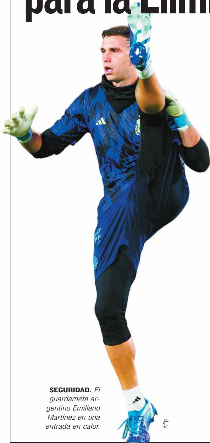
SEGURIDAD. El guardameta argentino Emiliano Martínez en una entrada en calor.