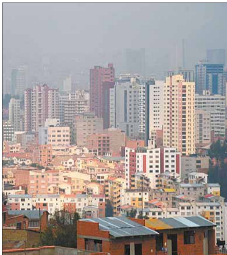
MEDICIÓN. La Alcaldía hace un monitoreo de la calidad del aire.

De momento no se registran incendios forestales activos en el departamento paceño, no obstante, desde el Servicio Nacional de Meteorología e Hidrología (Senamhi) se confirmó ayer el reporte de focos de calor concentrados en regiones del norte.