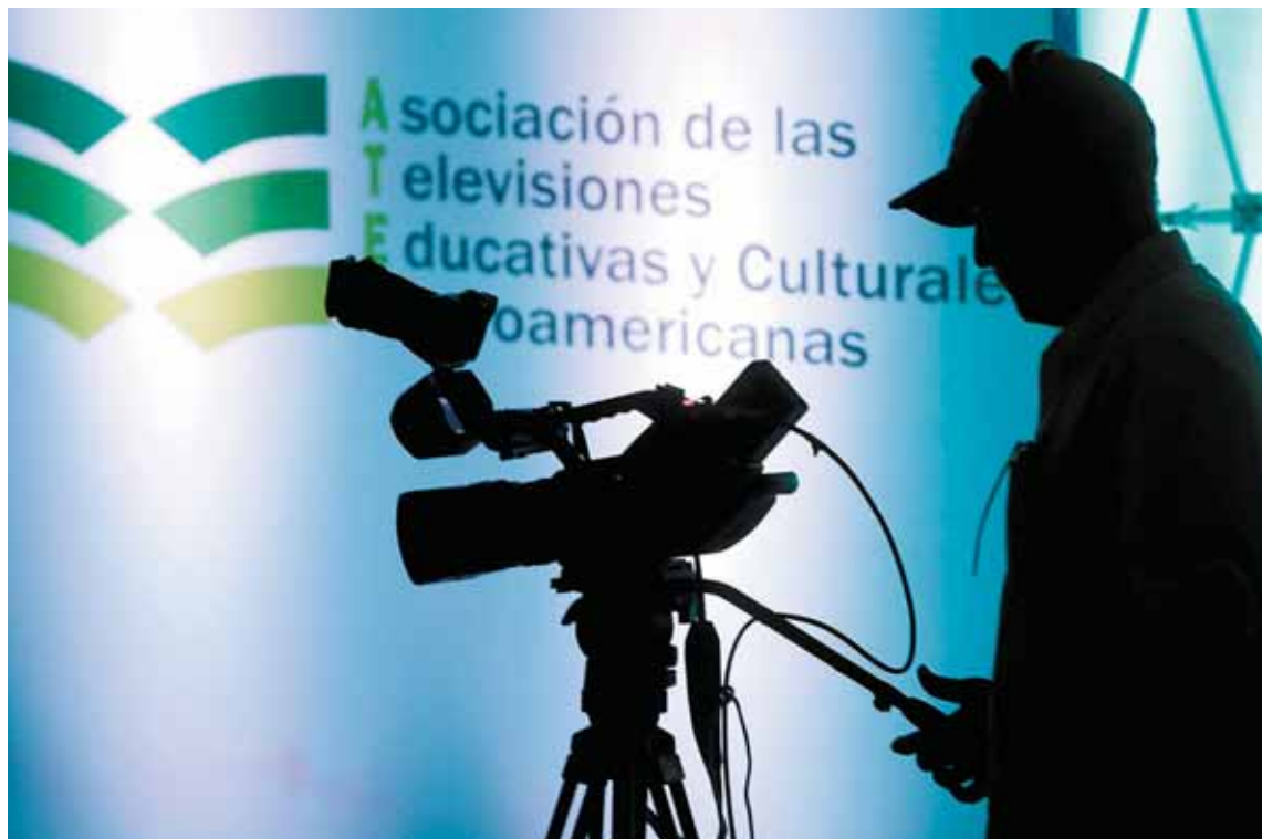
Un camarógrafo en el encuentro de televisiones educativas y culturales de Iberoamérica en Puerto Vallarta, Jalisco, México, el 8 de agosto de 2024.

Para Carlos Eduardo Gutiérrez Medrano, jefe de cinematografía del sistema UDG, el impacto final de la