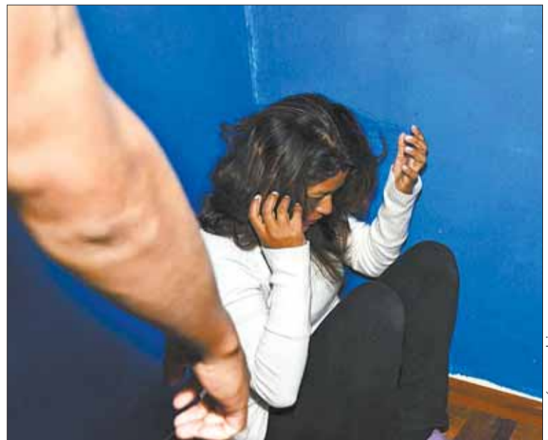
CASOS. La violencia familiar o doméstica es la más denunciada.