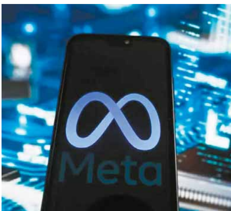
Meta intenta demostrar que la inteligencia artificial generativa no será una amenaza para las elecciones.

La IA fue utilizada para crear imágenes con detalles sorprendentes, videos y para traducir o generar texto con noticias falsas, reconoce el informe.