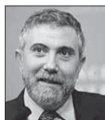
Paul Krugman es premio Nobel de Economía y columnista de The New York Times.

El viernes, la vicepresidenta Kamala Harris pronunció su primer gran discurso sobre política económica como candidata presidencial demócrata. Por supuesto, fue muy diferente de los discursos y conferencias sobre temas "económicos" que ha ofrecido Donald Trump.