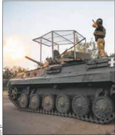
La guerra en Ucrania no para.

MUNDO. Desde Moscú se dice que la defensa de su territorio va por otro lado