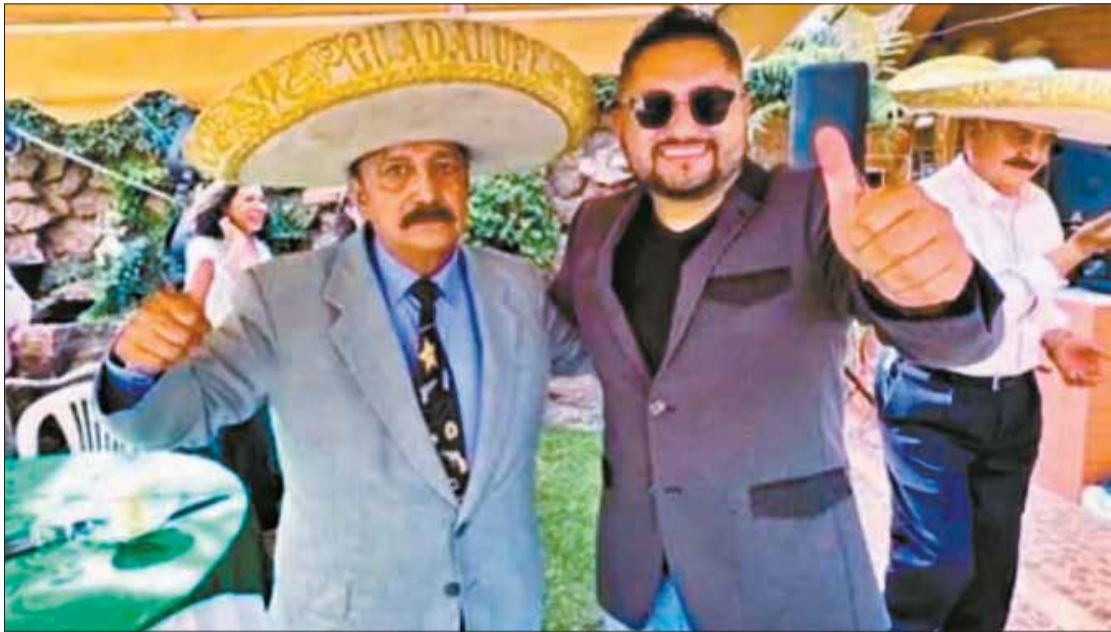
CAPTURA BOLIVIA TV