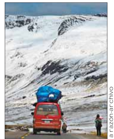
Pueden darse nevadas.