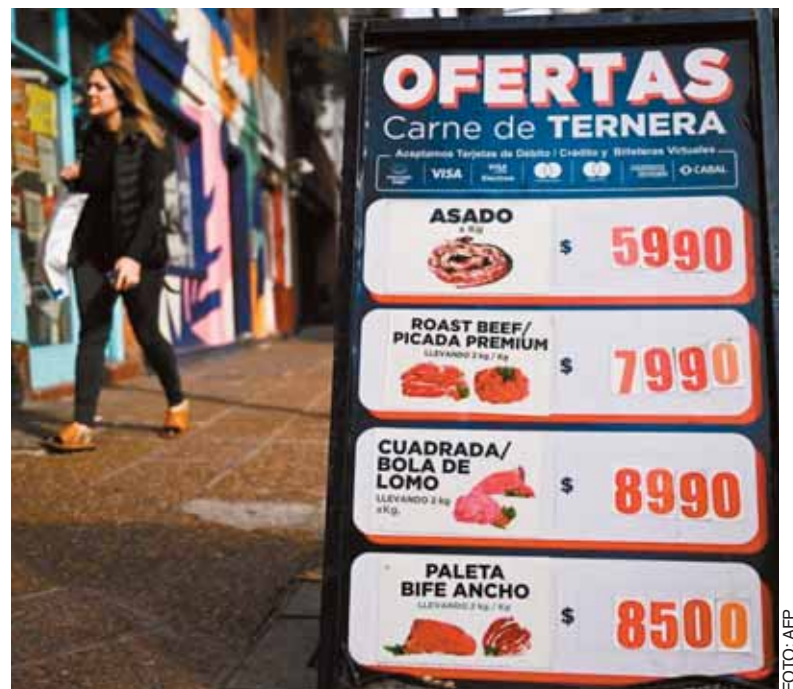
Una tablón con los precios de varios cortes de carne en una calle de Buenos Aires, el 13 de junio de 2024.

En contrapartida ha aumentado el volumen exportado, aunque el impacto en ingresos no fue tan lucrativo por la caída de los precios internacionales.