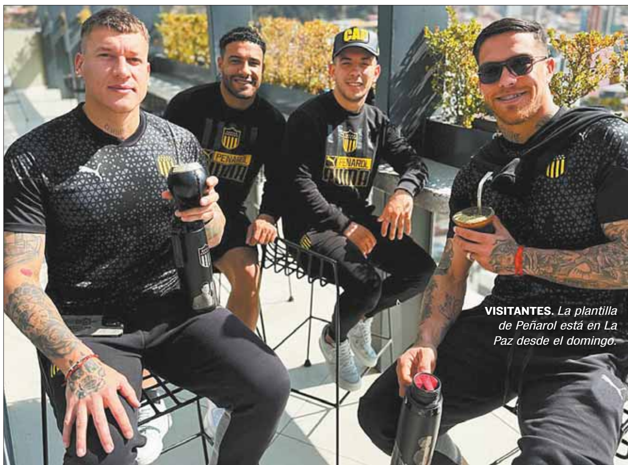
VISITANTES. La plantilla de Peñarol está en La Paz desde el domingo.

W Peñarol, Flamengo, River, Nacional y Fluminense definirán su futuro