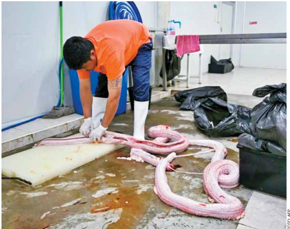
Un empleado limpia la carne de una serpiente pitón después de quitarle la piel en la granja Closed Cycle Breeding International, que provee al mercado de la moda, ubicada en Nam Phi, en el norte de Tailandia, el 15 de julio de 2024.

Aunque él mismo no duda en comerse sus serpientes, admite que debe