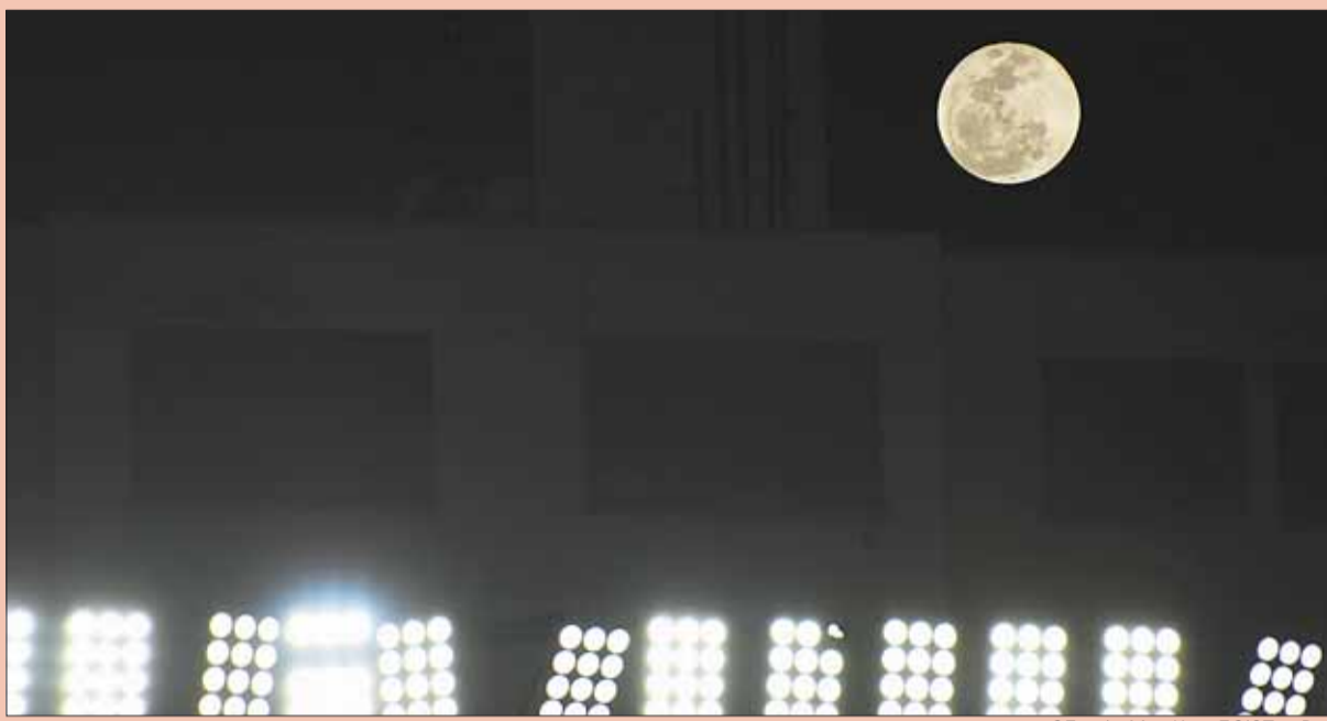
aGEncia MarKa rEGiSTraDa

El cielo tuvo anoche un brillo especial. Se presentó la llamada "Superluna", un fenómeno astronómico que asombró al país. Fue anunciado por el Observatorio Astronómico Nacional Tarija-Bolivia, que indicó que en este tipo de eventos el diámetro de la Luna puede aumentar hasta en 14% y su brillo en al menos 30%.