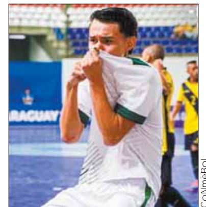
El grito de gol boliviano en Luque.

El seleccionado albiceleste es líder del certamen eliminatorio con 15 puntos, muy por encima del resto de los seleccionados rivales.