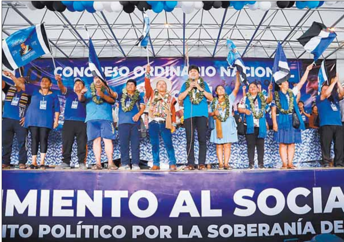
FALLIDO. El congreso del MAS de Lauca Ñ, en octubre de 2023, declaró a Evo Morales 'único candidato'

El 14 de agosto, luego de idas y vueltas, la Cámara de Senadores sancionó la ley, a instancias del TSE, que recogió la propuesta multipartidaria e interinstitucional en el encuentro que propició el 10 de julio con representantes de los 11 partidos nacionales, las tres fuerzas políticas con representación parlamentaria y los ór-