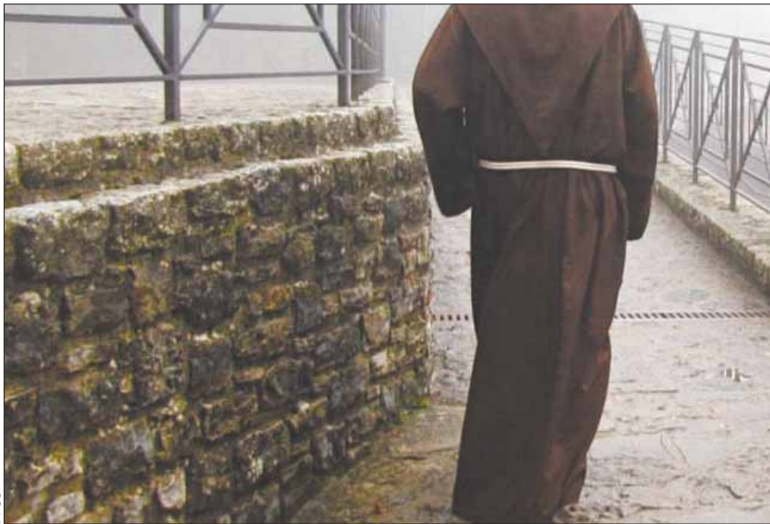
ACUSADO. El fraile franciscano es imputado por el delito de abuso sexual. El hecho ocurrió en 1997.