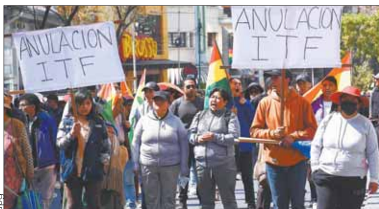
MEDIDAS. La movilización de los gremiales, ayer en La Paz.

ECONOMÍA. Protestaron en La Paz y otras regiones por la falta de dólares