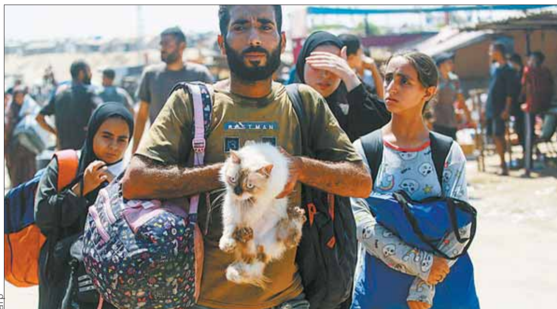
DRAMA. La población escapa de un lugar a otro para salvar sus vidas, ya van 40.139 muertos.

El mandatario ucraniano dice querer elaborar un plan para noviembre, fecha de las elecciones presidenciales en Estados Unidos -aliado vital de Kiev-, que sirva de base para una futura cumbre por la paz a la que el Kremlin debe ser invitado. Aunque la ofensiva en Kursk acaparó las miradas, el epicentro sigue siendo Ucrania.