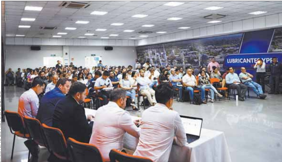
CONVENIO. La reunión entre autoridades de Gobierno con empresarios y productores, en Santa Cruz.