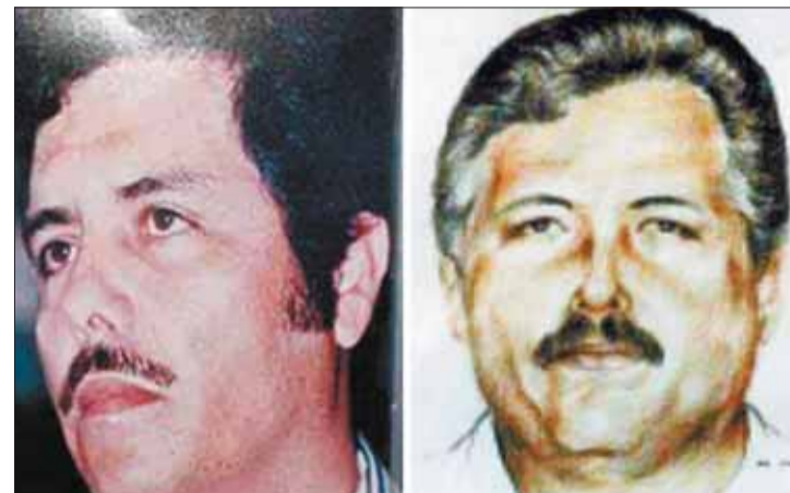
OPERATIVOS. La detención del 'Mayo' genera violencia.