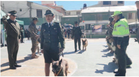
Pasillo de honor para los tres canes jubilados