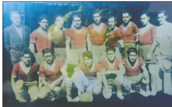
El equipo de 1939 campeones en el torneo oficial de la AFO