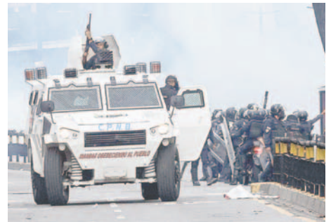
Imagen de archivo de integrantes de la Policía Nacional Bolivariana (PNB) que enfrentan a manifestantes durante una protesta contra de los resultados de las elecciones presidenciales, en Caracas (Venezuela)

Según datos oficiales, se estima que al menos 300 periodistas han sido agredidos durante las protestas postelectorales en Venezuela. Además, organizaciones internacionales como Reporteros Sin Fronteras han alertado sobre el deterioro de la libertad de prensa en el país caribeño.