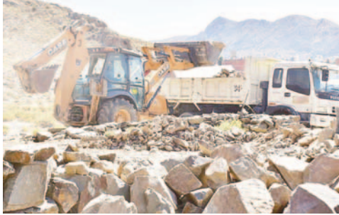
Retiro de material de construcción de La Víbora

tiro del material de construcción y la preservación del área protegida se realizó en cumplimiento del Decreto Municipal 283/23 y las leyes municipales 022/2015 y 004/12.