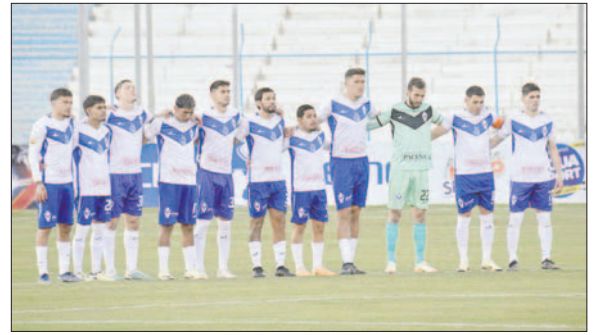
Jugadores de GV San José con el objetivo de recuperar posiciones