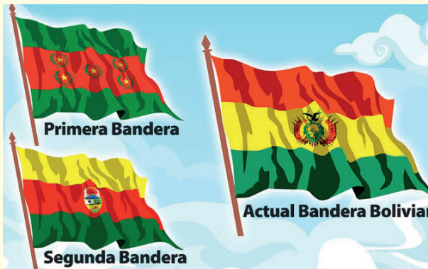
Las tres banderas de Bolivia