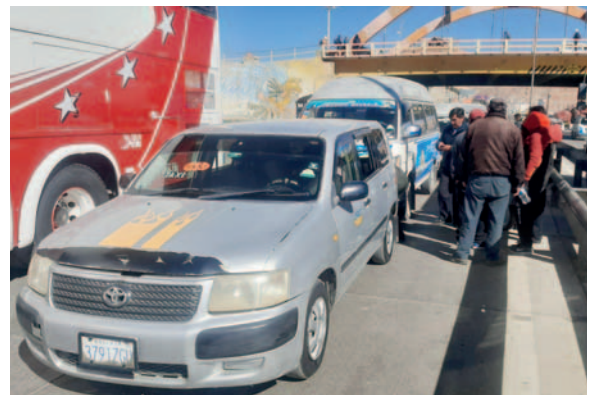
La colisión múltiple se registró en inmediaciones del Distribuidor Tagarete

Hasta el momento, el caso está en investigación y aún no se determinan las causas objetivas de este hecho de tránsito para el conocimiento respectivo del Ministerio Público. Sin embargo, se sabe que no se reportaron heridos y solo daños materiales.