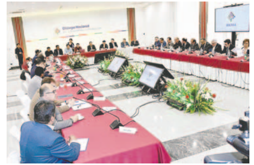
Reunión entre el Gobierno y empresarios privados