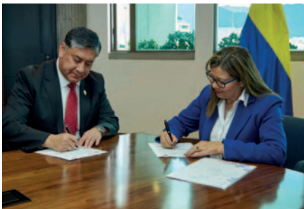
El Fiscal Juan Lanchipa firma convenio con la Fiscal General de la República de Colombia, Luz Adriana Camargo

Asimismo, viabilizará el intercambio sobre temas relacionados con criminalidad organizada transnacional. La suscripción del documento se dio luego del encuentro que tuvieron ambas autoridades en Bogotá.