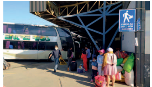
La Policía de Cochabamba arresta a individuo acusado de dopar y robar a pasajeros en viajes interdepartamentales /REFERENCIAL

Las víctimas reconocieron al acusado, lo que ha facilitado su imputación; el caso sigue en desarrollo donde se determinarán las medidas cautelares que se le impondrán.