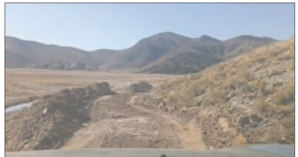
En estos días pusieron en condiciones el circuito en Chusaqueri

Paralelamente, se continúa con las inscripciones según lo indica