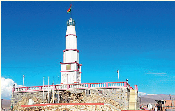
La bandera se izó por primera vez en el Faro de Conchupata

alude a la riqueza del subsuelo de la patria y el verde simboliza la vegetación que contribuye a la gran producción agraria boliviana.