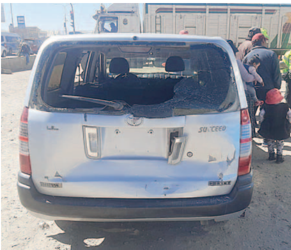
Se reportó daños materiales en los motorizados