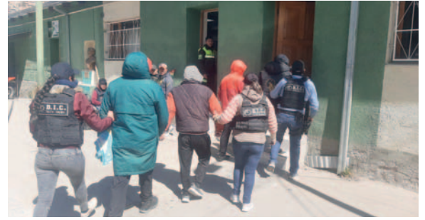
Labor coordinada entre inteligencia de la Felcv y la Fiscalía permitió la captura de cuatro sujetos implicados en el crimen

De acuerdo con las pesquisas, la víctima falleció en la vivienda después de consumir en exceso bebidas alcohólicas y ser agredida sexualmente