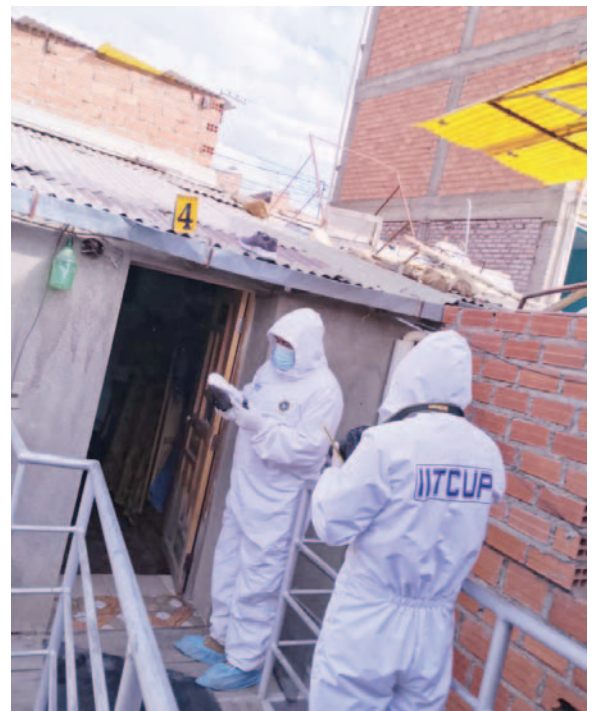
Peritos del Itcup procesan la escena del crimen en una vivienda en Huanuni

"Ese es el trabajo que se ha realizado y que lógicamente se hace el procesamiento de estos indicios para que los mismos sean trabajados laboratorio y determine procedencia misma para poder esclarecer cualquier hecho criminal este caso feminicidio", indicó.