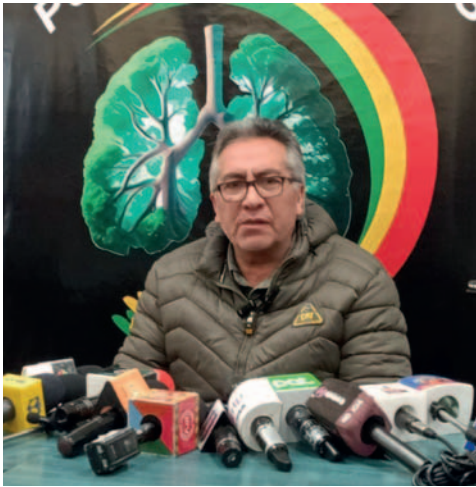
El viceministro de Coordinación y Gestión Gubernamental, Gustavo Torrico

afirmó que el mismo día que se lleven a cabo las elecciones judiciales se realizará un referéndum con tres preguntas sobre la subvención de hidrocarburos, mantener los escaños parlamentarios y la reelección continua o discontinua.