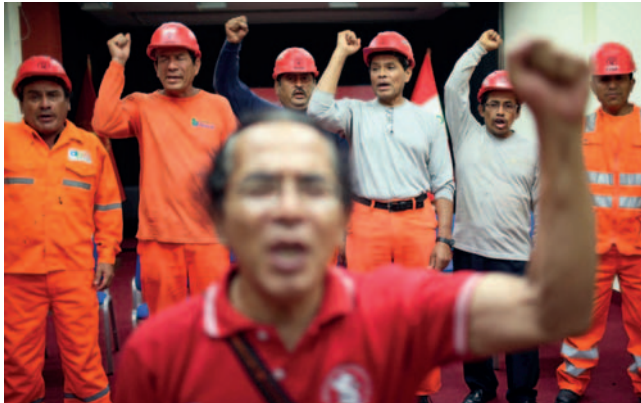
Miembros de la Federación de Trabajadores de Construcción Civil protestan en La Victoria, Lima