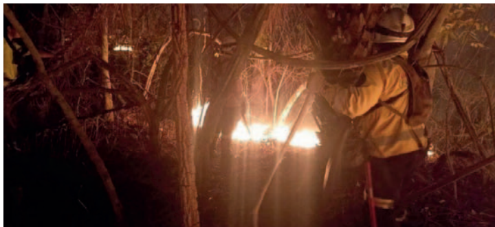
Varios bomberos combaten el fuego en la Chiquitania

El bombero herido tiene 30 años y sufrió quemaduras en el 40% de su cuerpo mientras apoyaba en las labores en la comunidad San Silvestre.