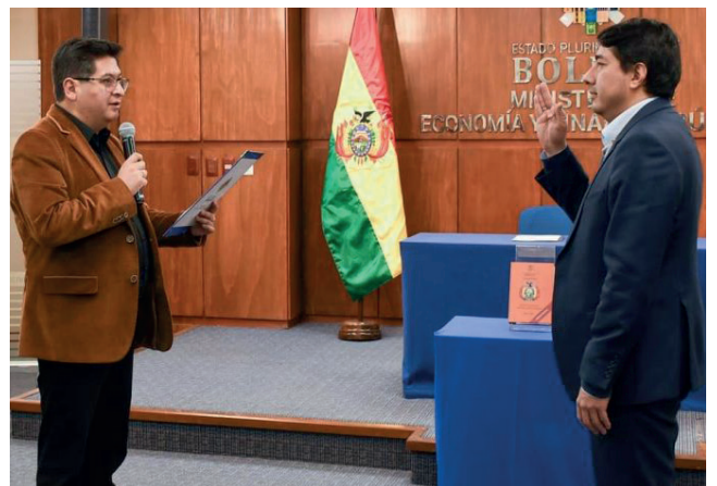
La designación fue realizada por el ministro de Economía y Finanzas Públicas, Marcelo Montenegro

supervisión del Ministerio de Economía, se encarga de la recepción, verificación, custodia, control, almacenamiento y certificación de todo tipo de mercancías y/o bienes en tránsito hacia Bolivia. Además, ofrece servicios como estiba y desestiba de carga, acopio y planificación del despacho de carga.