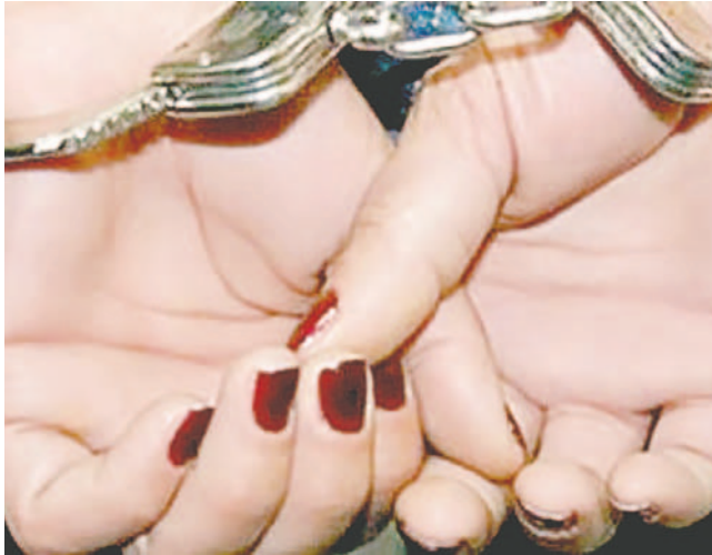
La mujer era buscada por el delito de trata y tráfico de personas /REFERENCIAL

pública de Argentina, es decir que el delito fue cometido en el país vecino y por eso la emisión de la notificación roja que ahora saltó mientras la mujer pretendía realizar la renovación de su cédula de identidad”, explicó Claire.