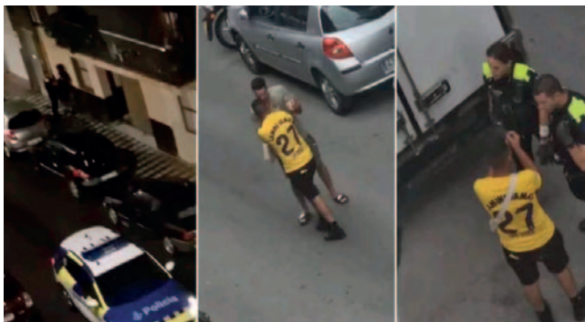
Imágenes de los instantes previos y la detención de los agresores del padre de Lamine Yamal

presunta participación en el apuñalamiento, incluido el supuesto autor material, para quien se ha decretado prisión, fueron llevados ayer desde las dependencias policiales hasta el juzgado.