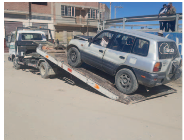
Tránsito remolca uno de los vehículos