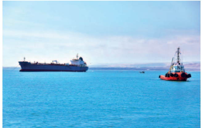
YPFB descarga 103.000 barriles de diésel en Terminal Arica / YPFB

terminal terrestre Sica Sica a través del ducto submarino con una extensión total de 1,5 kilómetros de tubería y otros cuatro adicionales en el área urbana de Arica, llegando finalmente a la terminal terrestre de YPFB Transporte S.A.