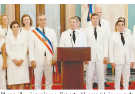
El canciller dominicano, Roberto Álvarez (c), lee una declaración firmada por veintidós países y la UE junto al presidente de República Dominicana, Luis Abinader (c-i), y los mandatarios invitados a la investidura de Abinader este viernes, en el Teatro Nacional en Santo Domingo (República Dominicana)

LA PATRIA / EFE Veintidós países y la Unión Europea (UE) solicitaron de manera conjunta la publicación inmediata de todas las actas originales de las elecciones del 28 de julio en Venezuela, así como una verificación imparcial e independiente de los resultados electorales. La declaración fue suscrita en Santo Domingo este viernes 16 de agosto por representantes de Argentina, Canadá, Chile, República Checa, Costa Rica, Ecuador, España, Estados Unidos, entre otros países y la UE. En el texto leído por el ministro dominicano de Exteriores se destaca: "En este momento crucial para Venezuela y la región, todos los actores sociales y políticos deben ejercer la máxima medida en sus actuaciones públicas". Asimismo, se hace un llamado urgente para poner fin a la violencia y liberar a los detenidos, incluidos representantes de la oposición. La solicitud se basa en el respeto a los principios democráticos y derechos