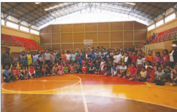
Curso importante para quienes dirigen en divisiones menores del baloncesto / LA PATRIA

Los interesados deben ser como mínimo bachilleres y tener cumplidos los 18 años. La certificación de este curso les permitirá desempeñarse como entrenadores en los encuentros de la AMBO. Los menores de edad podrán participar en calidad de oyentes.