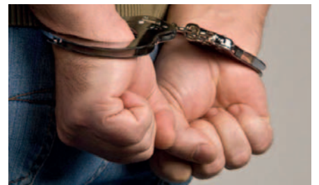
El caso sigue en investigación para determinar la verdad de los hechos /REFERENCIAL