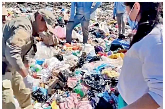
El cadáver de la infante fue hallado en una bolsa de basura en la comunidad de Abapó

“Como Ministerio Público, desde el primer momento en que se conoció el hecho, se realizaron las investigaciones de oficio por el delito de infanticidio. En ese marco, se colectaron diferentes elementos, como la declaración de testigos, la autopsia que determinó asfixia por sofocación como causa de la muerte, y el análisis de imágenes de cámaras de seguridad, entre otros elementos que fueron valorados por la autoridad jurisdiccional que ordenó la detención preventiva”, dijo Mariaca.