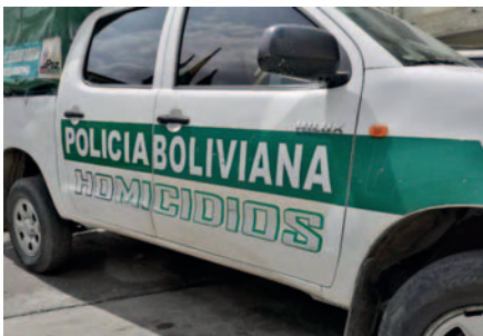
Disponen la detención preventiva para un joven acusado por doble crimen en La Paz /REFERENCIAL