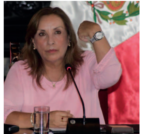
La presidente de Perú, Dina Boluarte, muestra su Rolex en una rueda de prensa en Lima