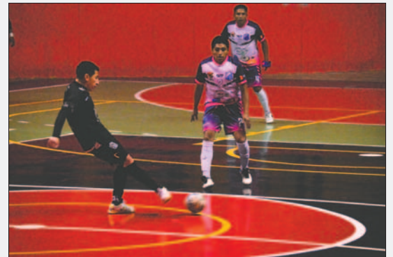
Morales Moralitos necesita recuperarse para salir del mal momento