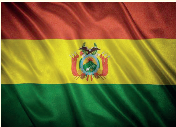
Este 17 de agosto se celebra el Día de la Bandera