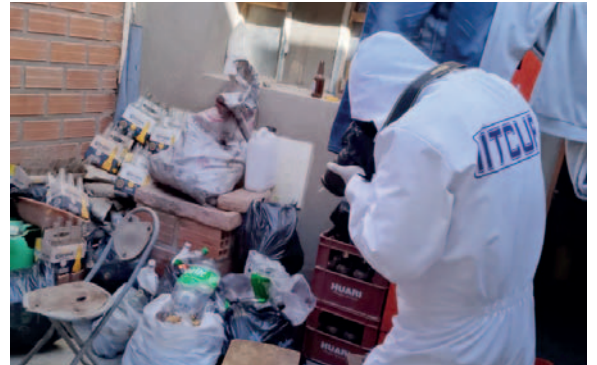
Buscan esclarecer las circunstancias del crimen