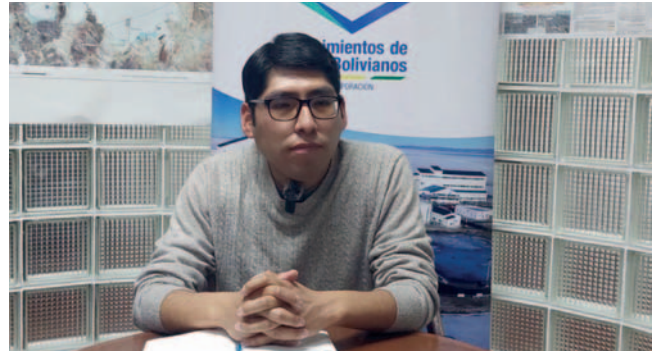
La autoridad puntualizó que las operaciones continúan de manera normal por el momento

“Por ahora estamos trabajando de manera normal, pero en la época en la que vamos a requerir más flujo de salmuera, tenemos que utilizar estos pozos”, dijo Chambi, según