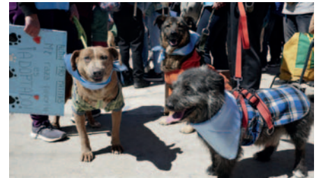
En el Día de San Roque, canes rescatados fueron agasajados