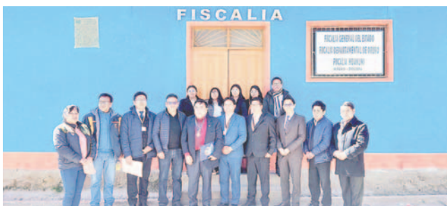
Refaccionan instalaciones de la Fiscalía de Huanuni

En esta ocasión, el Concejo Municipal otorgó el título de Huésped Ilustre al Fiscal Departamental por su esfuerzo y trabajo en favor de la población. Asimismo,