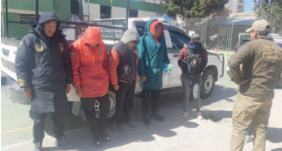
Los cuatro implicados fueron enviados a la cárcel de San Pedro