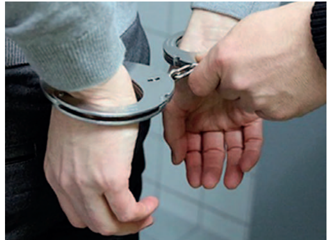
El implicado fue recluso en el penal de Padilla por 120 días /REFERENCIAL

A su vez, el Juzgado Público Mixto y Comercial, de la Familia y Adolescencia e Instrucción Penal de Villa Serrano, determinó que sea recluso en el penal de Padilla, donde debe cumplir detención preventiva por 120 días.