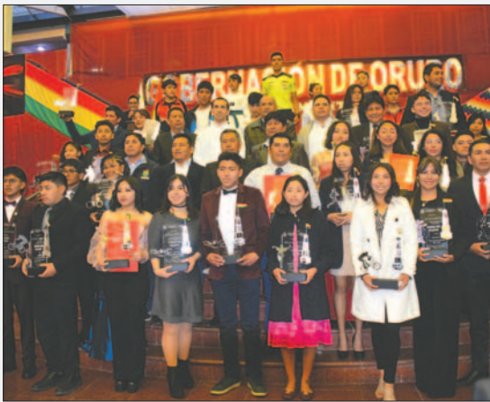
Los mejores deportistas del 2023 serán galardonados

Consultado sobre las asociaciones que no cumplieron con la entrega de las nominaciones de sus mejores deportistas y que no se ajustaron a la Ley del Deporte, Sotéz indicó que lamentablemente no serán tomadas en cuenta. Además, instó a los dirigentes de estas entidades deportivas a adecuarse de una vez por todas a la normativa vigente y no perjudicar a sus deportistas, quienes merecen todo el reconocimiento por el sacrificio que realizan para participar en los diferentes eventos deportivos.