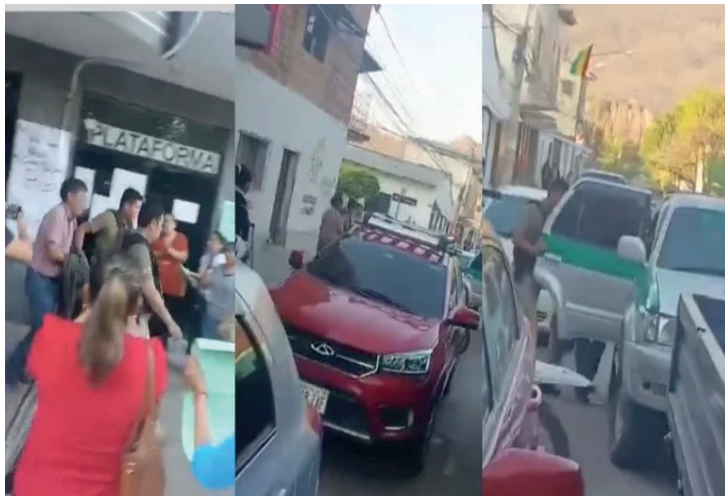
Rector de la Universidad Indígena enviado a prisión por abuso sexual