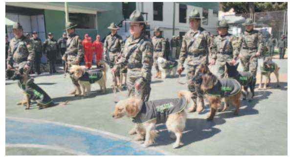
La Policía agasajó a los canes por el Día de San Roque