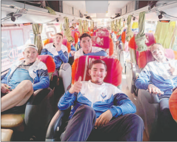
La delegación viajó ayer a la Villa Imperial con el ánimo elevado