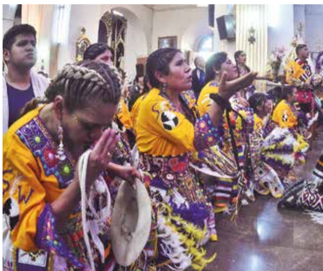
Los devotos llegan de rodillas ante la mamita. JOSE ROCHA