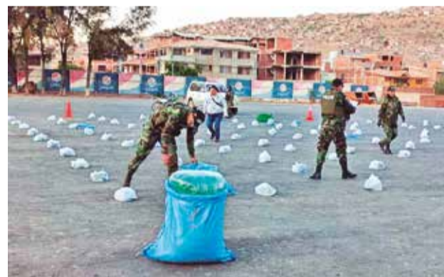
La marihuana secuestrada en Sacaba y Quillacollo. P.FIGUEROA

Además, el jefe policial indicó que el acusado cuenta con antecedentes y sería miembro de una pandilla denominada la “hermandad”.