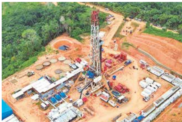
El pozo Mayaya Centro-X1 en el norte de La Paz.

Mayaya Centro - X2 (MYC-X2), Mayaya Centro-X3 (MYC-X3) y Suapi - XIIE (SAP-XIIE). Este apoyo fue manifestado durante la consulta pública organizada por Yacimientos Petrolíferos Fiscales Bolivianos (YPFB) el pasado 7 de agosto en la comunidad de Suapi, km 73, en el municipio de Alto Beni, provincia Carana-