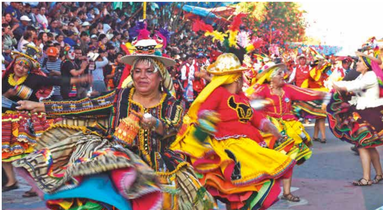
Urkupiña muestra danzas tradicionales como los wakatoqoris y los caporales. DANIEL JAMES