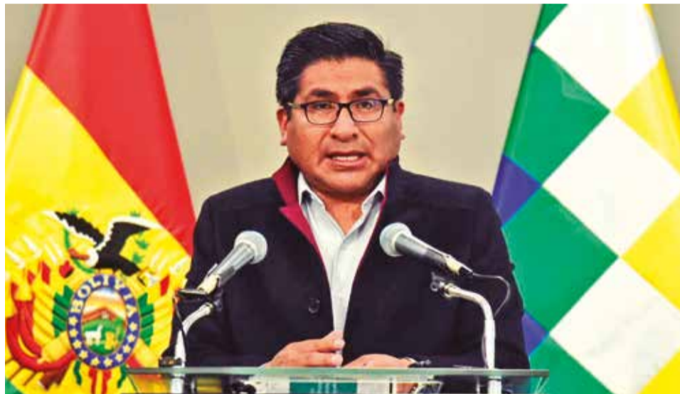
El ministro de Desarrollo Productivo, Néstor Huanca, en rueda de prensa, ayer.

“Estos precios en Bolivia nunca han sido tan altos, posiblemente exista una especie de especulación”, señaló Huanca, subrayando la discrepancia entre los precios locales y los