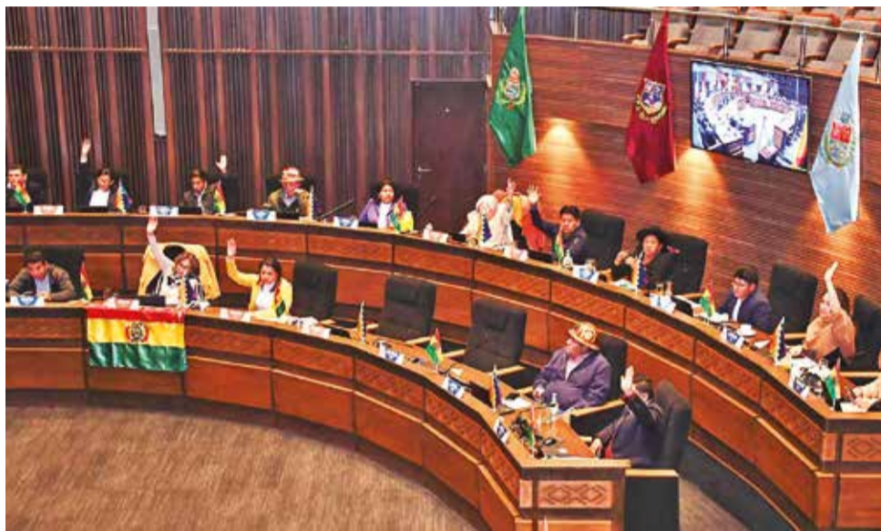
Legisladores de la Cámara de Senadores, ayer en sesión.

Según Alarcón, “el temor es que Evo Morales candidatee porque saben que va a ganar las elecciones, y entran en el juego del Ejecutivo para sacar de la jugada a un líder que nos gobernó por 14 años”.