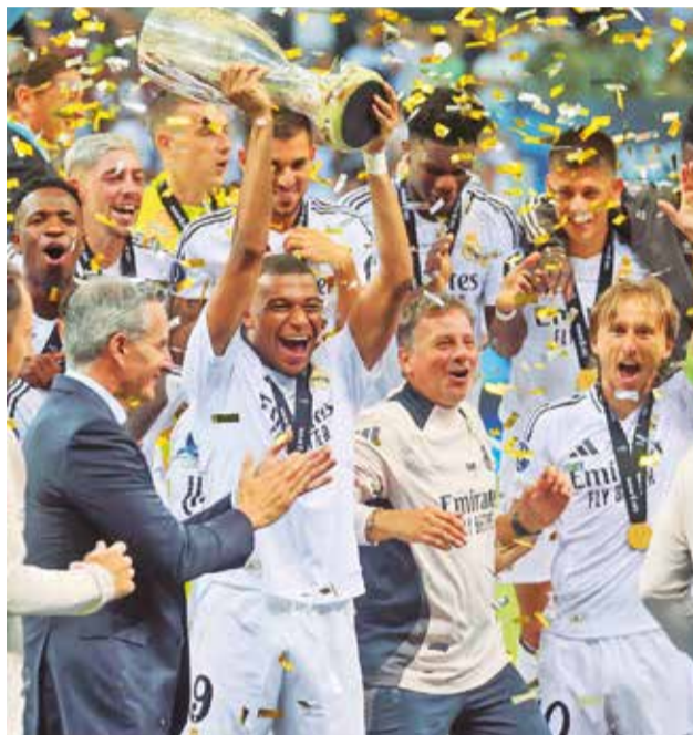
Real Madrid festeja el sexto título de la Supercopa Europea, ayer.

se arriba y cuando lo hizo pasaron cosas positivas. La más importante de ellas el 1-0, servido por él tras una excelente acción individual en el lado izquierdo y rematado a placer bajo el larguero por el uruguayo Fede Valverde.