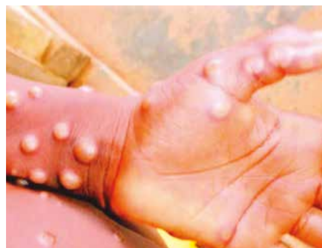
Una persona afectada con la viruela del mono.

El organismo de la ONU ya había tomado una decisión similar en 2022, cuando se produjo un brote mundial de viruela símica causado por una cepa conocida como clado Ib. Pero la epidemia actual, originada en República Democrática del Congo (RDC) y