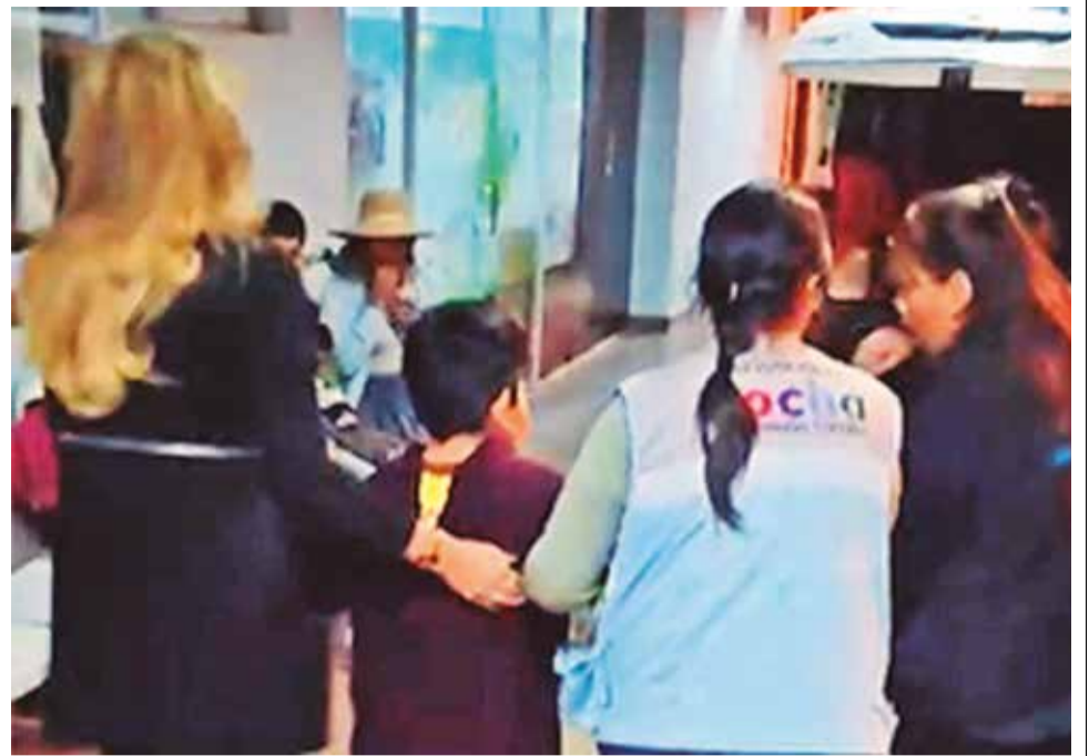
El niño de 10 años luego de ser rescatado.

Por otra parte, Herrera indicó que la mujer es madre de tres menores: una niña de 7 años que actualmente se encuentra en un centro de acogida, el niño de 10 años y un adolescente de 17, quien era el encargado de cuidar a su hermano menor. Sin embargo, hace aproximadamente seis meses, decidió irse a vivir con un familiar, supuestamente porque era víctima de maltrato por parte de su madre.