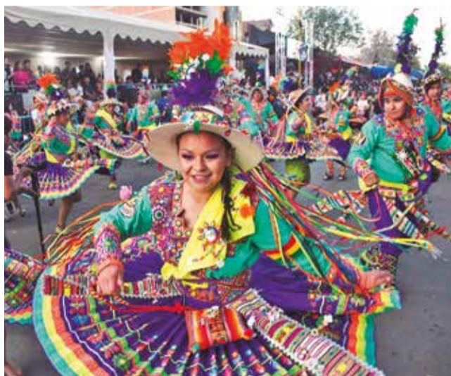
Danzarines de tinku con gran colorido. DANIEL JAMES