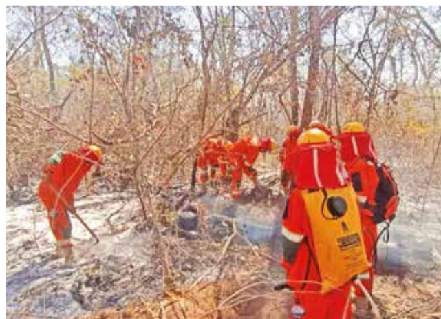
Incendio en un municipio de Santa Cruz.

De acuerdo con el reporte oficial cruceño, existen 27 incendios forestales activos en 10 municipios. “San Ignacio de Velasco, aunque aún no ha sido declarado en desastre, es una de nuestras principales