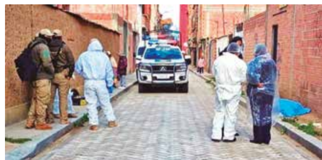
El trabajo de la Policía luego del doble asesinato. RED UNO

Crimen. Una tercera persona que también estaba en el lugar se debate entre la vida y la muerte porque recibió 30 puñaladas