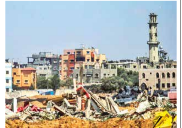
La destrucción causada por bombardeos israelíes en Gaza.