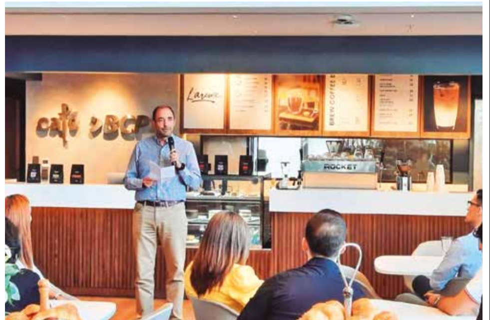
Apertura del café BCP.

“Ese respaldo nos ha permitido ser reconocidos en Bolivia como el banco más innovador del sistema y esperamos seguir aportando por mucho tiempo más con las mejores prácticas de esta industria, con énfasis en la inclusión y la educación financiera, y la gestión responsable y sostenible de nuestros negocios”, concluyó.