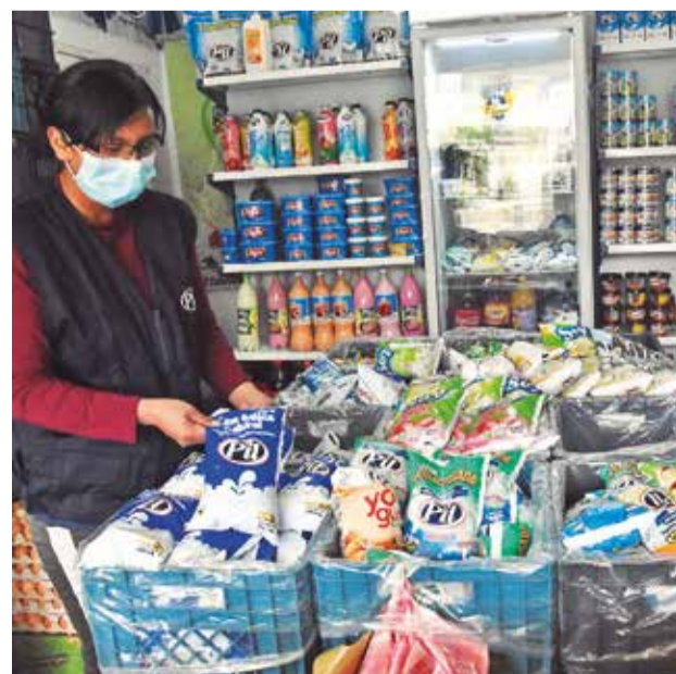
Productos lácteos expuestos en un mercado. DANIEL JAMES

El Gobierno indicó que los productos que han experimentado los mayores incrementos de precio son los importados y de contrabando.