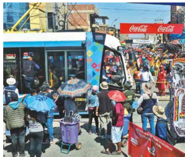
El tren hace una parada por el paso de los bailarines. J.ROCHA