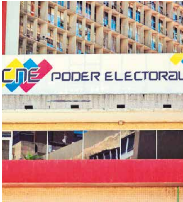
Sede del Consejo Nacional Electoral (CNE), en Caracas, Venezuela.

Los expertos se sorprendieron tanto como los venezolanos cuando Elvis Amoroso, presidente del Consejo Nacio-