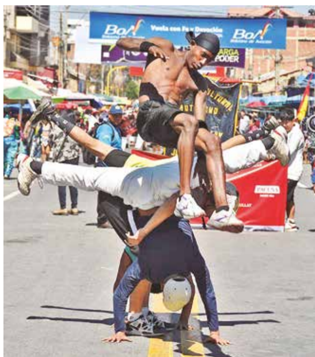
Artistas callejeros hacen piruetas en los baches.