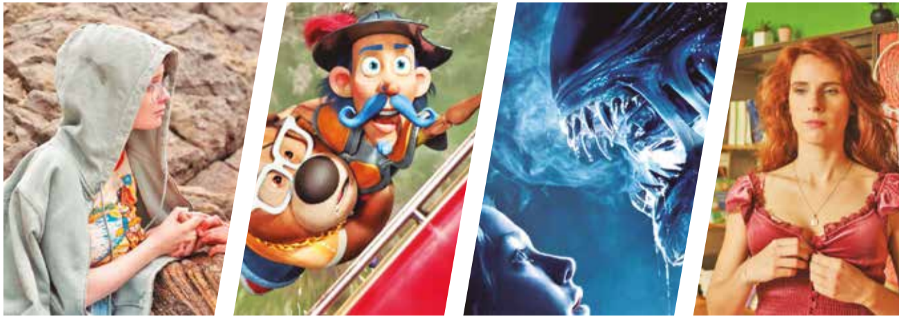
Fotogramas de las películas que se suman a la cartelera.