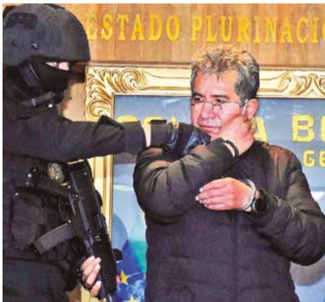
El exjefe antidrogas de Bolivia Maximiliano Dávila.

Actualmente, Dávila está detenido preventivamente en el penal de San Pedro de La Paz por el delito de legitimación de ganancias ilícitas.