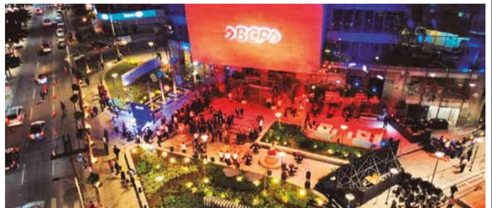
Inauguración de la agencia del BCP en Santa Cruz.