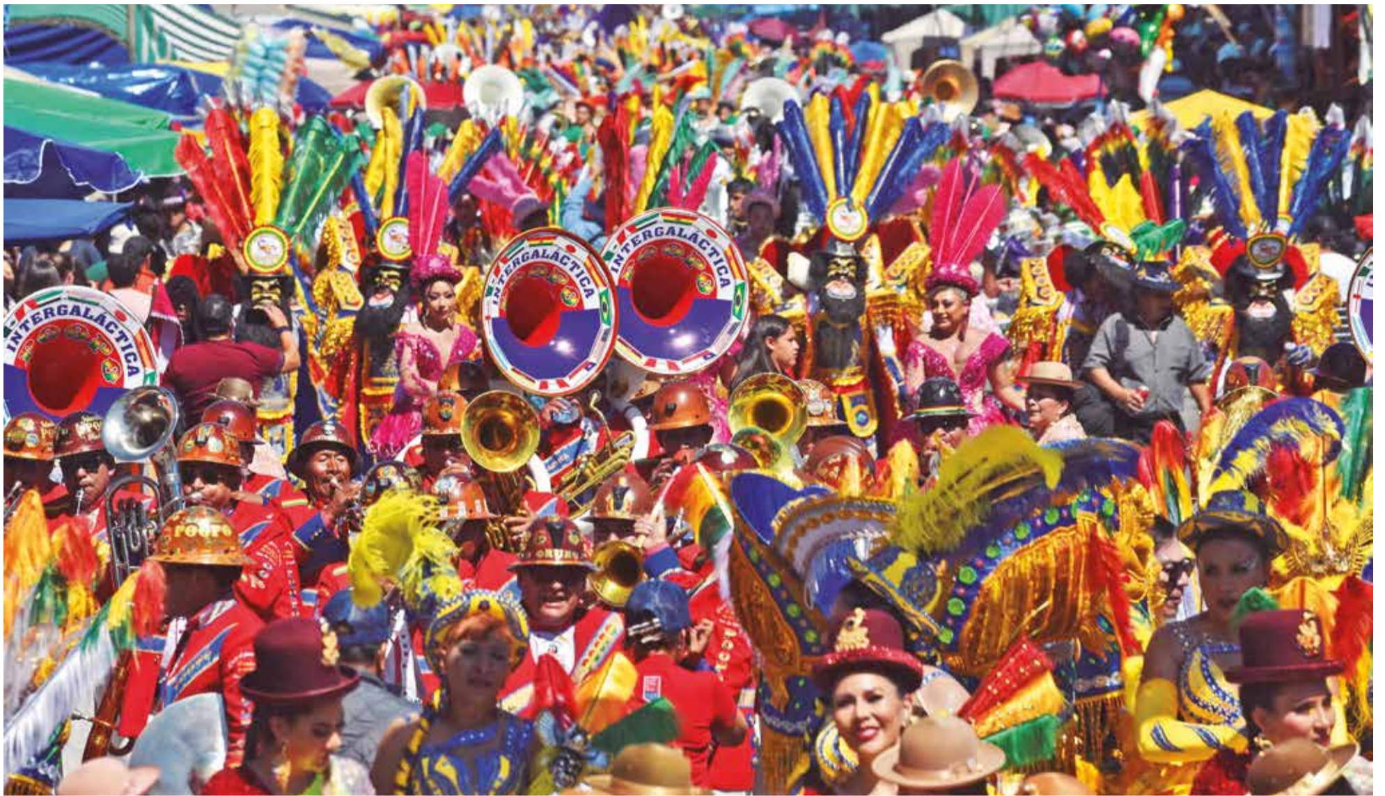
El colorido, música y el espectáculo que brindó la banda Poopó en la Entrada de Urkupiña. JOSE ROCHA