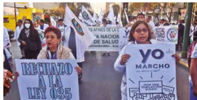
Marcha que se opone a la ley de pensiones. JOSE ROCHA

Protesta. Estudiantes de Derecho y Salud amenazan con asumir medidas de presión en caso de que Diputados no los escuche.