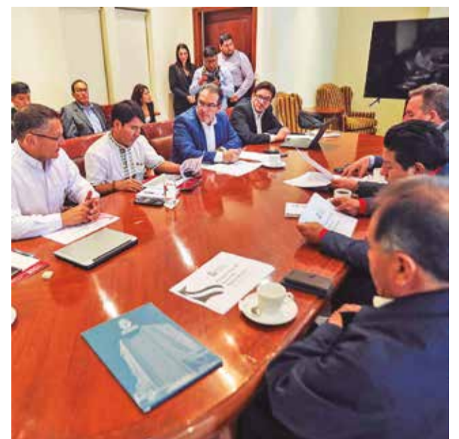
El Ministro de Economía con los gobernadores, ayer. APG

La reunión en Santa Cruz, que congregó a los ministros, viceministros y gobernadores, fue un espacio para abordar diversas temáticas que afectan a las regiones, entre ellas, la reprogramación de deudas, los resultados del próximo Censo de Población y Vivienda, y los mecanismos para mejorar los ingresos regionales. Sobre este último punto, Montenegro señaló que se discutió la necesidad de implementar un control más efectivo del pago de regalías, como parte de un esfuerzo conjunto para incrementar los recursos que reciben las gobernaciones.