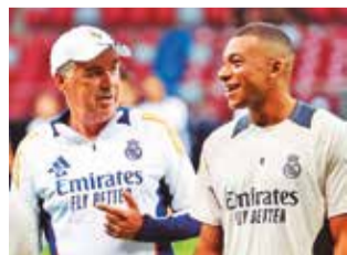
Carlo Ancelotti (izq.) y Kylian Mbappé.

Real Madrid y Atalanta de Italia se medirán hoy (15:00 HB) Estadio Nacional de Varsovia, en la Supercopa de Europa, un torneo que el conjunto blanco aspira a conquistar por sexta vez en su historia. En el choque será clave el desempeño de sus jugadores más destacados, entre ellos el francés Kylian Mbappé, que apunta