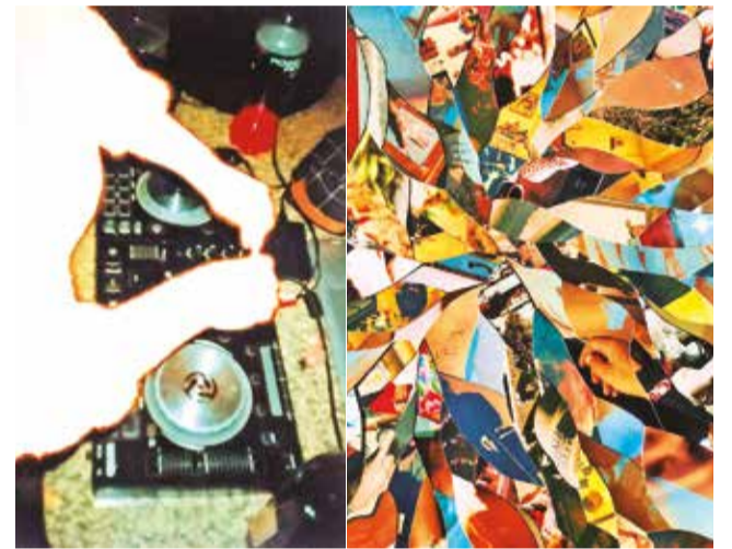
Algunas fotografías que se exponen en la Alianza Francesa.

Los horarios de visita son de lunes a miércoles, de 9:00 a