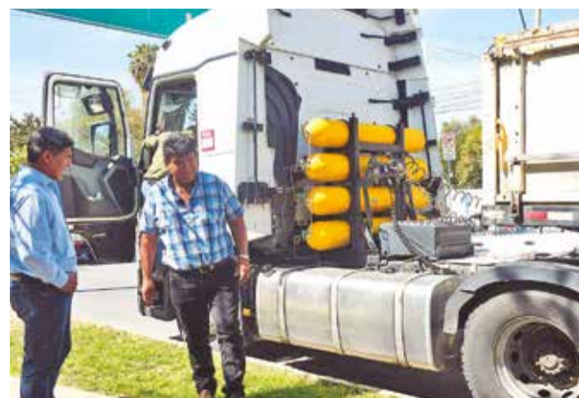
El camión que fue convertido a gas natural vehicular. C.L.

Dato. La conversión a GNV permite una sustitución del 70% del consumo de diésel bajo condiciones normales