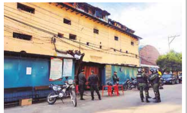
La cárcel San Sebastián varones.