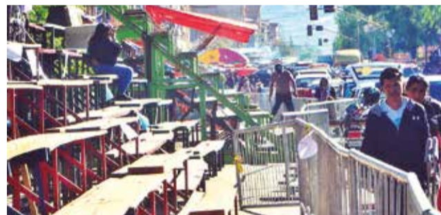
El armado de graderías para la festividad.

En medio de este contexto, este miércoles se llevará a