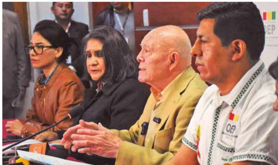
Los vocales del Tribunal Supremo Electoral en conferencia de prensa, ayer.

Junto con la convocatoria, el TSE aprobó el calendario electoral para el proceso y Hassenteufel anticipó que “dentro de ocho días se iniciará el empadronamiento masivo para que todos los ciudadanos que cumplan 18 años o hayan cumplido 18 años de edad puedan registrarse” y emitir su voto en diciembre.