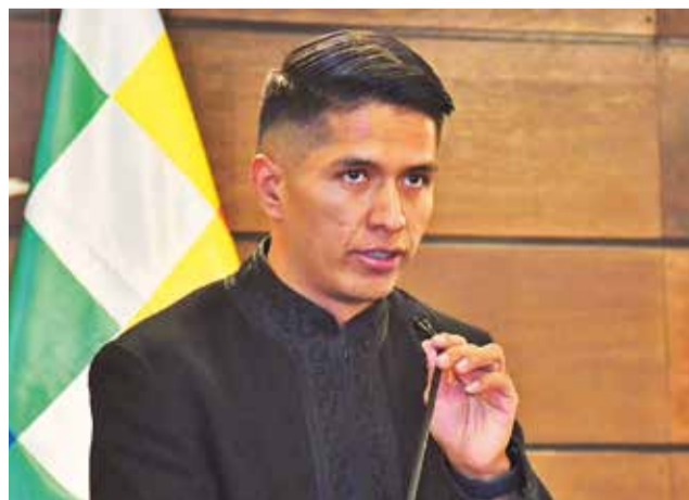
El presidente del Senado, Andrónico Rodríguez.

El proyecto de ley fue elaborado por el Tribunal Supremo Electoral (TSE) en cumplimiento de los acuerdos asumidos en el Encuentro Multipartidario Interinstitucional por la Democracia, realizado el 10 de julio, que determinó suspender las elecciones pri-