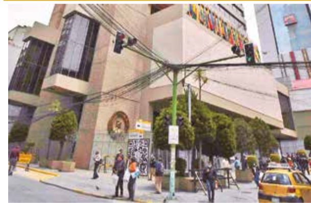
El edificio del Banco Central de Bolivia en La Paz.

Actualmente, este camión es el único en Bolivia que opera con este sistema de GNV. Los impulsores de este proyecto piloto están solicitando al Gobierno que facilite la instalación masiva de estos sistemas en más camiones, permitiendo así el uso combinado de GNV y diésel.