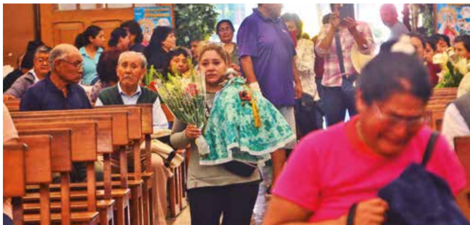
Los peregrinos llegan de rodillas ante la Virgen de Urkupiña.

“Son 10 años que vengo peregrinando a la casa de la madre. La conocí con sólo ocho años cuando una boliviana la llevó a mi pueblo y empezó a difundir la devoción, fue un enamoramiento a primera vista que he