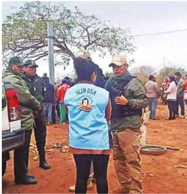
La Policía, durante el trabajo de investigación.