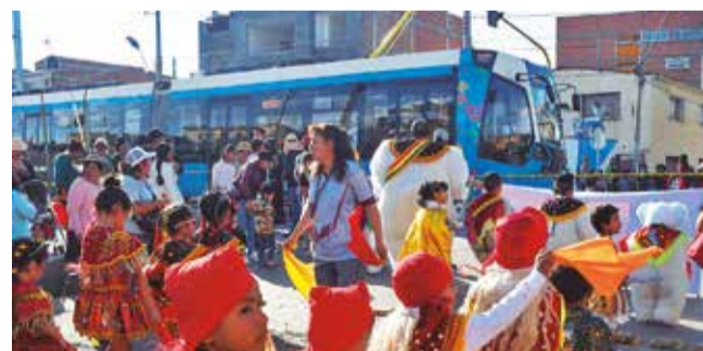
El tren metropolitano con la imagen de la Virgen.

Visita. La imagen de la Virgen de Urkupiña llegó ayer a la Alcaldía de Cochabamba y fue recibida por decenas de peregrinos