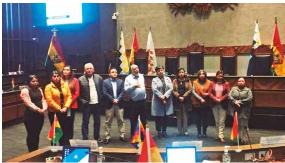
Senadores de Comunidad Ciudadana protestan ayer en la Cámara Alta.