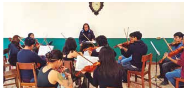
Músicos participantes durante un ensayo.