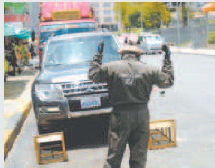
La inspección técnica vehicular garantiza la seguridad ciudadana.

La ITV 2024 se distingue por la especialización del