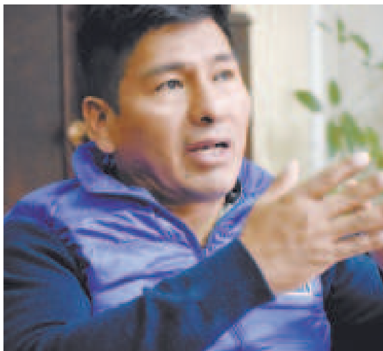
El presidente del MAS-IPSP, Grover García.