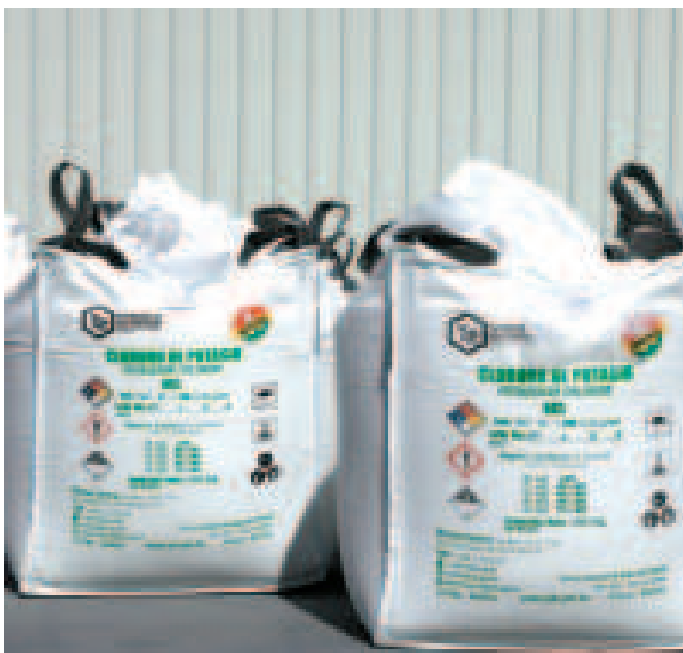
Los sacos de producción de YLB.