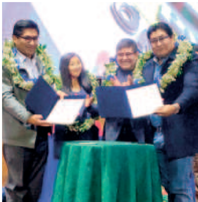
Autoridades muestran el convenio suscrito.

MIL MILLONES DE BOLIVIANOS están garantizados para la implementación de 170 plantas industriales.