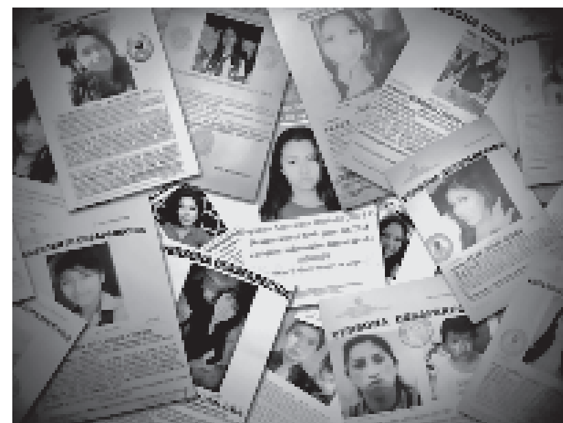
Carteles de mujeres y menores de edad desaparecidos.

ia, Iván Lima, destacó la importancia de ostenta en este foro multilateral.