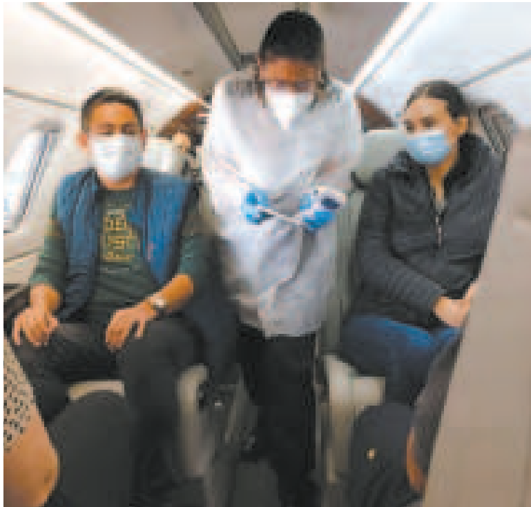
El Servicio Departamental de Salud (Sedes) La Paz intensifica la vigilancia.