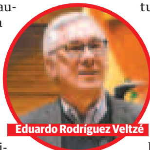
Eduardo Rodríguez Veltzé

Luego de ese polémico fallo, en diciembre de 2023 el Tribunal Constitucional Plurinacional, sobre la base de una opinión de la Corte Interamericana de Derechos Humanos (IDH) y la Constitución Política del Estado, anuló la reelección indefinida en el país.