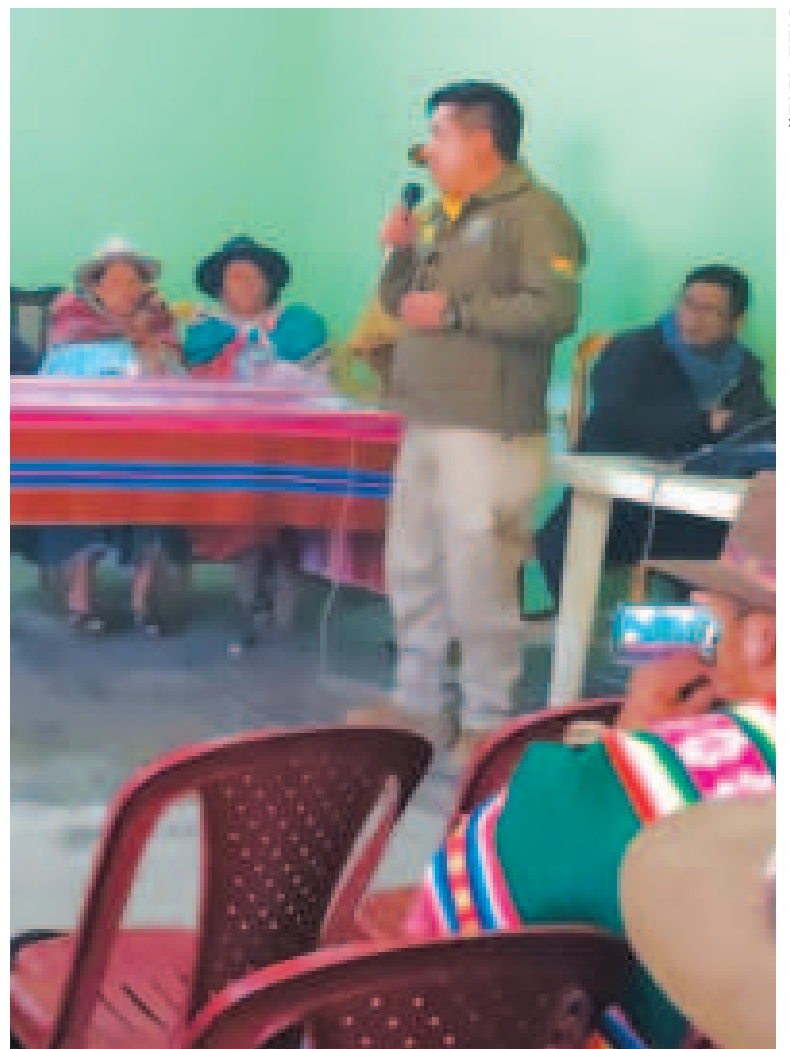
Un efectivo policial durante el taller.