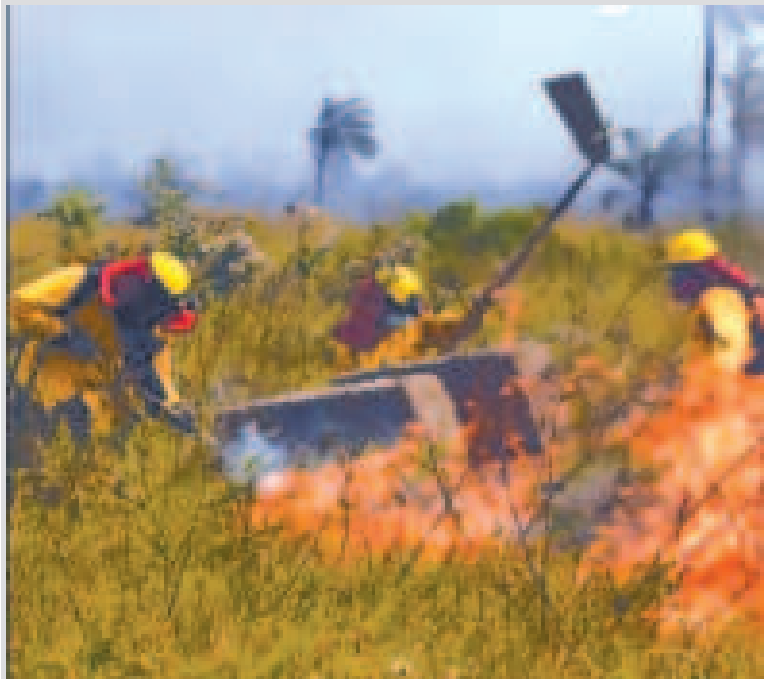
Trabajo de mitigación de llamas en el oriente boliviano.