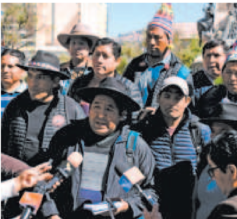
La dirigencia de la CSUTCB en conferencia.