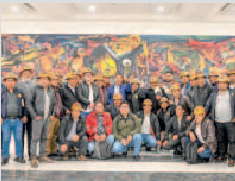
El presidente Luis Arce con los representantes de Fencomin.