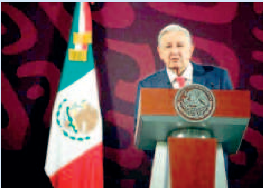
El presidente de México, Andrés Manuel López Obrador, durante el anuncio.