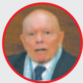
ÓSCAR HASSENTEUFEL es el presidente del Tribunal Supremo Electoral (TSE).

Una es el empadronamiento biométrico masivo que inicia el miércoles 21 y concluye el 30 de este mes, indica el cronograma de actividades del TSE.