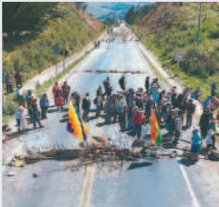
Bloqueo de una vía en Cochabamba.