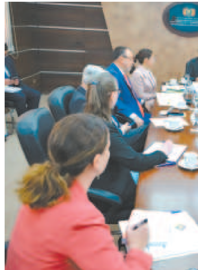
Reunión de la Plataforma Regional contra la Trata de Personas y el Tráfico Ilícito de Migrantes.

“Es el momento de sentar un precedente sobre estas calumnias”, expresó.