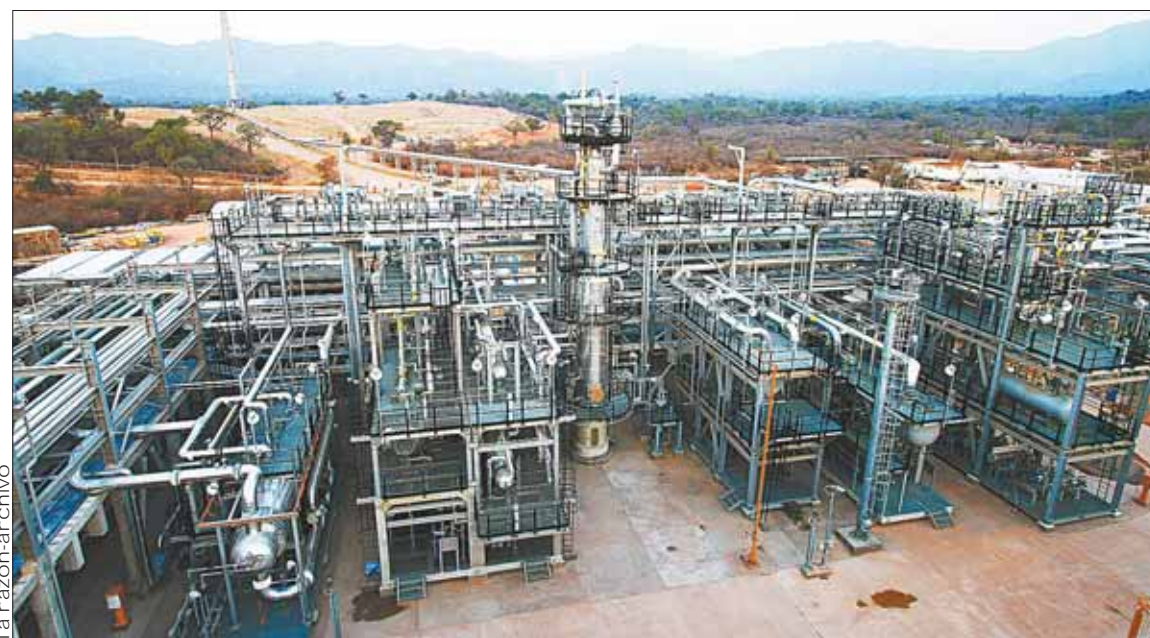
PETROLERA. El campo Margarita, en el departamento de Tarija, donde la Shell realizó labores.

mercio Internacional (CCI) en favor de Shell establece un pago aproximado de $us 10 millones.