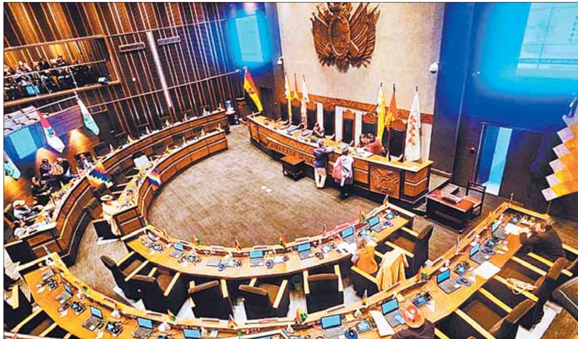
DEBATE. La sesión de la Cámara de Senadores, a la cabeza de su presidente Andrónico Rodríguez.

“El jefe de bancada (del MAS) nos solicita decretar un cuarto intermedio hasta las 11 de la mañana. No creo que exista ningún problema, así hay mayor posibilidad para que pueda ponerse de