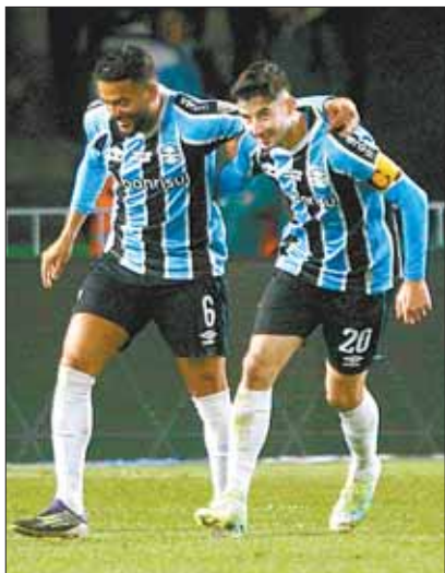
Los jugadores de Gremio celebran.

El club de Porto Alegre venció (2-1) y saca ventaja en octavos de la Copa