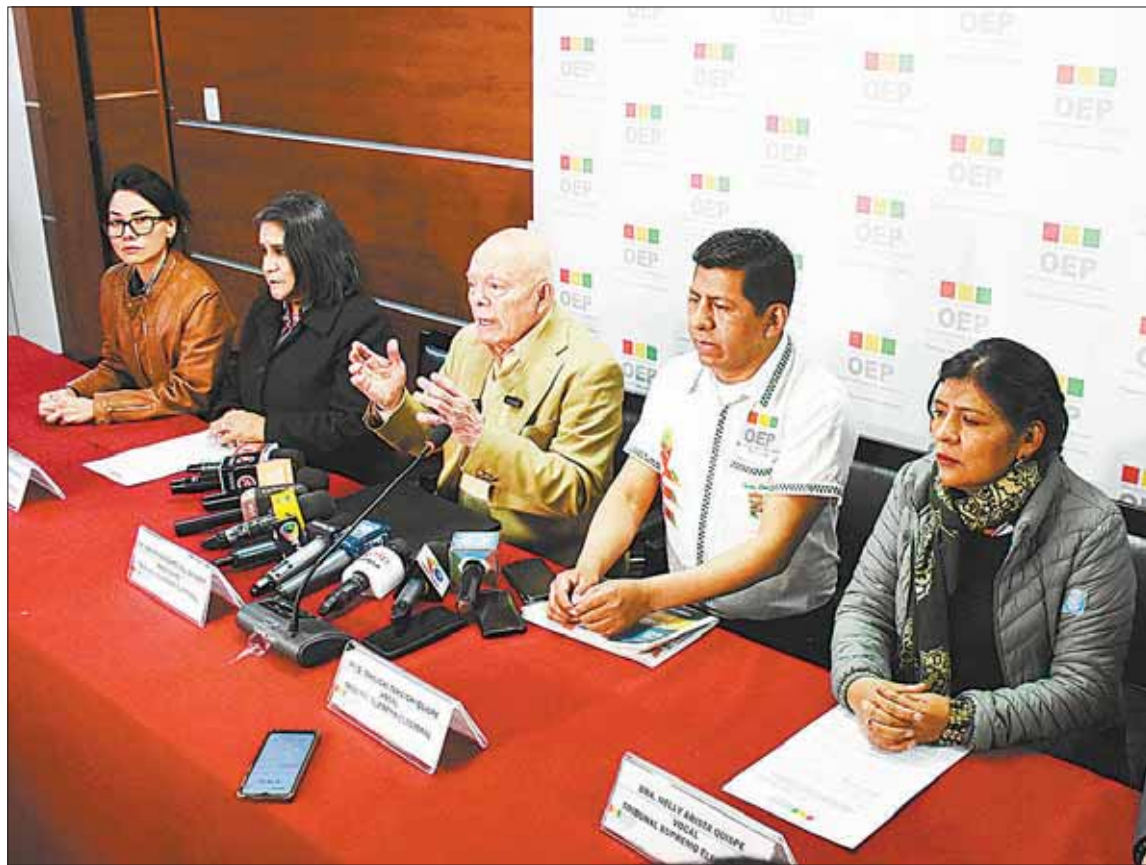
CONVOCATORIA. La sala plena del TSE, a la cabeza de su presidente Óscar Hassenteufel.

Nacional. El ente electoral iniciará con el registro masivo para el padrón en ocho días