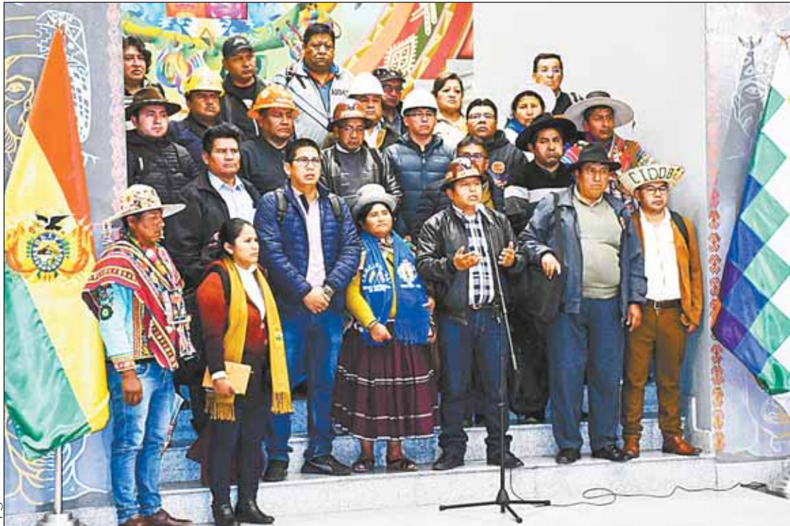
ENCUENTRO. Las organizaciones sociales hacen conocer las conclusiones del Gabinete Social.

Hoy en la Casa Grande del Pueblo se instalará el Diálogo por la Economía y la Producción con el gremio empresarial del país. Hablarán de dólares y combustibles