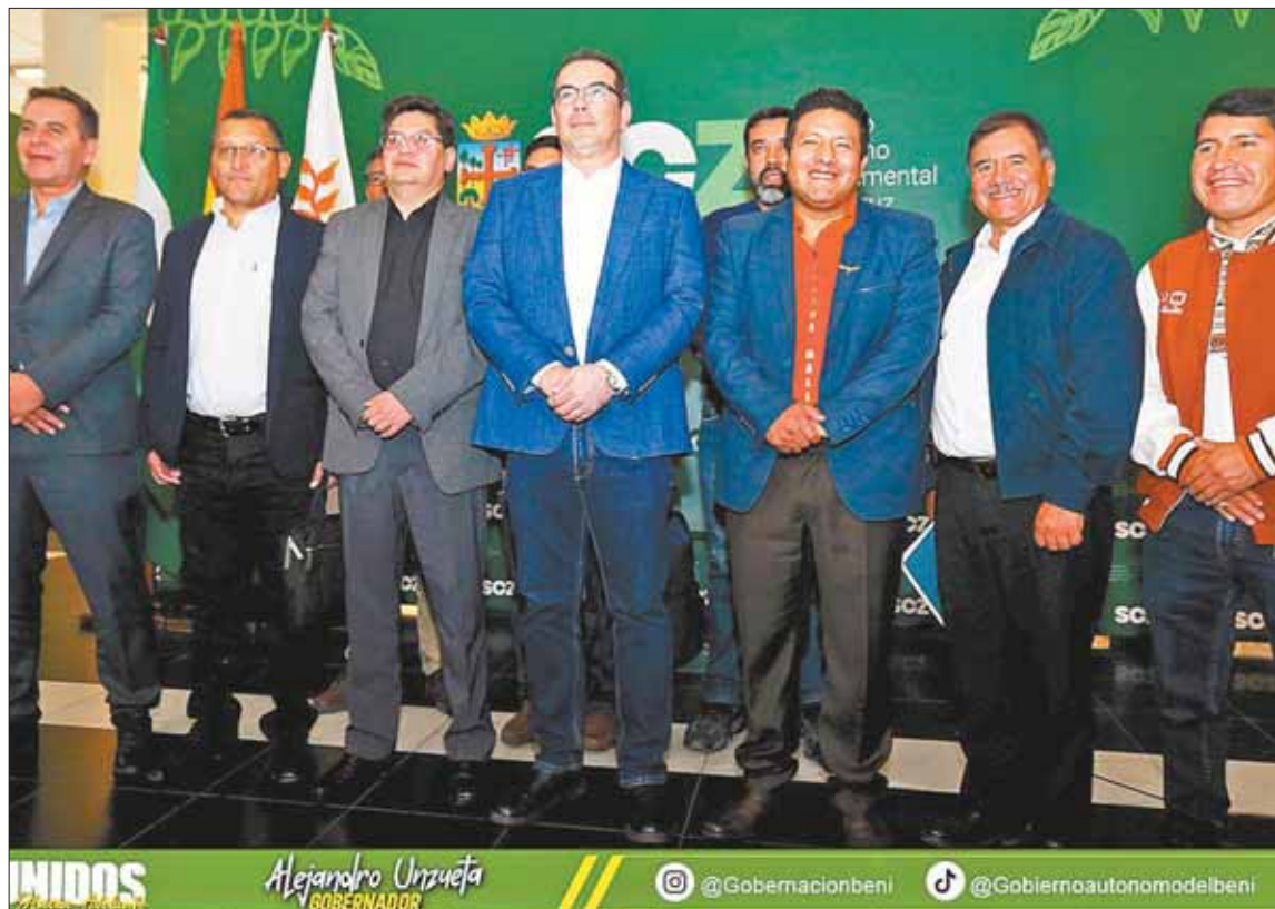
SANTA CRUZ. El ministro de Economía, Marcelo Montenegro, se reunió ayer con seis gobernadores.

Entre los puntos de acuerdo, según Montenegro, están la evaluación sobre un fondo de reactivación, el trabajo conjunto para mejorar los ingresos económicos regionales "a través de un control más efectivo del pago de las regalías" y la reprogramación de las