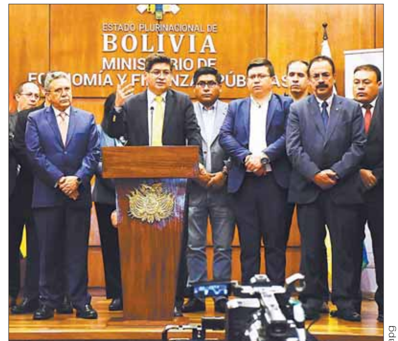
DIÁLOGO. Un encuentro anterior de Economía con los empresarios.

En su mensaje por los 199 años de la Independencia de Bolivia, el jefe de Estado anunció que convocará a empresarios y organizaciones sociales a un diálogo para asumir acciones conjuntas.