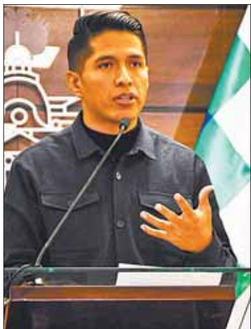
El senador Andrónico Rodríguez,

Gustavo Ávila también se refirió a la suspensión de las elecciones primarias