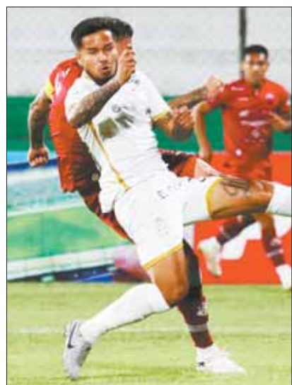
Incidencia entre Guabirá y Real.

El merengue venció ayer a Guabirá por 0-1, en el Gilberto Parada