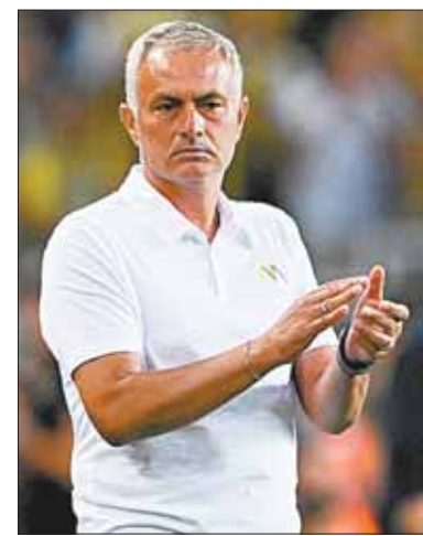
José Mourinho, DT de Fenerbahce.

Todo parecía conducir a la tanda de penales, pero en el 118 el árbitro principal decretó penal y Jonathan David transformó el 1-1.