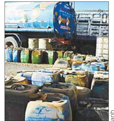
Parte del combustible incautado.

En la primera fase del plan Soberanía se evitó el desvío de 282.000 litros de combustibles.