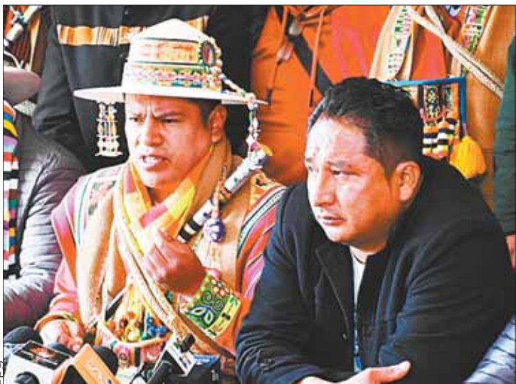
CONFERENCIA. Dirigencia del Pacto de Unidad de la facción evista.