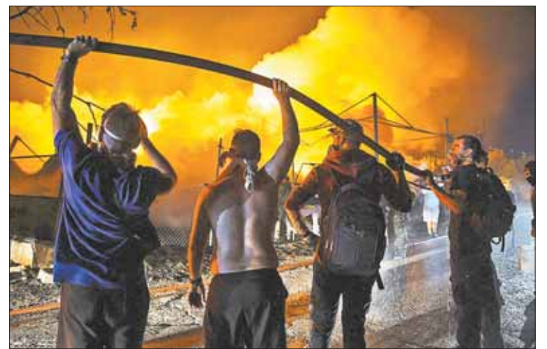
TEMOR. Las llamas rondan varios centros poblados de Grecia.

Fuentes comunitarias confirmaron a Europa Press que Italia ha movilizado dos aeronaves Canadairs, mientras que Francia desplegó un helicóptero. Todos estos medios pertenecen a la reserva estratégica de la UE contra emergencias. Asimismo, el Mecanismo coordinó el envío de dos equipos terrestres para ayudar a las labores de extinción.