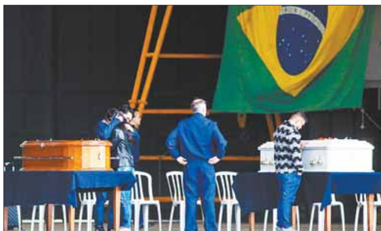
LLANTO. Familiares desesperados tras el accidente.

La aviación brasileña es reconocida como una de las más seguras a nivel mundial, afirmó ayer martes el ministro de Puertos y Aeropuertos de Brasil, Silvio Costa Filho, al referirse al accidente aéreo ocurrido el pasado viernes en una ciudad del interior del estado de Sao Paulo (sureste) y que cobró la vida de 62 personas.