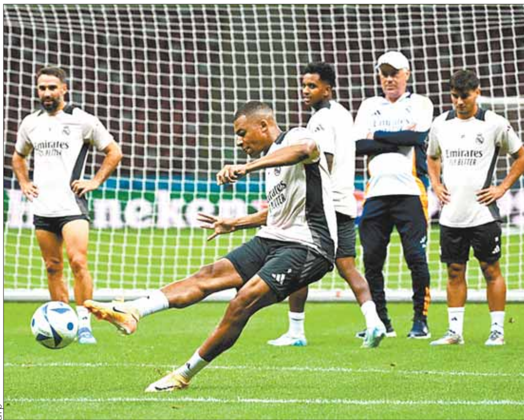
REFUERZO. Mbappé remata en pleno entrenamiento del Real Madrid, en Varsovia.