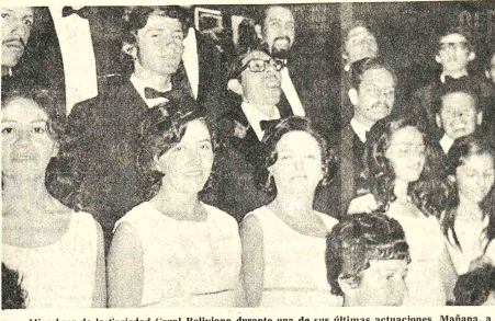
Miembros de la Sociedad Coral Boliviana durante una de sus últimas actuaciones. Mañana, a las 20.00, en el Teatro Municipal, la Sociedad Coral y la Orquesta Sinfónica Nacional presentarán "Carmina Burana" de Carl Orff.