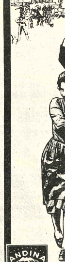
ANTHONY QUINN - ANNA MAGNANI