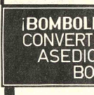
HOY DIJO SUS PRIMERAS PALABRAS -- "ALKA-SELTZER"