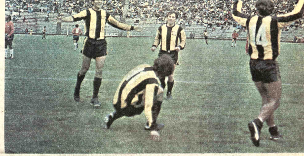
(EJEFERACION) - Los jugadores orureños celebran una de las conquistas frente al sub-campeón nacional Wilsterman de Cochabamba. Su acción ofensiva fue mucho más completa que la del rival. El gol de Bastida a los 3 minutos de iniciado el cotejo. Fue psicólogo para que el equipo local jugará con confianza.