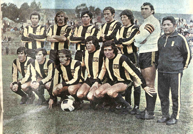
DEBUTARON EN LA COPA LIBERTADORES... Equipos de Wilsterman y The Strongest, que ayer debutaron en la "Copa Libertadores de América", grupo 2, en un cotejo jugado en cancha anormalmente intensa lluvia caída en horas de la tarde en La Paz. Ganaron los anfitriones por 2 a 1, jugando mejor que su adversario.