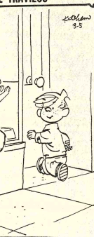
Yamos a entrar. Ya han pasado dos semanas desde que nos dijeron...