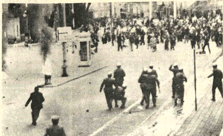
DISTURBIOS, Oporto, 3 (AP). - Manifestantes izquierdistas chocan con la policía portuguesa, después de haberse producido incidentes durante la reunión de un partido de derecha.

Los militares pidieron a los extranjeros que trabajan en esas empresas que permanecieran en sus puestos, prometiéndoles una completa seguridad. Los extranjeros que, en cambio, desiguieren las contabilidad e intenten sabotear la buena marcha de las empresas nacionalizadas, comparecerán delante de tribunales militares.