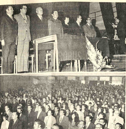
INAUGURACION DE AÑO ESCOLAR.—Las fotografías fueron tomadas ayer durante la inauguración del año escolar. Arriba, las autoridades que presidieron el acto. Abajo, parte del público que presenció la ceremonia en el local del cine-teatro "16 de Julio".