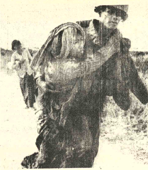
AYUDA.- Nueva York 3 (AP). - Un soldado camboyano ayuda a una aldeana con el pie lesionado, a trasladarse fuera de la ciudad de Neak Luong, sitiada por los comunistas.

Washington, 3 (AP) - El Secretario de Estado Henry A. Kissinger reaccionó amargamente hoy ante la publicación de informaciones sobre las actividades clandestinas durante el régimen chileno del Presidente Salvador Allende. "The Washington Post" reprodujo en su primera plana acusaciones del ex embajador chileno en esta capital, Orlando Letelier, en el sentido de que Kissinger se reunió personalmente en 1971 que la CIA no está envuelta en la conspiración contra Chile. "Es sorprendente que el haberse sido invitado a la casa de un diplomático para recibir un mensaje nítido", respondió Kissinger con visible molestia. Letelier dijo al periódico que se le había invitado a una cena que ofrecía el economista Joseph Alsop en la cual estaría Kissinger con un mensaje especial para él. "Kissinger me llevó a un la