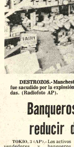
DESTROZOS.-Manchester 3 (AP).-Vista interior del almacén Lewis de Manchester que fue sacudido por la explosión de una bomba. La policía dijo que 19 personas resultaron heridas.

cubana en colaboración con el congreso, y agregó que la decisión de revisar las relaciones asimismo con la posición que asuman hacia la isla los países latinoamericanos. En un espacio de la política exterior, el secretario de estado señaló que su objetivo en Medio Oriente es un nuevo acuerdo para Israel y Egipto, y con ese espíritu emprendió su imminente gira por el extranjero. Luego afirmó Kissinger que es imposible considerar a la OLP (Organización para la Liberación Palestina) como un interlocutor válido desde el momento en que se niega a reconocer la existencia de Israel. Refiriéndose a China, Kissinger sostuvo que los responsables chinos no parecen desalentados del lento ritmo con que avanza el proceso de normalización de relaciones. De este modo, el secretario de estado discrepó abiertamente con las declaraciones del líder demócrata Mike Mansfield, quien opinó todo lo contrario al regresar de su reciente visita a China. Acercar de Vietnam, según Kissinger, es responsable por el fracaso de la paz en Indochina. El secretario de estado opinó todo lo contrario al regresar de su reciente visita a Hanoi, que según acercando sus efectos. En las instancias de los periodistas, Kissinger regresó luego al tema latinoamericano para declarar que se autodetermina "Fuerzas Armadas Revolucionarias" (FARC), al que se atribuye el secuestro.