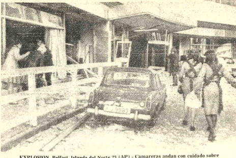
... EXPLOSION, Belfast, Irlanda del Norte 23 (AP) - Camareros andan con cuidado sobre vidrios rotos por la explosión de una bomba que causó daños graves al lujoso Hotel Europa. (Radiofoto AP).

Un vocero, del grupo revolucionario "Bandera Roja" informó, en forma exclusiva a esta agencia, que sus principales dirigentes escapados el sábado, estaban cubiertos extensamente y que esto, así como la preparación anterior a la fuga realizada por su sector urbano y rural, imposibilitaban totalmente la captura de Carlos Betancourt, su principal dirigente, Gabriel Puertas, otro de sus máximos líderes así como de los demás miembros del grupo. "Todo ha sido cuidadosamente preparado para llevarnos al éxito, disponemos de suficiente resanado humano y económico.