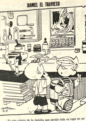
Es una amiga de la familia que perdió toda su ropa en un incendio

URGENTE Necesito casa compra al contado Zona Escuderos referencias teléfono 82709 (R)