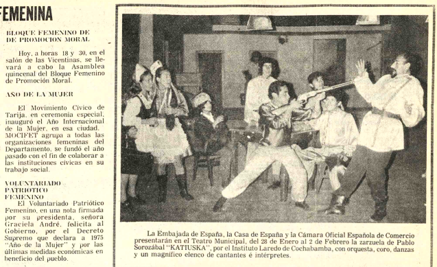
La Embajada de España, la Casa de España y la Cámara Oficial Española de Comercio presentarán en el Teatro Municipal...

INSCRIPCIONES: Abiertas hasta el 30 de enero en la Secretaría del CENTRO SUPERIOR DE ENSEÑANZA