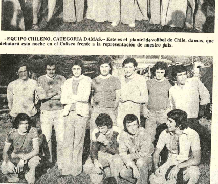
-EQUIPO MASCULINO.- Elenco de varones, que representará a la Federación Chilena de Voleibol. Debutará también esta noche frente al seleccionado de varones de Bolivia. Mucha interés por el espectáculo.