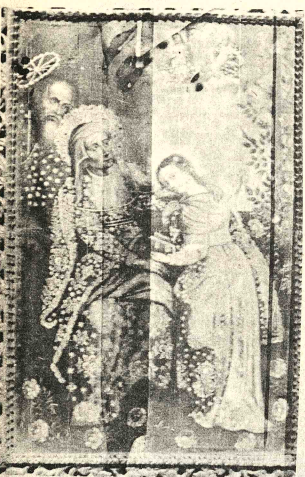
"LA VIRGEN CON SANTA ANA Y SAN JOAQUIN". Anónimo. Escuela Cuzqueña. Siglo XVII. Esta es una de las valiosas pinturas que fueron robadas del Templo de Laja, el pasado diciembre. Los responsables del Instituto de Estudios Bolivianos de la UMSA prepararon a PRESENCIA (para su publicación) la mayoría de las fotografías de las obras sustraídas.