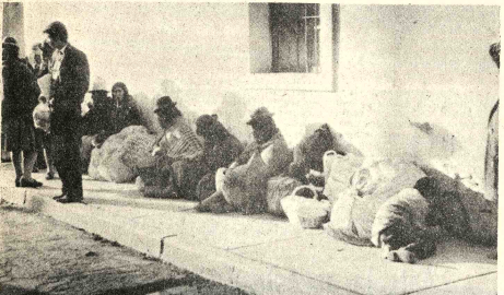
PASAJEROS PARALIZADOS. Centenares de personas que viajaban a Llallagua quedaron detenidas en Oruro, debido al cierre de la carretera. Su situación es desesperante, ya que muchos no cuentan con recursos y deben permanecer en la calle.

plazan diariamente 14 de sus buses, con un promedio de 500 pasajeros, pierde diariamente doce mil pesos bolivianos. Otros empresarios expresaron que se resisten a utilizar ese camino (Oruro - Challapata - Llallagua), por su pésimo estado de conservación. RECLAMOS La suspensión de la mencionada carretera, que es controlada por la Policía de Tránsito y la Guardia de Seguridad, está motivando acentuadas protestas de parte de los usuarios y transportistas. Algunos de ellos han señalado que gestionarían ante el mismo Presidente de la República, la revocatoria de la medida, "que afecta mayormente - dicen - a gente de condición humilde".