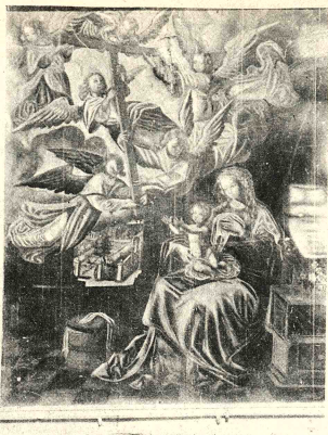
"VISION DE LA CRUZ". Anónimo. Escuela Europea. Siglo XVI. Otra de las obras sustraídas del Templo de Laja. Serán el fondo del Instituto de Estudios Bolivianos, el templo mencionado quedó casi desierto.

tístico cometido en la iglesia de Laja, los responsables del Instituto de Estudios Bolivianos consideran de suma importancia la publicación de las fotografías de las valiosas pinturas sustraídas. De este modo, las autoridades podrán alertar a los posibles compradores de estas obras, dentro y fuera del país.