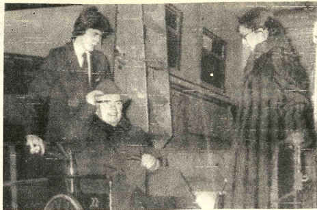
- FUTURO SIR.— Londres, (AP).— Carlitos Chaplin y su esposa en el aeropuerto de Londres cuando se dirigían a Suiza. Ambos volverán a Gran Bretaña a principios de febrero para la ceremonia en que la Reina Isabel II armará caballero al legendario cineasta. (Radiotele AP).

Sin embargo el ministro dijo que la situación de orden público es casi normal y está bajo control por lo cual el gobierno no ha pensado en decretar el Estado de Sitio o tomar medidas extraordinarias.