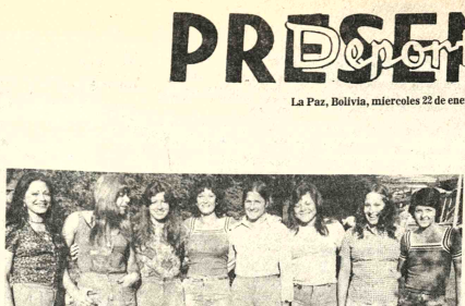
-EQUIPO CHILENO, CATEGORIA DAMAS.- Este es el plantel de voleibol de Chile, damas, que debutará esta noche en el Coliseo frente a la representación de nuestro país.