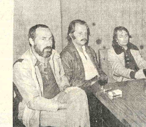
RAHISTAN.- Los ralistas italianos que conducen máquinas Fiat, aparecen en la conferencia de prensa realizada ayer para informar sobre la prueba que se cumple rumbo al Canadá. Hoy prosiguen hasta el Perú.