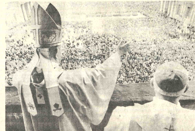
BENDICIÓN. Vaticano Dc. (A).- El Papa Paulo Sexto en el momento de dar su tradicional bendición "Urbi et Orbi" a la ciudad y al pueblo desde la Basílica de San Pedro en El Vaticano. Paulo VI abrió las puertas del Año Santo en una emotiva ceremonia.

Un análisis lógico de la situación y la fijación de metas conexas, serán también hechos en los días posteriores para la ejecución de las metas fijadas en el presente programa de la Corporación Boliviana de Fomento y las demás entidades estatales. Los Consejos Consultivos, según los portavoces de la Presidencia de la República, tienen como función principal la de asesorar a la Presidencia de la República en las materias que les son asignadas. A tal fin, el asesorado, las mismas que deberán responder a las metas fijadas en el presente programa de la Corporación Boliviana de Fomento, ni excusas por el incumplimiento de la que se las ha confiado", afirmaron las mismas fuentes del gobierno.