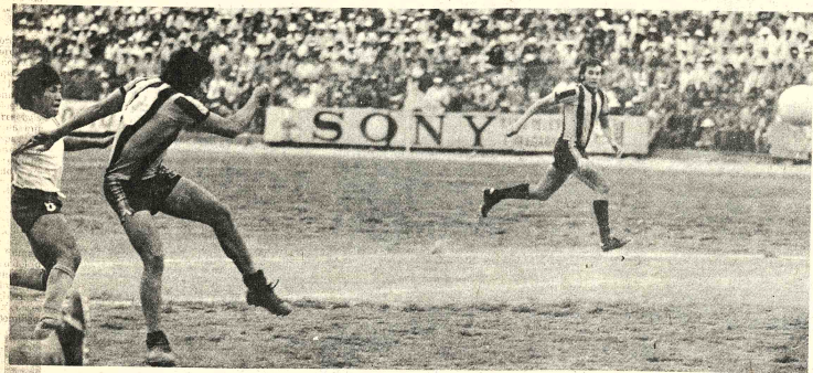
OPORTUNIDAD PERDIDA. Una de las muchas oportunidades perdidas por The Strongest frente a Bolívar. El tomate de Pariente saltó desviado. El delantero strongista careció de seriedad para definir en los momentos oportunos.

alumag ANTI-ACIDO Cada tableta 45 Cts. en todo el país.