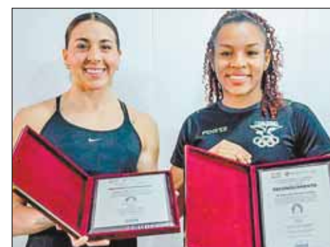
VICEMINISTERIO DE DEPORTES