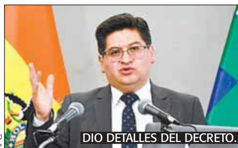
DIO DETALLES DEL DECRETO.

La medida busca reducir hasta en 50% la importación de diésel