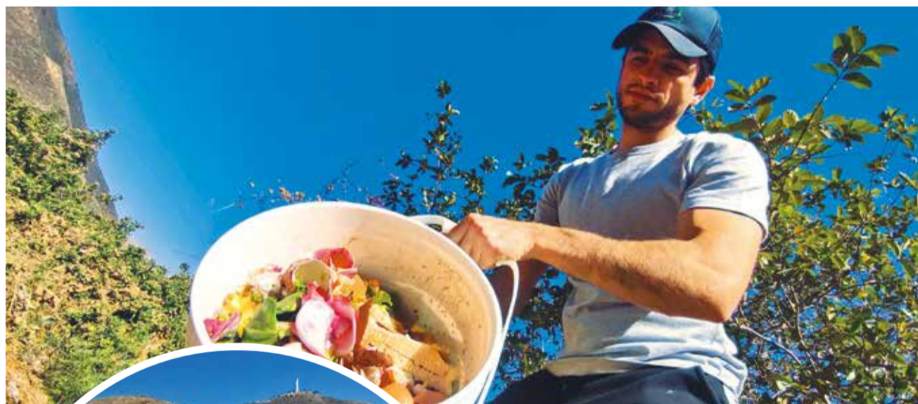
El proceso de compostaje con los residuos recolectados.

Apuesta. Esta iniciativa, impulsada por un joven universitario, pretende llegar a más zonas instalando puntos verdes con el apoyo de la población, organizaciones e instituciones