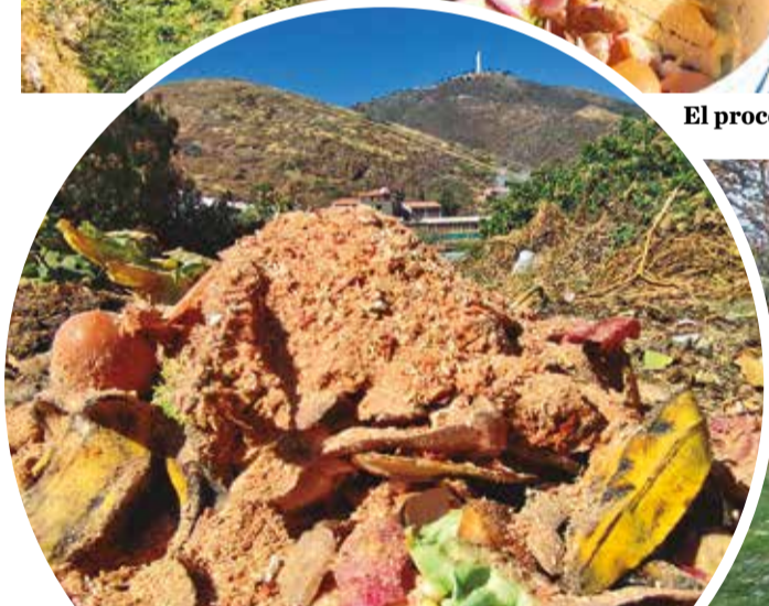
Residuos transformados en abono.