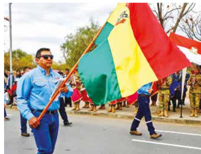
Actos cívicos en Tarija. GOBERNACION TARIJA