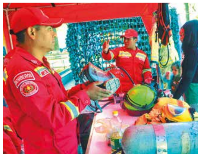
Los policías de la Dirección de Bomberos. HERNAN ANDIA