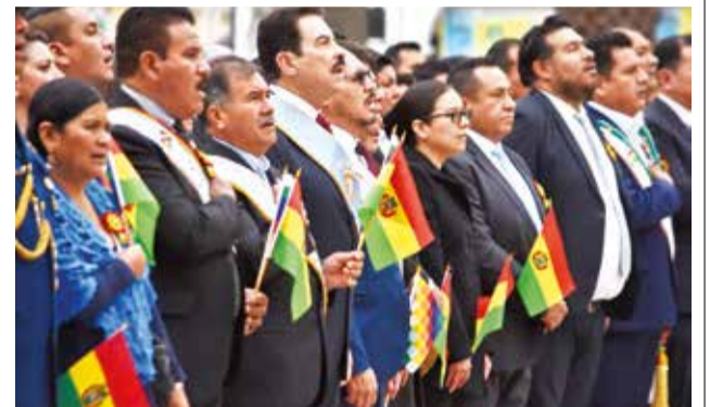
Autoridades en la iza de las banderas nacional, del departamento, y la wiphala, en la plaza 14 de Septiembre.