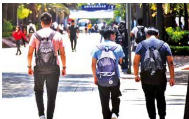
El voto joven será importante en los comicios de 2025.

Coca sostiene que los jóvenes deben ser entendidos en su verdadera dimensión, ya que el pensamiento de ellos es muy diferente al de otras generaciones. “No quieren que el Estado les entorpezca en sus emprendimientos, sino que se les deje emprender y producir; quieren que el país se incorpore al siglo XXI plenamente y a