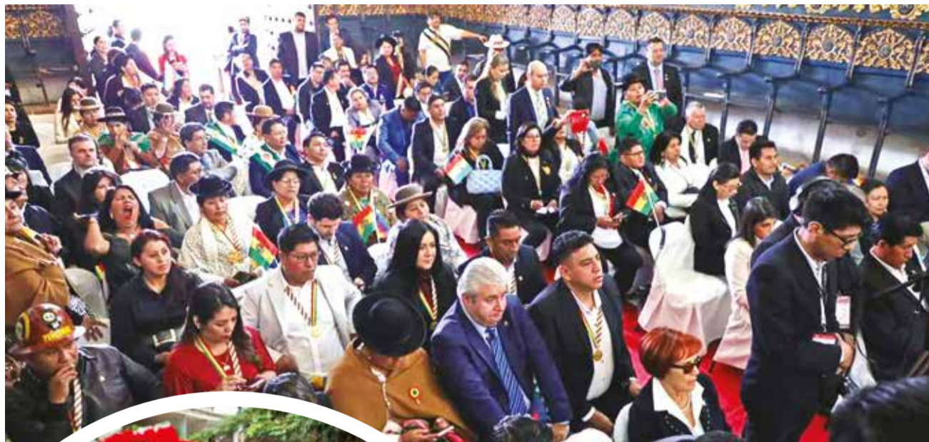
Legisladores de la ALP abuchean a magistrados “autoprrogados” durante la sesión de Honor, ayer en Sucre.

Los desfiles y actos protocolares por el aniversario patrio en Santa Cruz comenzaron temprano con ofrendas y misas, pero el acto central se realizó en la mañana en la