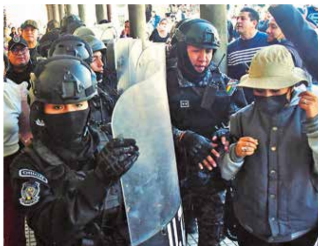
Miembros de la Unidad Táctica de Operaciones Policiales. C.L.

Seguridad. Las direcciones de investigación y las unidades de prevención, patrullaje y auxilio, al margen de brindar seguridad, tienen como principal objetivo ganarse la confianza de la población.