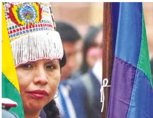
Desfile por el aniversario patrio en La Paz.

Aniversario. Desde Cobija hasta Tarija y de Puerto Suárez a La Paz, los bolivianos desfilaron con civismo por su aniversario.