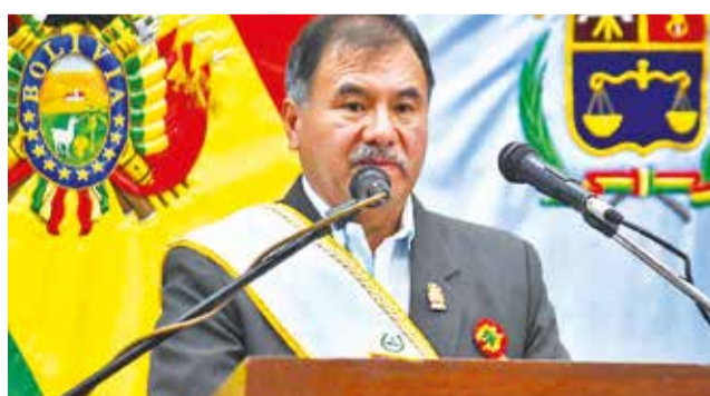
El Gobernador de Cochabamba. GOBERNACIÓN

"Estamos en el octavo mes del año, esperamos que el Ministerio de Economía pue-