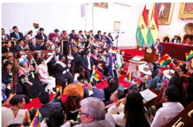
Legisladores en la sesión de honor de la ALP, en Sucre.

El jefe nacional de Comunidad Ciudadana (CC) Carlos Mesa, dijo que con sus pro-