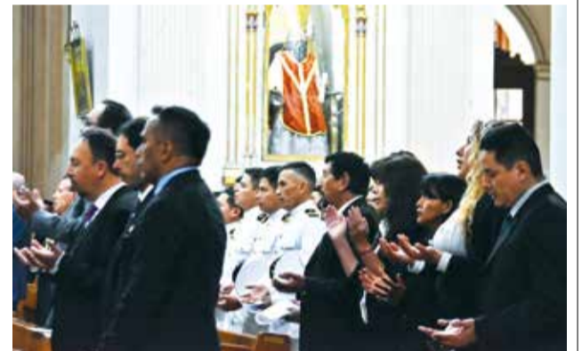
Funcionarios y oficiales navales en el Te Deum celebrado en la Catedral de San Sebastián, Cochabamba.