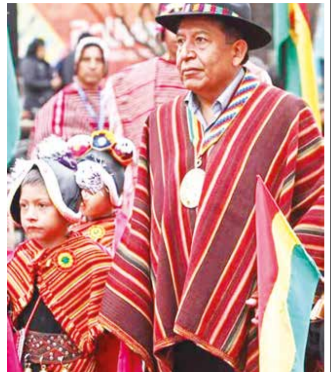
El vicepresidente David Choquehuanca en los actos por el aniversario patrio.