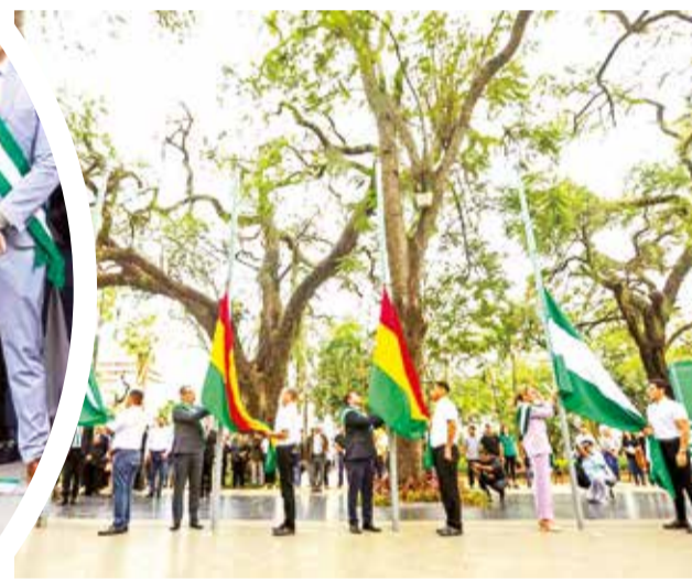
Desfile por el 6 de agosto en Santa Cruz. 4 PAG 2 GONERNASION DE STA CRUZ