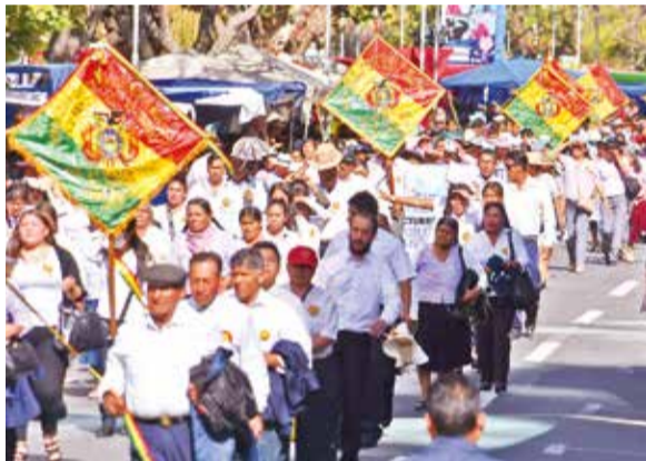
Asociaciones de comerciantes minoristas de la ciudad desfilan con unción cívica.