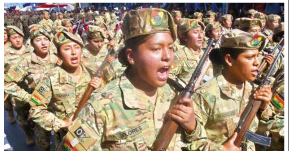
Jóvenes estudiantes del último año de secundaria que cumplen su servicio premilitar.

El desfile fue el último de los actos oficiales de una jornada de homenajes —feriado festivo-patriótico— que se inició a las 7 de la mañana con el depósito de una ofrenda floral a los pies del monumento al Libertador Simón Bolívar, continuó con la iza de las banderas nacional y departamental, además de la wiphala, en la plaza 14 de Septiembre y la celebración de una misa de Te Deum en la catedral metropolitana.