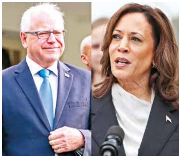
Harris y Walz, aclamados ayer en Filadelfia.

El partido utilizó este inusual método de votación, en lugar de coronar a Harris en la Convención Nacional Demócrata que celebrará en dos semanas en Chicago, porque las normas del estado de Ohio exigían conocer los nombres de los candidatos antes del 7 de agosto.