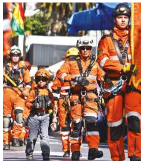
Miembros del Grupo Voluntario de Salvamento Bolivia (GVSB-SAR).