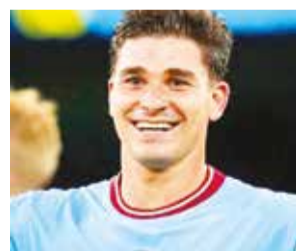
El futbolista argentino Julián Álvarez.

El argentino, campeón del mundo y bicampeón de Copa América con la selección albiceleste, dejará así el club inglés tras haber disputado