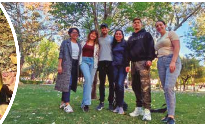
Algunos de los que se sumaron a este proyecto medioambiental.