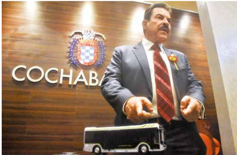
El Alcalde de Cochabamba muestra un modelo a escala del bus eléctrico. JOSE ROCHA

“El GAMC (...) coadyuvará para que un total de 300 vehículos eléctricos de Guangxi Sunlong Automobile Manufacturing Co.,Ltd. puedan ser adquiridos por las federaciones asociaciones del autotransporte público para operaciones de prueba en Bolivia”.