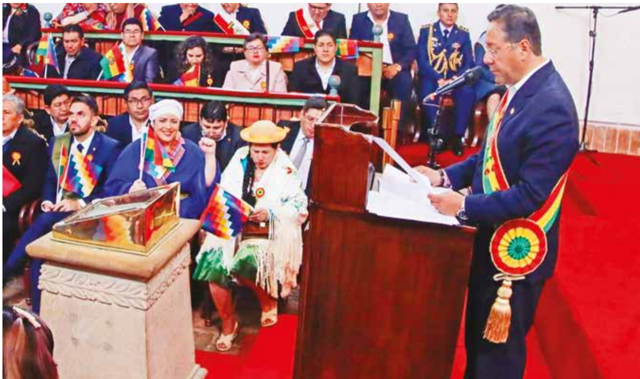
El presidente Luis Arce durante su discurso por el 6 de agosto, en Sucre.