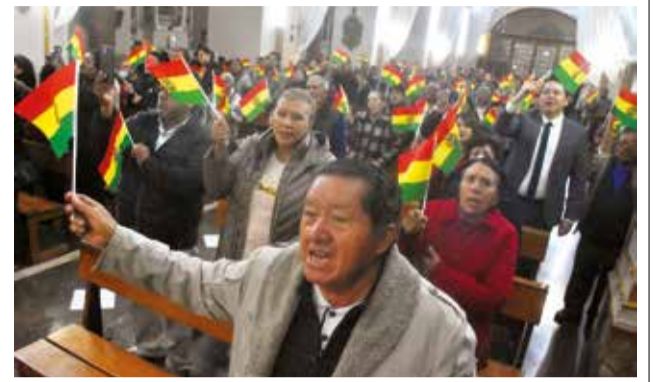
La misa en el templo de San Ildefonso, en Quillacollo.