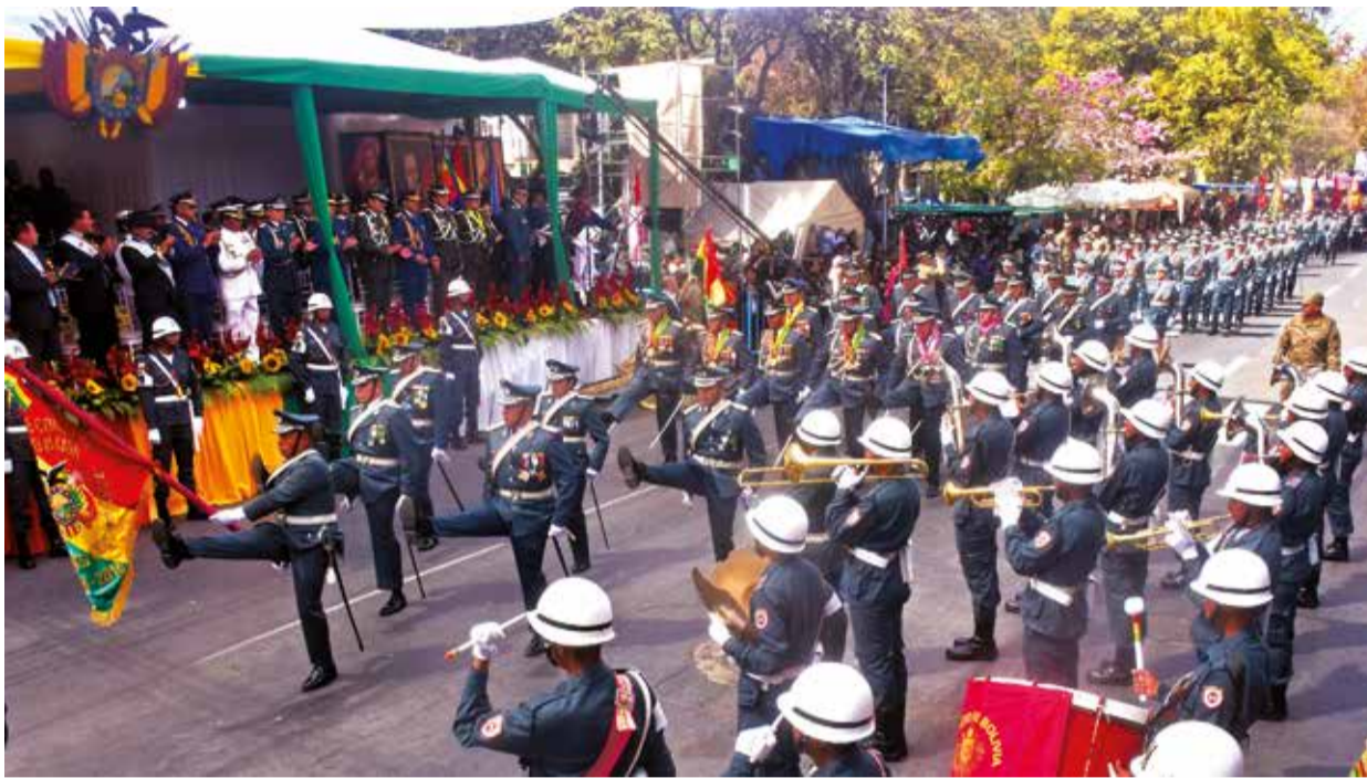
Oficiales de alta graduación de la Escuela de Comando y Estado Mayor "Andrés de Santa Cruz".