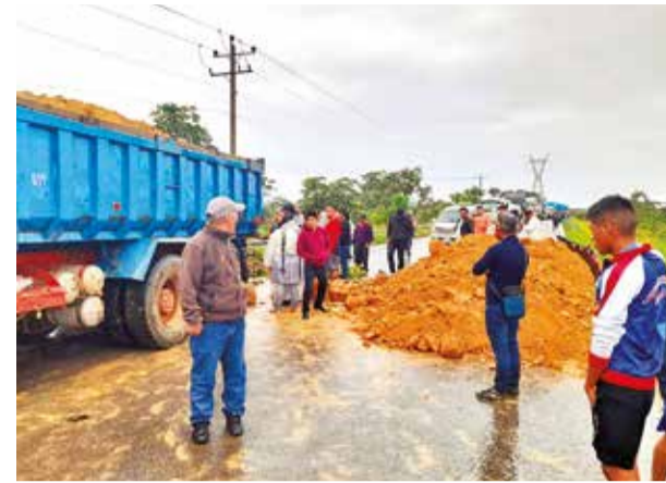
Bloqueo en la ruta hacia Entre Ríos.