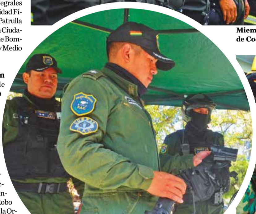
La Patrulla de Auxilio y Cooperación Ciudadana (PAC). H.A.