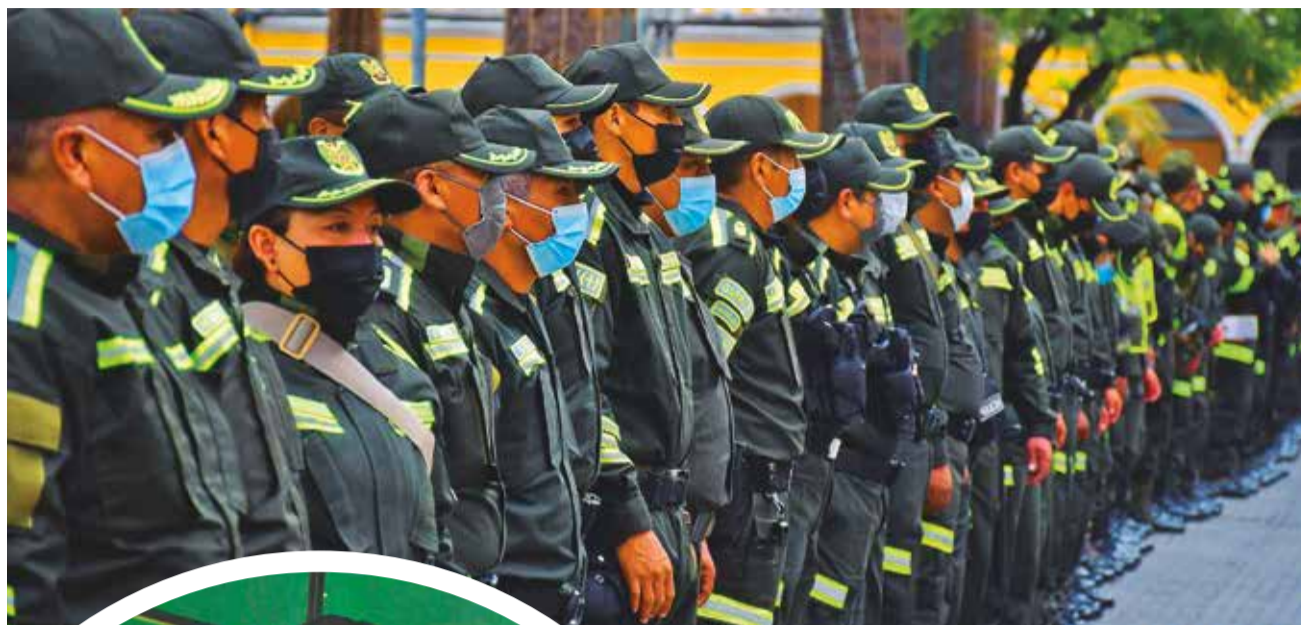
Miembros de la institución policial en el departamento de Cochabamba. CARLOS LÓPEZ

Por un lado, está la Unidad Táctica de Operaciones Policiales (UTOP), que se encarga de mantener el orden público en caso de disturbios; por otro, la Brigada Delta, que debe hacer frente al crimen organizado con el uso de tácticas, armas y