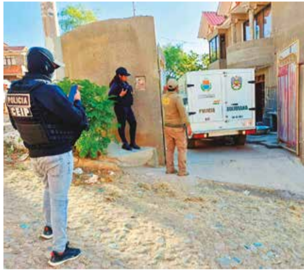
La Policía en el inmueble donde vivía la pareja. P. FIGUEROA

El Ministerio Público secuestró un revolver calibre 38, el mismo que fue usado por el ciudadano chileno para enfrentar a la Policía. Asimismo, los agentes del Cen-