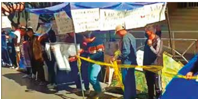
La vigilia de los estudiantes en el TCP, en Sucre. UMSS

Postura. Los decanos de ocho facultades determinaron aplicar el antiguo estatuto hasta que el Tribunal aclare la sentencia