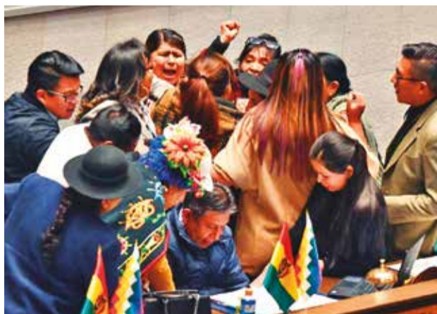
Pelear en la sesión de la Asamblea, ayer.

Luego de varios minutos, finalmente los legisladores