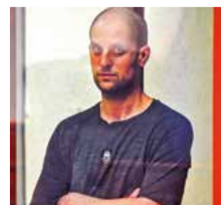
El periodista Evan Gershkovich.

Se ha producido el mayor intercambio de prisioneros entre Rusia y Estados Unidos desde la Guerra Fría, en el que 16 personas fueron liberadas de la custodia rusa, entre ellas el periodista del Wall Street Journal Evan Gershkovich. También fueron liberados otros ciudadanos extranjeros detenidos en Rusia y nu-