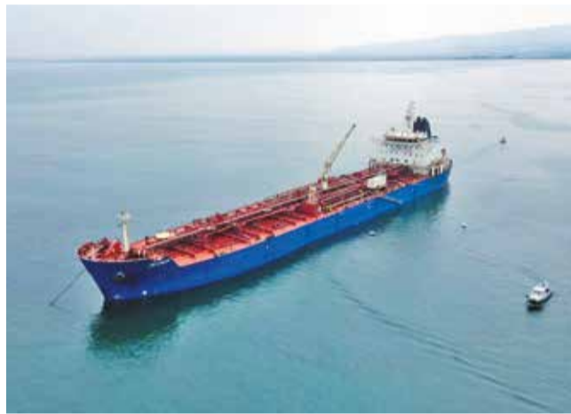
El buque cisterna Zeynep descarga diésel en Arica.