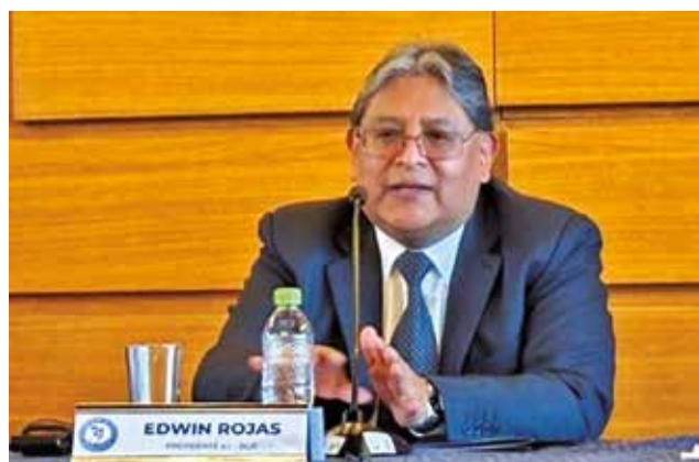
Edwin Rojas, presidente del Banco Central de Bolivia. BCB

El cumplimiento de estos compromisos —destaca el ente emisor— se ha llevado a cabo a pesar de las dificultades económicas