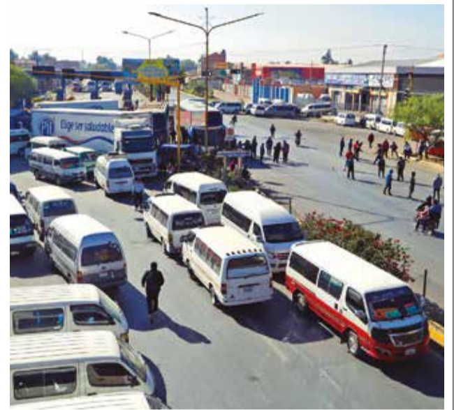
Tráfico paralizado en Quillacollo. APG