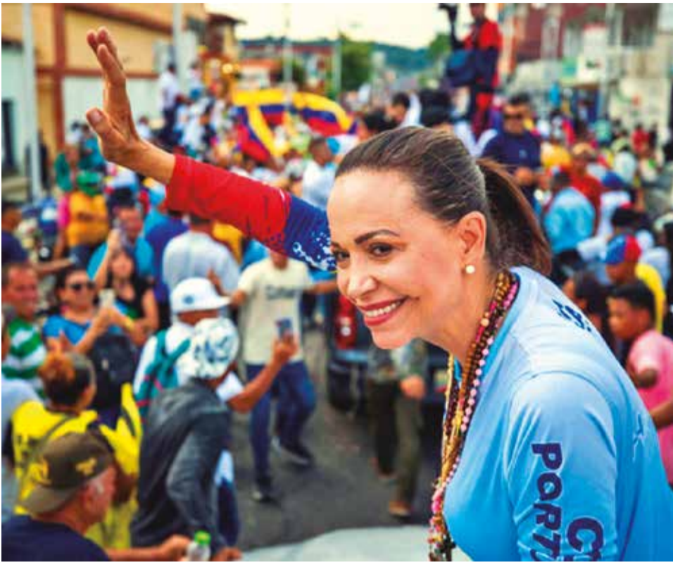
La opositora venezolana María Corina Machado, en un acto de campaña.