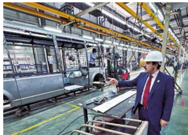
El Alcalde en una fábrica de buses eléctricos. RRSS

Semanas después, la Alcaldía mandó a una empresa las observaciones para que se realice un modelo con estas condiciones. No se supo más de la respuesta. Sin embargo, recientemente, el alcalde Manfred Reyes Villa viajó a China para que una empresa de buses eléctricos instale una fábrica.