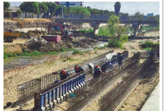
Los trabajos de la línea amarilla en el río Rocha.