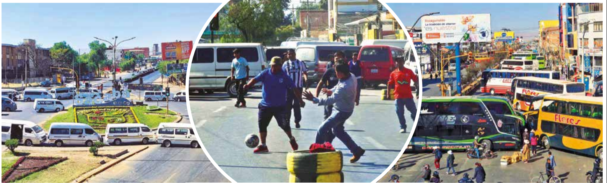
El ingreso principal a Sacaba, cerrado por minibuses. D.JAMES