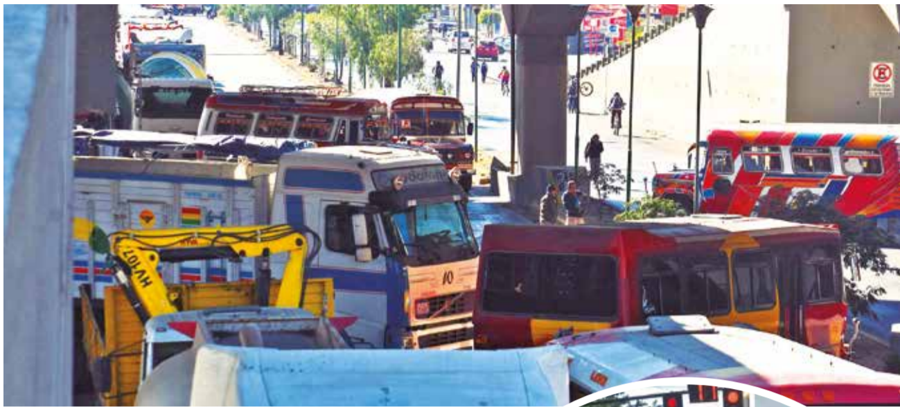
Bloqueo total en el cruce de dos avenidas de Cochabamba.