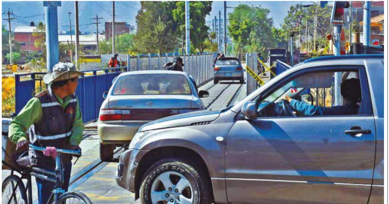
Varios vehículos invaden la vía del tren en el puente del río Rocha, en la línea verde.

MULTIMEDIA: Escanee este QR para ver el video de los vehículos que invaden la vía del tren.