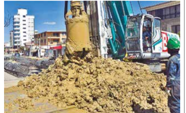
Los trabajos en el distribuidor de la av. Perú.