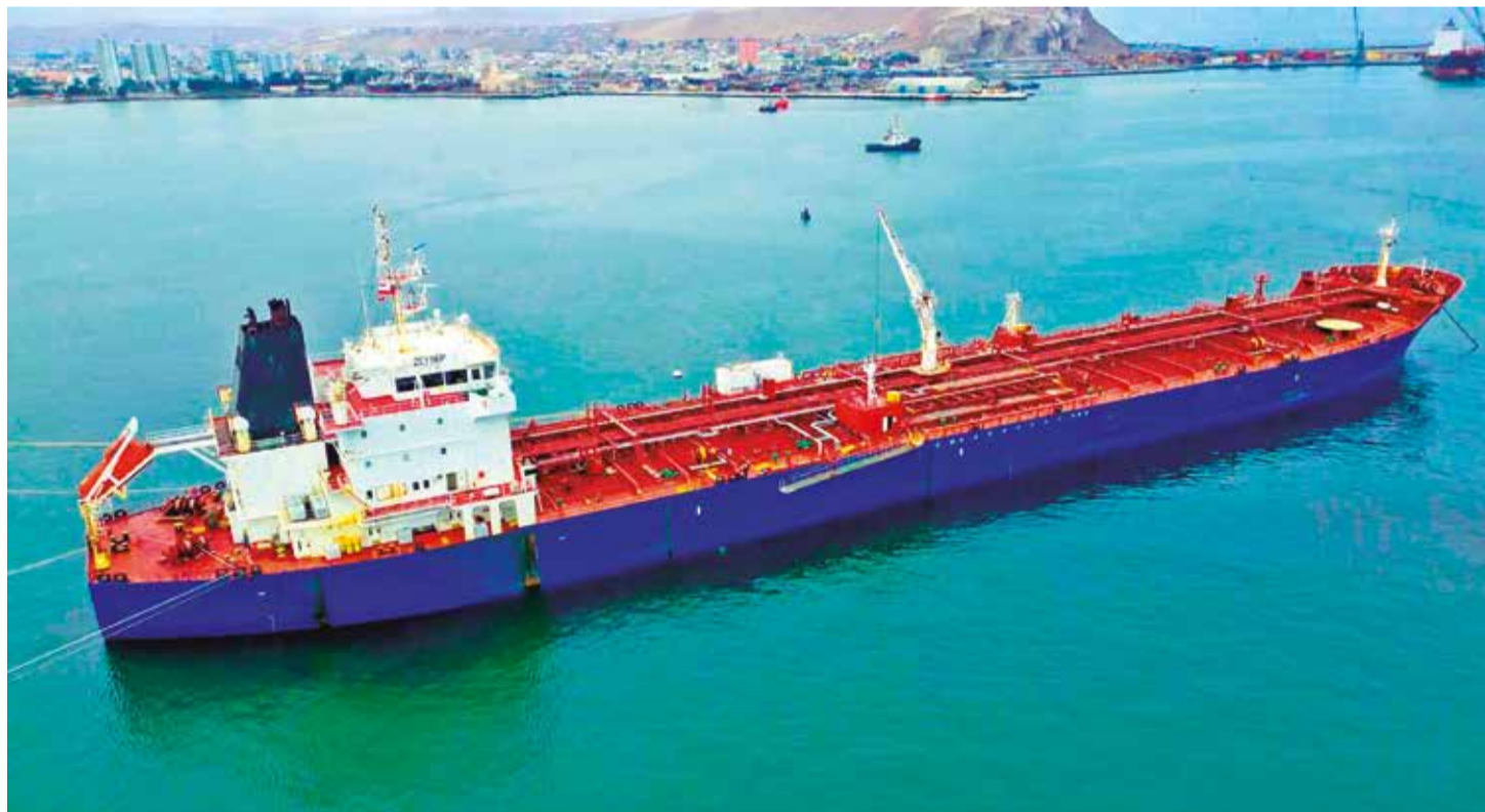
La descarga del diésel para Bolivia de un buque en el puerto de Arica, ayer. YPFB

Bloqueo. YPFB asegura que el combustible ingresará en cisternas hoy al país y pide paso al transporte pesado. Los choferes federados levantaron su medida ayer. Págs. 6-7