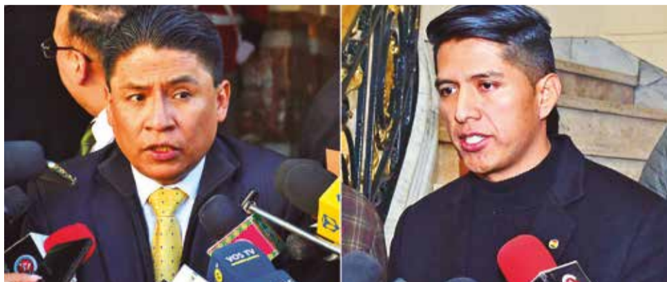
El ministro Iván Lima y el presidente del Senado, Andrónico Rodríguez.

Independiente del acuerdo político institucional para suspender las primarias, “soy honesto, Evo Morales es nuestro candidato y pasa-