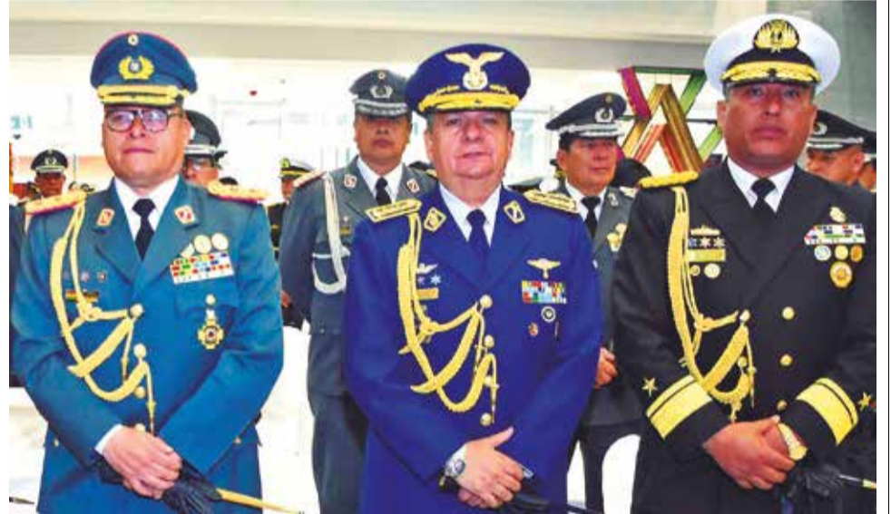
Los exgenerales Juan José Zúñiga, Marcelo Zegarra y Juan Arnés.

Las autoridades del Gobierno señalaron que Zúñiga y Arnez mantuvieron su insubordinación ante el presidente Luis Arce, pero Zegarra retrocedió e incluso participó en la posesión del nuevo Alto Mando.