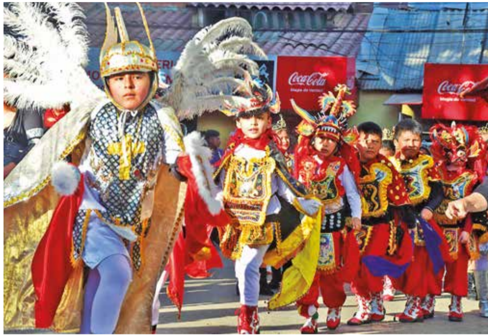
Niños que participan de la "Entrada de Urkupiña", en Quillacollo, en 2023. CARLOS LÓPEZ

En ese contexto, personal de diferentes reparticiones municipales intensifican los trabajos de mejoramiento de vías y áreas verdes para recibir a los miles de peregrinos que ya comienzan a llegar al municipio para visitar a la Virgen de Urkupiña en el templo de San Ildefonso.