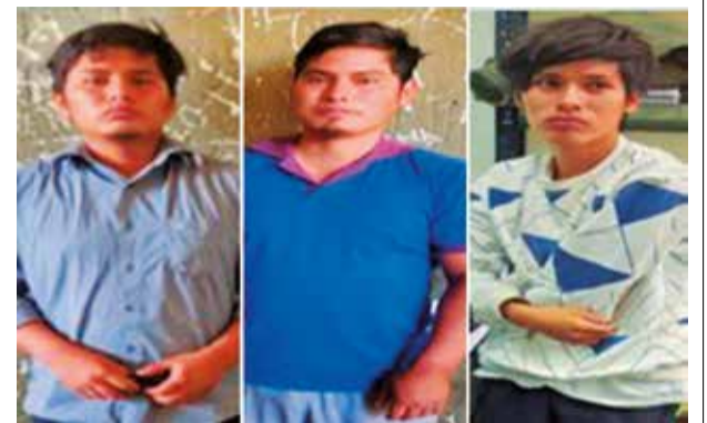
La Policía aprehende a tres personas. POLICIA BOLIVIANA

El operativo de ejecución de un mandamiento de aprehensión se realizó el miércoles.