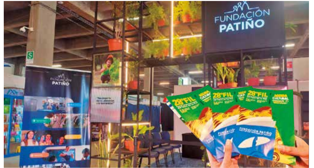
La Fundación Patiño ofrece una experiencia inmersiva con "El Palacio suena" y "Sonidos de la flora" en el stand de niños.