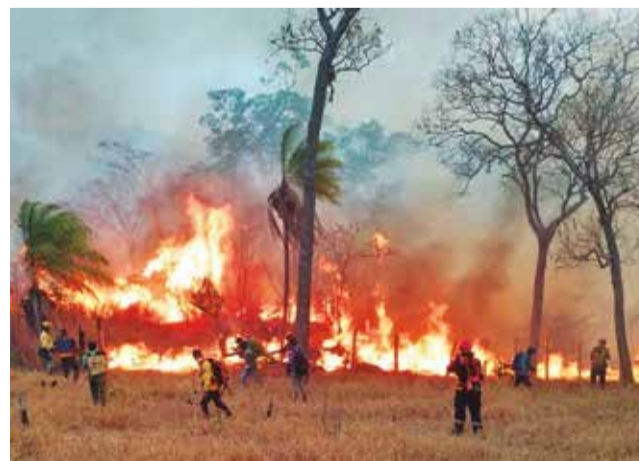
Incendio en el municipio de Roboré.

“Se pronostica vientos moderados a temporalmente fuertes de dirección noroeste, con velocidades entre 80 y 110 kilómetros por hora