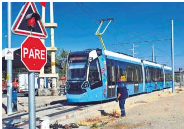
El tren eléctrico, el único transporte público, ayer.