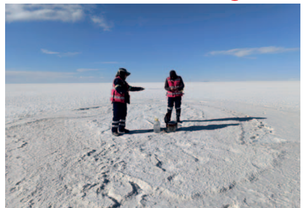
Durante el encuentro se presentó el plan de producción de las plantas industriales

discutieron también los proyectos destinados a diversificar la gama de productos y subproductos derivados del litio, con el objetivo de