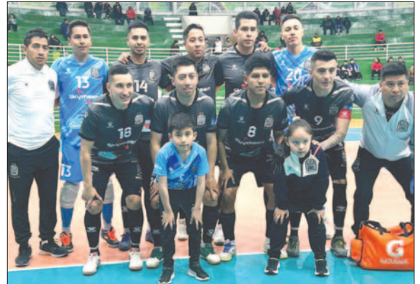
El cuadro orureño quiere sumar tres nuevas unidades en casa

El equipo de El Alto conoce bien el escenario de Oruro y al rival al que se enfrentará, por lo que tomará todas las precauciones necesarias para intentar sorprender al bicampeón en su propio terreno y buscar