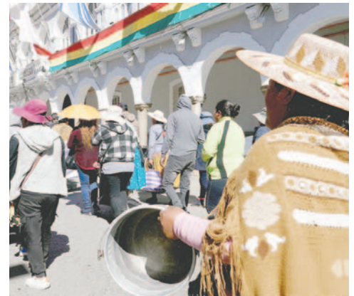
Gremiales radicalizarán medidas de presión