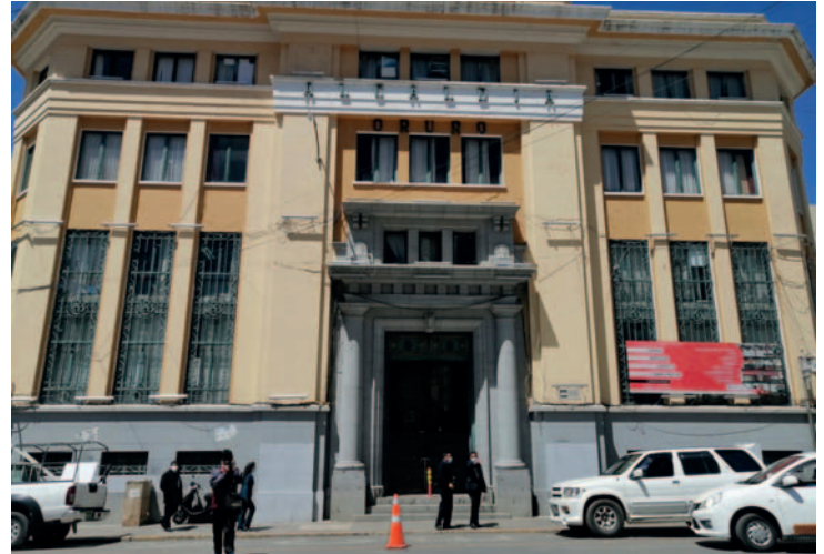
GAMO tiene la meta de recaudar Bs. 205 millones

Según el director de la Dirección Tributaria, durante este periodo de aproximadamente un mes de vigencia de la ley, se recaudaron cerca de 900 mil bolivianos por deudas de alcantarillado.