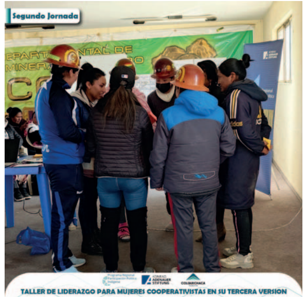
La Fundación Colquechaca realiza diversos tipos de talleres y capacitación con instituciones relacionadas a la minería

“Juntos podemos trabajar hacia una minería responsable, ya