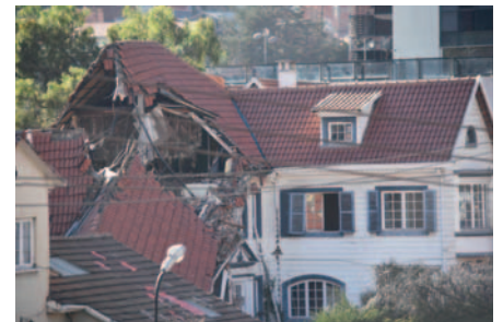
En recientes días una casa patrimonial fue parcialmente demolida