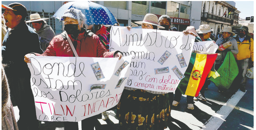
Gremiales exigen a las autoridades solución ante escasez del dólar / LA PATRIA