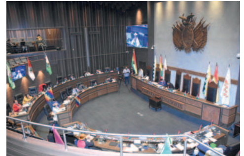
Instan al Senado a tratar la ley de suspensión de las primarias

“Sin duda alguna, hay que debatir. Me parece, desde mi punto de vista, que no es sensato privar al pueblo de Bolivia del derecho político de elegir internamente a sus candidatos.