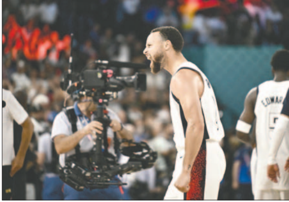
El festejo de los norteamericanos tras vencer a Serbia en semifinales

Superado el susto, en un partido en el que los 19 puntos de Joel Embiid fueron de vital importancia, el 'Team USA' buscará su decimoséptimo título. Kevin Durant, un inédito cuarto oro; LeBron, su tercero; y Curry, que debuta en Juegos,