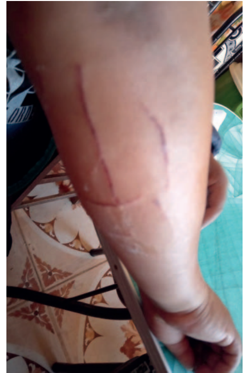
Se descartó un posible caso de rabia felina en Oruro

Desde el Sedes se informó que la vacunación contra la rabia canina y felina es permanente. Por lo tanto, aquellos propietarios que no pudieron