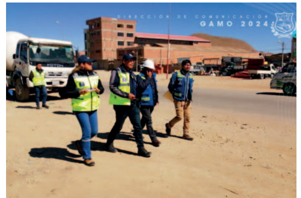
Destacan importancia de ejecutar el proyecto vial