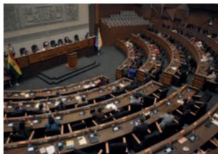
La norma debe tratarse en Diputados

“Nosotros vamos a aprobar, primero tratar y aprobar el proyecto de ley y así garantizar que