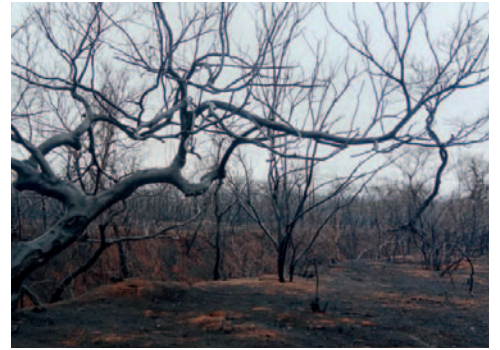
Zona afectada por incendios forestales este jueves en Roboré

Los incendios son un problema recurrente en Bolivia. En 2019, el fuego arrasó más de 5 millones de hectáreas en el país, lo que se consideró uno de los desastres ecológicos más graves de la última década.