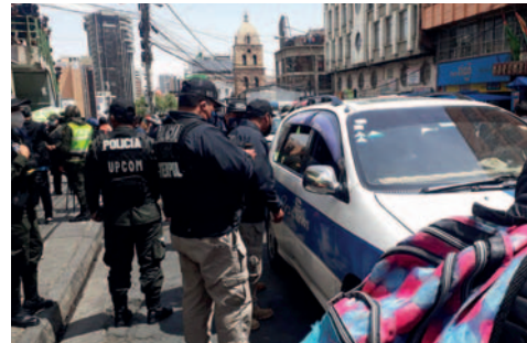
Operativo policial desarticula red internacional de tráfico de inmigrantes que operaba en España, Bolivia y otros países

En esos países, los migrantes eran alojados en hoteles hasta que la organización les proporcionaba pasaportes españoles de