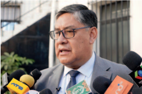
Fiscal General del Estado, Juan Lanchipa Ponce /FEE

En el marco de la investigación, la máxima autoridad del Ministerio Público indicó que, dentro de la imputación, se solicitó la aplicación de medidas cautelares personales para los tres imputados, como la prohibición de salir del