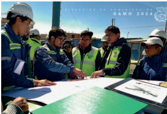
GAMO y ABC realizaron una inspección al proyecto de mejoramiento de la Doble Vía Oruro-Capachos

“Vimos que hay sectores bastante urbanizados, sectores comerciales. Esto es muy rele-