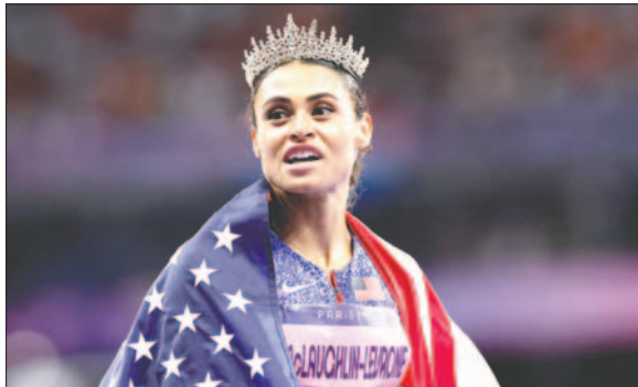
Sydney McLaughlin es dueña del nuevo record en 400 vallas damas