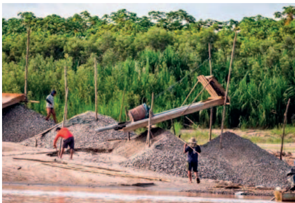
En Perú existen varias zonas mineras donde se explota de manera ilegal

Uno de los principales retos es la diversidad geográfica del país, lo que requiere soluciones adaptadas a cada región. Por ejemplo, en Madre de Dios, una región con características amazónicas, se podría