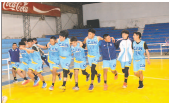
Vuelta olímpica de los campeones en Cadetes varones

El resultado final fue de 64 a 34 a favor de Corque, con parciales de 20-0, 11-12, 13-9 y 20-13, en consecuencia, Corque mantiene su lugar en Primera Honor.