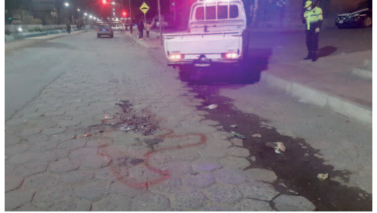
Agentes de la División Especiales iniciaron las investigaciones correspondientes en busca del responsable del hecho vial