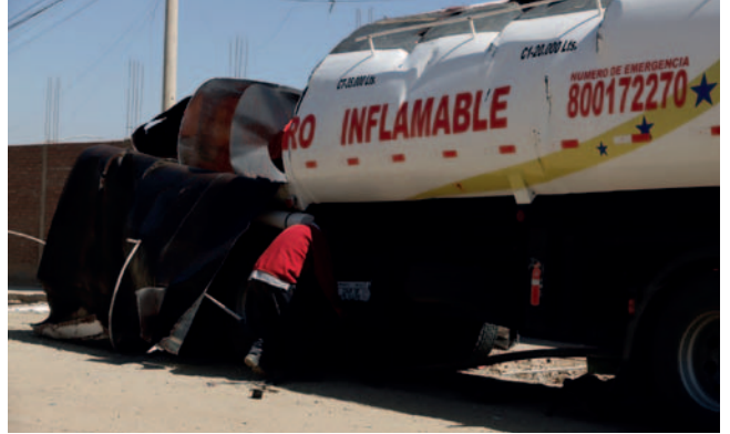
El tanque del cisterna estalló y mató al soldador

El impacto de la explosión fue tan fuerte que dañó el colegio adyacente, rompiendo los vidrios de las ventanas y generando un ambiente de pánico. “Se produjo la explosión de un contenedor, un tanque de un