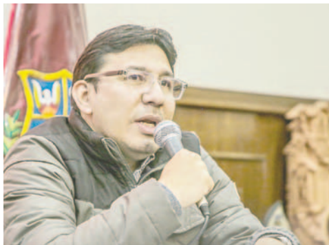
Franklin Molina López ratificó su apoyo a la consulta para la subvención de combustible

Molina aseguró que hay necesidad de reformar las políticas relacionadas con la subvención, ya que son "insostenibles" tanto para el Estado como para los consumidores.