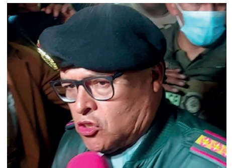
Juan José Zúñiga, excomandante del Ejército