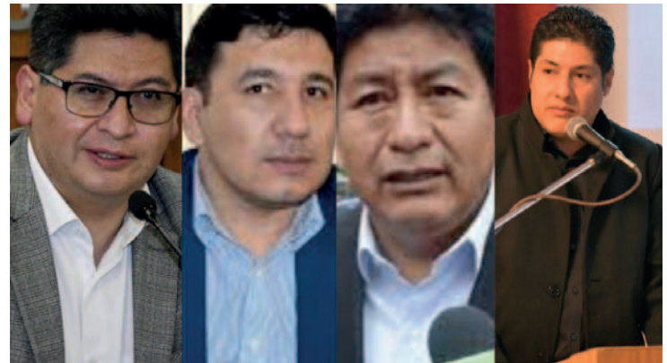
Afines al Gobierno de Luis Arce y opositores piden la destitución de cuatro ministros