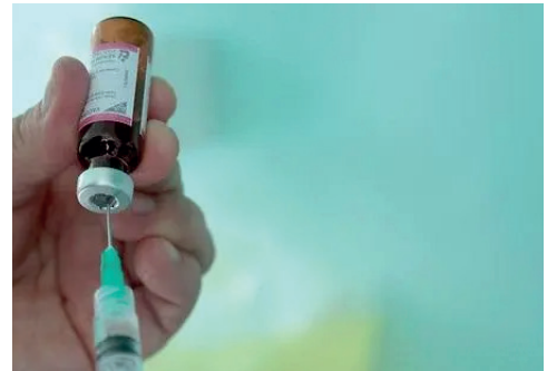
Vacuna contra el sarampión

Según Enríquez, el paciente estuvo en contacto con su hija, quien contrajo sarampión en Estados Unidos a principios de julio, antes de su llegada a Bolivia. Además, participó en un evento social en la colonia Piraí, donde se estima que alrededor de 50