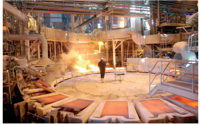
La producción de cobre mejoró respecto al año pasado / PROACTIVO.COM.PE

En particular, el sector minero experimentó un incremento del 21,1% en sus exportaciones a nivel interanual, con envíos que alcanzaron los US$ 4.722 millones. Asimismo, las exportaciones de cobre, principal producto de exportación chileno, aumentaron un 30,8% respecto