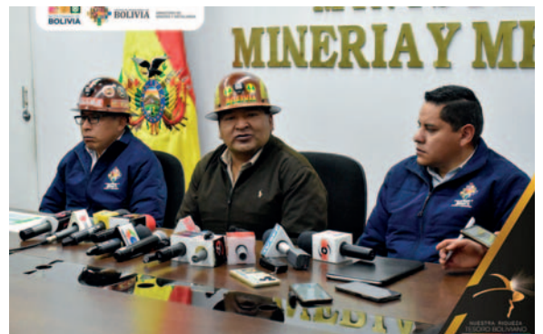
Ministro de Minería, Alejandro Santos (c) /MMVM

La Planta Refinadora de Zinc será instalada en los terrenos de la EMV, ubicada en Vinto, y contará con una capacidad de procesamiento anual de 150.000 toneladas métricas netas secas de concentrados de zinc, con el objetivo de obtener anualmente 65.000 toneladas métricas finas de zinc metálico y subproductos, según un informe institucional.