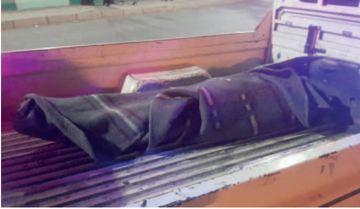
El cuerpo del infortunado peatón fue trasladado hasta la morgue del Cementerio General