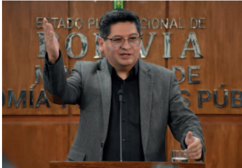
El ministro confirmó el encuentro para el 14 de agosto a las 16:00 horas

“Ya hemos extendido una invitación a la Confederación de Empresarios Privados de Bolivia y a todos sus afiliados para que puedan asistir a una reunión con el primer mandatario este miércoles 14 de agosto a las 16:00 horas