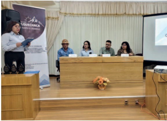
Acto de aniversario de la Fundación Colquechaca

El acto de aniversario estuvo conformado por distintos socios de la Fundación Colquechaca, entre ellos JCI Oruro y la Federación Departamental de Cooperativas Mineras de Oruro, quienes renovaron sus convenios en pleno acto.