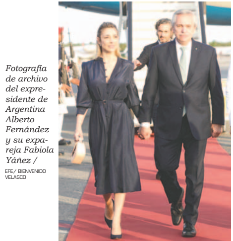
Fotografía de archivo del expresidente de Argentina Alberto Fernández y su esposa Fabiola Yáñez