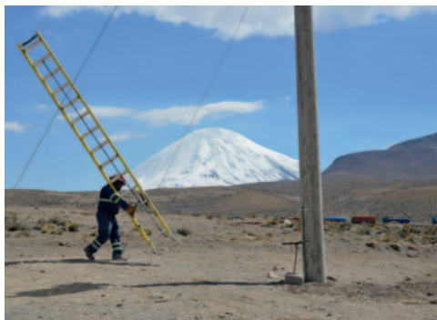
Oruro tiene más del 90% de electrificación /ENDE

(BID) y el Programa IDTR III financiado por el Banco Internacional de Reconstrucción y Fomento (BIRF) son parte fundamental de este convenio para llevar energía a las zonas más remotas del país.