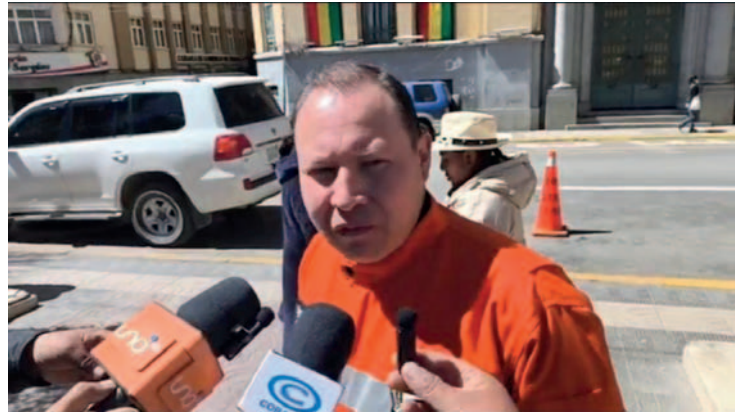
Uno de los voluntarios invitó a los jóvenes a ser parte del Grupo SAR /LA PATRIA

La evaluación práctica se llevará a cabo ese