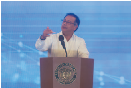
El presidente de Colombia, Gustavo Petro, habla en la "Cumbre Ministerial Latinoamericana y del Caribe por la Inteligencia Artificial: Colombia" este jueves, en Cartagena, Colombia

El mandatario, que intervino en la "Cumbre Ministerial Latinoamericana y del Caribe por la Inteligencia Artificial: Colombia", señaló que es importante tener una discusión filosófica, ética y política sobre