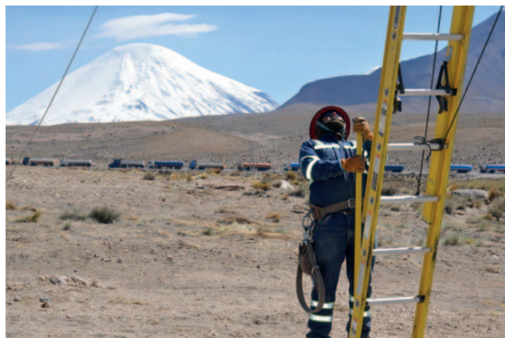
La inversión es superior a los 8 millones de dólares /ENDE