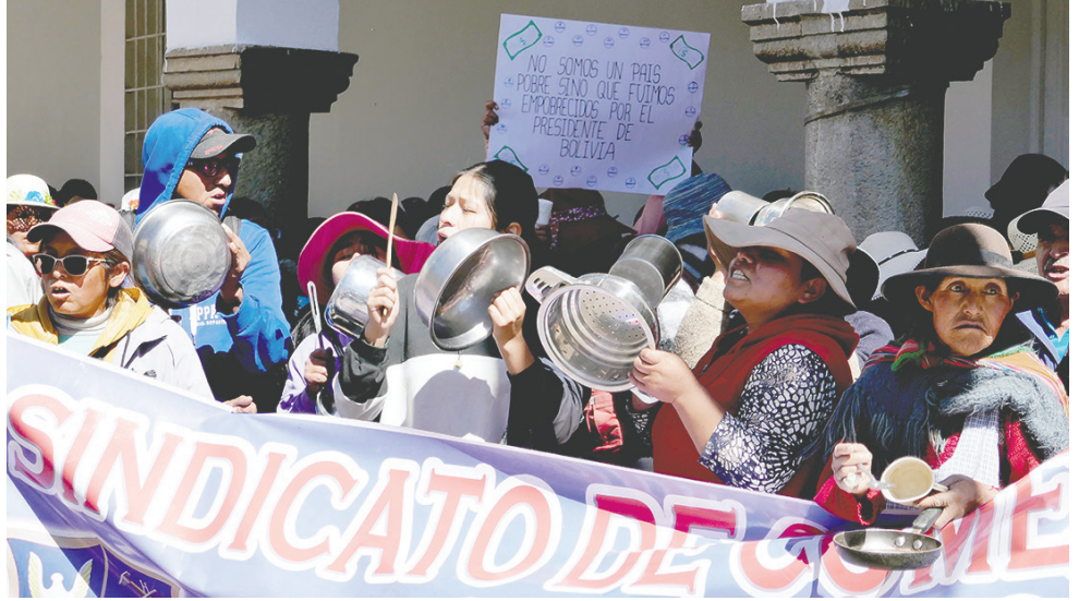
Movilización del sector gremial fue contundente

Asimismo, aseguró que el sector comercial tomará acciones más radicales ante la falta del dólar y la subida de la canasta familiar, además del combustible. Prevé que esto generará un aumento en los precios de los pasajes, lo cual será otro problema más para la población.