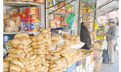
Pan de batalla en Oruro podría producirse en menor cantidad ante incremento de insumos

“La subvención sigue, pero es insuficiente... vamos a mantener el precio del pan a 40 centavos, pero puede haber variación de otros panes, ya sea surtidos, especiales con otros precios comprando harina argentina, el precio del pan de batalla garantizamos, pero el peso no, tampoco el abastecimiento, porque ha empezado a subir todo. Cuáles son los factores que