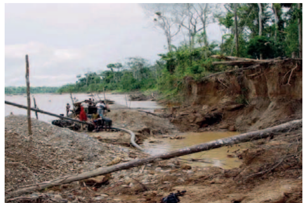
El propósito del Gobierno peruano es que los mineros ilegales modifiquen su actividad económica a algo legal

El alto comisionado subrayó la importancia de ofrecer a las familias una opción legal y sostenible que no solo mantenga sus ingresos, sino que también les brinde estabilidad y tranquilidad. “Muchos piensan equivocadamente