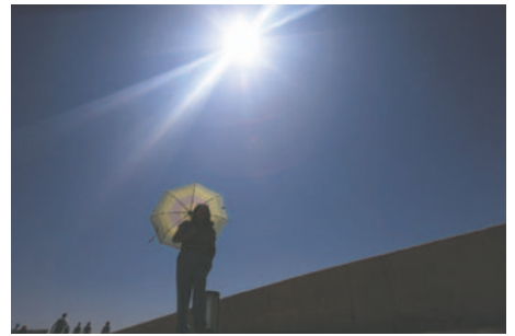
El Servicio de Cambio Climático de Copernicus advirtió que el mes de julio de 2024 es el segundo más caliente a nivel mundial

Fuera de Europa, hubo mayor falta de precipitaciones en el oeste de Norteamérica, el este de Rusia,