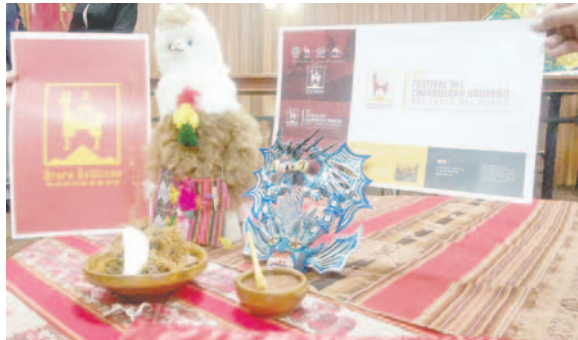
Marca gráfica para la promoción del charquekan orureño

“Lo que se ha tomado en cuenta son los elementos identificativos, históricos de Oruro, se toma en cuenta la cultura aimara,