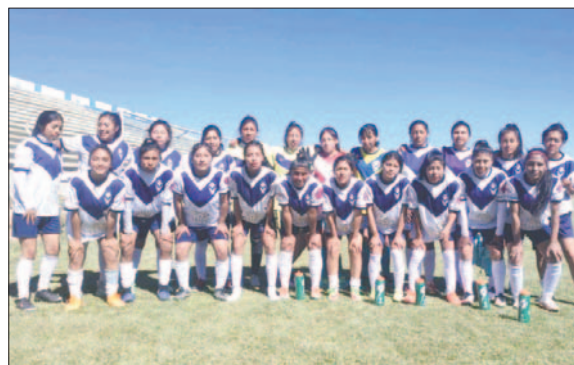
Las chicas de GV San José lograron su primer punto, pero ya no les alcanza

La Comisión Organizadora de Competiciones de la Federación Boliviana de Fútbol (FBF) dio a conocer la reprogramación de los partidos de la décima fecha de la primera fase de la Liga Femenina de Fútbol. En cuanto al grupo "A", en el que se encuentran los equipos orureños, el próximo lunes 12 de agosto, en el complejo "Figaro" de La Paz, The Strongest jugará contra Deportivo Fatic. Mientras tanto, en el complejo Ciudad Satélite, Always Ready será local ante GV San José. Ambos partidos solo servirán para la estadística, ya que con los resultados registrados esta semana, el equipo "millonario" y las "tigresas", aseguraron su pase a la siguiente fase.