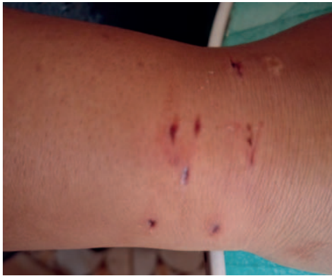
Tres personas fueron mordidas por un gato /SEDES

vacunar a sus mascotas pueden llevarlas a los mismos ambientes del Sedes para que reciban la dosis respectiva en horario de 09:00 a 14:00 horas. Asimismo, se determi-