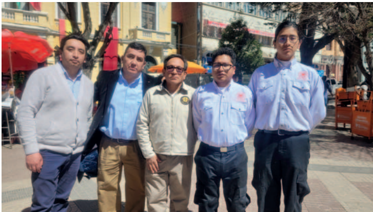
El sábado 10 y domingo 11 de agosto se llevará adelante la campaña gratuita /LA PATRIA