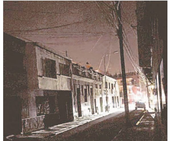
El servicio se reestableció cerca de las 20:51 horas /ENDE según reporte.

Según comunicó ENDE, el servicio fue normalizándose primero en gran parte de la zona afectada a las 19:50 horas y luego de reparar la falla se normalizó el servicio eléctrico en todo el sector ya para las 20:51 horas