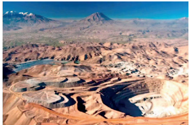
La actual cartera registra un aumento de 2,7% en comparación a lo registrado en el portafolio de julio del 2023

El informe de la Dirección General de Promoción y Sostenibilidad Minera (DGPSM) del Minem destaca que la “Cartera de Proyectos de Inversión Minera 2024” está compuesta por 51 planes que suman una inversión total de US$ 54.556 millones. Se ha registrado un aumento del 2,7% en comparación con el