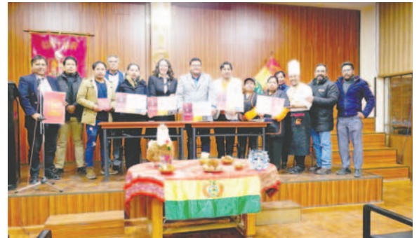
Miembros promotores del Festival

“Lo que buscamos es que se pueda impulsar nuestra gastronomía a través del logo que ha hecho la Universidad Xavier que han sido ganadores, muy hermosa la marca en el que representa nuestra llama, la carne principal del charque y la representación andina de nuestra región,