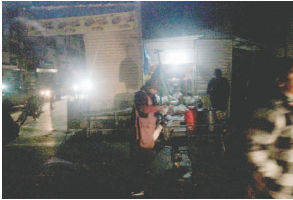
Varias calles céntricas de Oruro estaban a "oscuras"

Según versión de algunos ciudadanos que se vieron afectados por el "apagón", quedaron