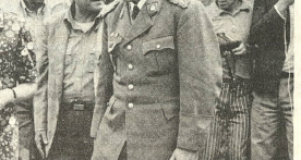
Al acto celebrado en Valle Hermoso, donde la Dirección de Comunicaciones, a través del sistema de "auto escuela", construyó una escuela...