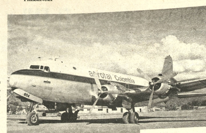
DONACION. Avión DC-4 de línea colombiana, que trajo a bordo la donación de los bolivianos que residen en ese país, para los damnificados de las inundaciones en Cochabamba y el Beni. El avión aterrizó en la base Aérea Militar de Cochabamba transportando 37 cajones de drogas y ropa.

Representantes de instituciones cívicas y autoridades locales, recibieron dicho donativo en el aeropuerto de la Base Aérea Militar, a tiempo de dar la bienvenida a los compatriotas residentes en Colombia, expresaron su reconocimiento y agradecimiento en nombre del