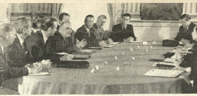
PRIMERA REUNION. Paris 8 (AP).—El nuevo gabinete del gobierno de Pompidou realizó su primera reunión después de ser constituido. Trataron asuntos internos del país y de economía y política internacional.