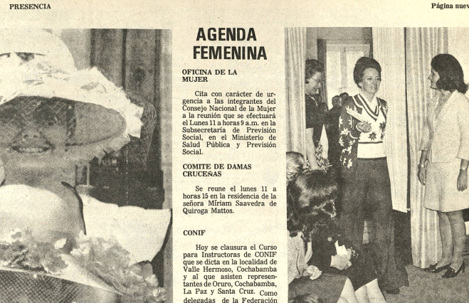
DESFILE DE MODAS Con los auspicios del Club de Damas Americanas tuvo lugar el pasado domingo 2 de marzo en la residencia de la Embajada de los Estados Unidos...

GERENCIA DE ADQUISICIONES La Paz, marzo 8 de 1974