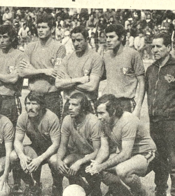
EL CAMPEÓN NACIONAL. Wilsterman se presentará otra vez en el estadio de Miraflores. Sus dorsos llegaron ayer, y se alojan en el Suero.

FONDO La atracción de la jornada de hoy es el partido entre Bolívar y Wilsterman. Los celestes, que cumplieron buena actuación ante Municipal defecaron luego ante La Serena y están con "la sangre en el ojo". Los bicampeones nacionales siempre o casi siempre han caído buena impresión en La Paz, de modo que debe cuidarse en este importante detalle en esta nueva presentación. En resumen, jornada que podría ser exitosa.