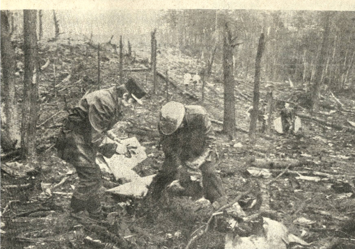
INSPECCION - París 5 (AP). Bomberos y policías continúan sus investigaciones en los escombros del avión toro que se accidentó el domingo y en el que perdieron la vida 244 personas en un bosque cerca de París