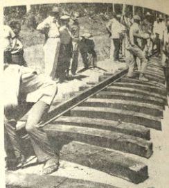
A MANOHE: En la punta de rielos. Los obreros han querido tanta experiencia en el manejo de hierro y aluminos, que su colocación se hace en forma de contramida. Es un trabajo duro y sacrificado. La mayoría de este gentío proviene de las minas y el campo.

pero los medios de transporte dificultan el traslado del producto hasta los ingenios, donde actualmente trabajan en un treinta por ciento de su capacidad, por la falta de materia prima. La oficina distrital del Servicio de Caminos reconoció que gran parte de los caminos de tierra se encuentran inhabilitados por las inundaciones y lluvias persistentes. En los centros de producción se encuentran almacenados miles de quintales de arroz, expuestos a la intemperie y en riesgo de sufrir deterioro por la humedad y la presencia de roedores.