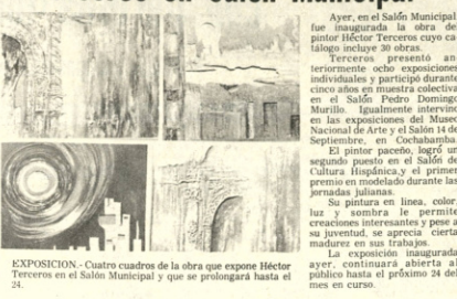
EXPOSICION. Cuatro cuadros de la obra que expone Héctor Terceros en el Salón Municipal de la ciudad.