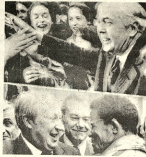
—ELECCIONES.— Londres 17 (AP). - Los candidatos a Primer Ministro de Gran Bretaña, durante la campaña de proselitismo. En la parte superior, Harold Wilson expone al Premier Edward Heath que busca la reelección. Ambos candidatos conversaron con los sectores adictos.

El llamado se hizo después que se produjera un hallazgo de bombas de alto poder en la localidad minera de Lota, a unos 700 kilómetros al sur de Santiago. Un total de 24 bombas, confeccionadas en base a dinamita, fulminantes y mechas, fue encontrado enterrado en un bosque ubicado en el camino a Santa Juana, en el sector denominado La Posada.