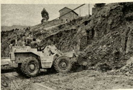
DESPUES DEL DESASTRE. Una pala mecánica de la Municipalidad trabaja limpiando la tierra desprendida de un cerro. Deslizamientos se producen a cada momento, a consecuencia del agrietamiento y alojamiento de la tierra de los cerros. Es frente a este peligro, que la Alcaldía ha movilizado hombres y maquinarias para poner reparos en previsión de nuevos desastres.

- Autoriza un régimen temporal de rebajas en gravámenes aduaneros para la industria manufacturera para maquinarias y equipos. - Se autoriza a la Corporación Boliviana de Fomento la suscripción de un contrato para la provisión de maquinaria que destina a la ampliación del Ingenio Azucarero de Guabirá. - También fueron aprobados por el Consejo de Gabinete, el Estatuto de Organización del Instituto Boliviano de Seguridad Social y Estatuto del Colegio de Odontólogos.