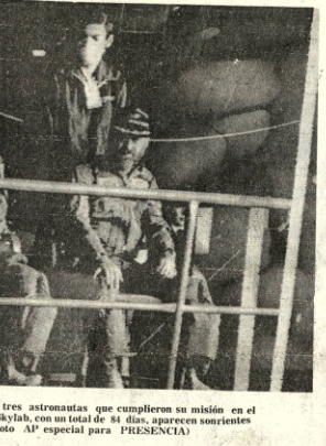
MINIS COMPLETADA. Centro Espacial, 8 (AP). Los tres astronautas que cumplieron su misión en el espacio logrando un récord de permanencia en la nave Skylab, con un total de 84 días, aparecen serios pero sanos.

Volieron a tierra los astronautas Los tres astronautas que cumplieron su misión en el espacio logrando un récord de permanencia en la nave Skylab, con un total de 84 días, aparecen serios pero sanos.