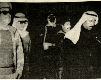
RUMBO A YEMEN: Kuwait, 8 (AP). Nueve terroristas se aprestan a partir rumbo a Yemen del Sur después de dejar en libertad a quince rehenes en Kuwait y Singapur. (Radiofóno AP especial para PRESENCIA.

Ishikawa. "Por el contrario, creo que allanar el camino de una comprensión más profunda de la situación) y por el fortalecimiento de las relaciones entre los países árabes y el Japon". El Japon depende en gran medida del combustible que trae para el funcionamiento de su economía. Otros cuatro rebeldes habian sido dejados en libertad ayer. Todos resultaron ilenos. En cambio, un hombre de Kuwait dijo que tres de los guerrilleros fueron sacados de la embajada en camillas por "sufrir de fatiga". En el aeropuerto, los cinco sulieron al reactor de la línea cuatro terroristas restantes, transportados desde Singapur a insistencia de los ocupantes de la embajada japonesa aquí.