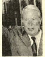
CONFLICTO. Londres, 8 (AP). El Primer Ministro británico Edward Heath no pudo detener la huelga nacional de mineros en Inglaterra...

Los conservadores de Heath esperan ganar votos con el lema de la campaña "¿Qué gobierno Gran Bretaña? El gobierno electo o los sindicatos?". Heath anunció a los simpatizantes de su partido que intenta buscar en su campaña los votos moderados. El Primer Ministro desea identificar al partido laborista de oposición como partidario de los extremistas en el liderazgo del sindicato minero.