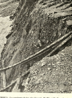
DESTRUCCION DE VIA FERREA. La corriente de los ríos Sarari, Walla y Challa, además de las mazorras, provocaron la casi total destrucción del tendido ferroviario entre Aguas y Cochabamba. Las pérdidas llegan al millón de dólares. El tráfico estará interrumpido por días de un mes.