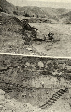
—DESASTRE. En la composición gráfica se observa la magnitud de los desastres, provocados a las vías del trayecto de las mazorras, arrojaron con el tendido, provocando daños en una extensión de 35 kilómetros.

Entre otras donaciones de dinero y materiales, se tiene la de Latices, de Brasil, 10 mil pesos, Cervecería Boliviana Nacional, 20 mil, La Papelera, 6 mil.