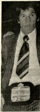
MONZÓN, El campeón mundial de la categoría medio-mediano, Carlos Monzón, haciendo un cinturón mundial en su categoría

El término pertenece al manager neoyorquino Gil Clancy, que gusta de los desayunos oiparros.