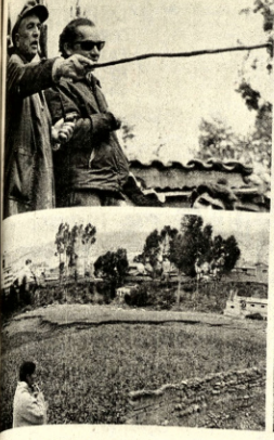
El accidente, que trabajó incansablemente para un niño humano y la desgracia que sobrevino no pudo ser prevista por los desastrosos, el salvamento y la evacuación de las familias. La composición gráfica da idea de la magnitud de la ca-