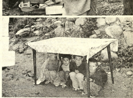
TRAGEDIA. Salvo la actitud del Alcalde de oficiales y soldados del "Ingavi" y miembros de la Policía, no hubo solidaridad humana frente a la desgracia de más de ochenta familias que quedaron sin pan y sin techo. Arriba, un niño paralítico es llevado sobre las espaldas de su madre, en tanto que abajo cuatro niños se protegen de la lluvia debajo de una mesa a la que caudan para que gente inescrupulosa no se la lleve. Ese es el saldo de un desastre, que debiera conmovir a la sociedad paceña.