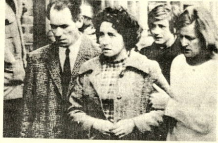
TRIGEDIA.-Hoyes (AP).— Con el dolor en el rostro, estos padres de familia relatan cómo su hijo murió en un accidente ocurrido en el establecimiento escolar donde estudiaba. Radiado AP especial para PRESENCIA