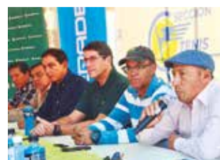
Presentación del torneo de tenis, ayer. HERNAN ANDIA

El tradicional certamen nacional Senior y Súper Senior, que comenzará a disputarse desde mañana en el Country Club Cochabamba (CCC), prevé reunir a más de 200 de-