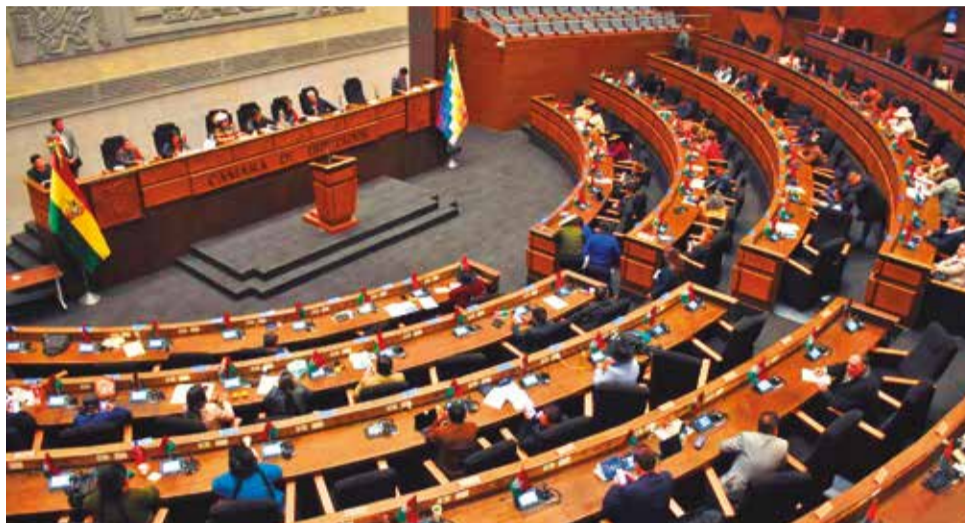
Legisladores sesionan en la Cámara de Diputados, ayer.

Además, los líderes y representantes de organizaciones políticas, así como los representantes de los Órganos del poder público, reafirman su compromiso democrático para la realización de las elecciones generales en los términos y plazos expuestos por el TSE.