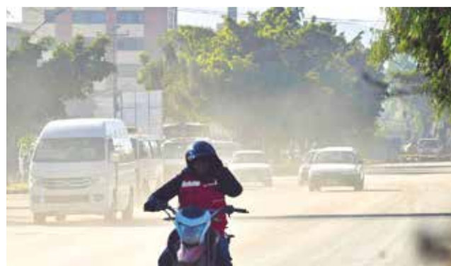
El paso de vehículos por un desvío en la av. Perú.