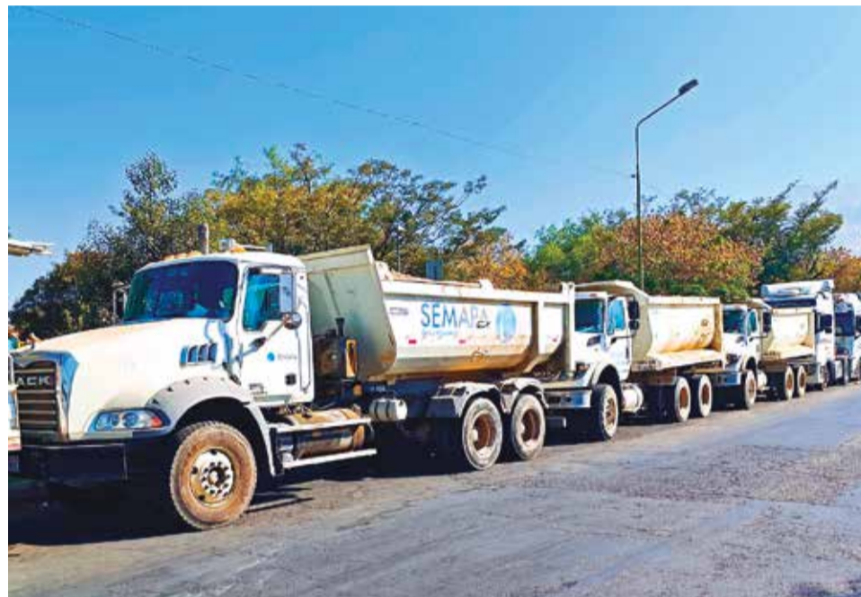
Vehículos de Semapa hacen fila por diésel en una estación de servicio. SEMAPA

MULTIMEDIA: Use el QR para ver el video del gerente de Semapa. www.lostiempos.com