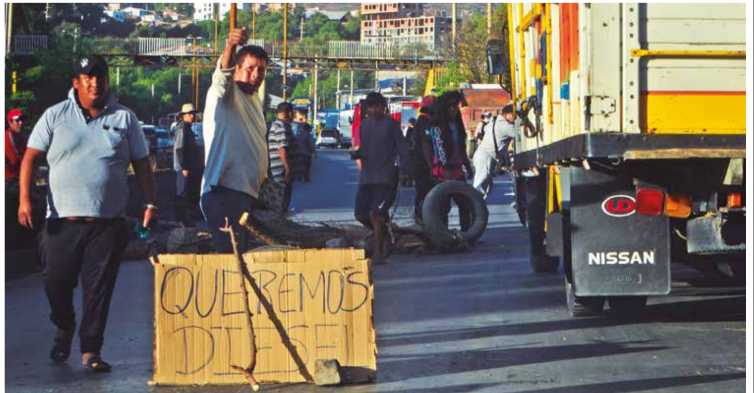
Transportistas realizan un bloqueo y protestas en una ruta de Cochabamba. DANIEL JAMES

Escasez. Son 88 millones de litros en espera. El transporte pesado insiste en su medida, que ayer paralizó cinco regiones y a la que hoy se sumarán los sindicatos. Págs. 6-7