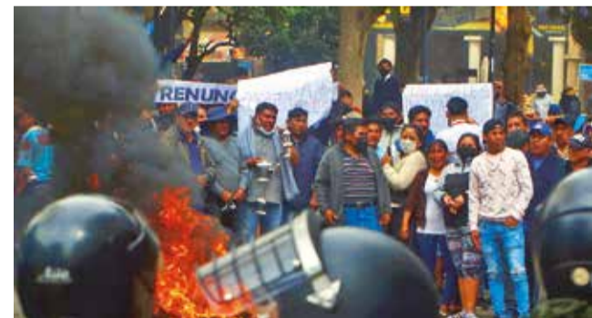
Protestas en Sacaba por un caso de acoso político. D.JAMES

Estudio. El 29 por ciento de los casos revisados corresponde a denuncias de acoso político y el 71, a violencia política