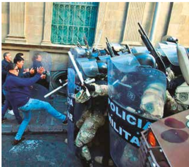
Militares en la toma de la plaza Murillo el 26 de junio.

La comisión solicitará a los organismos internacionales, como la Relatoría Especial de las Naciones Unidas sobre In-