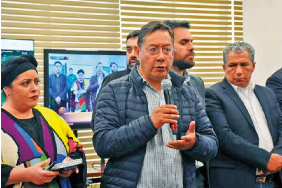
El presidente Luis Arce explica el operativo para abastecer de diésel, ayer.

La autoridad invitó a los dirigentes de los diferentes sectores del transporte a sumarse a la delegación gubernamental para constatar in situ la descarga de combustibles.