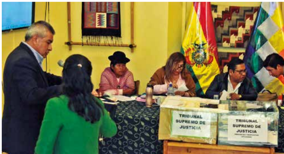
Postulantes a Magistrados dan su examen oral ante la Comisión de Constitución.

En elecciones judiciales, la población elegirá a 23 magistrados de los tribunales Supremo de Justicia (TSJ), Constitucional (TCP) y Agroambiental (TA), y tres miembros del Consejo de la Magistratura (CM). Desde el Tribunal Supremo Electoral (TSE) ratificaron que se recibirán listas bien elaboradas de los candidatos a los altos cargos del TCP y del Órgano Judicial. En el caso del TCP y del TSJ, las listas se recibirán por departamento y contemplando criterios de equidad e inclusión indígena.