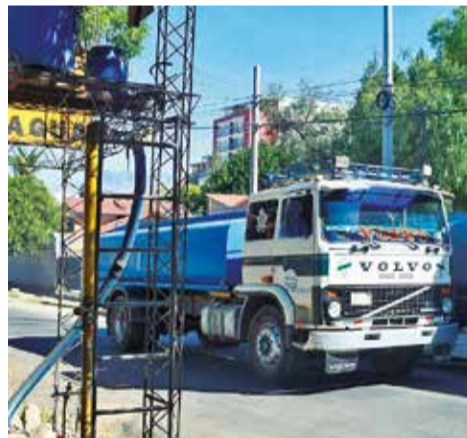
El carguío de las vertientes a las cisternas que llevan agua al sur. CARLOS LÓPEZ