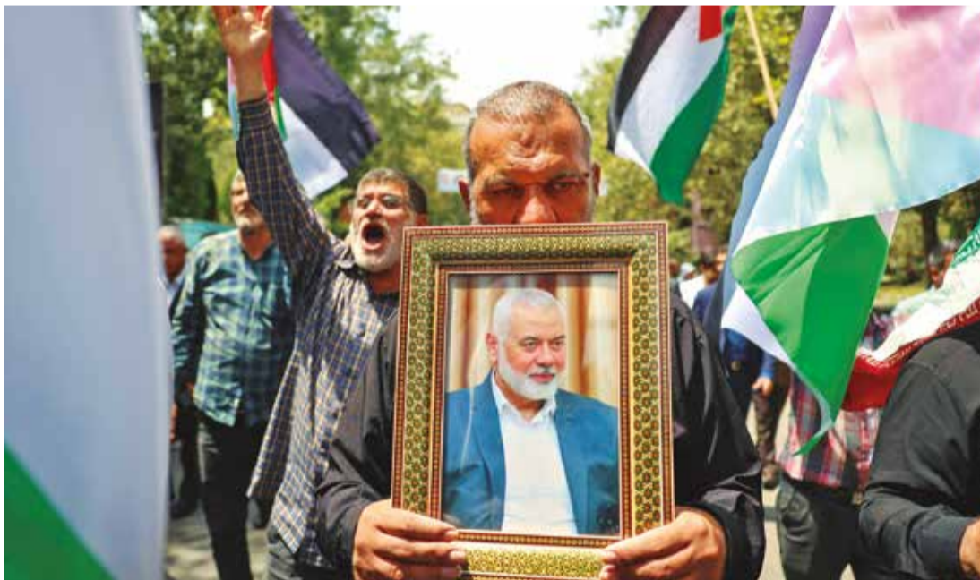
Simpatizantes del grupo Fundación Palestina participan en una protesta tras la muerte del líder político de Hamas.

Conflicto. El ataque que mató al cabecilla del grupo terrorista palestino fue atribuido a Israel y podría escalar la tensión de este último país con Irán y afectar las negociaciones de alto el fuego en Gaza