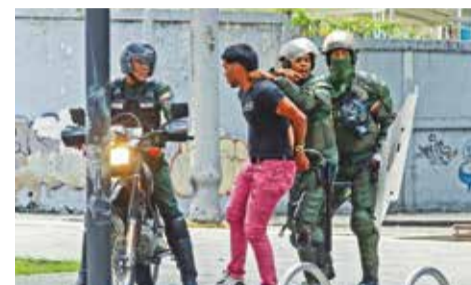
Integrantes de la Guardia Nacional Bolivariana detienen a un manifestante opositor.

actas digitalizadas de los comicios. Según sus datos, Edmundo González obtuvo el 67% de los votos (7,1 millones de votos) mientras que Nicolás Maduro quedó en segundo puesto con el 30% (3,2 millones). Esto contradice lo asegurado por el CNE, que afirmó que el mandatario fue reelecto con el 52% de los votos.