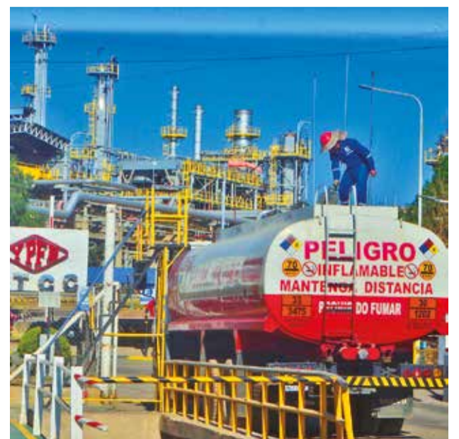
Instalaciones de YPFB, en Valle Hermoso. DANIEL JAMES

“Normalmente, cada día despachamos 980 mil litros de gasolina y hemos adicionado 300 mil litros más, debido a la sobredemanda”, aseguró, antes de recordar el riesgo que tiene almacenar ese combustible “muy inflamable” en casa.