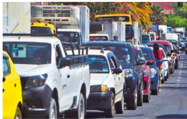
Las filas continúan en surtidores.