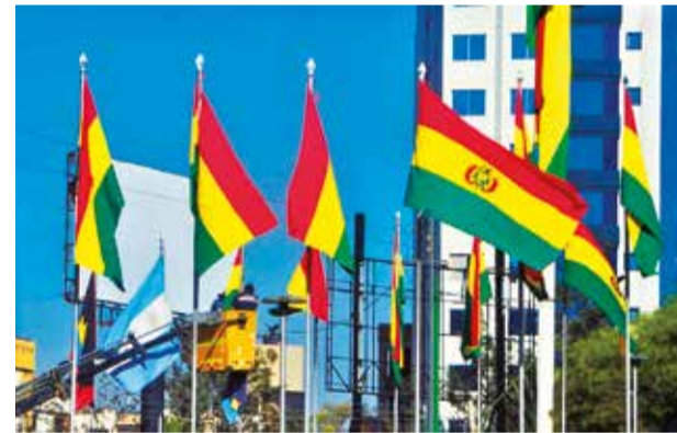
La tricolor en la Plaza de Las Banderas. DANIEL JAMES

Explicó que si los bloqueos se concentran en los surtidores se mantendrá la modalidad presencial. Asimismo, en las regiones donde no hay protestas las clases serán en las aulas.