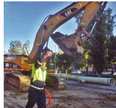
Parte de la maquinaria afectada por falta de diésel en obras de la Alcaldía. JOSE ROCHA