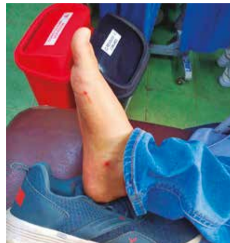
El pie del oficial herido.