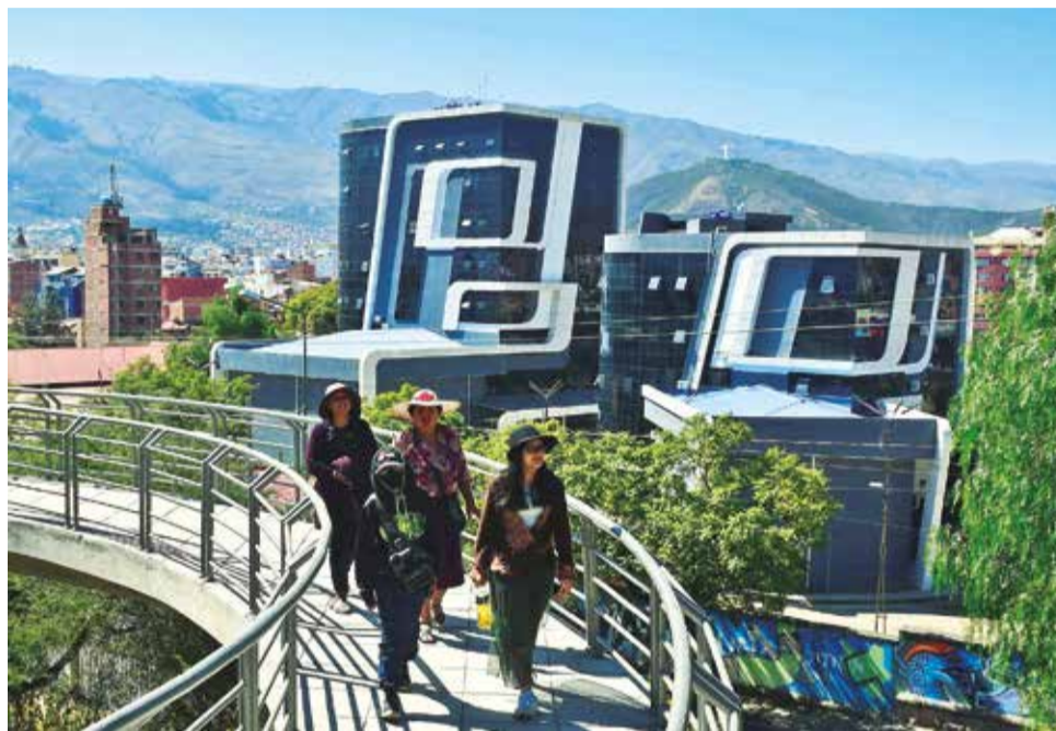
Los edificios de la sede de la Gobernación en ex-Cordeco. CARLOS LÓPEZ

Siles subrayó que un cierre tendría consecuencias graves, como la paralización de grandes proyectos y la falta de