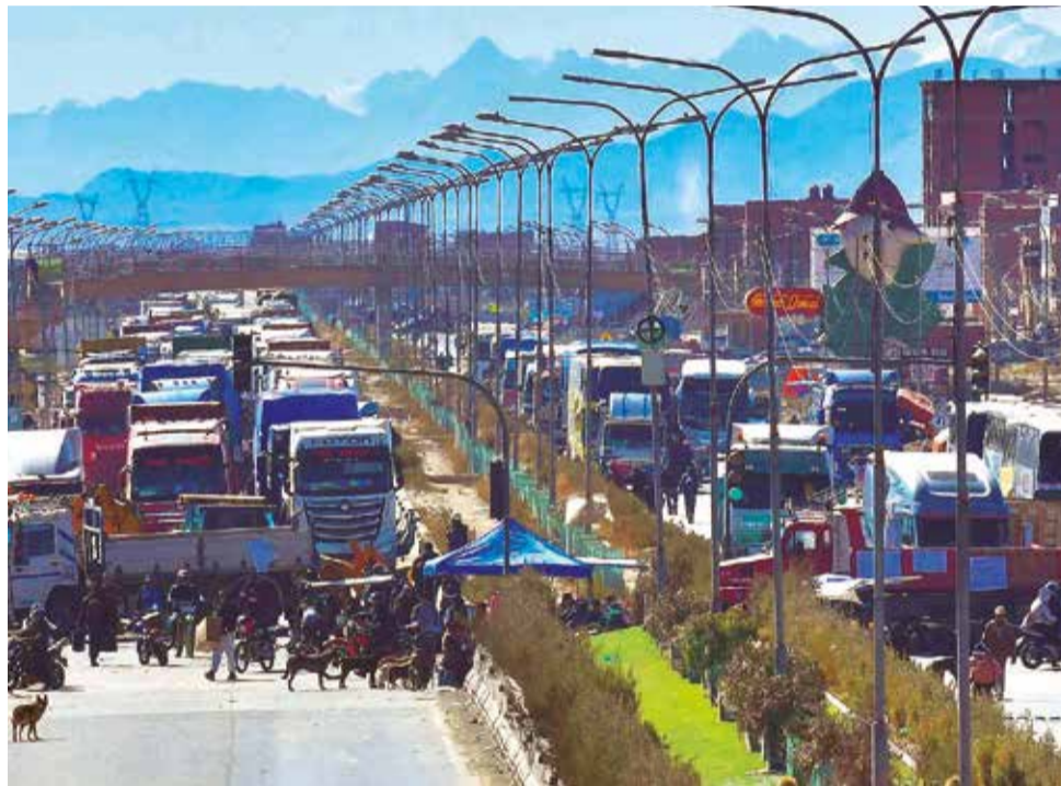
Uno de los puntos de bloqueo en la carretera Cochabamba - Oruro.

El ministro de Economía y Finanzas Públicas, Marcelo Montenegro, esperó a los dirigentes del transporte pesado a las 10:00 de ayer en su despacho, conforme a la invitación que les había hecho un día antes. Sin embargo, éstos no se