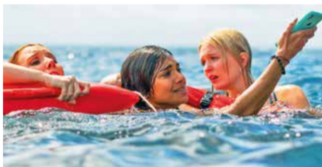
Fotogramas de las películas.

co para crear su propio mundo lleno de aventuras y fantasías. Desde un dragón custodiando un árbol hasta un océano con un velero, la película explora el poder de la imaginación y reflexiona sobre la realidad y la ilusión, ofreciendo una experiencia visualmente rica para todas las edades.