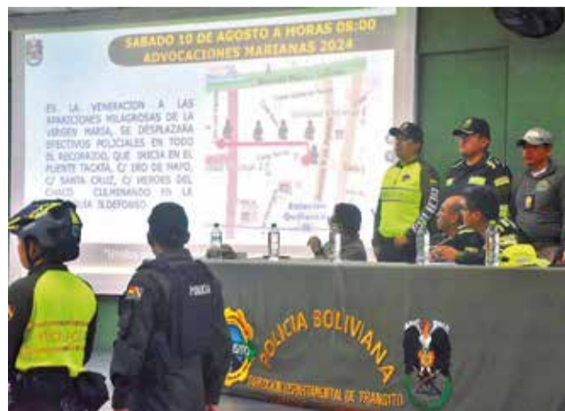
La Policía muestra el trabajo que hará en Urkupiña. JOSÉ ROCHA

En total, 1.800 policías brindarán seguridad a los feligreses durante el desarrollo de la fiesta de la integración, y se pone a disposición 29 vehículos, entre patrullas y ambulancias,