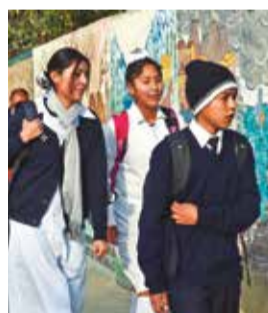
Escolares llegan a clases. CARLOS LÓPEZ