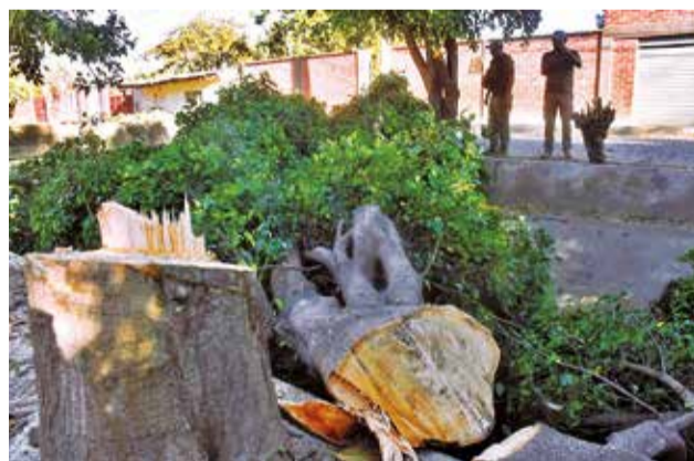
Los árboles talados en el canal de Linde, en junio. J.ROCHA

En la denuncia, respaldada por videos, fotografías y otras pruebas documentadas, Siles acusó al Alcalde de ser el principal responsable de la tala, alegando que los actos se realizaron debido a presuntos “compromisos políticos” con los regantes. “Ha habido denuncias y contradenuncias y no se ha llegado a definir nin-