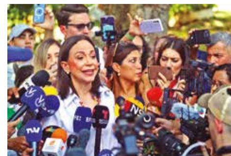
La líder de la oposición María Corina Machado hace declaraciones a la prensa.