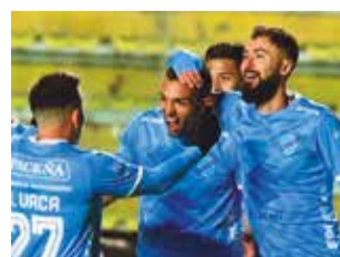
Festejo de los jugadores de Bolívar.

a los 9'PT con el gol de Bruno Savio, tras un pase a ras del piso de Patricio Rodríguez.