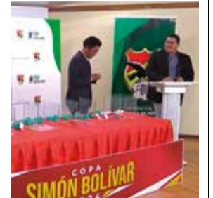
Sorteo de la Copa Simón Bolívar, anoche.