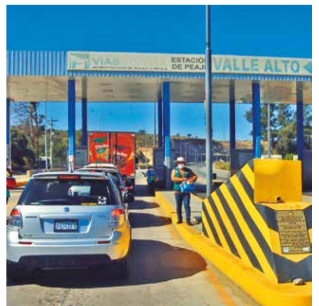
Un punto de cobro de peaje de Vías Bolivia. DANIEL JAMES

Se espera para este sábado el arribo de diésel desde el puerto de Sica Sica, en Arica, y desde el martes venidero estará ingresando al mercado nacional al menos 100 cisternas cargadas de diésel importado de Paraguay y Perú.