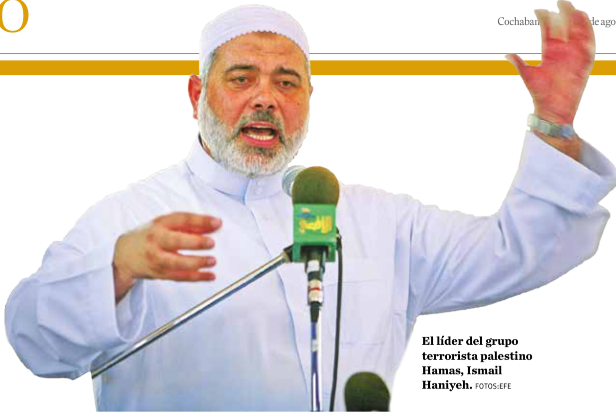
El líder del grupo terrorista palestino Hamás, Ismail Haniyeh.

Haniyeh fue asesinado alrededor de las 2:00 (hora local) del miércoles, según informaron los medios iraníes. Se encontraba en "una residencia especial" para veteranos de guerra en el norte de Teherán, la capital iraní.