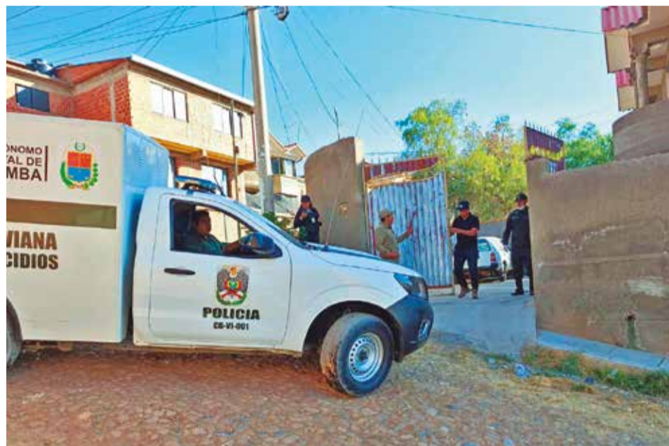
La Policía realiza el retiro del cadáver del ciudadano chileno.

De manera preliminar, se informó que en el departamento que alquilaba la pareja de extranjeros se encontró marihuana; por ese motivo, la Fiscalía convocó a los investigadores de la Felcn.