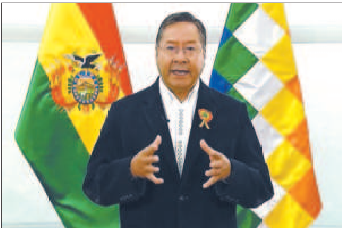
El presidente Luis Arce durante el mensaje de anoche por Bolivia TV.

Añadió que se perfila ampliar la presencia boliviana en el continente y países que graviten en la nueva configuración del orden mundial, como los Brics. “Tenemos un compromiso de cuidar nuestro Estado”.