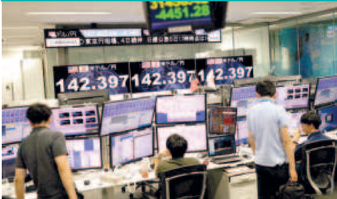
El mayor hundimiento de la bolsa en Tokyo.