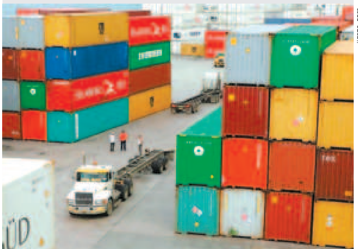
Contenedores de exportación.

MILLONES DE DÓLARES es el valor de las exportaciones de Bolivia durante junio.