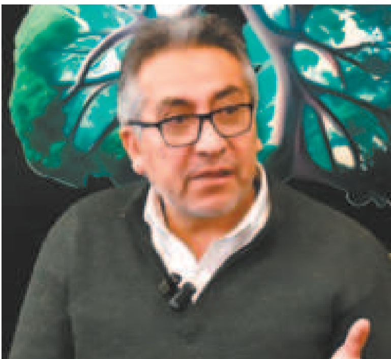
El viceministro de Gestión Gubernamental, Gustavo Torrico.