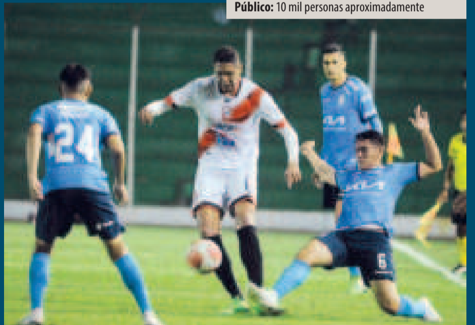
Una incidencia del cotejo disputado entre Blooming y Nacional Potosí, en el estadio 'Tahuichi' Aguilera.

Ciudad: Santa Cruz Estadio: 'Tahuichi' Aguilera Árbitro: Javier Revollo (Oruro) Asistentes: Juvenal Villca y Teddy Villarroel Público: 10 mil personas aproximadamente