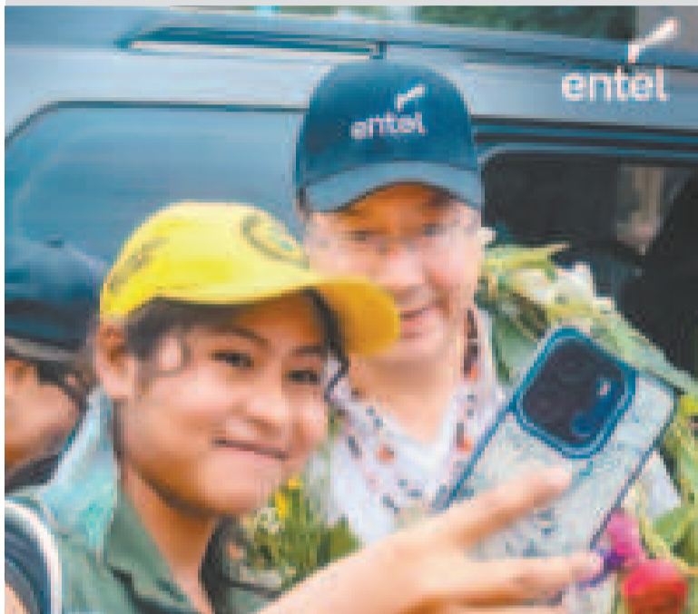
El presidente Luis Arce en un acto de Entel.