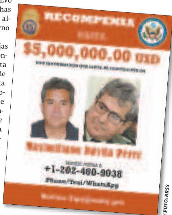
La DEA ofreció en su momento una recompensa de $us 5 millones.

Nadie se explica cómo él, quien era un mayor de la Policía, se convirtió en uno de los más grandes traficantes de cocaína en la región. Se le señala del envío de por lo menos 100 toneladas y miles de armas a Estados Unidos.