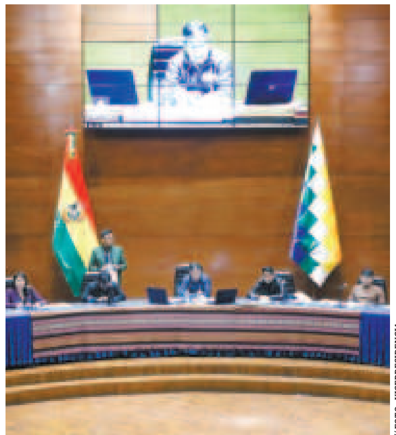
El vicepresidente y presidente nato de la Asamblea, David Choquehuanca.