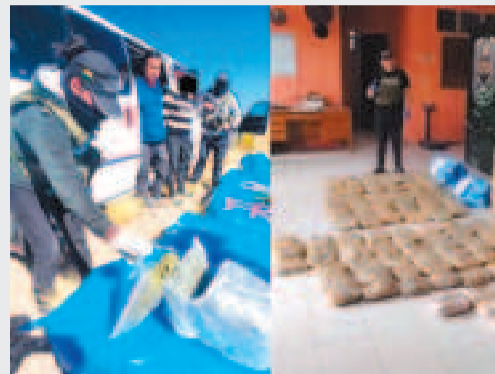
Efectivos muestran la marihuana incautada en los operativos.

"En la revisión del remolque se encontraron ocultos entre los sacos de cloruro de potasio dos bolsas de yute azules y cajas de cartón que contenían paquetes de distintas formas. Realizada la prueba de campo, dio positivo a marihuana", informó.