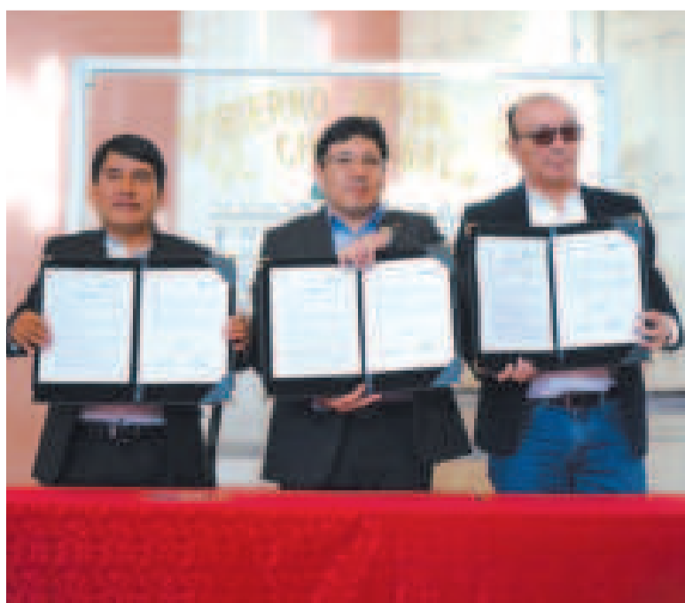
El ministro Molina (centro) junto a autoridades de ENDE y de la Gobernación de Chuquisaca.

La inversión no requerirá contraparte departamental ni municipal.