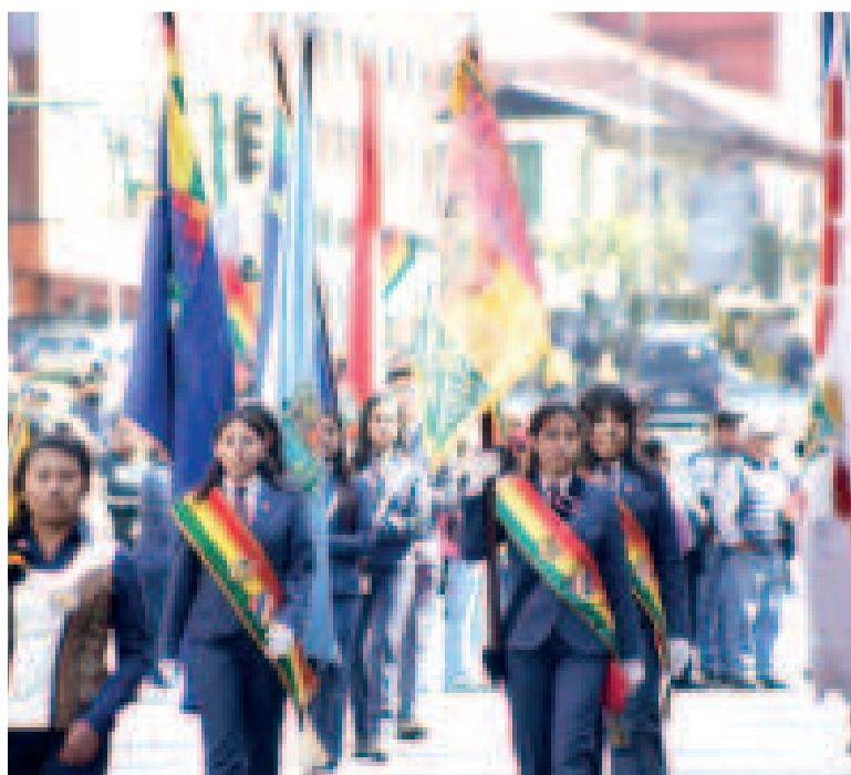
Estudiantes protagonizan los desfiles cívicos en la ciudad de La Paz.