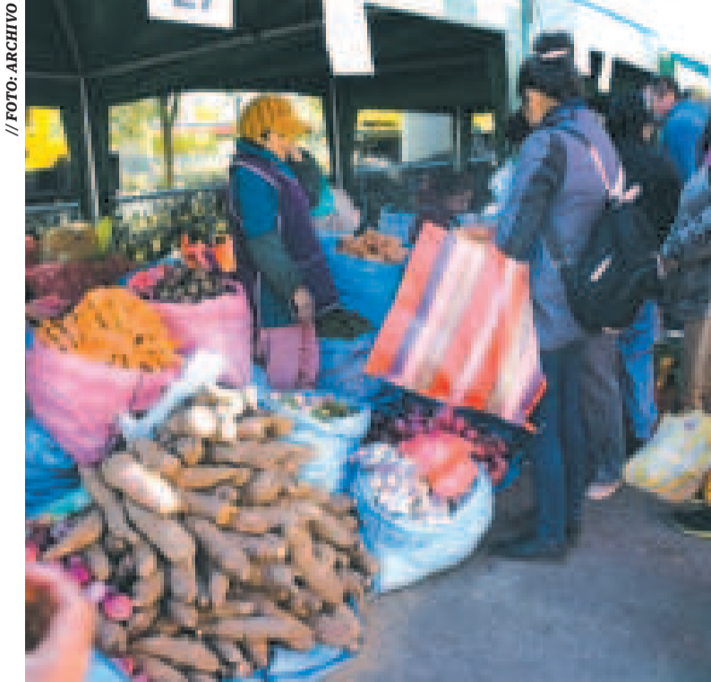
Un mercado de abasto en La Paz.