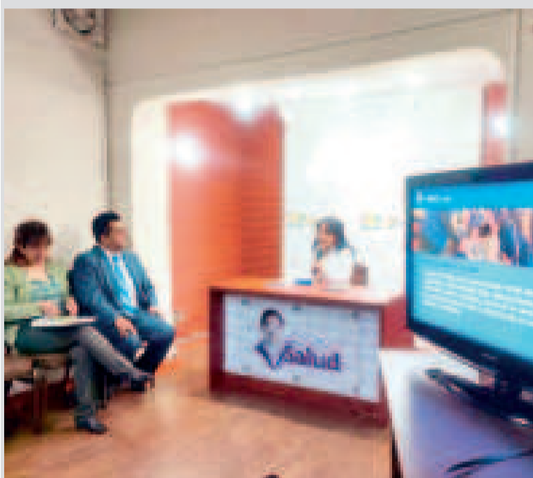
Autoridades del Ministerio de Salud durante la presentación del documento.