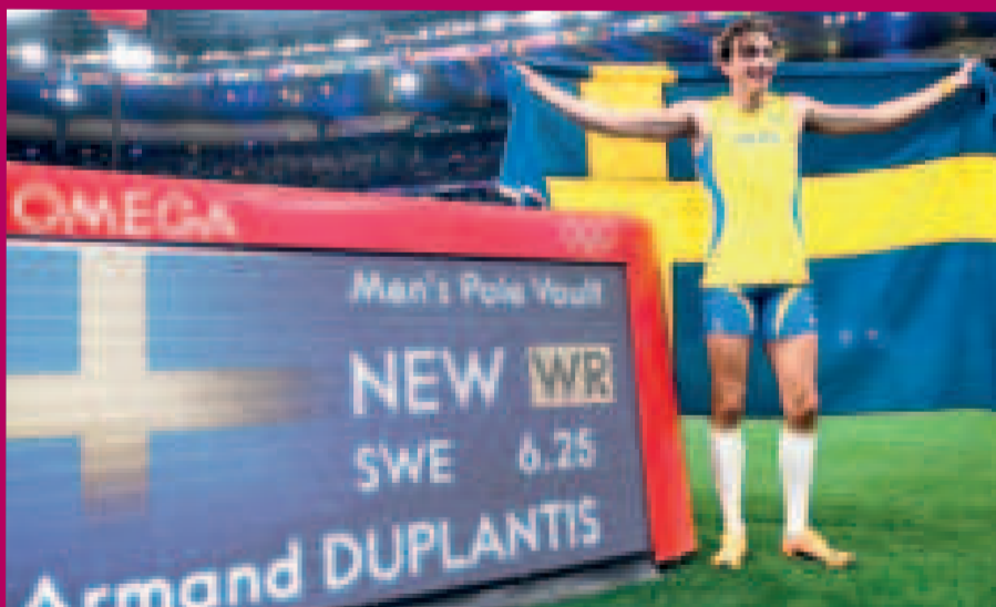
El atleta sueco Armand Duplantis posa junto a su nueva marca.

Duplantis, de 24 años y conocido como 'Mondo', inició la jornada con una seguidilla de saltos impecables que lo llevaron a asegurar fácilmente el oro. Ya con el primer lugar garantizado, el atle-