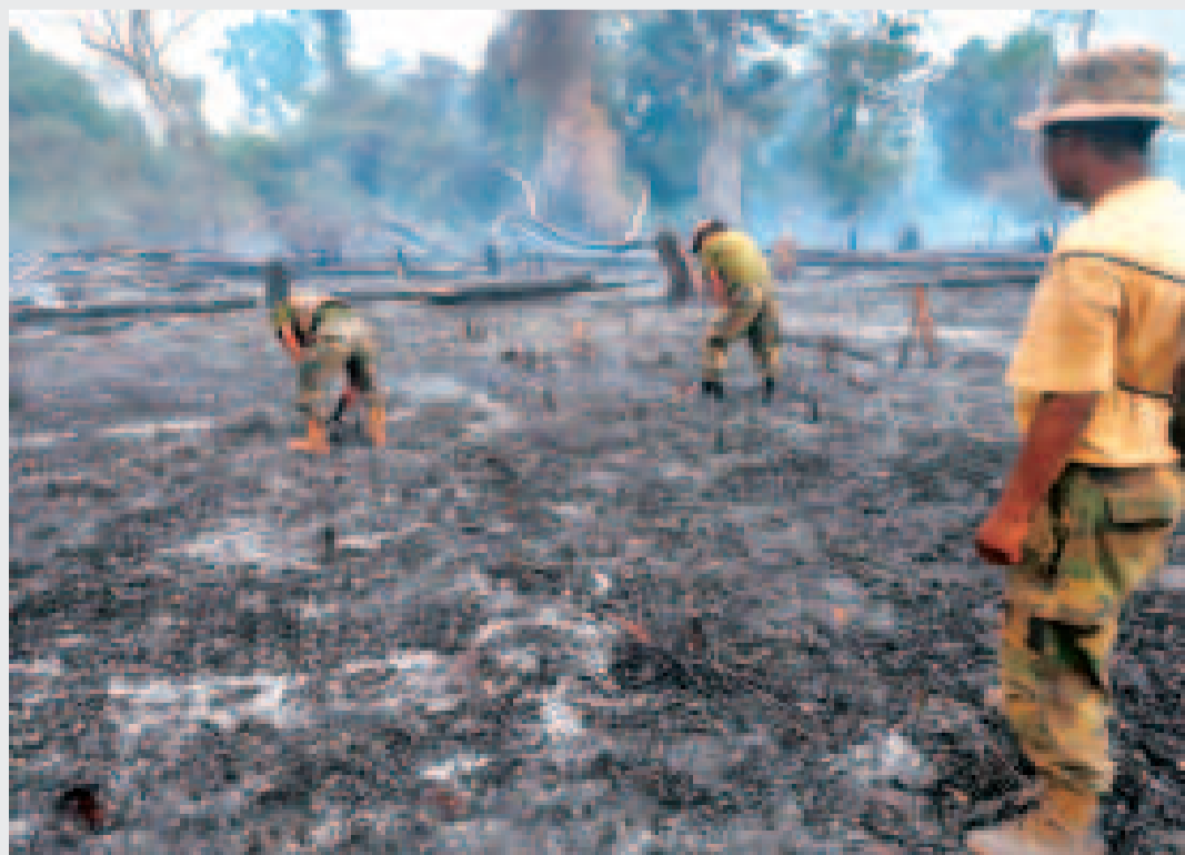
Más de 1.000 bomberos forestales y de las Fuerzas Armadas trabajan en las zonas afectadas.

Luis Arce Catacora Presidente de Bolivia