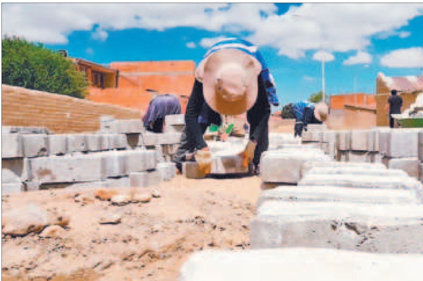
Obreros en una obra de enlosetados.

Entre los proyectos paralizados están obras viales destinadas a cinco regiones, generación de empleo, recursos dirigidos a combatir la crisis climática y otros.