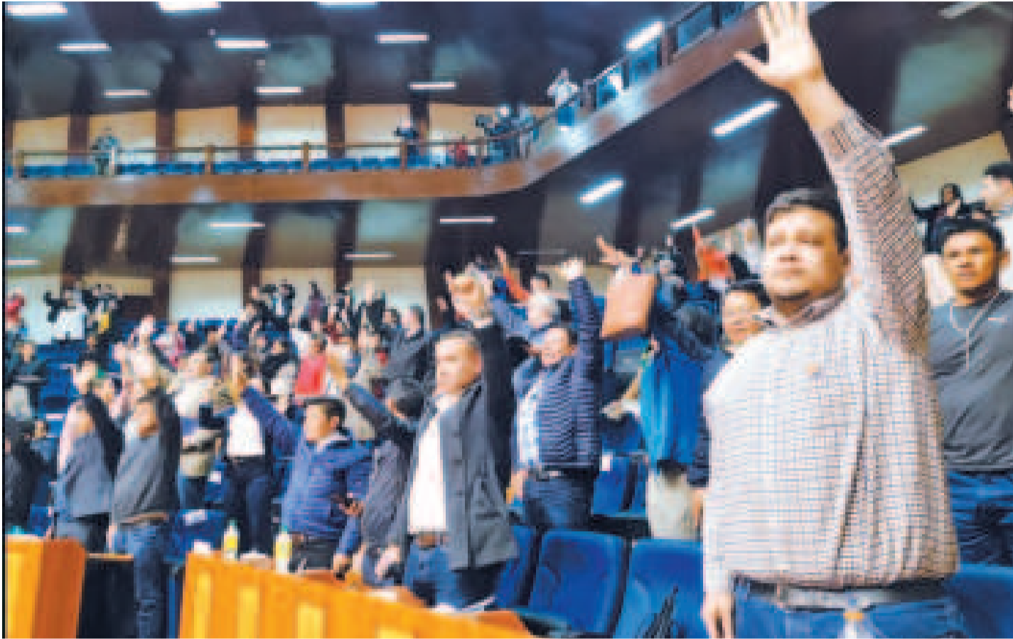
Asambleístas aprueban informes y listas de candidatos para las elecciones judiciales.