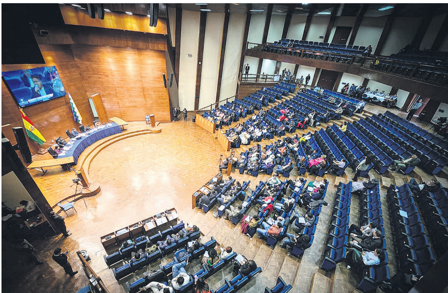
La Asamblea Legislativa se reunió ayer en el Centro de Convenciones, ubicado a unos seis kilómetros del centro de la ciudad de Sucre

Varias autoridades políticas y académicas ya están en la capital, donde se concentrarán los actos oficiales en conmemoración por los 199 años de la independencia de Bolivia. En horas de la mañana de ayer, se desarrolló un desfile cívico militar, debido a que hoy, la Asamblea Legislativa sesionará en la Casa de la Libertad para recibir el informe del presidente Luis Arce.