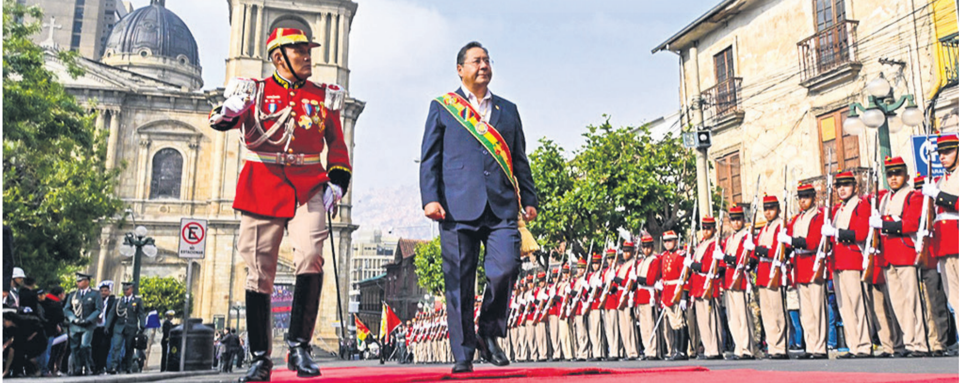
El presidente Luis Arce será el protagonista principal de los actos por la celebración de los 199 años de independencia de Bolivia, en la capital, Sucre

Es el mensaje que dejaron en claro cinco líderes opositores hacia el jefe de Estado. Exigen un discurso que no busque excusas, ni responsables por la situación actual de Bolivia. Proponen cambio de modelo económico