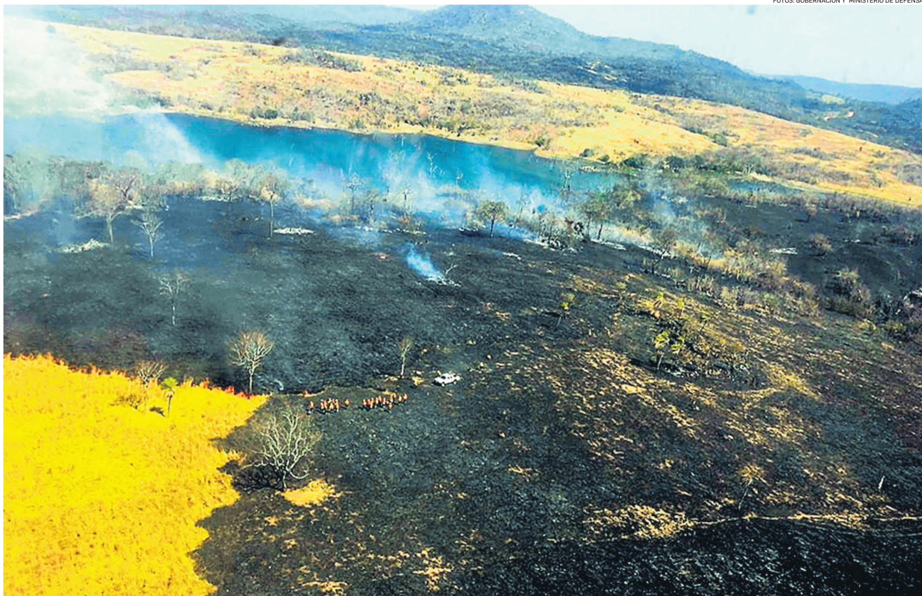
EL ANMI San Matías y otras zonas de este municipio son afectadas por las llamas desde hace un mes. El Gobierno desplazó ayuda para combatir el fuego por tierra y aire