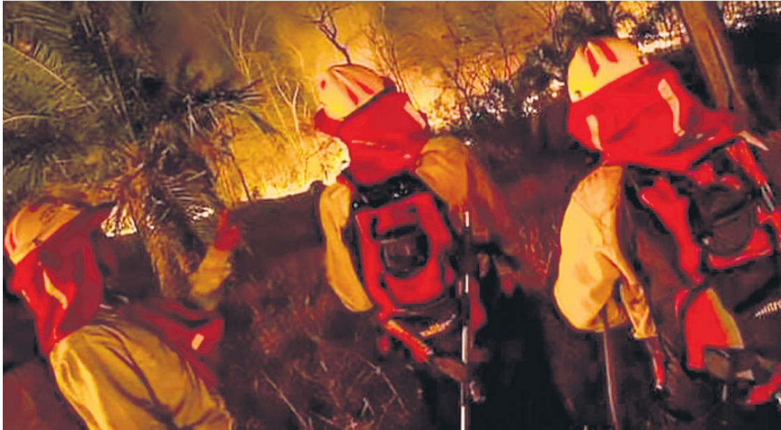
Los que están en primera línea se enfrentan a grandes incendios. Priorizan el resguardo de comunidades.