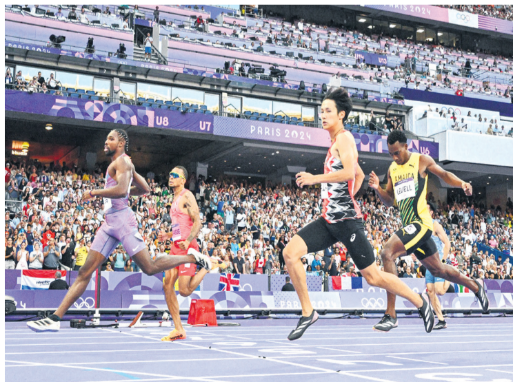
Lyles se pasó en las clasificatorias de los 200 m. Mañana es la semifinal y jueves la final