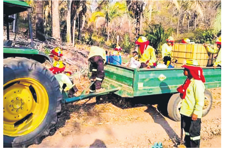
Bomberos trasladan agua hasta los lugares de incendio, como ocurre en los municipios de San Javier y Concepción.