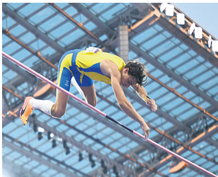
Récord mundial de Armand Duplantis en salto con garrocha. Sigue siendo el dominador

PARA APLAUDIR Andrade en plena acción. Demostró que es una gimnasta de primer nivel; ganó el oro