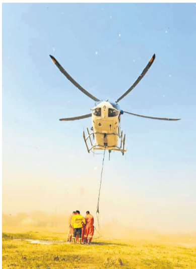
Las operaciones se refuerzan con el ataque del fuego desde el aire.