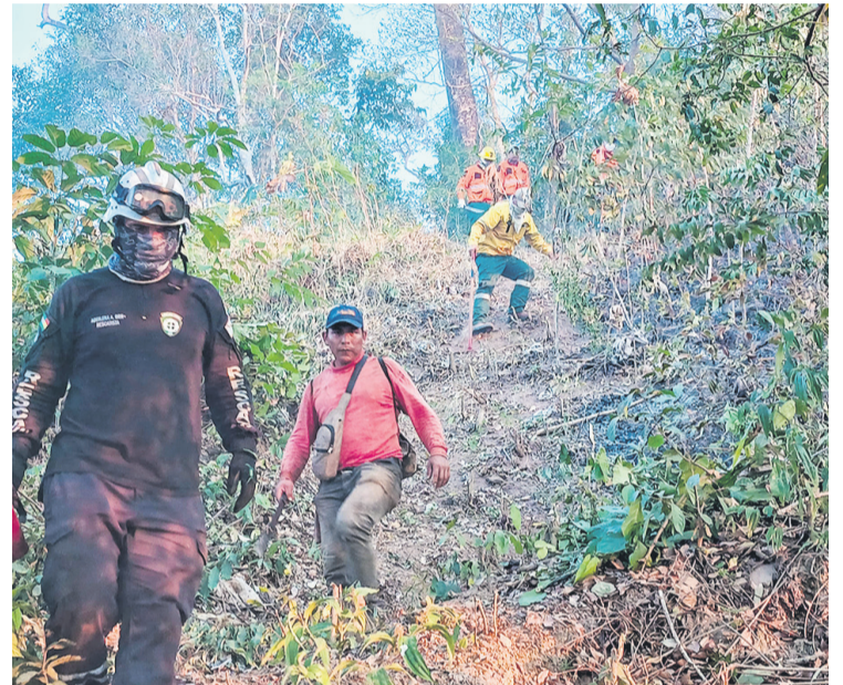
Brigadas comunales, voluntarios y militares forman parte de los equipos que se trasladan a combatir los incendios.