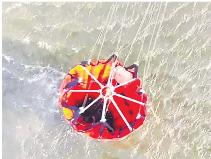
Defensa Civil realizó descargas en la zona de la comunidad Candelaria, en el segundo día de tareas en San Matías.