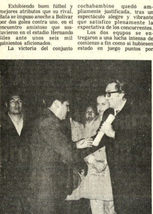
Conjunto de Bata, cuya actuación satisfizo plenamente la expectativa de los aficionados. Cuenta con valores que pueden brindar muchas satisfacciones. Anoche expuso buen fútbol y ganó merecidamente a Bolívar por dos goles contra uno.