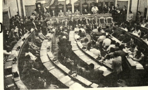
AMPLIADO CAMPESINO.- Cerca de 300 delegados participan en el III Ampliado Nacional...