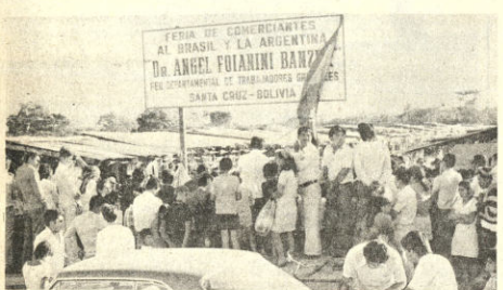
COCHABAMBA. Los comerciantes que operan regularmente con mercaderías de la Argentina y el Brasil, acaban de inaugurar un campo de ferias ubicado en la zona Oeste de la ciudad, casi sobre la avenida al río Piray. El año se cumplió este fin de semana con la asistencia de varias autoridades. Lleva el nombre del doctor Ángel Folandini. Anteriormente, estos comerciantes estaban asentados en Barrio Lindo, de difícil acceso debido a las calles intrasitables. Existe proyecto de realizar modernas construcciones. La foto muestra una vista general de la feria.

La Corporación de Desarrollo de Oruro, en forma