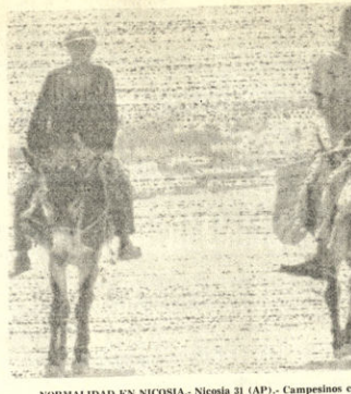
NORMALIDAD EN NICOSIA. Nicosia 31 (AP). - Campesinos chipriotas arrian sus malas ceras de Nicosia hoy al volver a la normalidad de la vida sept. después de firmados los acuerdos de paz en Ginebra. Muchas cosechas se arruinaron al estallar la guerra.