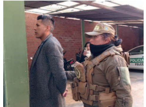
Efectivos policiales ejecutan orden de aprehensión contra el influencer