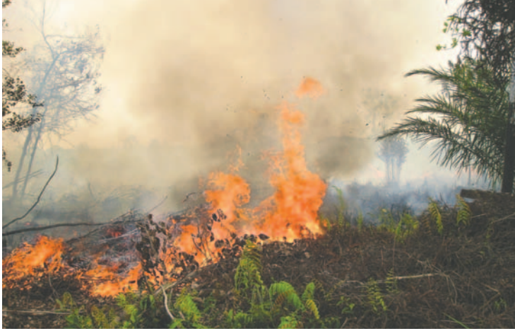
Bosques en Indonesia se queman