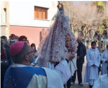
Desde el atrio de "La Catedral", la Virgen de la Asunta bendijo a Oruro

Mientras que para el 15 de agosto, el Día de la Asunción, la Iglesia celebrará la solemne eucaristía de fiesta, que será presidida por el Obispo a las 19:00 horas.