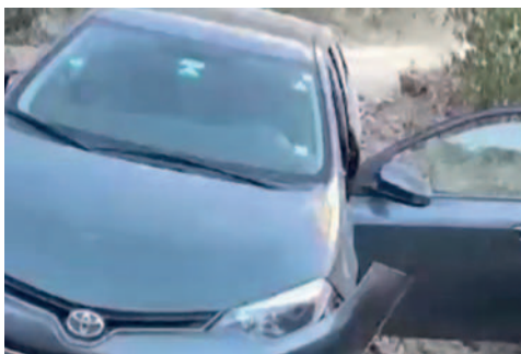
El hombre fue visto por última vez la mañana del lunes 15 de julio cuando salió de su vivienda a bordo de su vehículo particular

El médico fue visto por última vez la mañana del lunes 15 de julio cuando salió de su vivienda a bordo de su vehículo particular. La única pista que tenía la familia era una carga de combustible