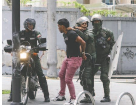
Integrantes de la Guardia Nacional Bolivariana detienen a un manifestante opositor, el martes, en Caracas (Venezuela)

Saab no se refirió a los manifestantes lesionados, quienes fueron repelidos con gases lacrimógenos y perdigones usados por la fuerza pública, según constató EFE en Caracas. En cambio, acusó a algunos de delito de simulación (de muertes) y a la difusión de mensajes que causan zozobra y pánico a la población. Maduro denunció que está en marcha un intento de golpe de Estado de carácter fascista, en vista de los cuestionamientos a su reelección, que fue rechazada por la oposición mayoritaria y buena parte de la comuni-