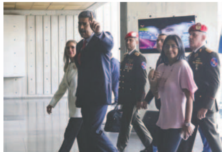
El presidente de Venezuela, Nicolás Maduro, saluda a su llegada al Tribunal Supremo de Justicia (TSJ) este miércoles, en Caracas (Venezuela)

El mandatario hace esta solicitud después de dos días de protestas en varias regiones del país contra su anunciada reelección, toda vez que la principal coalición oposi-