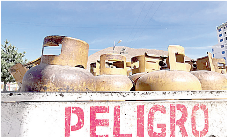
Desde el lunes no se hizo despachos de GLP en Oruro

Desde YPFB aseguraron que el GLP y gasolina están garantizados, pero que el producto no puede salir de la planta San Pedro. Por su parte, transportistas aseguraron seguir con la medida hasta que se garantice el diésel.