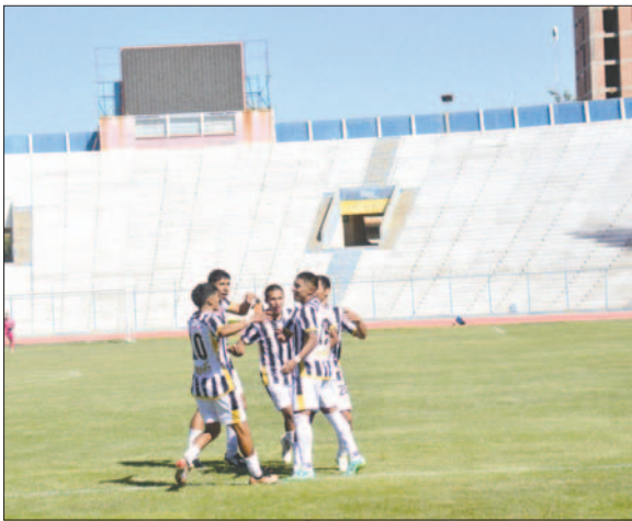
Oruro Royal recibirá a Río San Juan Humi en la primera fecha

Luego se eligieron a los clubes que iban a ser cabezas de serie. CDT Real Oruro fue seleccionado como primero del grupo "E", seguido por Río San Juan Humi de Potosí como segundo en la misma serie. En la tercera ronda del sorteo, Destroyers de Santa Cruz fue el siguiente en aparecer en la serie del equipo orureño. Los equipos que no fueron sorteados de las tómbolas A y B pasaron al bolillero