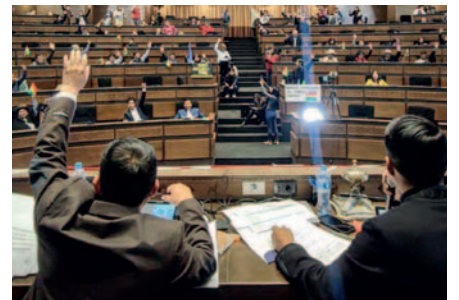
Asamblea Legislativa tratará informes de preselección de candidatos al Órgano Judicial

Para aprobar los informes se requiere el voto favorable de dos tercios del total de asambleístas presentes.