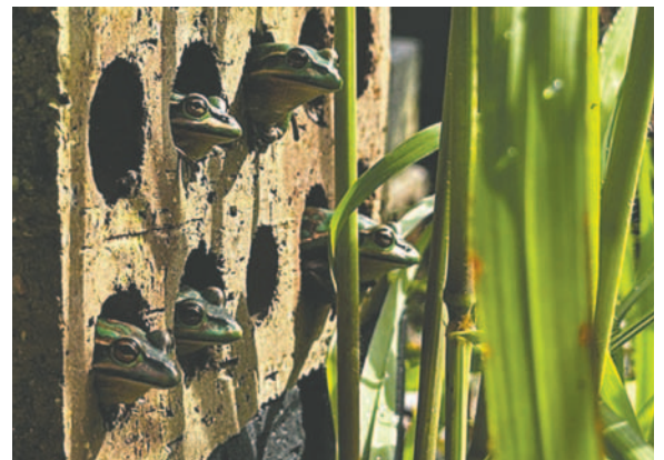
Este método no es la solución final, pero es de gran utilidad /ANTHONY WADDLE

Los científicos involucrados planean expandir el uso del sistema de "sauna de ranas" a otras especies, especialmente aquellas que