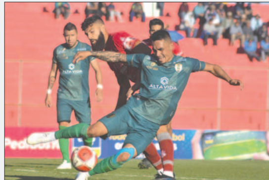
El cuadro tarijeño recupera terreno en el torneo

Los números del cuadro monterense siguen siendo pésimos, apenas tiene seis puntos, siendo penúltimo en la tabla y comprometido con la zona del descenso indirecto de categoría.