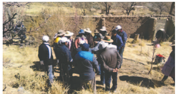
La comunidad de Huayña Pasto Grande se encuentra al sur de la ciudad de Oruro