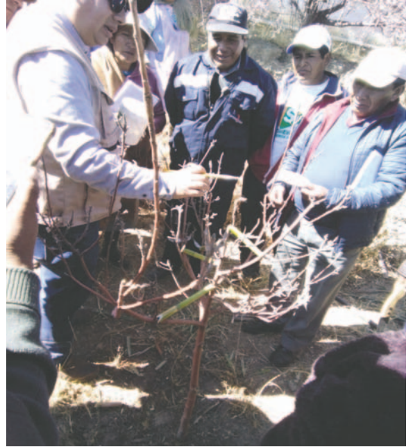
Ven potencial productor en Huayña Pasto Grande

“En Oruro dicen que no, que hace frío, que no se puede, pero eso es falso. Estas frutas (manzanas) necesitan de este clima. Además, aquí contamos con una gran ayuda debido a la radiación solar, lo que hace que la fruta sea más dulce”, sostuvo.