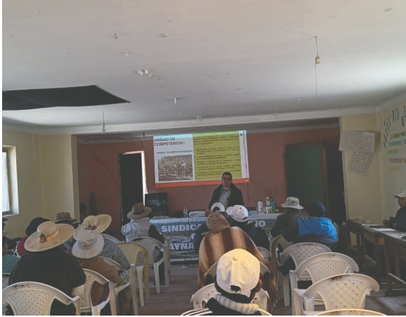
La capacitación se llevó a cabo el pasado domingo

El taller de capacitación se llevó a cabo el domingo 28 de julio en la localidad de Huayña Pasto Grande, al sur del departamento de Oruro. El curso se dividió en dos partes: teórica y práctica. Asistieron aproxima-