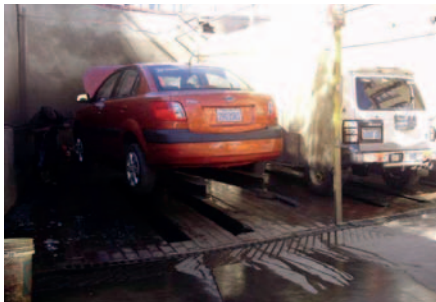
Un adolescente desaparecido fue hallado en un lavadero de autos en El Alto /REFERENCIAL

En medio del caso, Ibarra señaló: "El menor se encontraba trabajando en un lavadero de vehículos. Sin embargo, en este caso se ha omitido información, ya que aunque el menor afirmó ser huérfano, esta persona que ahora está aprehendida no informó a las autoridades".