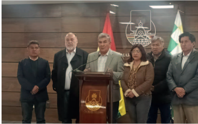
Ayer inició su labor la comisión especial, integrada por legisladores de distintas fuerzas políticas / LA PATRIA

Torres explicó que una de sus principales tareas será coordinar con