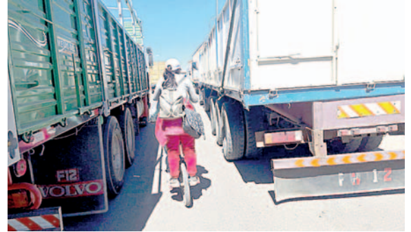
Las salidas hacia otros departamentos fueron las más afectadas

Ante el panorama de falta de diésel, desde hace algunos