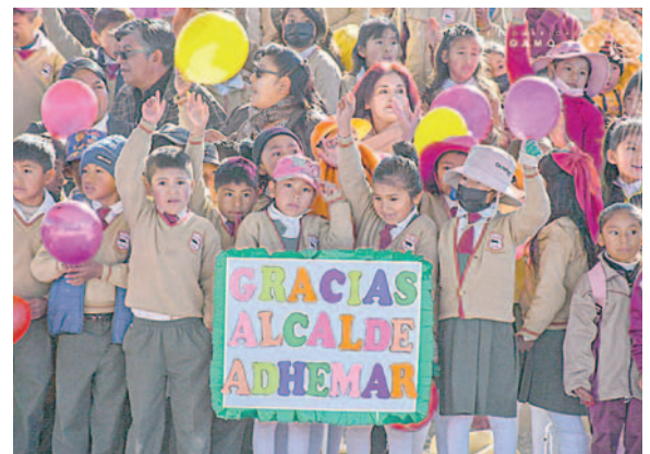
Estudiantes se beneficiarán de aulas modernas

Este año se ejecutarán 30 aulas educativas y en 2025 se construirán otras 30 aulas, cada una con un costo aproximado de 100