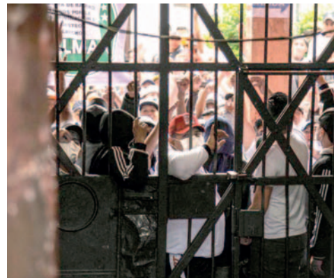
Hacinamiento carcelario aumenta en 73% de 2022 a julio de 2024 /RRSS

Específicamente, el hacinamiento en el penal de San Pedro de La Paz, el