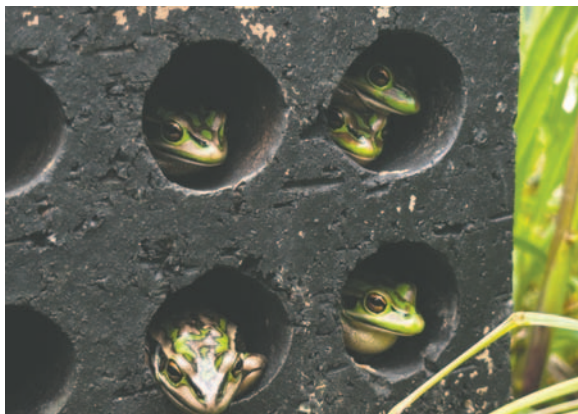
Ranas campana verde y dorada infectadas por un hongo mortal se sientan dentro de ladrillos calentados al sol

El estudio realizado por Waddle y sus colegas demostró que las ranas curadas dentro de los ladrillos tenían 23 veces más probabilidades de sobrevivir a otro ataque del hongo quitridio. Además, se destacó que las saunas para ranas son una intervención sencilla y asequible, incluso pueden instalarse permanentemente en el exterior de las casas.