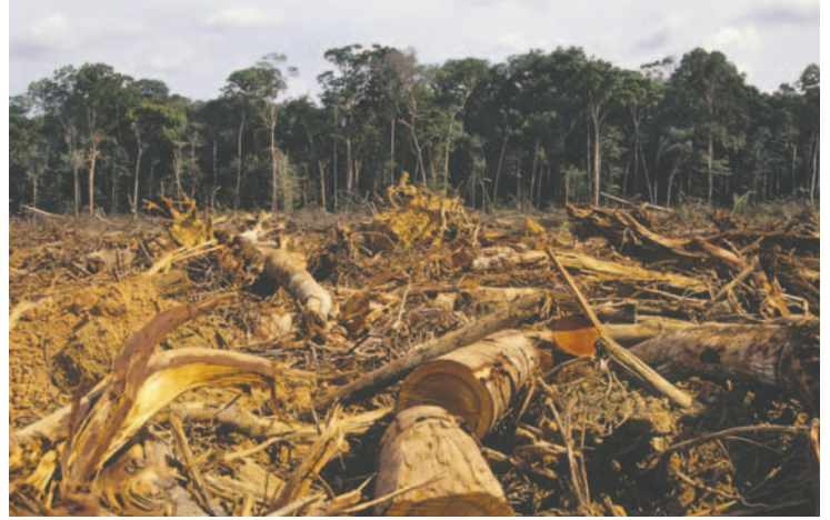
La demanda de madera ha generado un incremento en la deforestación

LA PATRIA La Organización de las Naciones Unidas para la Alimentación y la Agricultura (FAO) alertó sobre el aumento de la vulnerabilidad de los bosques a nivel mundial debido al cambio climático, incendios forestales y plagas. Según un informe reciente, se prevé un incremento del 49% en la demanda de madera entre 2020 y 2050, lo que