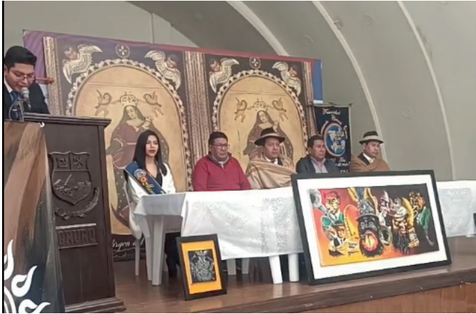
El acto de presentación del Festival Jach'a Uru Central