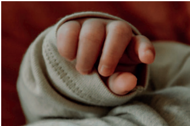
Dentro la bolsa, fueron encontradas unas sábanas que envolvían el pequeño cuerpo mutilado de un recién nacido/REFERENCIAL

que el cuerpo del recién nacido fue encontrado decapitado. Las autoridades están investigando si la mutilación ocurrió antes de ser abandonado y si fue en parte causado por los animales. El cadáver fue trasladado a la morgue del Hospital de Clínicas para seguir con el proceso investigativo, añadió el jefe policial.