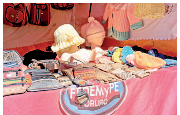
Micro y pequeños empresarios piden apoyo para abastecerse de materia prima

departamental como el nacional, aseguraron que desde hace meses tienen el problema del encarecimiento de la materia prima, prácticamente desde que hubo escasez de dólares en el país.