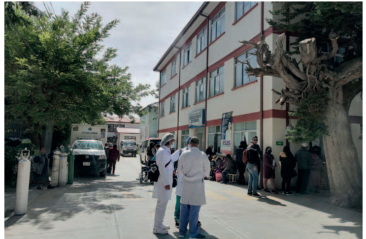
Gobernación destina Bs. 20 millones de bolivianos en salud / LA PATRIA

En cuanto a los ítems, el gobernador reiteró que el departamento de Oruro no rechazó los 60 que el Ministerio de Salud designó en semanas pasadas. Sin embargo, se solicita que los ítems lleguen al departamento