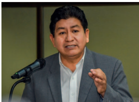
El ministro Édgar Montaña lamentó el bloqueo indefinido en carreteras

Los bloqueos realizados en Cochabamba fueron atribuidos por Montaña a la dirigencia del ala evista, generando pérdidas diarias de 4,7 millones de bolivianos y daños a las carreteras. El ministro anunció que viajará a Ari-