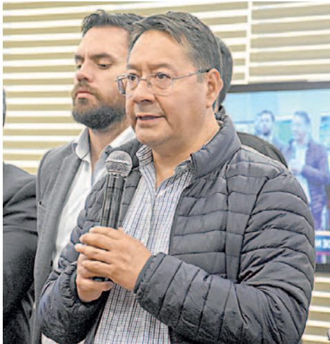
El mandatario aseguró que hoy descargarán el combustible en el puerto de Arica y llegará a Bolivia el sábado

“Mañana (hoy) vamos a poder realizar el desembarco de todo el combustible que se tiene ahí en los barcos. Tenemos cuatro barcos ahí en este