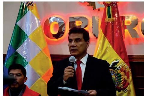
Promulgan el Decreto Departamental de embanderamiento en Oruro /GADOR

"Ya tenemos la agenda del aniversario patrio, comenzamos mañana (hoy),