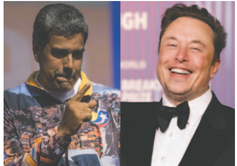
Combo de fotografías del presidente de Venezuela, Nicolás Maduro (f), y el CEO de Tesla Motors, Elon Musk

LA PATRIA / EFE El magnate Elon Musk, que el martes protagonizó una trifulca en las redes con Nicolás Maduro, aceptó este miércoles el reto de este último y dijo estar dispuesto a pelear con el presidente de Venezuela, a quien definió como "un tipo corpulento que seguro sabe cómo luchar". Fue Maduro quien el martes, tras calificar a Musk de "nuestro nuevo archienemigo", le dijo en un acto público: "Elon Musk, ¡quien se mete conmigo, se seca! (...) ¿Quieres pelear? ¡No te tengo miedo!, donde quieras, en los barrios... ¡Si tú quieres, yo quiero!", le espetó. Este miércoles, Musk aceptó la pelea en su cuenta de X y estableció sus condiciones: "Si gano yo, él dimite como dictador de Venezuela; si gana él, le invito a un viaje gratis a Marte", una alusión a su empresa SpaceX de cohetes espaciales. Incluso repostó una encuesta de un seguidor suyo en la que anima a los internautas a votar por quién ganará en esa pelea. No olvidó aludir a otra famosa pelea de "artes marciales mixtas" dentro de una jaula, que él mismo fomentó hace unos meses, contra Mark Zuckerberg, el fundador de Facebook y uno de sus mayores rivales en el mundo de la tecnología, encuentro que nunca llegó a realizarse. Comparando a Maduro con Zuckerberg, dijo que frente a un Maduro corpulento, "Zuck es un hombrecillo, así que sería una pelea rápida, LOL (acrónimo en inglés para carcajada)".