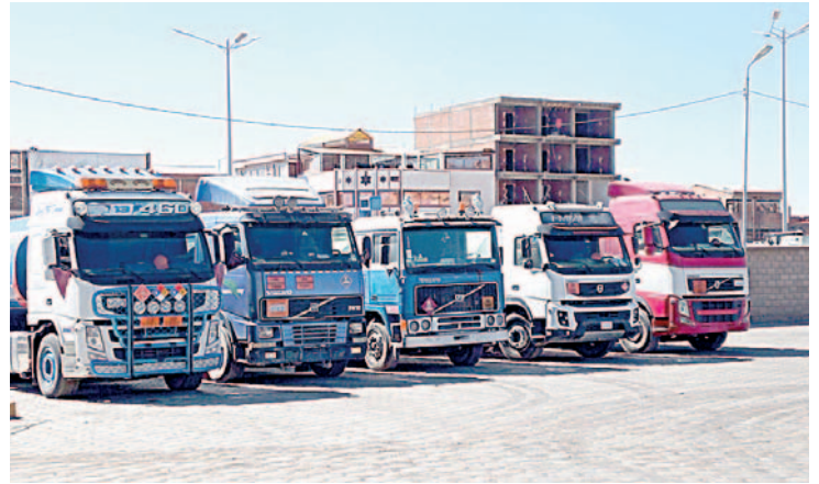
Vehículos repartidores de gas no circularon en la semana