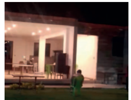
El ataque se produjo en un restaurante de comida en Tiquipaya

Después de cometer el ataque, el sujeto intentó darse a la fuga, pero fue capturado y llevado a dependencias policiales. Posteriormente, el juez cautelar determinó enviarlo a la cárcel de San Sebastián varones con detención preventiva por el delito de tentativa de homicidio.