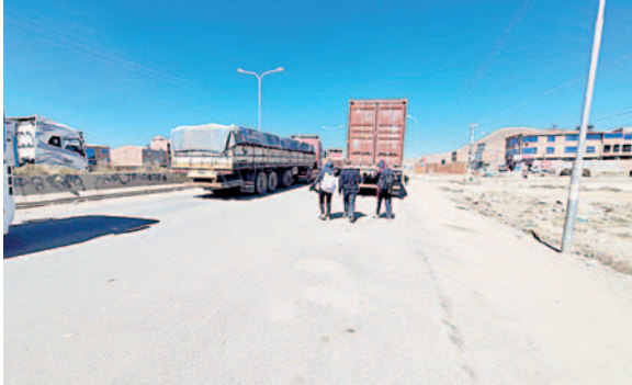
Bloqueos dejan su huella y se sienten los efectos