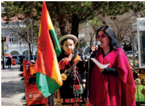
La artista de 5 años se presentó ataviada como una pastorcita y llevando la bandera boliviana

El videoclip se estrenó al mediodía del martes reciente, en diferentes plataformas digitales, las imágenes muestran paisajes y animales de los alrededores de Paria - Soracachi.