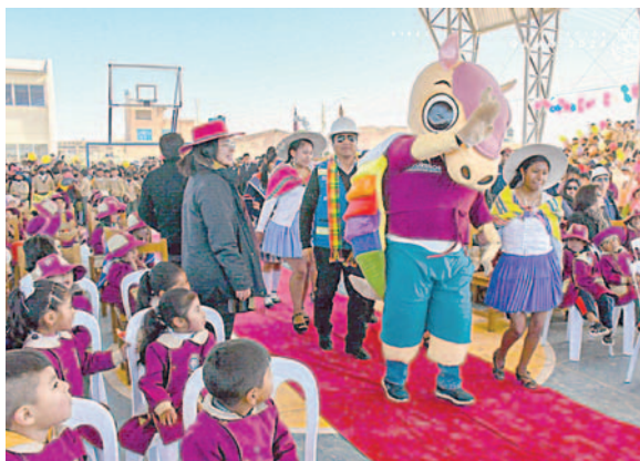
Inicio del Programa "Mi Escuelita"

El Programa "Mi Escuelita" tiene como objetivo adaptar el proyecto de aula piloto a las necesidades específicas de cada unidad educativa identificada, considerando factores como el número de estudiantes, la disponibilidad de espacio y las condiciones estructurales.