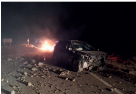
Los daños son de consideración en el motorizado tras el fuerte impacto contra el promontorio de tierra que los bloqueadores dejaron/TRÁNSITO

Cuando hay bloqueos en carretera, dejan escombros y tierra, y no hay señalética para advertir a los conductores, lamentó Valdez.