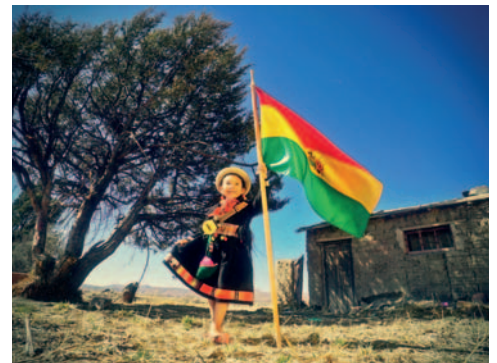
Arantxa durante la grabación de su videoclip

"Estoy muy feliz de recibir a todos en el debut