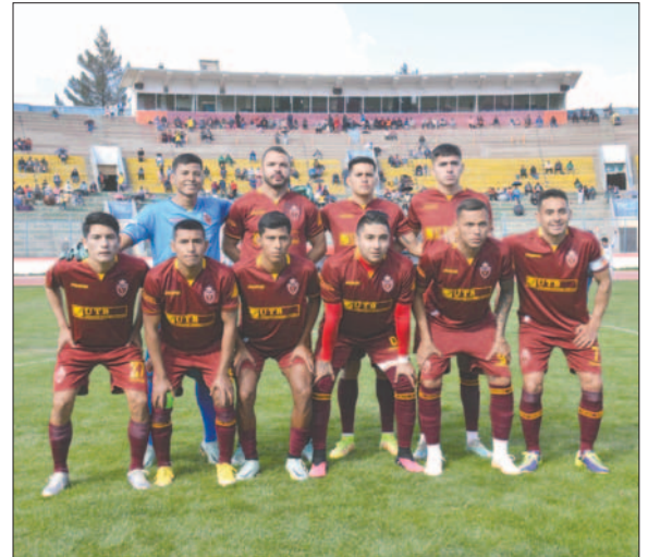
CDT Real Oruro comenzará como visitante ante Destroyers

D, donde Oruro Royal tuvo la fortuna de quedar junto a CDT Real Oruro, el conjunto "destroyano" y el equipo potosino.