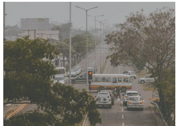
Segundo anillo de la capital cruceña

Las autoridades locales han recomendado extremar precauciones y estar atentos a las indicaciones emitidas por los organismos competentes para evitar situaciones peligrosas.