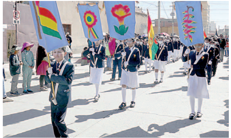
Realización de desfiles por la independencia de Bolivia deberá ser analizado