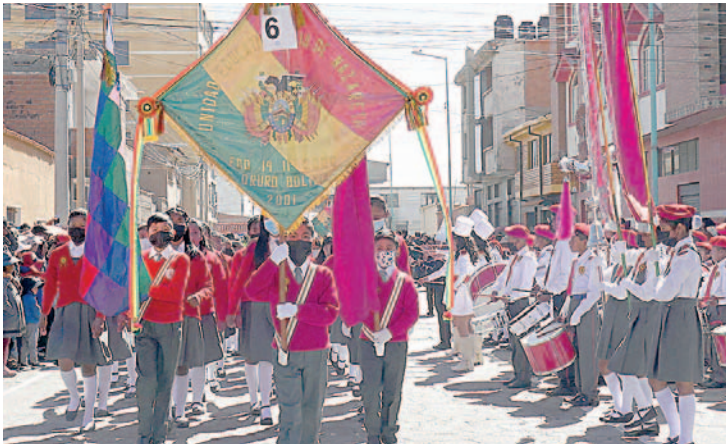
En duda el desarrollo del desfile escolar del 2 de agosto