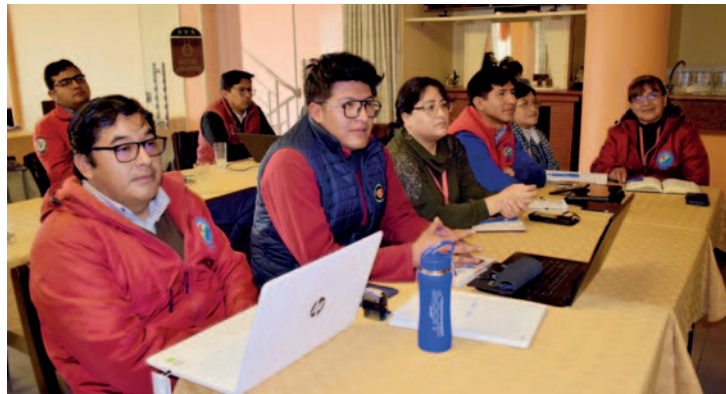
Mediante evaluación, se busca mejorar la atención en los centros de salud /SEDES

con el apoyo de los coordinadores de red, el equipo de cada red de salud y representantes de diferentes unidades, áreas y programas del Sedes.