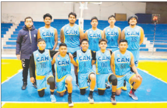
CAN logra una buena campaña en la categoría juvenil

Aunque el tercer cuarto terminó empatado 13 a 13, Saracho mantuvo su ventaja con un marcador global de 52 a 36. En el último cuarto, Litoral mostró determinación, llevándose el parcial 17 a 15, pero no fue suficiente para superar a Saracho, que se llevó la victoria con un score final de 67 a 53. Acapa David, del plantel sarachista, fue el jugador más destacado del encuentro.