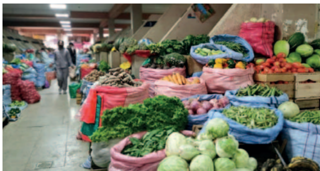
La CAO pidió solución urgente al Gobierno nacional