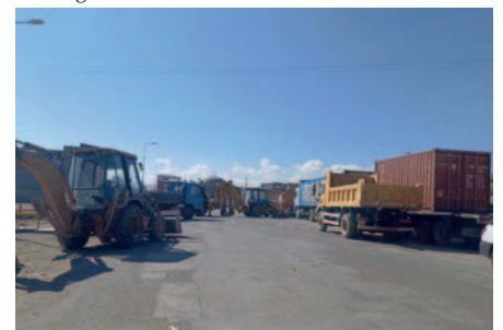
Paro indefinido del sector transporte inicia con fuertes críticas al Gobierno por falta de soluciones efectivas

“El único responsable de la crisis es el Gobierno nacional y es el que debe dar la solución correspondiente”, sostuvo el presidente de la CAO.