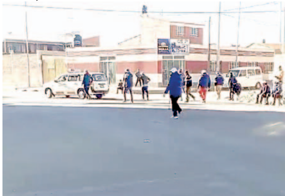
Momento en el que un grupo de personas, portando palos, amedrenta a un taxista

Después de que uno de esos vehículos se detiene, los bloqueadores se acercan al automóvil y hacen que el conductor se baje.