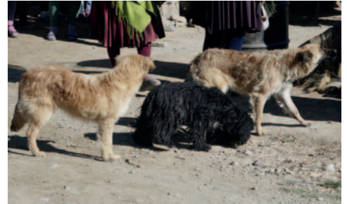
Canes en situación de calle preocupa a las autoridades

Desde el Programa de Enfermedades Zoonóticas manifestaron su preocupación por la gran cantidad de perros abandonados por dueños irresponsables en las calles, los cuales forman jaurías y ponen en riesgo la integridad y la salud pública.