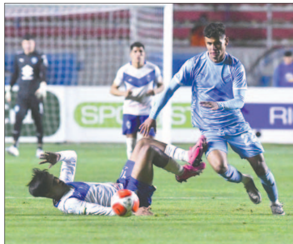
El cuadro celeste puso por los suelos a la defensa de