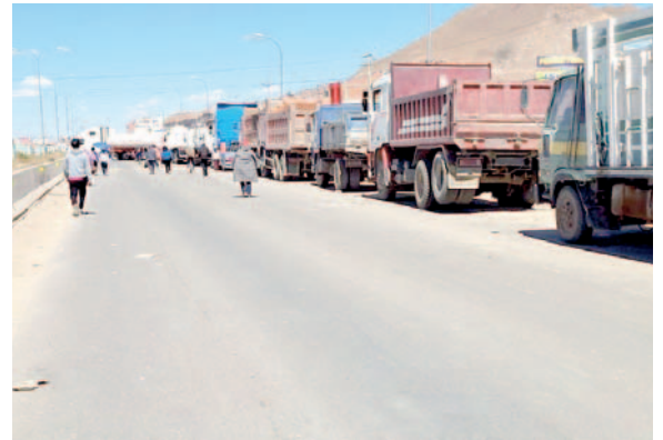
Paro indefinido del transporte comienza en Oruro con incidentes de amedrentamiento a conductores