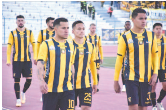
El "tigre" tratará de sanar sus heridas a costa del cuadro "millionario" / LA PATRIA

FC Universitario de Vinto y Blooming jugarán su duelo, a las 15:00, en el estadio Félix Capriles, donde con 11 puntos, la "U" quiere desplazar a los celestes (12) en la tabla para seguir compitiendo por un lugar en la zona de clasificación a un torneo internacional.