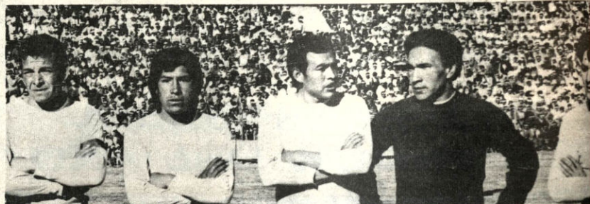
-Defensores bolivaristas. Tratarán de frenar a la vanguardia de 31 en el partido que juegan hoy.

Sin embargo, ni bolivaristas y crucistas están dispuestos a resignar el título del certamen, y lo que es más, la clasificación