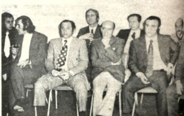
Las fotos corresponden al agasajo que anoche ofrecieron el Ministerio de Información y Deportes y el Círculo de Periodistas Deportivos de Bolivia, en honor de los periodistas argentinos que se encuentran en nuestro medio con motivo del encuentro de mañana.

Al acto concurrió el titular de esa cartera, Guillermo Bulacia y otras altas autoridades de gobierno y del deporte.