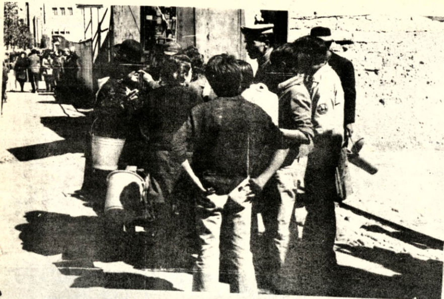
Problemas en los sistemas centrales de distribución de agua potable, motivaron un corte intermitente en el suministro del líquido elemento, ocasionando serios problemas a los habitantes de la zona central y algunos barrios periféricos de la

ciudad de La Paz. Reaparecieron los baldes y las colas con el afán a procurarse agua por lo menos para satisfacer las necesidades más indispensables.