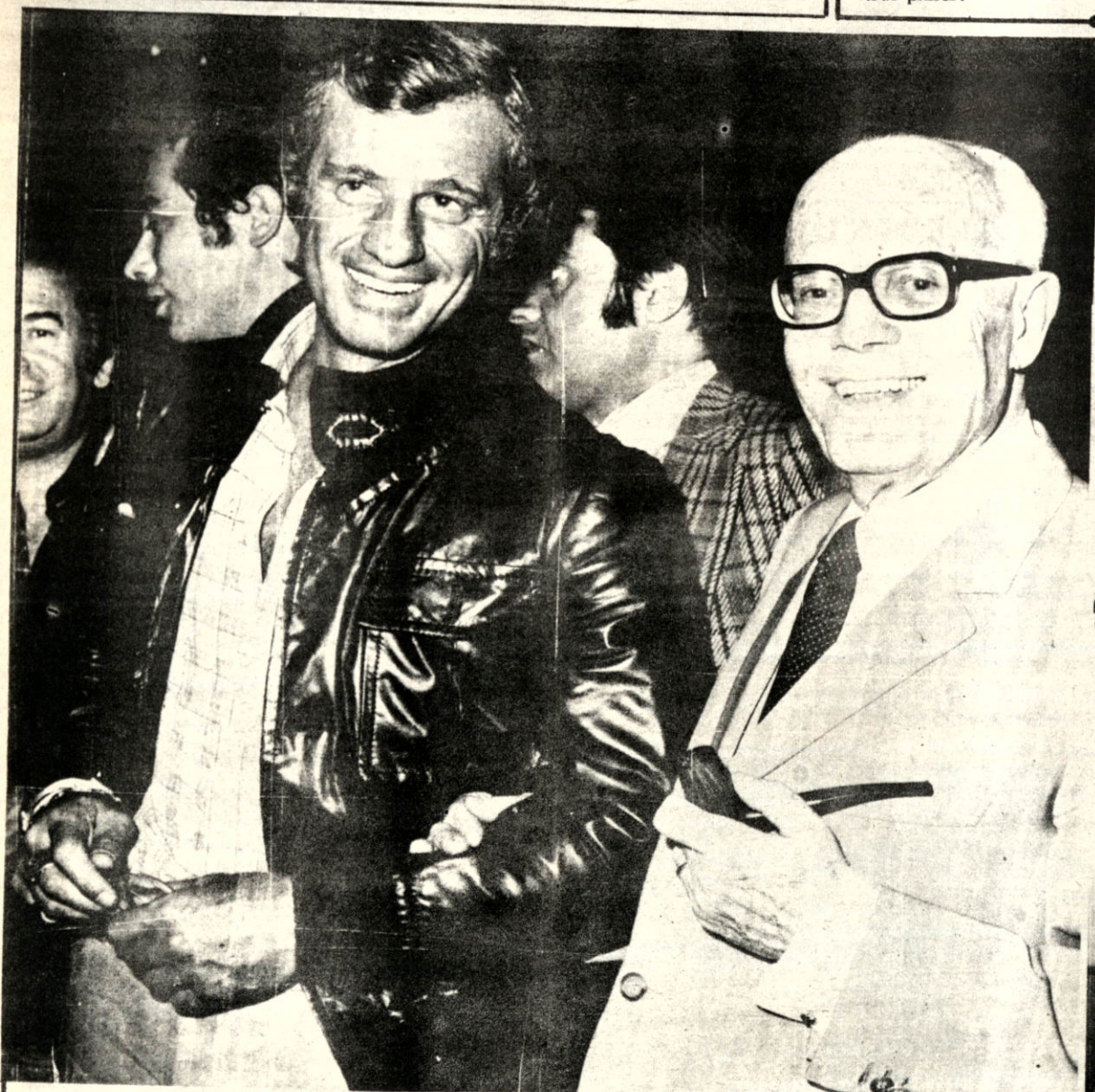
ROMA, (ANSA). El conocido cineasta, Jean Paul Belmondo, declaró ser admirador de Carlos Mozzón, campeón mundial de box en la categoría de los medianos. Belmondo formuló la declaración en oportunidad de encontrarse en el Palacio de los Deportes de Roma.

Asimismo instituciones culturales, cívicas y gubernamentales aprovechan la fecha para realizar la labor educativa de los maestros con el sincero deseo que la enseñanza dentro las aulas se supere a corto plazo alcanzando el nivel de otros países.