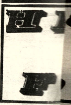
La embajada Nacional de Comercio técnicos. La