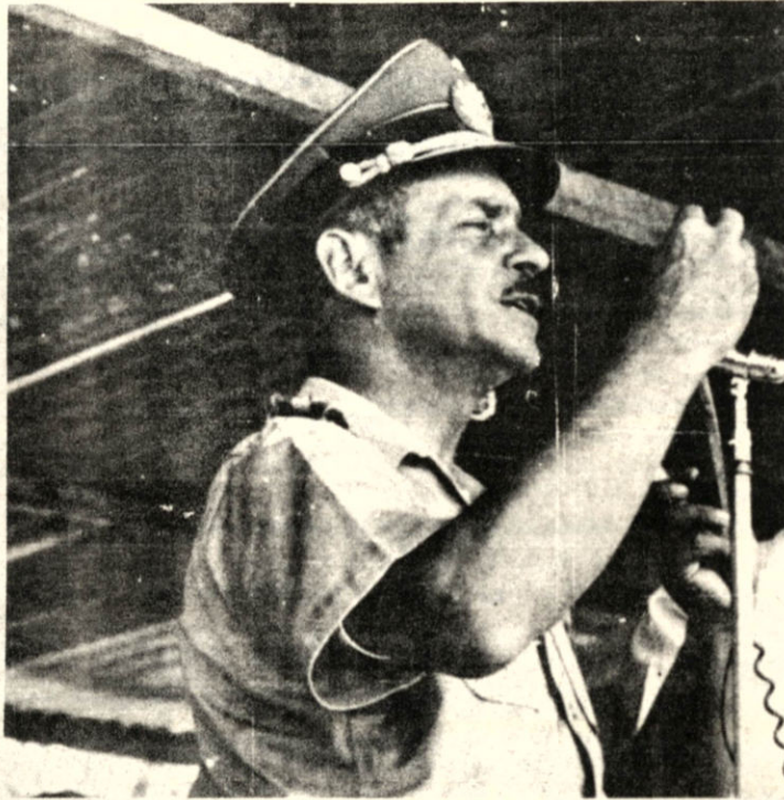
Gral. Dn Hugo Banzer Suárez EXCMO. PRESIDENTE DE LA REPUBLICA

El Gobierno Nacionalista cumple así la política habitacional ejecutada por CONAVI.