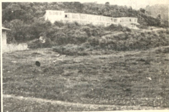
Un aspecto del Hotel Prefectural de Irupana que se inició durante el gobierno del General René Barrientos Ortuño y hasta el momento no puede ser concluido. Muchas de sus dependencias se encuentran deterioradas por factor climático.

Según declaraciones de los componentes de la Junta de Vecinos el principal objetivo es gestionar ante las autoridades respectivas la conclusión del Hotel Prefectural que desde hace 5 años está sin terminar. Intentarán también se efectúe la reparación de la escuela "Agustín Aspiazú" y del Colegio "5 de Mayo" que al momento constituyen un peligro para los educandos de esa tierra yungueña.