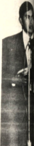
Un Jefe de... neral... da ay... del G... res. E... calida...