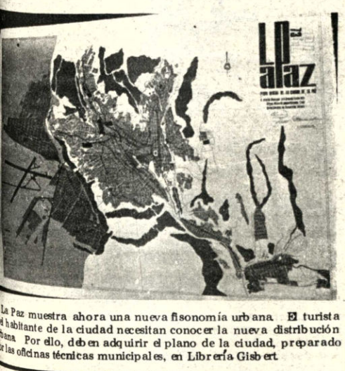
La Paz muestra ahora una nueva fisonomía urbana. El turista y el habitante de la ciudad necesitan conocer la nueva distribución urbana. Por ello, deben adquirir el plano de la ciudad, preparado en las oficinas técnicas municipales, en Librería Gisbert.