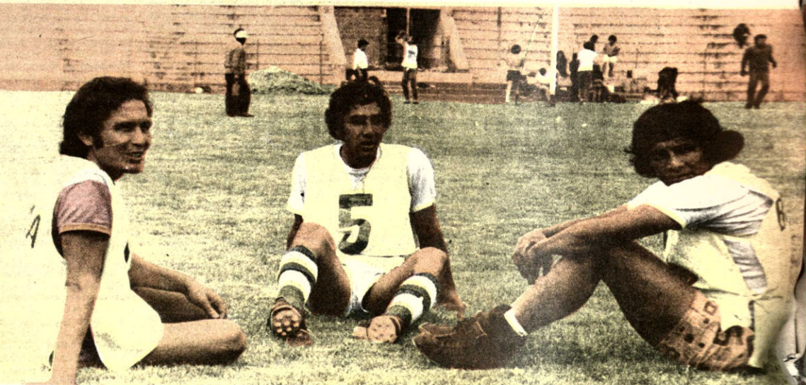
"DEPOSITO LEGAL LE 15 88"

PERDIO BOCA BUENOS AIRES, 16 (ANSA). Boca Juniors superó esta noche a Boca Juniors por 2-0 en un partido correspondiente a la octava fecha del torneo metropolitano.