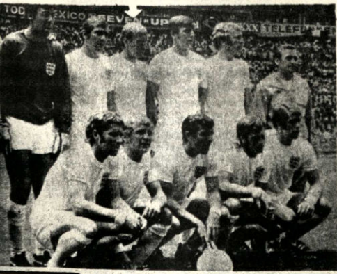
La selección inglesa en México. "Bobby" Charlton es el capitán. El popular jugador se retirará del fútbol el próximo mes.