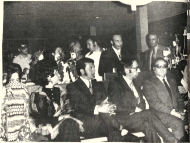
Con asistencia de altas autoridades de Gobierno y del deporte, anoche se inició el campeonato de bowling auspiciado por el club Macabi. La competencia en la que participan destacadas figuras de este deporte se desarrollará en el curso de este mes.

Por su parte la sección aficionada resolvió postular