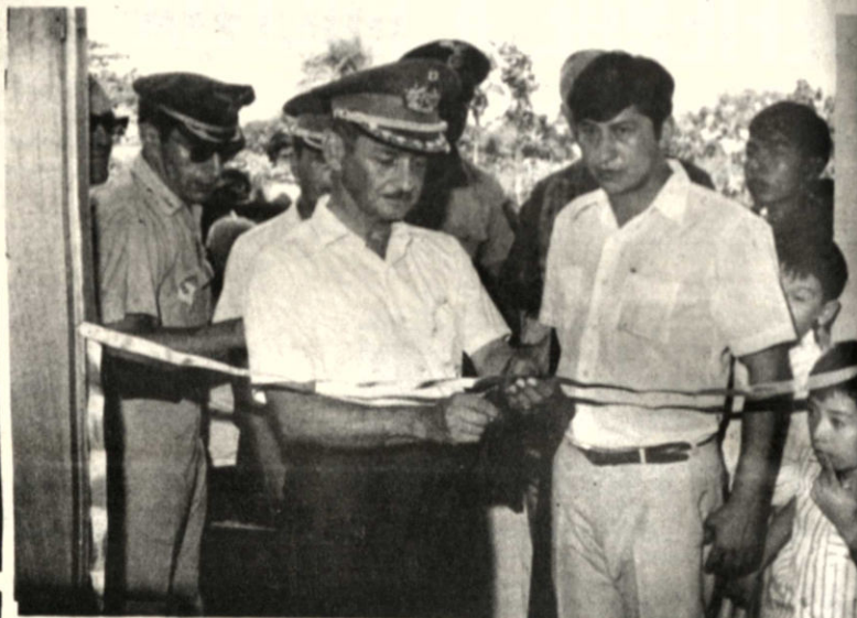
El Presidente Banzer, en el momento de cortar la cinta inaugurando el Hospital "César Banzer", en la localidad de Concepción.

La muestra estará abierta del 4 al 11 de este mes.