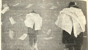
"MASANA HABRA PAN", óleo con el que el artista Magdo Arqueles ganó el Gran Premio Anual de Pintura "Pedro Domingo Murillo".

Se reunió finalmente con un aplauso a la obra del productor francés y un consenso general sobre la necesidad de que se dé importancia a la cultura boliviana.