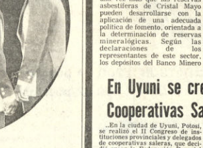
En la ciudad de Uyuni, Potosí, se realizó el II Congreso de Instituciones provinciales y delegados de cooperativas saleras, con el fin de crear la Federación Especial de Cooperativas Saleras Industriales, FECSI, con una membresía de 10.000 saleros de esta zona.

Los productores y concesionarios mineros influyen una vez más que las reservas asbestíferas de Cristal Mayo pueden desarrollarse con la aplicación de una adecuada política de fomento, orientada a la determinación de reservas mineralógicas. Según las declaraciones de los representantes de este sector, los depósitos del Banco Minero