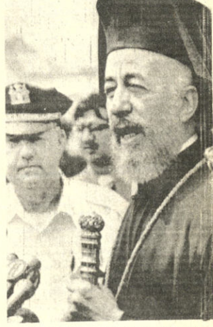
MAKARIOS. Nueva York 18 (AP). - El Arzobispo Makarios habla a periodistas hoy después de arribar al aeropuerto John F. Kennedy en Nueva York. Makarios hablará en las Naciones Unidas sobre la situación en Chipre.