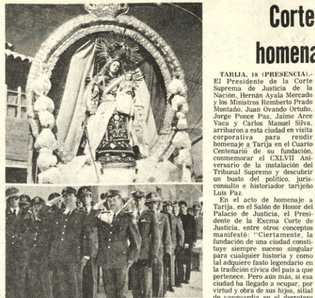
HOMENAJE.- La Virgen del Carmen, Patrona y Generala de las Fuerzas Armadas de la Nación.