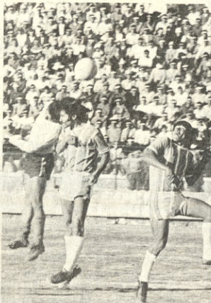
DEFENSA LITORALENSE. Los defensores de Litoral teniendo un ataque de los boliviaristas durante el juego del domingo pasado equipados 1 a 1 en el estadio de Miraflores.