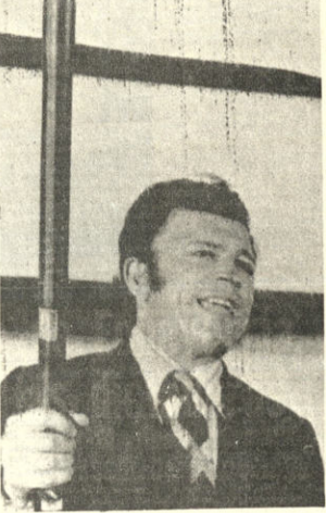
- PRESIDENTE DE CHIPRE. Nicosia, Chipre 18 (AP). - Nikos Sampson muestra, durante una conferencia de prensa, una "manaca" presuntamente utilizada bajo el régimen de Makarios para torturar a oponentes..