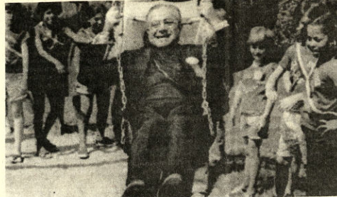
DIVERSION.- Natsesk (AP). - El Cardenal Humberto Medeiros se divierte en un campamento durante su visita a esta playa donde se encuentra una institución para niños desvalidos. Los jóvenes empujan al Cardenal ubicado en un colmpio.