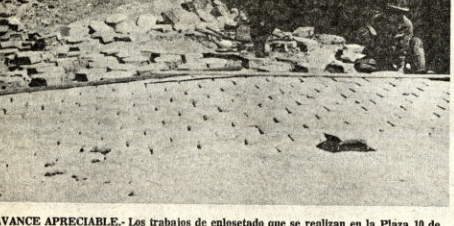
AVANCE APRECIABLE.- Los trabajos de enlosado que se realizan en la Plaza 10 de Noviembre de Llaallagua muestran apreciable progreso. El decidido apoyo de los vecinos permite programar nuevas obras.