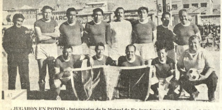
JUGADOR EN POTOSI.- Integrantes de la Mutual de Ex-Jugadores de La Paz, que el último fin de semana se presentaron en Potosí ganando a Oromo por 2 a 1, y empatando con Potosí 2 a 2

la cual ya garantiza la realización del certamen. Nuestro informante dijo además que para los próximos días se espera la confirmación de algunos países de esta parte del continente. Nuestro informante que retornó recién a Cochabamba manifestó que máximo hasta el próximo sábado deben hacerse presentes en la concentración de la selección nacional las jugadoras de las asociaciones de Cochabamba y Santa Cruz. Se dijo que en el interior las jugadoras así como los respectivos padres de familia están a la espera de la respectiva Resolución Ministerial a objeto de no perjudicar a las deportistas en edad escolar en sus estudios. Autoridades de la Federación Boliviana de Básquetbol reinitiarán hoy los trámites ante el nuevo Ministerio de Educación, Tcnl. de Aviación y DEMA, Waldo Bernal Pereira. Mientras tanto la selección que por el momento entrena sólo con las cinco jugadoras de la Asociación de La Paz continúa ayer, con sus prácticas en la cancha "B" del Coliseo "Ciudad de La Paz" bajo la dirección del técnico norteamericano Arthur Manuel Durán.