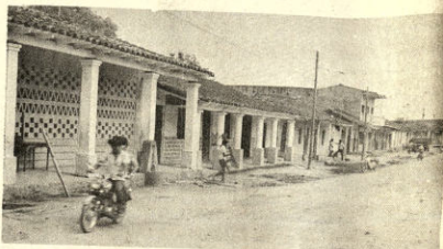
Inversión $b. 2.025.031