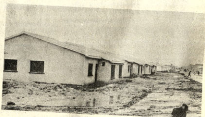
Inversión $b. 1.191.474