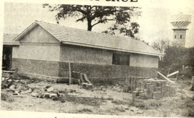
Inversión $b. 15.134.940