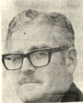
bornoz y funcionarios de Protocolo y de Finanzas.