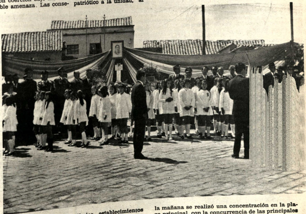
POTOSI, 27 (HOY).— Varios establecimientos escolares de esta ciudad rindieron homenaje a los héroes de la guerra del Pacífico. Durante horas de