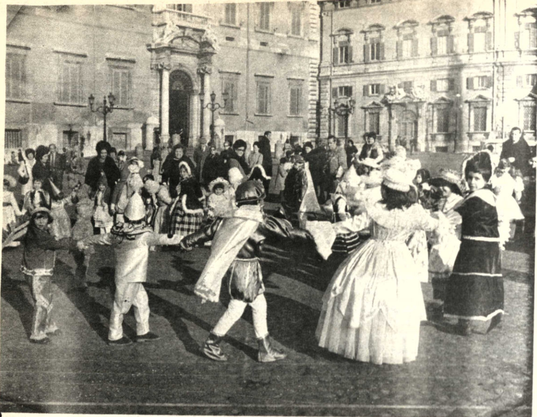
ROMA, (ANSA).—El Antiguo Palacio del "Quirinale", en un tiempo residencia del Papa y ahora perteneciente al estado italiano, fue escenario de la desbordante alegría de los niños romanos.