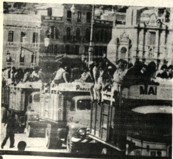
Otro contingente de mil trabajadores partió ayer a Santa Cruz para sumarse a los que anteriormente viajaron para la zafra del algodón.

La semana anterior, Bolivia—Utah participó en el estreno de la escuela de Pasto Pata la primera correspondiente a 1973, incluida en alrededor de 28 escuelas más que serán inauguradas en el curso de este año.