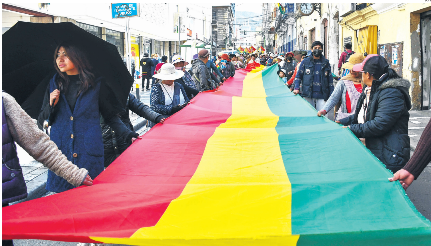
En gran número los gremialistas salieron a marchar por las calles de La Paz. Al sector preocupa el encarecimiento del tipo de cambio

En el pliego petitorio también se detalla: "Se pide la renuncia inmediata de los ministros de Hidrocarburos y del de Obras Públicas, más sus brazos operativos (YPFB) y fiscalizadores (ANH), por haber mentido sobre el abastecimiento de combustible, por no haber cumplido en su integridad con los acuerdos arribados dentro de las actas tratadas en diferentes reuniones. (...) A su vez, se solicita las garantías respectivas para todos nuestros dirigentes a nivel nacional a la cabeza de nuestro movimiento a objeto de no ser perseguidos ni legal ni políticamente".