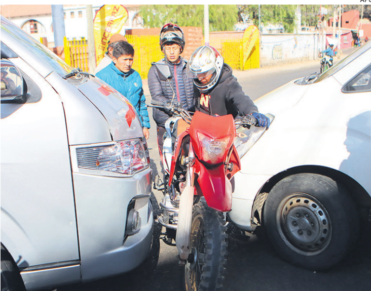
El cierre de vías ya se hace sentir en las calles de la capital del país

Es el alza de los pasajes interdepartamentales registrados en la terminal Bimodal de Santa Cruz.