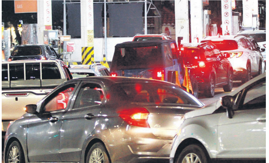
Las personas, por temor, salieron a cargar sus vehículos con gasolina generando largas filas

“Nos dicen que el pasaje está elevado por la escasez del diésel. Viajar a Puerto Quijarro costaba 80 bolivianos, ahora lo pillé a Bs 130, y no salen los buses completos. Dicen que por la noche el precio está mucho más caro”, reclamó una mujer que tenía que viajar hacia la zona fronteriza.