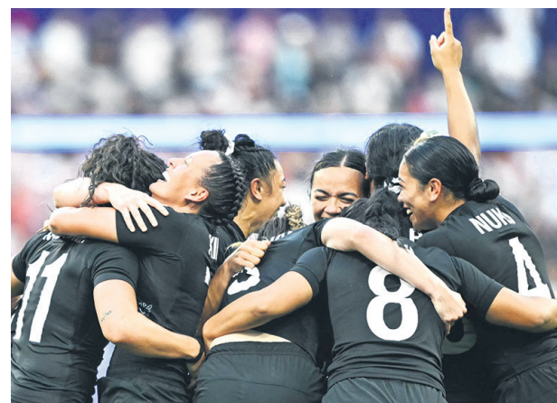
Nueva Zelanda, en rugby femenino, festejó una nueva conquista. En la gran final disputada ayer, le ganó a Canadá por 19-12, muy superior

rición, consecuencia de un bloqueo mental, le había obligado a retirarse de esta misma prueba en Tokio y a perderse la mayoría de finales de aquellos Juegos.