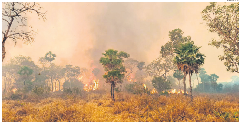
El fuego en San Matías está activo desde hace más de 30 días