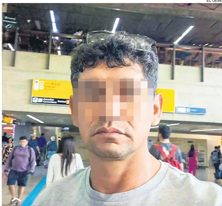
El hombre está imputado por violación y por violencia familiar

Un informe psicológico, elaborado por peritos de la Fiscalía, con participación de la Defensoría, concluyó que la mujer era dopada con tabletas que le daba su cónyuge y la atormentaba afectando su autoestima.