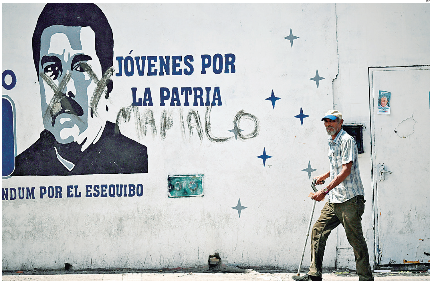
Venezuela vive horas de tensión tras las elecciones del domingo. Casi todos los gobiernos de América no reconocen la reelección de Maduro.

La OEA denunció ayer, a través de un comunicado, que las elecciones presidenciales en Venezuela sufrieron "la manipulación más aberrante". Hoy, el Consejo Permanente de la OEA se reunirá para analizar los resultados en Venezuela.