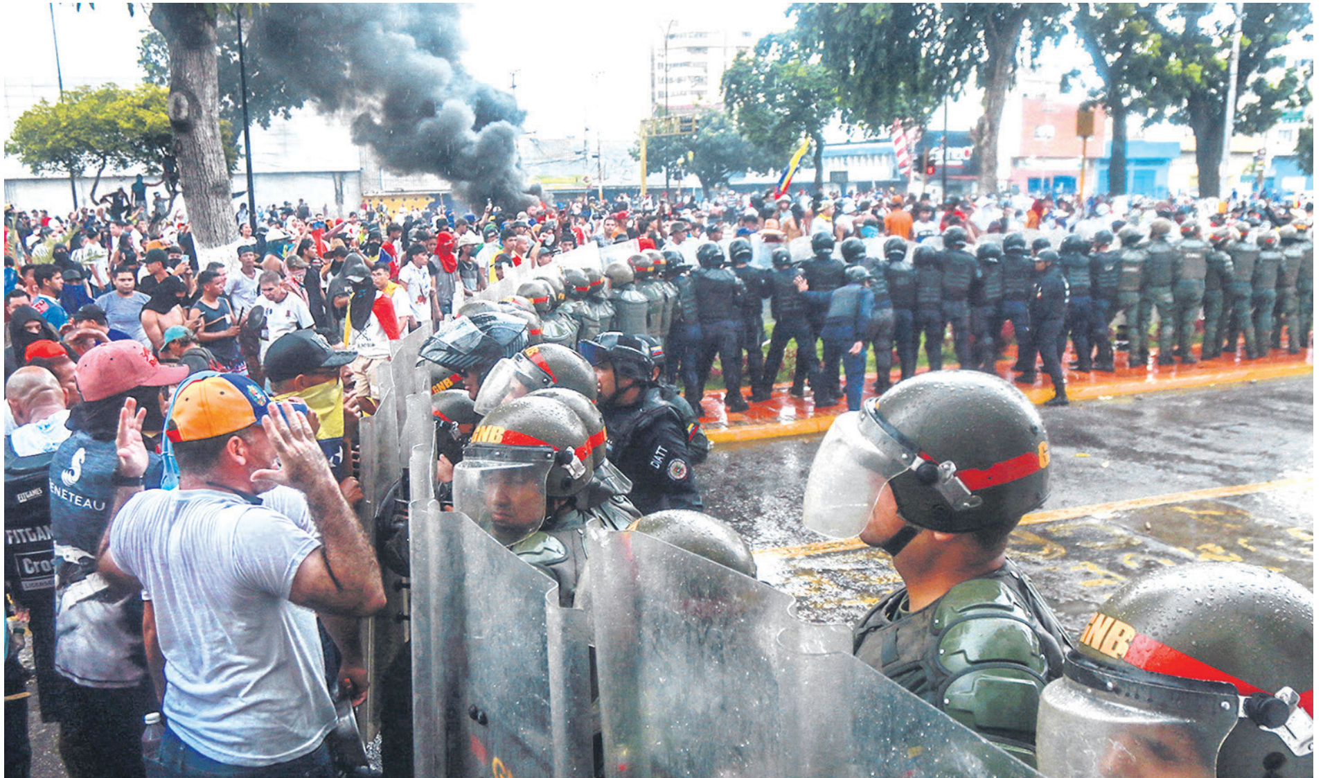
Manifestantes contrarios al gobierno de Nicolás Maduro protestan en la zona central de la ciudad de Caracas mientras son contenidos por la Guardia Nacional Bolivariana