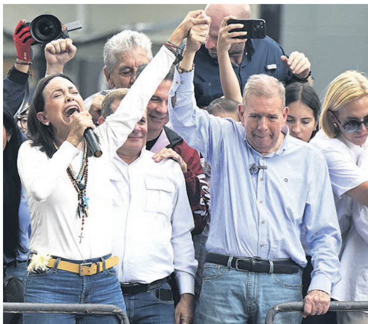
Corina Machado y González estuvieron ayer con sus seguidores

Machado asegura tener en su poder copias del 84% de las actas