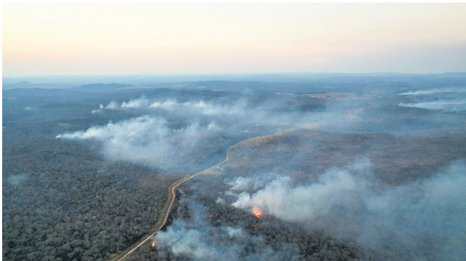
Roboré, San Rafael, San Antonio de Lomerío, San Javier, San Ramón y Puerto Suárez se declararon en desastre por los incendios