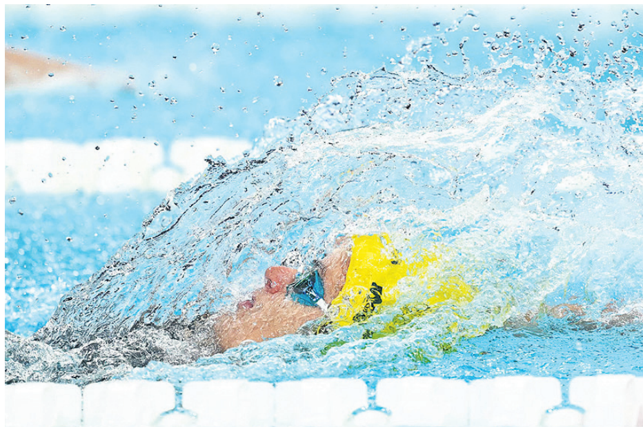
La australiana Kaylee Mckeown fue la mejor en la final de los 100 metros espalda en natación. Imparable