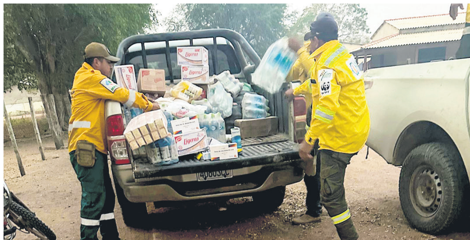
El director del ANMI San Matías agradeció la ayuda de las ONG