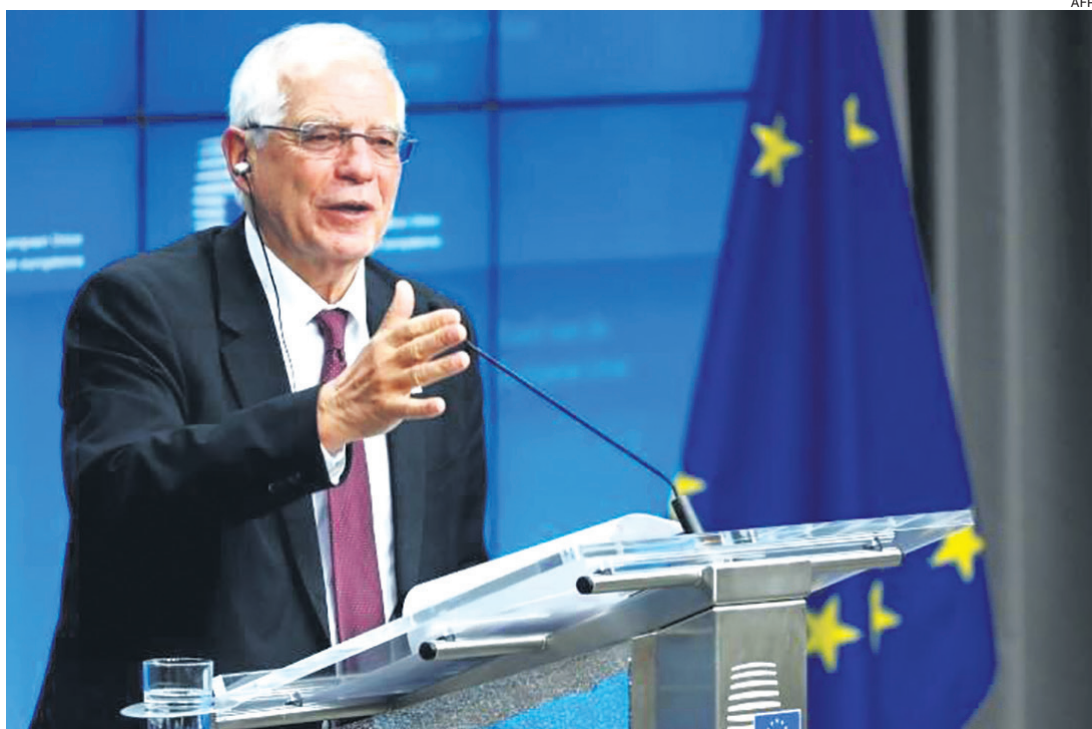
Josep Borrell se refirió ayer a la represión ejercida por los militares contra los manifestantes

La medida "deberá aplicarse a partir de mañana (hoy) desde las 8 de la noche", agregó la funcionaria en conferencia de prensa.