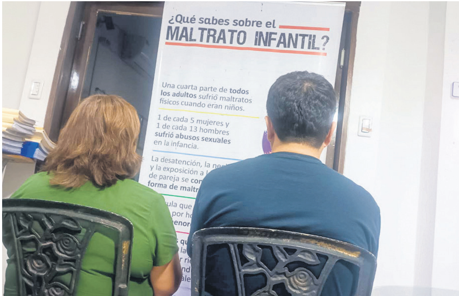
Los familiares de la joven víctima de violación y la exesposa que denunció violencia, siguen procesos contra el acusado y una corregidora