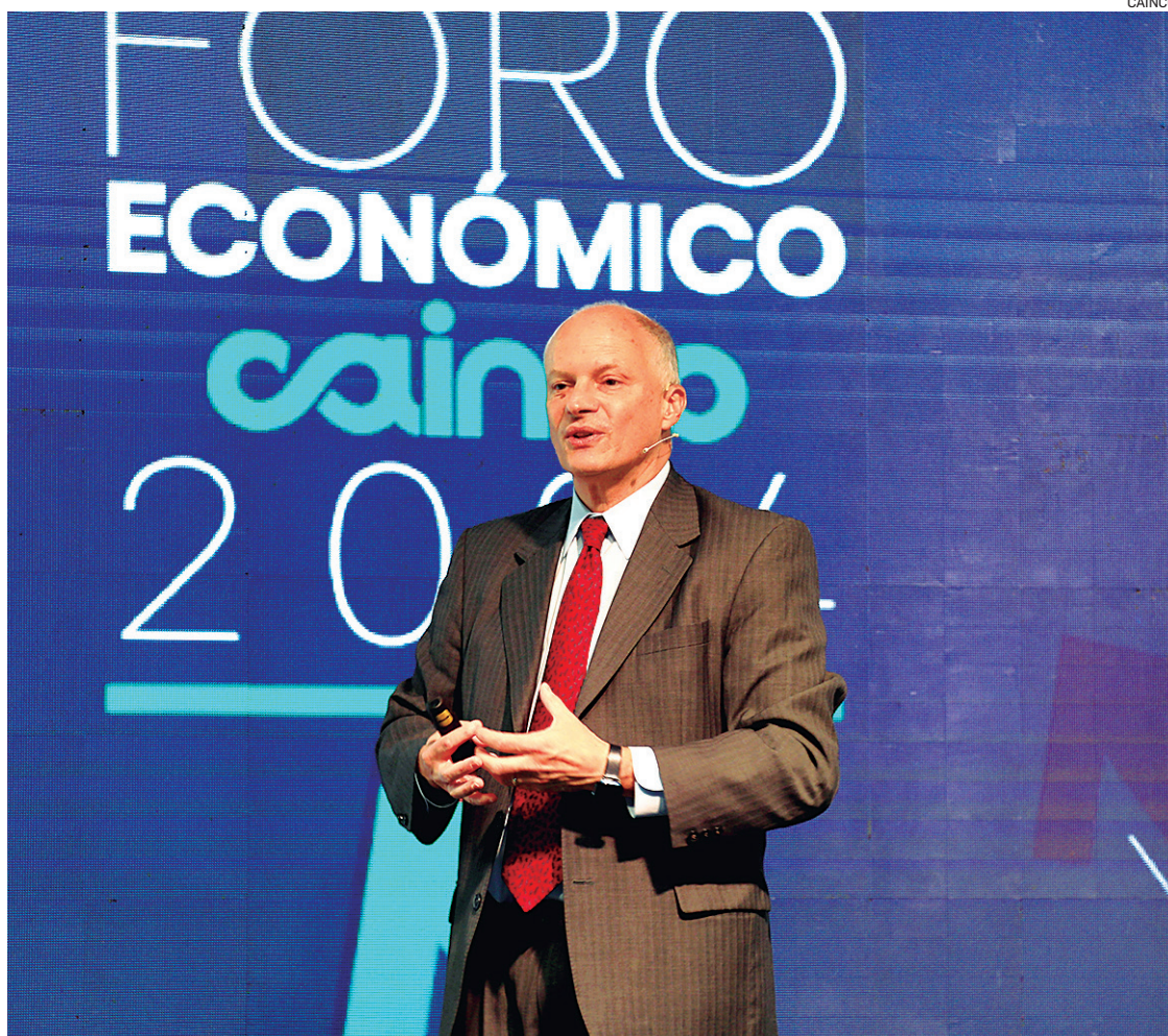
Werner ve que se requiere un tipo de cambio que refleje la realidad, más débil y que impulse exportaciones

— Sugiere recurrir al FMI por crédito internacional, pero Bolivia devolvió un dinero a ese or-