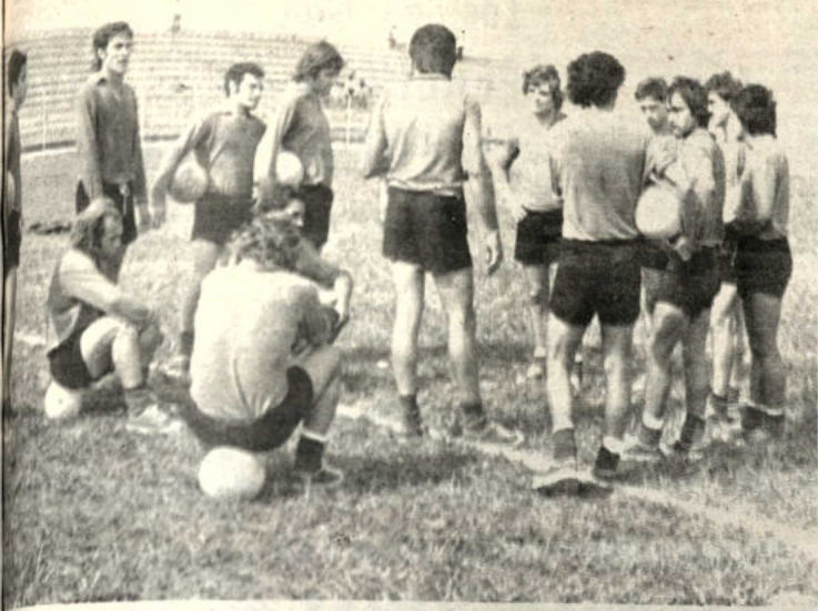
SANTA CRUZ, 23 (HOY).— Jugadores de River Plate durante una de las prácticas que efectuaron en el estadio William Bendek. Los argentinos esperan hacer un buen partido.—