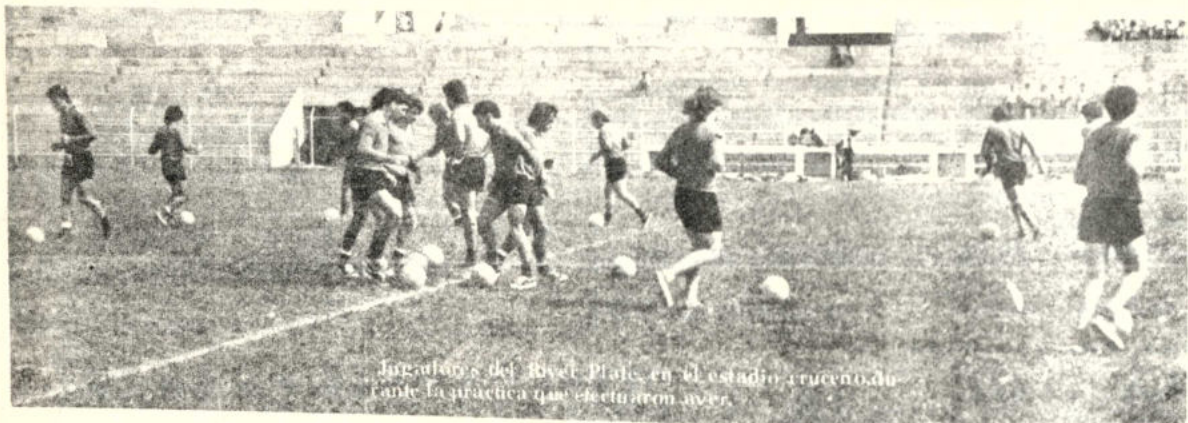
Jugadores del River Plate, en el estadio aruceno, durante la arriada que efectuaron ayer.

Delegados de ambos clubes han adelantado tratativas y la actuación "millonaria" en La Paz podría producirse en el curso de la primera quincena del mes que viene.