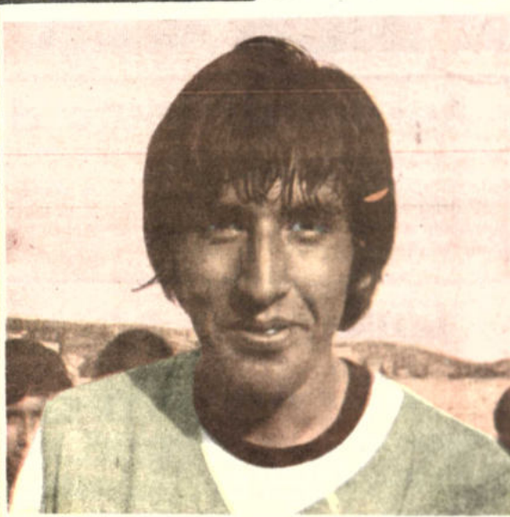
Blanco, jugador de la selección nacional amateur, de fútbol que participa en los Bolivarianos. Nuestra representación volverá a presentarse mañana enfrentando a Perú.

nos entrenen el jueves por la noche a The Strongest.