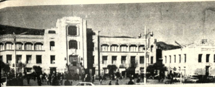
El estadio Hernando Siles. Actualmente se gestiona un empréstito para ampliarlo para 60 mil personas.