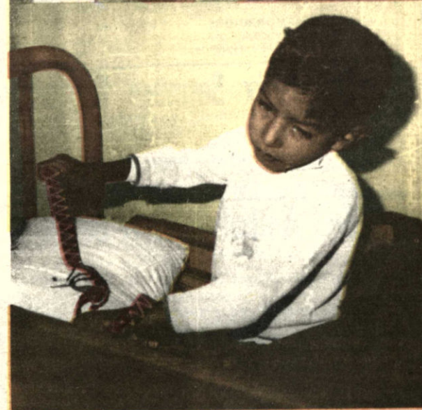
En nuestros informantes.