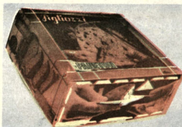
PANETON NAVIDEÑO Con frutas abellanadas Nueces $b.10 - $b.12