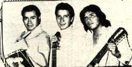
trovadores de Bolivia