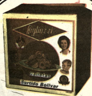
CAJITA "SURTIDO BOLIVAR" $b.22.50