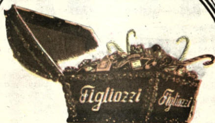
COFRE TESORO FIGLIOZZI $b 16