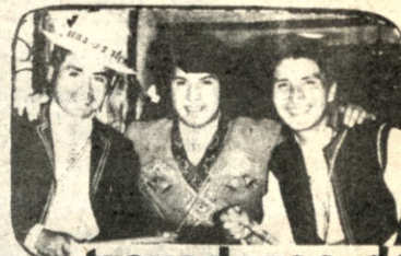
trovadores de Bolivia

BUENOS DÍAS EL SHOW FAMILIAR CON PRECIOS