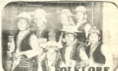
FOLKLORE LOS CHUSPITAS