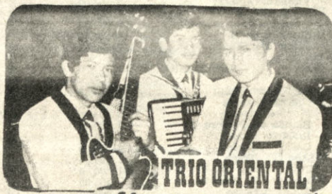
TRIO ORIENTAL ritmo tropical