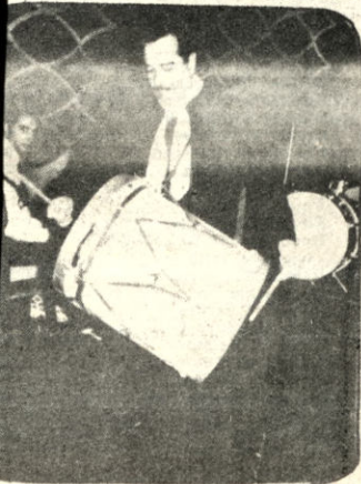
LALO ESPINDOLA EL BOMBO DE AMERICA