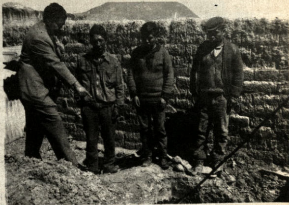
El jefe de la INTERPOL Jaime Zuniagua, muestra la coca macerada en pozos especiales cubiertos de tierra, junto a él, tres de los implicados en la producción de cocaína.

También se informó que con un costo de ciento cincuenta mil pesos bolivianos, se construirán, en dos pisos modernas celdas para presos comunes, prontuariados mujeres y menores de edad, en las dependencias de la DID. El aporte lo está haciendo el pueblo mediante entregas voluntarias. Actualmente se encuentran financiados el 20%.