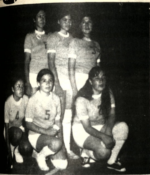
Equipo femenino de Oruro que interviene en el campeonato nacional de volibol que se juega en la ciudad de Santa Cruz. Su actuación no fue de las más regulares.

El corredor belga, 25 años, quien en su carrera "ganó todo" pero este año no logró reconquistar el campeonato mundial, se encuentra en excelente estado físico. En la última semana ganó en Italia la "Vuelta De Emilia" y la "Vuelta de Lombardia" y en pareja con su compatriota Roger Swerts, el "Trofeo Baracchi" con tra reloj.