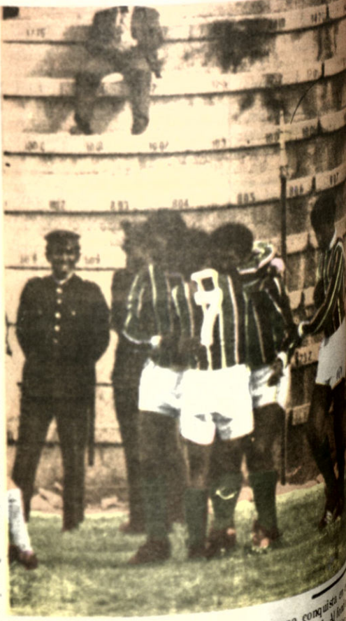
Los tricolores festejan su primera conquista en el certamen, el gol logrado frente a Municipal. Al lado de los policías sonríen de felicidad. Los adictos al fútbol esperan que la escena se repita en este nacional.