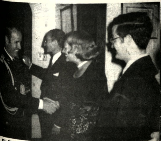
El Embajador de España Eduardo García Ontiveros, ofreció una recepción al cuerpo diplomático de ministros de Estado y demás personalidades políticas y sociales, con motivo de conmemorar el Día de la Hispanidad.