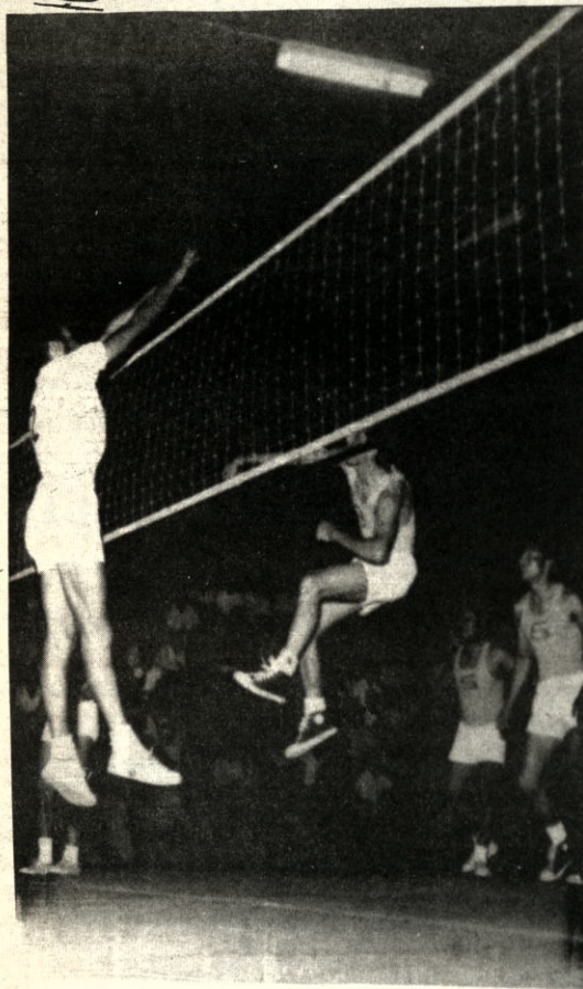
Del Nacional de Vólibol. Un cruceño ensaya un mate, mientras un chuquisaqueño trata de bloquear la acción del cambia. La competencia vólibolista continúa en la capital oriental.

El rol de pruebas será el siguiente: 200 metros estilo espalda (varones mayores), 200 metros libre (damas mayores), 50 metros pecho (varones mayores A), 100 metros libre (damas mayores B), 200 metros libre (varones mayores B), 100 metros libre (damas mayores A), 50 metros espalda (varones infantiles B), 200 metros combinado individual (damas mayores), 50 metros libre (varones infantiles A), 100 metros mariposa (damas juveniles) y 100 metros pecho (varones juveniles).