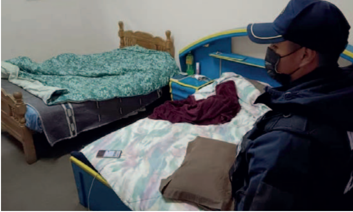
Varias señoritas que brindaban el servicio sexual y preservativos fueron encontrados dentro el lenocinio