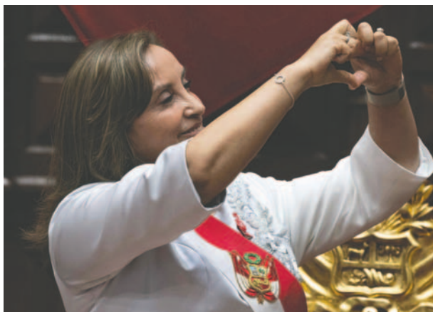
La presidenta de Perú, Dina Boluarte, ofrece un discurso ante el Parlamento este domingo en Lima (Perú)

Según datos del Instituto Nacional de Estadística e Informática (INEI), el porcentaje de la población