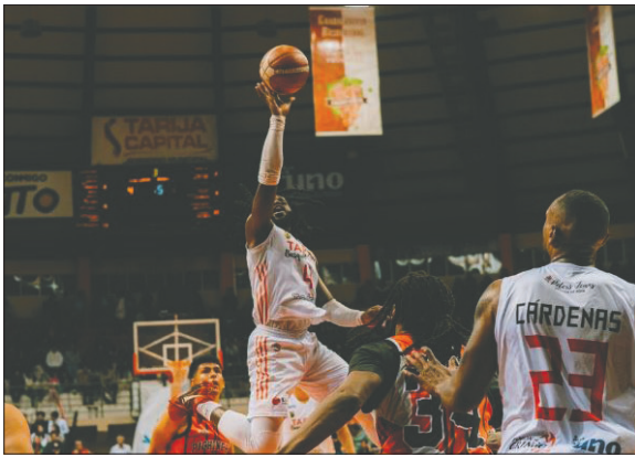
Tarija Básquet sigue dando de qué hablar en el campeonato / TARIJA BÁSQUET

El viernes, en el coliseo "Ciudad de Potosí", Leones se impuso por 69-71, mientras que el sábado, en el mismo escenario deportivo, ganó por 65-81.