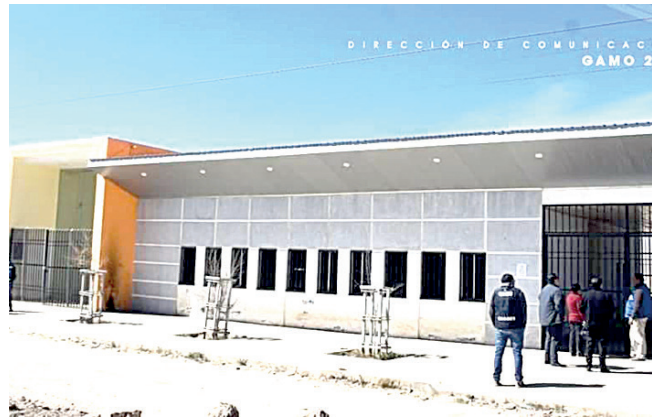
Infraestructura del Centro de Salud Pumas Andinos no está en funcionamiento

Mientras tanto, los vecinos de la urbanización Pumas Andinos continúan recibiendo atención en salud en una vivienda adaptada para su funcionamiento, sin embargo, esta no es adecuada puesto que la mayoría de los servicios están en espacios compartidos.