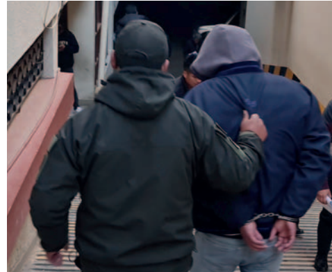
El sujeto fue aprehendido y el vehículo secuestrado para fines investigativos

"Diprove ha remitido un aprehendido al Ministerio Público... han identificado un vehículo cuya placa no le correspondía, a partir de eso empiezan a detener el motorizado, piden la licencia al conductor y este en lugar de entregárselo les entrega un memorándum y se idéntica como funcionario po-