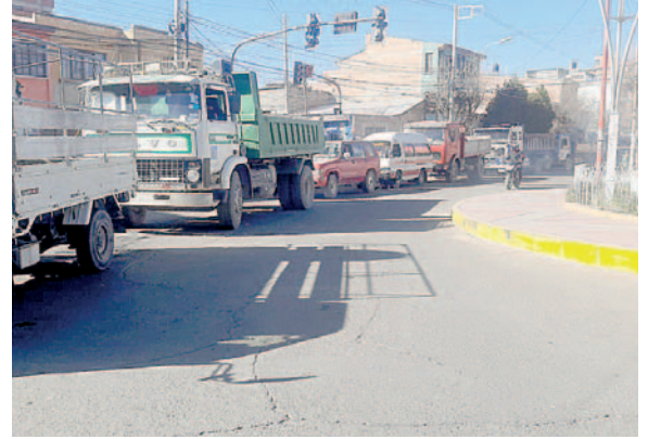
Se registran largas filas en los surtidores de Oruro

Paralelamente para hoy 29 de julio, el sector del Transporte