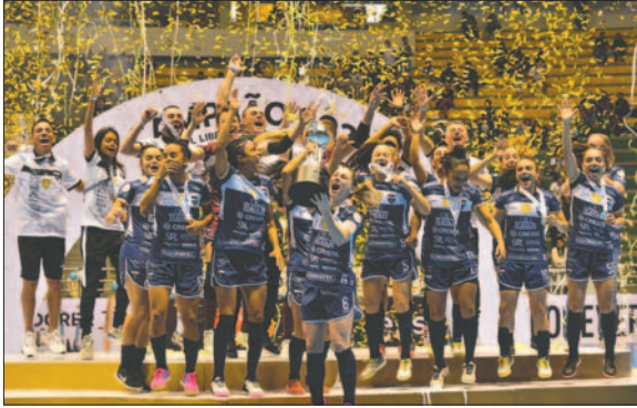
Cascavel demostró ser el mejor elenco del certamen

En el tercer puesto, Always Ready goleó a Exa Ysaty (Paraguay)