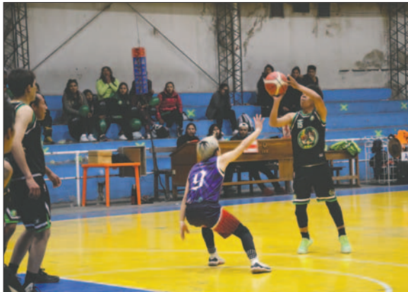
Agronomía se llevó la victoria con un score ajustado

El desenlace de estos encuentros definirá a los nuevos campeones de la categoría de ascenso del torneo de la AMBO, prometiendo grandes emociones y espectaculares jugadas en la cancha "Luis Lazzo Quinteros".