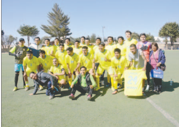
VHSR sumó un triunfo ajustado sobre La Cantera FC

el marcador parcial de 2-0 concluyó el primer tiempo del partido.