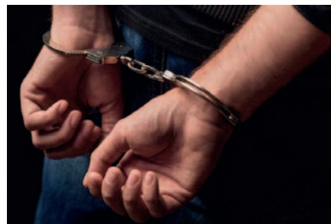
El ahora sentenciado cumplirá su condena en el penal de El Abra /REFERENCIAL

El hecho ocurrió el 17 de enero de 2023, cuando la adolescente se encontraba en su departamento junto a sus hermanos menores.