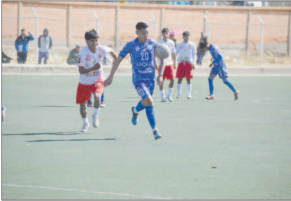
Escara y Aurora sellaron un empate en un encuentro trabado