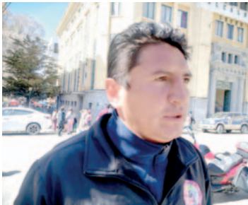
Padres de familia preocupados por el comportamiento de los estudiantes /LA PATRIA