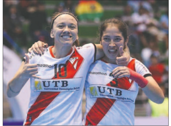
Premio de consolación para Always Ready llegando al podio del campeonato

En las demás posiciones, La Unión (Ecuador) quedó en quinto lugar tras vencer a Llaneros (Colombia) por 5 a 2. Tigres Futsal (Venezuela) ocupó el séptimo puesto al derrotar a Peñarol (Uruguay) por 4 a 2, y Deportivo JAP (Perú) se ubicó en la penúltima posición después de imponerse a Universidad de Chile por 3 a 0.