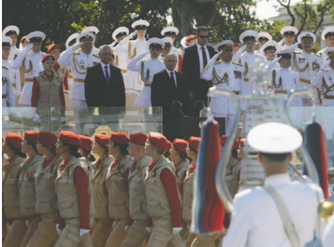
Rusia avanza con el desarrollo de sistemas de misiles ante las acciones de Estados Unidos

La Casa Blanca anunció este mes que Estados Unidos comenzará a partir de 2026 en Alemania el despliegue gradual de sus armas de largo alcance en