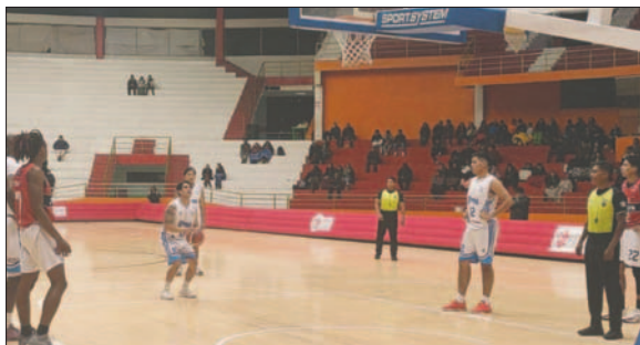
Leones está a un paso de volver a disputar una final de la "libo"

El tercer enfrentamiento está programado para este martes a las 20:00 horas en el Ciudad de Potosí, donde se jugarán los otros dos partidos si son necesarios: el miércoles 31 de julio y el viernes 2 de agosto.