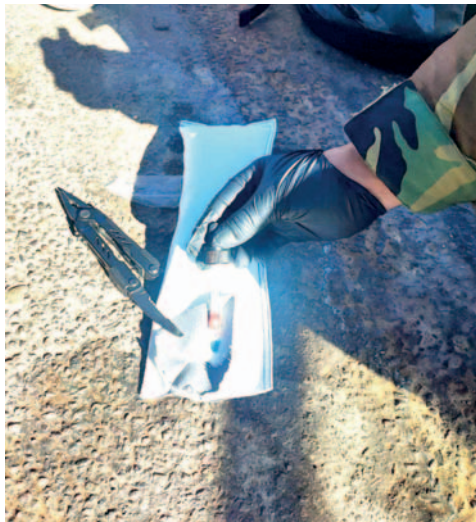
Agentes antinarcóticos confirmaron que ambos colombianos llevaban cocaína

Los operativos antinarcóticos realizados por la Fuerza Especial de Lucha Contra el Narcotráfico (Felcn) permitieron la identificación de un hombre y una mujer que se encontraban en actitud sospechosa, trasladándose