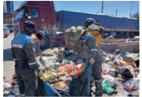
No habrá recojo de residuos sólidos esta jornada

"San Cristóbal" de Oruro ha anunciado un paro departamental movilizado de 24 horas para este lunes. Esta medida de protesta se debe a la falta de diésel y gasolina, así como a la falta de atención por parte del Gobierno central.