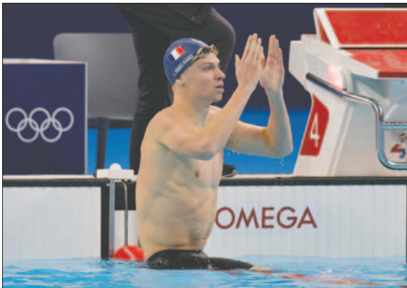
El francés Léon Marchand compete en la final de 400m Estilos Individual Masculino

La plusmarca que finalmente se le escapó por tan solo 45 centésimas, no empaña la magnífica actuación de Léon Marchand, quien ya tiene la primera de las cuatro medallas de oro que busca ante su público en los Juegos de París.