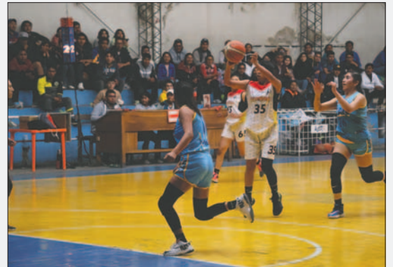
Alemán no se quedó atrás y dio un buen juego

Con esta victoria, CAN logra igualar la serie final por lo que se tendrá un cotejo más entre ambos quintetos para definir al elenco que se corone campeón en la categoría juvenil damas.