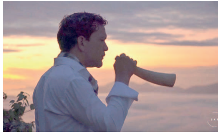
El 30 de julio, JAS Compositor culminará su gira en el Salar de Uyuni

Como última etapa en Uyuni, los invitados llegaron un par de días antes para vivir actividades de preparación para la ofrenda musical. Esto incluyó un proceso de conexión