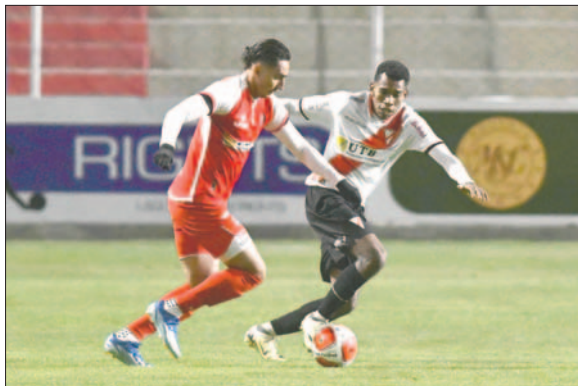
La "U" de Vinto sorprendió a Always Ready en su reducto