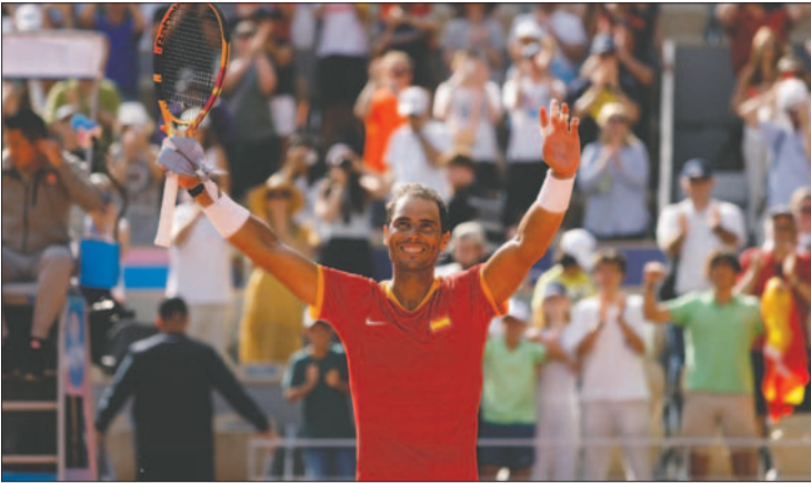
Nadal avanza dentro de los Juegos Olímpicos y se cita con Djokovic

La fe, el empuje, santo y seña del ganador catorce veces en París, le acercó al arreglo. Rompió y sacó para igualar. Pero no le aprovechó. Le falta continuidad, alargar el esfuerzo. Fucsovics no se vio en otra. Igualó el encuentro.