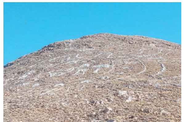
Ya en fase de pintado de las piedras del escudo nacional

La DSA del Gobierno Autónomo Municipal de Oruro (GAMO), solicitó el apoyo de la Segunda División del Ejército para las tres fases de revitalización del escudo considerado el más grande de Bolivia, según Cepeda este símbolo