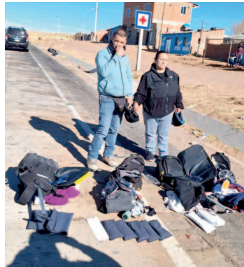
La Felcn aprehendió a ambos individuos y los remitió a la Fiscalía

Al llevar a cabo un Dispositivo Estacionario