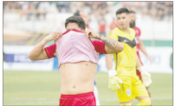
Faltó un poco de serenidad en GV San José para conseguir algo más en este encuentro