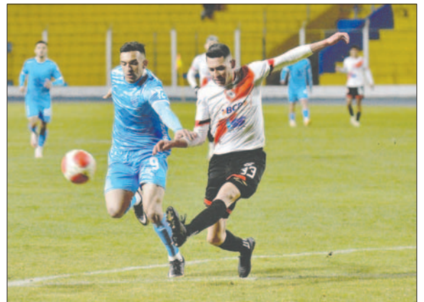
Nacional Potosí frenó en seco al conjunto paceño