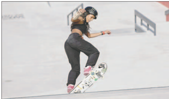
Con 16 años Rayssa Leal terminó en el podio del Skateboarding

"Parece que estaba en Río de Janeiro. En la semifinal tuve un poco de presión, no de la mala, pero presión porque quería que todos los que estaban aquí lo celebraran por todo lo alto", concluyó.