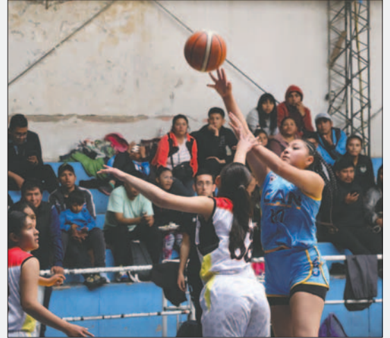
CAN luchó por conseguir llevarse la victoria