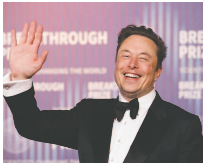
Fotografía de archivo fechada el 14 de abril de 2024 del CEO de Tesla, Elon Musk en una ceremonia en Los Angeles, California, (EE. UU.).

ser mujer de ascendencia india y jamaicana.