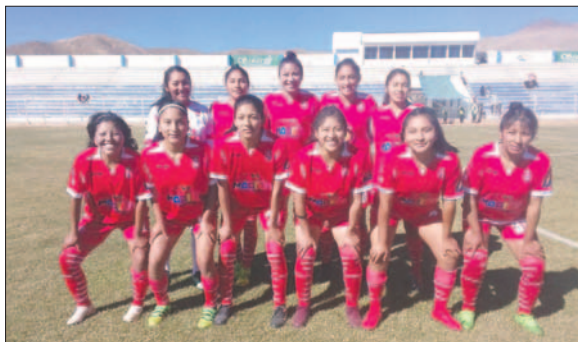
Independiente hizo respetar la casa con un buen triunfo

En la vereda del frente, GV San José cosechó otra derrota más siendo uno de los elencos de todo el certamen de recibir más goles, el conjunto orureño ya se encuentra sin chance de buscar la clasificación y los encuentros que le restan servirán solo por cumplir con el torneo que de a poco va llegando a su conclusión en su primera fase, de cada uno de los grupos conformados clasificarán los dos primeros a la siguiente instancia del certamen.