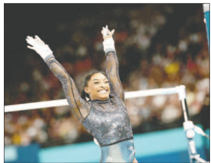
La estadounidense Simone Biles en el Bercy Arena en París, Francia

Francia acusó la presión de ser local y, con una actuación plagada de errores por parte de su estandarte, Melanie de Jesús dos Santos, quedó fuera de la final reservada a los ocho mejores equipos. Tampoco estará Dos Santos en la final del concurso individual, el peor resultado que podía imaginar el equipo galo.