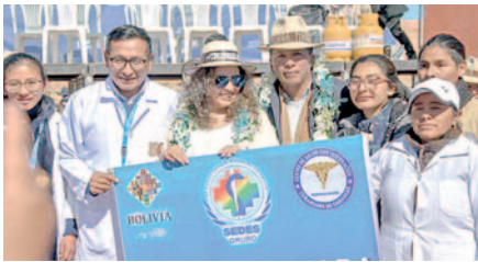
Gobierno inicia construcción de Centro de Salud en Curaguara de Carangas