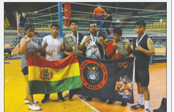
El equipo Invictus dejó en alto el nombre de Oruro

De momento la participación deja satisfechos a los entrenadores y se espera que pronto se pueda contar con más eventos de esta índole para que los boxeadores locales sigan mostrándose en otros escenarios, pronto se tendrá otros eventos a nivel nacional.