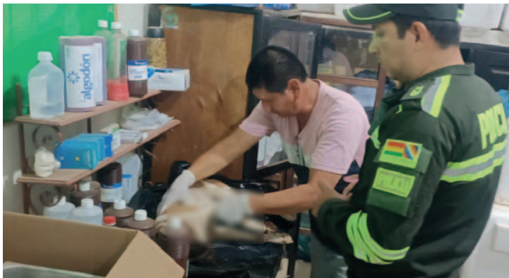
El veterinario junto a un policía examinan al can que sufrió lesiones con una cadena por el sindicado

Las autoridades han reiterado su compromiso en la lucha contra el maltrato animal e instan a la ciudadanía a denunciar estos actos crueles que afectan la vida y bienestar de los seres vivos.