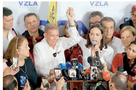
El candidato a la presidencia de Venezuela, Edmundo González Urrutia (c-i), y la líder opositora venezolana, María Corina Machado (c-d), dan declaraciones tras conocer los resultados de las elecciones presidenciales

El aspirante opositor quedó con 44,2% del respaldo popular, según los datos difundidos por Elvis Amoroso, presidente del CNE, quien atribuyó el retraso en la comunicación de resultados a una "agresión" al proceso electoral. No dio más detalles sobre ese punto.