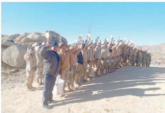
Entre hoy y mañana se espera la conclusión de los trabajos

“Con un avance del 80%, calculamos terminar el lunes; el mantenimiento y revitalización del escudo nacional instituido en