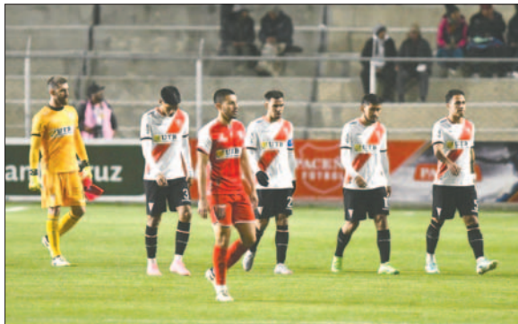
El cuadro "millonario" anda de capa caída