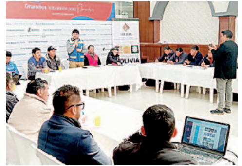
Se encamina el proyecto de construcción de la Plaza del Bicentenario en Oruro

"Como orureños, estamos comenzando a trabajar en esta obra junto