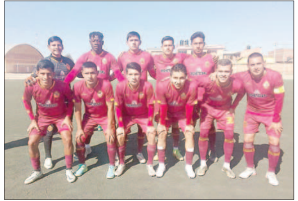
CDT Real Oruro esta imparable en el torneo

Oruro suma 21 puntos en siete partidos, mientras que Oruro Royal se queda en la cuarta posición con 13 puntos.