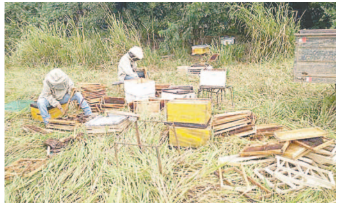
Los vecinos agresores se dedican a criar abejas /OPINIÓN REFERENCIAL

"Los vecinos tienen un criadero de abejas en un lote cerca de su casa donde se les escaparon las abejas y