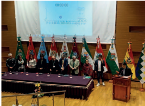
Mesa redonda con personalidades notables de la música académica

Cámara de Diputados y la Brigada Parlamentaria de La Paz expresaron su alegría por esta actividad y manifestaron la importancia de que espacios como estos se repliquen para seguir impulsando el talento, especialmente de los jóvenes y niños.