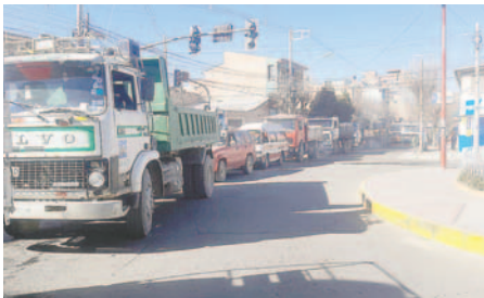
Largas filas en los surtidores de la ciudad de Oruro