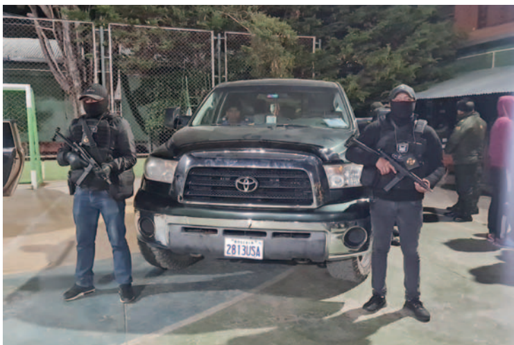
Agentes del CEIP custodiaban la camioneta incautada