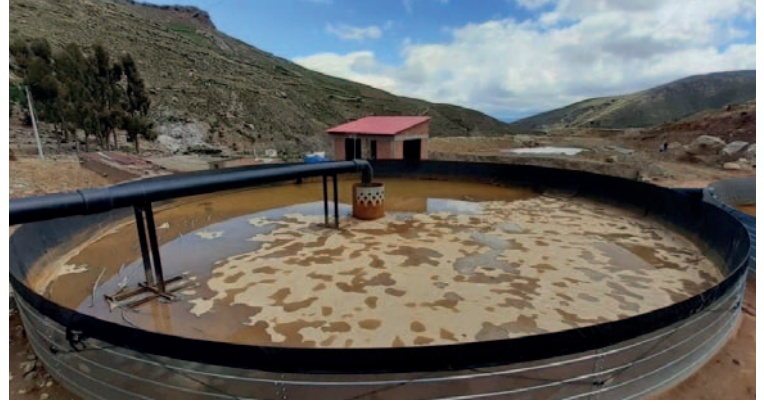
Los representantes de regantes de Macha Pocoata no cesan en su lucha por un ambiente limpio y seguro para sus cultivos

Los representantes piden a las autoridades com-