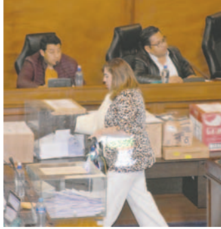
La Comisión Mixta de Constitución sesionó anoche

En el documento se detalla que, debido a que no se alcanzó la cantidad mínima de nota en los exámenes de las postulantes femeninas, fue necesario utilizar los exámenes para lograr la equidad de género establecida por la norma. Por departamen-