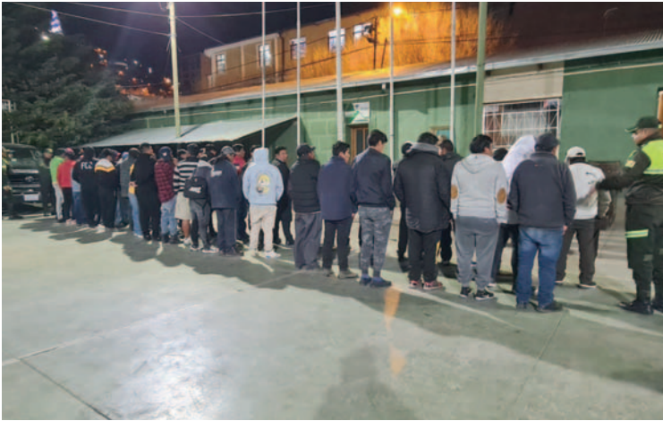
Decenas de personas fueron arrestadas