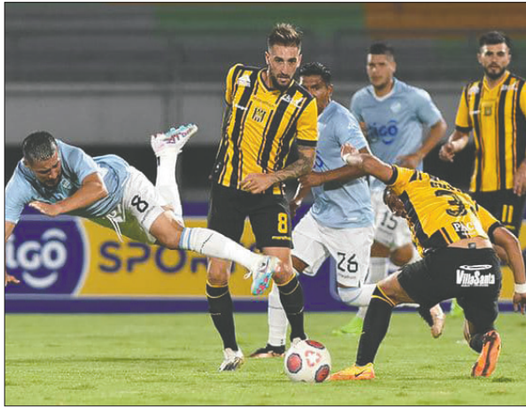
El aurinegro quiere sanar sus heridas a costa de Aurora