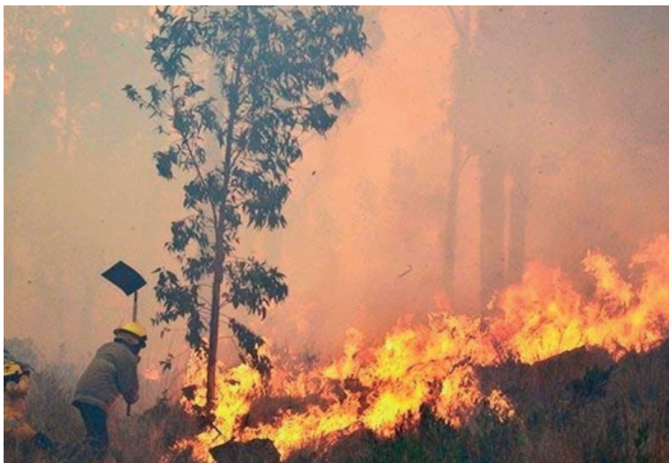
Incendios forestales que azotan la Chiquitania /E/D

nos, bomberos, militares y voluntarios que trabajan en la sofocación del incendio forestal registrado en diferentes municipios de Santa Cruz.