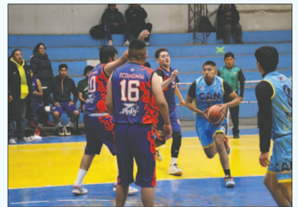
CAN llega a la final con buenos argumentos de juego

En la víspera también debía jugarse el encuentro de ida por el título en la categoría cadetes varones entre CAN y Alemán, pero el encuentro fue suspendido, no se dio una explicación clara del motivo dejando a los aficionados a la espera de una nueva fecha para este emocionante partido.