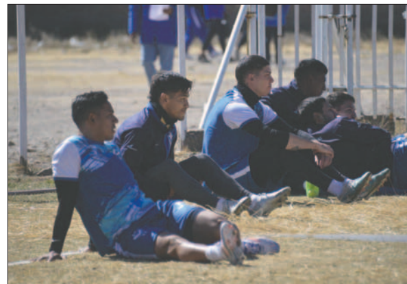
El equipo está listo para el viaje a Montero

oficialización de su vinculación con GV San José, además de su habilitación, lo cual se concretó en estos días por lo que espera que sea tomado en cuenta para el encuentro de este domingo.