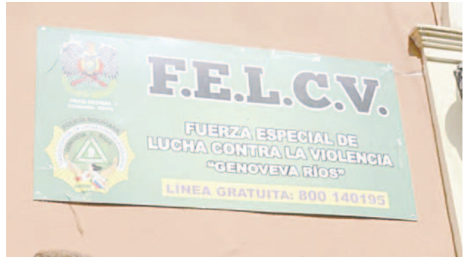
La Felcv de Cochabamba investiga este hecho de agresión sexual

Según el informe policial, el sujeto fue denunciado por los delitos de abuso sexual y violación contra la joven pasante que trabajaba en el medio de comunicación