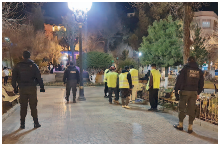
Los infractores realizaron el barrido y limpieza de la Plaza 10 de Febrero