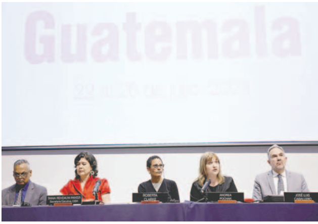
Representantes de la Comisión Interamericana de Derechos Humanos (CIDH) participan en una conferencia de prensa este viernes en Ciudad de Guatemala (Guatemala)