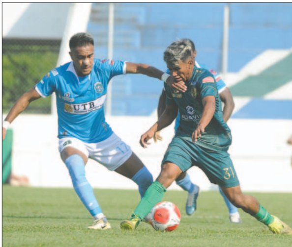
San Antonio no puede salir de su mal momento en el certamen