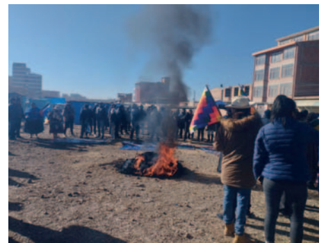
Simpatizantes de Evo Morales instalaron una vigilia en la zona de Senkata, Distrito 8 de la ciudad alteña

Morales fue declarada persona non grata en El Alto y su presencia para su autoproclamación como candidato presidencial fue rechazada por diversas organizaciones sociales.