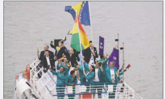
La tricolor nacional flameó imponente por el Sena