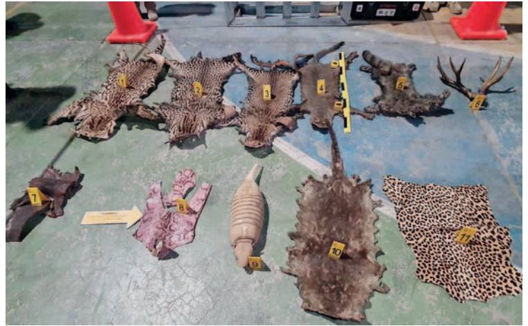
Las pieles pertenecían a distintos animales de la fauna silvestre

El coronel Claire destacó que este operativo es parte de los esfuerzos continuos para cumplir con su mandato institucional, enfocado en la prevención del delito, la concienciación pública y la reducción de la inseguridad para fomentar un sentimiento de bienestar y tranquilidad entre la población. Por lo tanto, continuarán realizando operativos similares en el futuro para mantener la seguridad y el orden en la comunidad.