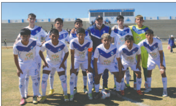
Gran triunfo del cuadro orureño en su reducto

Uno de los aspectos que empañó la tarde deportiva fue el arbitraje con algunas decisiones cuestionables que afectaron el desarrollo normal del partido. Los técnicos de ambos equipos coincidieron en señalar que se debe dar mayor seriedad al certamen de esta categoría, ya que los errores arbitrales son recurrentes en este tipo de encuentros.