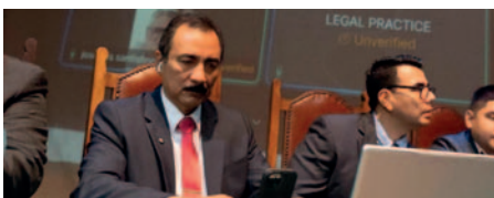
La audiencia virtual fue proyectada en vivo en una pantalla en el Paraninfo Universitario de la UAGRM

El proceso contra los líderes cruceños se originó a partir de una denuncia de la Central Obrera Regional (COR) de El Alto el 13 de noviembre de 2022. Se les acusa de supuestos delitos de resoluciones contrarias a la Constitución y a las leyes, racismo y discriminación, asociación delictuosa, y desórdenes o perturbaciones públicas, entre otros.