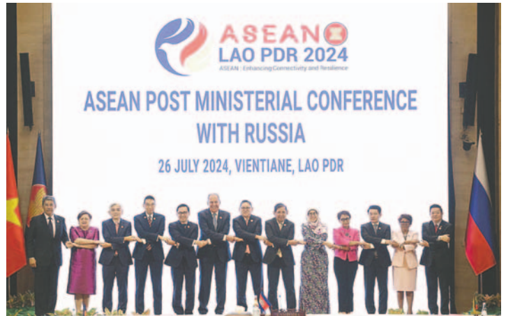
Los Ministros de Asuntos Exteriores y representantes de la Asean durante la Conferencia Post Ministerial Vientiane, Laos, el 26 de julio de 2024

Sin embargo, el Gobierno chino reclama la práctica totalidad del mar de China Meridional, rico en recursos naturales y una ruta esencial para el comercio marítimo, a pesar de que un tribunal internacional dictaminó en 2016 que su