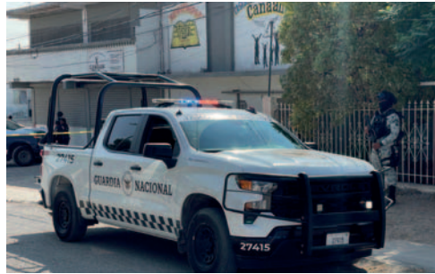
Elementos de la Guardia Nacional resguardan la zona donde cuatro personas fueron asesinadas dentro de una vivienda

Santa Teresa es una población pequeña que se encuentra en Nuevo México, Estados Unidos, que tiene un aeropuerto propio, y que colinda con una zona de Ciudad Juárez llamada San Jerónimo, en donde