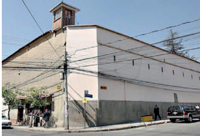
El sujeto cumplirá condena en el penal de San Pedro

El fiscal del caso, Reynaldo Chambi, detalló que el suceso tuvo lugar aproximadamente a la 01:00 de la madrugada del 24 de mayo, cuando Adán discutió con su padre en su domicilio. Tras agredirlo con un hacha hasta causarle la muerte, huyó del lugar. El cuerpo fue descubierto por el hijo mayor de la víctima,