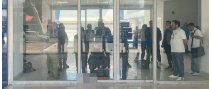
La primera de las sucursales desprecintadas está ubicada en la zona del primer anillo, en la capital cruceña

Según el reporte de los abogados, se descarta que estas sucursales de la entidad intervenida por