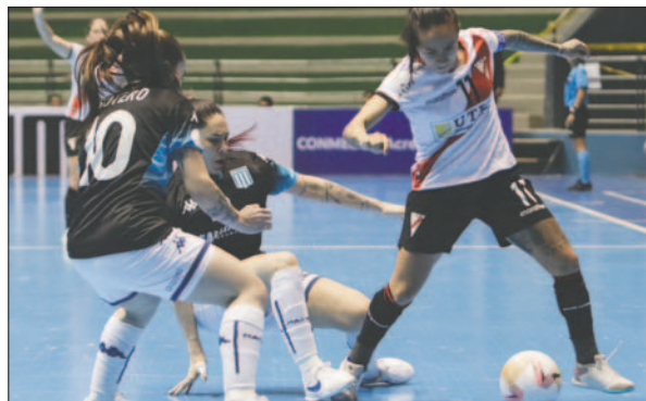
Always Ready volverá a enfrentar a Cascavel, esta vez en semifinales

Deportivo JAP y Universidad de Chile abrirán la jornada sabatina a las 12:00 con el enfrentamiento entre los quintos de cada serie, mientras que Tigre Futsal se enfrentará a Peñarol a las 14:00.