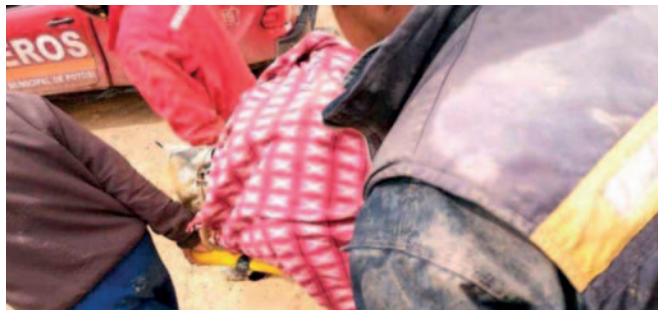
Potosí ha registrado cuatro víctimas menores de edad dentro de minas en lo que va del año

Los informes policiales actuales indican un total de 82 muertes en minas del departamento de Potosí, según el diario El Potosí. La investigación continúa para asegurar el cumplimiento de las normativas laborales y prevenir futuras tragedias.