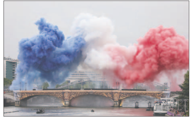
Francia mostró toda su magia en una puesta en escena sin precedentes / PARÍS 2024

incluso en referéndum, rechazan organizar los JJOO. Munich, Roma, Estocolmo, Cracovia, Hamburgo... no lo vieron claro. La vieja Europa, con París a la cabeza, se resiste a dejar esta postal en manos de otros continentes y países emergentes.