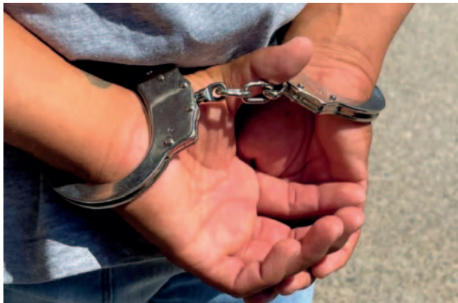
El sujeto fue enviado a prisión por violar a su hijastra / REFERENCIAL

Inmediatamente, la institución presentó el caso ante la Fuerza Especial de Lucha Contra la Violencia y posteriormente al Ministerio Público, que inició un proceso penal y solicitó la aprehensión del sindicado.