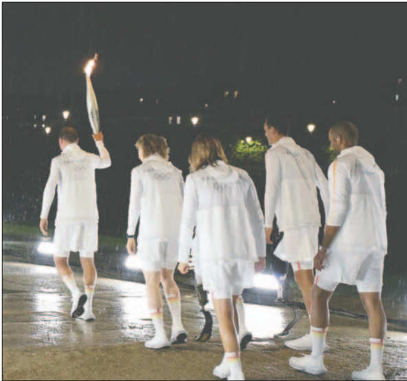
Un momento especial donde se muestra que el deporte es inclusión y hermandad / PARÍS 2024

La torre Eiffel fue el gran reclamo de la noche. Las ceremonias agotan, por eso muchos se quedaron a cubierto y lo vieron por televisión. Son varias las ciudades cuyos habitantes,