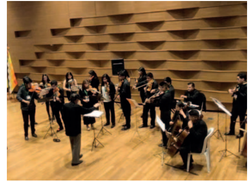
Camerata Oruro presentándose en la clausura

entre ellos, y posteriormente con el público, hablaron sobre la realidad actual de la música académica en Bolivia, los retos que enfrentan los músicos y cómo se puede impulsar la excelencia musical en el país. Representantes de la