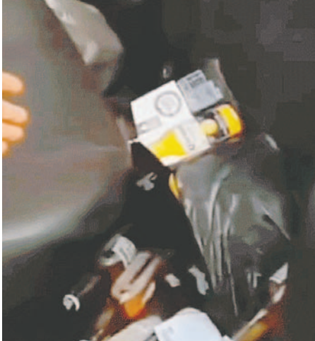
Se hallaron botellas dentro del vehículo