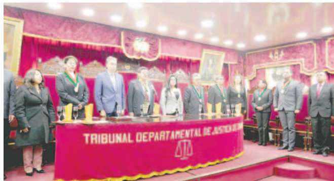
Solemne Sesión de Honor por el Día del Juez Boliviano

Asimismo, mencionó que gracias al Consejo de la Magistratura,