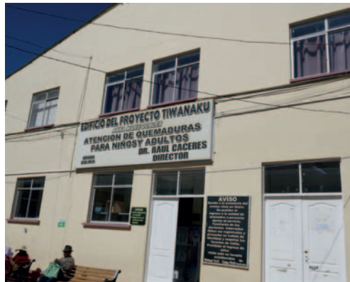
Unidad de Quemados es la esperanza de pacientes con quemaduras

Tras ser reanimada por su padre, la menor fue llevada de inmediato