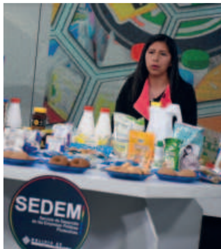
La gerente de Subsidios del Sedem presentó los nuevos productos.

El Sedem incorporará estos nuevos productos una vez que las empresas cumplan con los requisitos del envase primario. Esto permitirá que estén disponibles en todas sus sucursales.