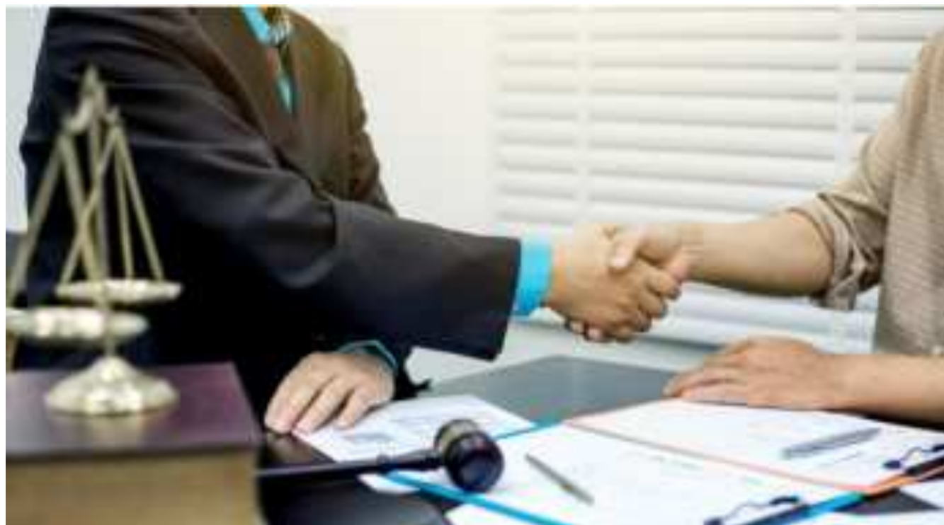
La conciliación, como salida alternativa al juicio penal.