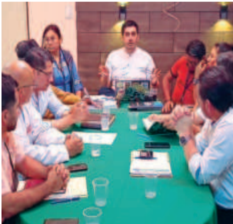
La reunión desarrollada en Santa Cruz.