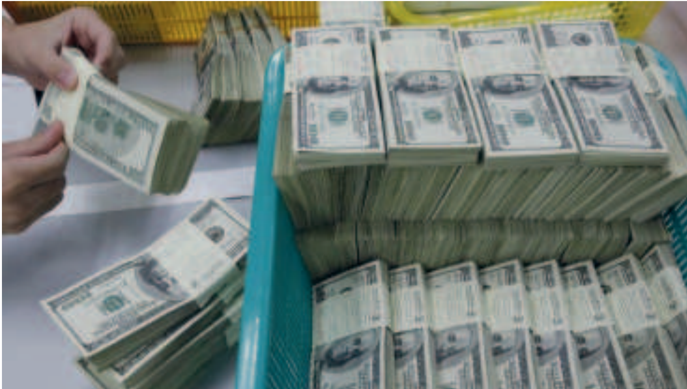
Fajos de billetes de la moneda norteamericana, utilizada en gran parte del mundo.