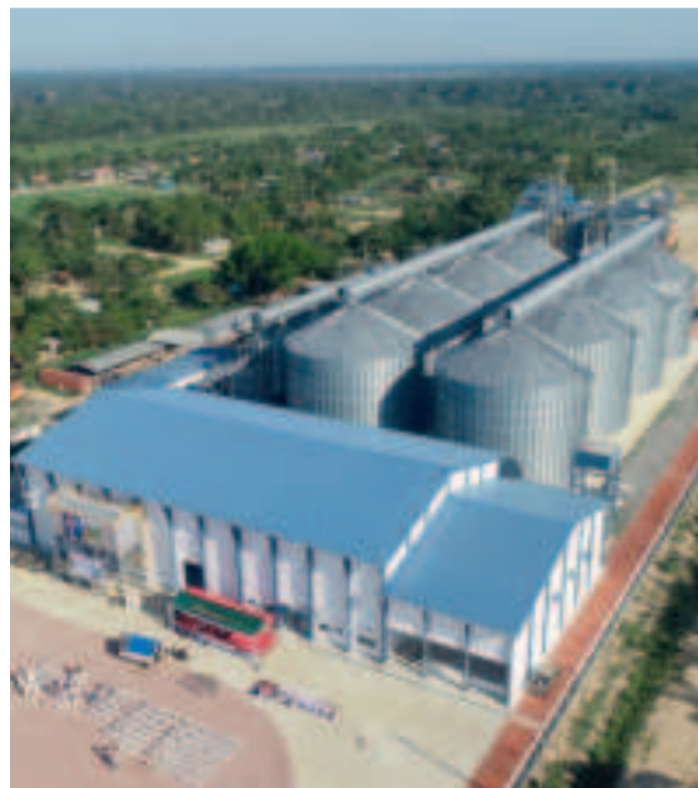
Una de las plantas industriales que se construye en el país.

“Parece que a los legisladores no les interesan los productores, ahí tenemos el desafío de exigir para que aprueben esos recursos para el bien de la agricultura. En total son alrededor de 800 millones de dólares que hasta ahora no aprueban”, lamentó.