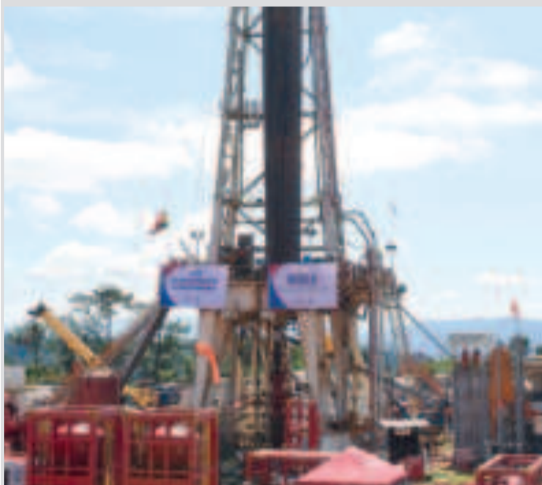
El pozo Mayaya Centro-X1 IE está ubicado en Caranavi, La Paz.