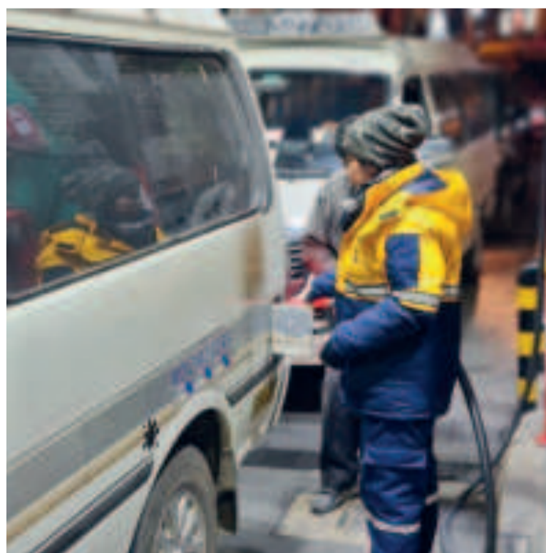
El carguío de combustible en una estación de servicio de La Paz.

MIL LITROS de combustibles despacha la estatal petrolera YPFB en La Paz.