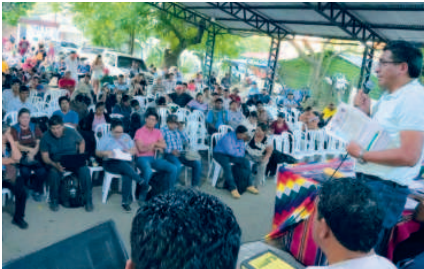
El ministro Huanca durante su intervención en el ampliado.

“ Hermanas y hermanos, tenemos que producir, garantizar la materia prima para nuestras industrias. Hay muchos factores para seguir mejorando nuestra producción. ”