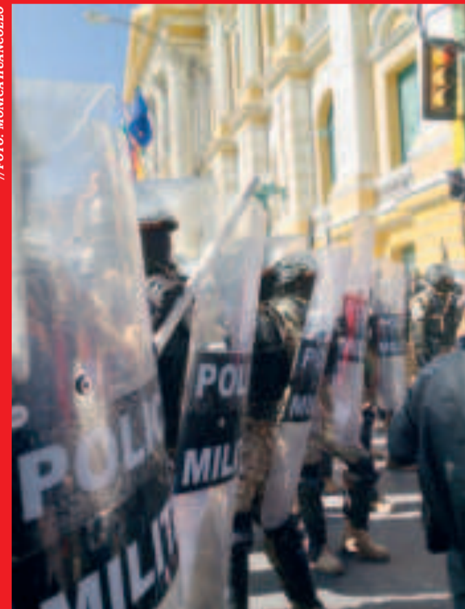
Soldados militares en la plaza Murillo, el 26 de junio.