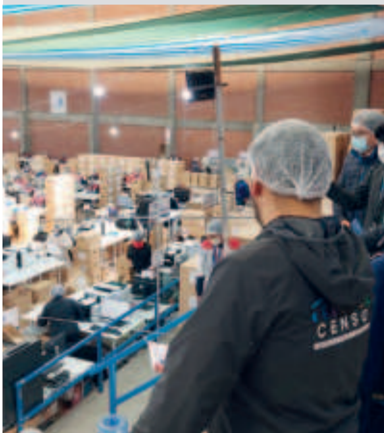
El recorrido del centro de operaciones del Censo 2024.