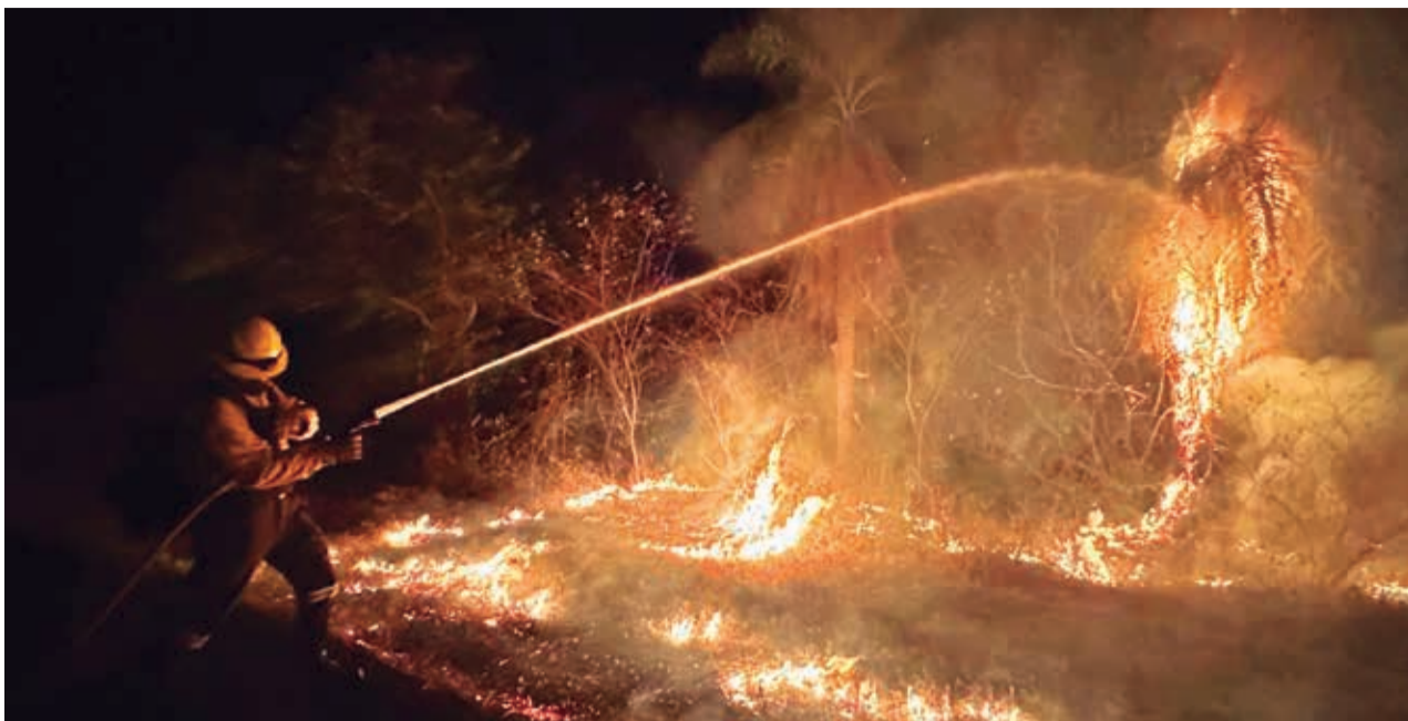
El incendio consume áreas forestales del municipio cruceño de Roboré. STEFFEN REICHLÉ