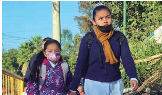
Estudiantes con ropa abrigada por el invierno. HERNÁN ANDÍA

Recomendaciones. Las autoridades piden mantener medidas de bioseguridad, como el uso de barbijo, para evitar los contagios.