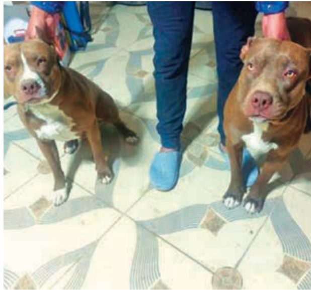
Los dos perros pitbull luego de su captura.