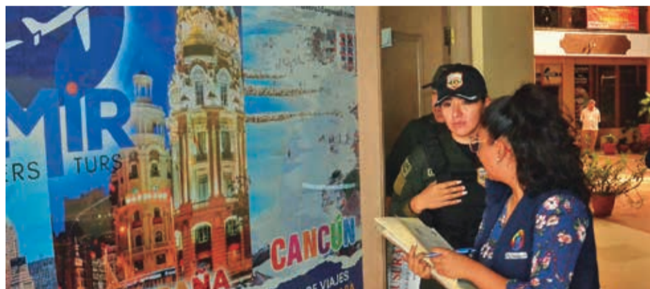
Los controles a las agencias de turismo en Cochabamba. HERNÁN ANDÍA

Tanto maestros urbanos como padres de familia de colegios particulares apoyaron la idea de reponer las clases durante los trimestres, considerando los sábados como una opción viable. Los maestros rurales coordinarán con las distritales.