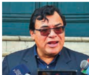
El diputado Jerges Mercado. APG