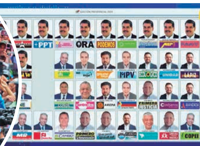
La boleta electoral para los comicios del domingo.