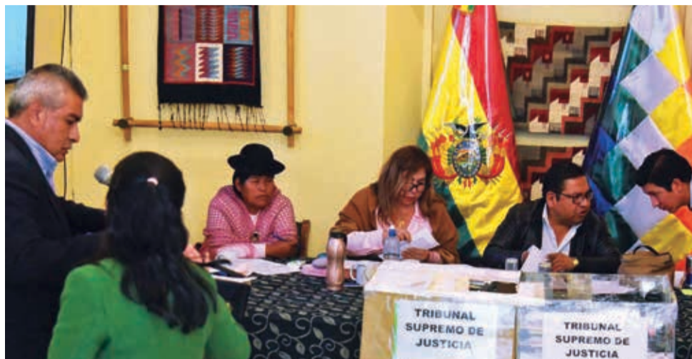
Un postulante durante las pruebas de evaluación oral.