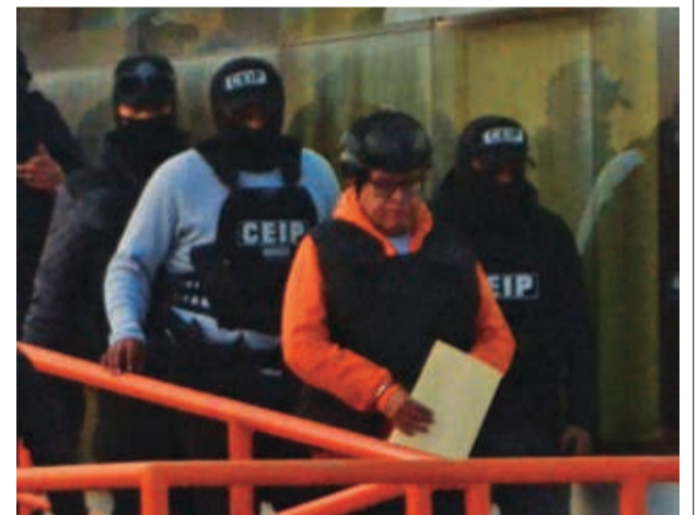
Juan José Zúñiga, ayer en el IDIF de Cochabamba.