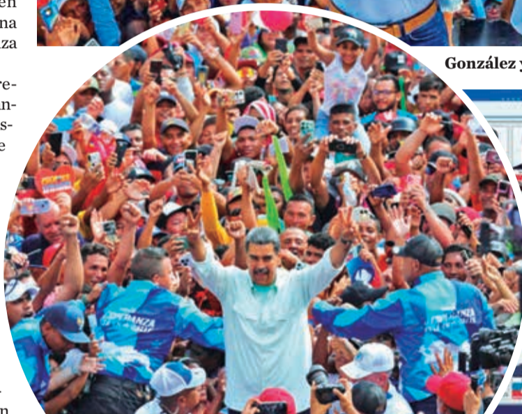
Nicolás Maduro recibe el apoyo de sus seguidores. FPXCV