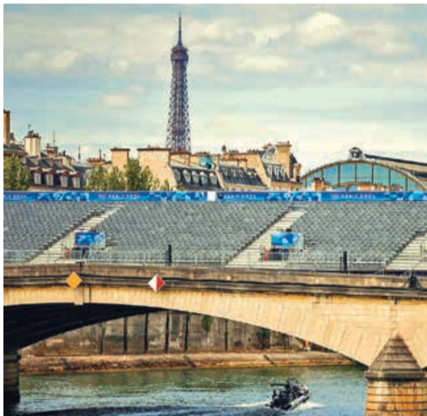
El río Sena, donde se realizará la inauguración hoy.

La Comisión Disciplinaria de la FIFA decidió nombrar a un experto en integridad para que preste su ayuda en investigaciones sobre posibles contravenciones de la reglamentación del organismo, tras los incidentes acaecidos durante el partido entre Argentina y Marruecos, de la primera jornada del torneo masculino de los Juegos de París 2024.