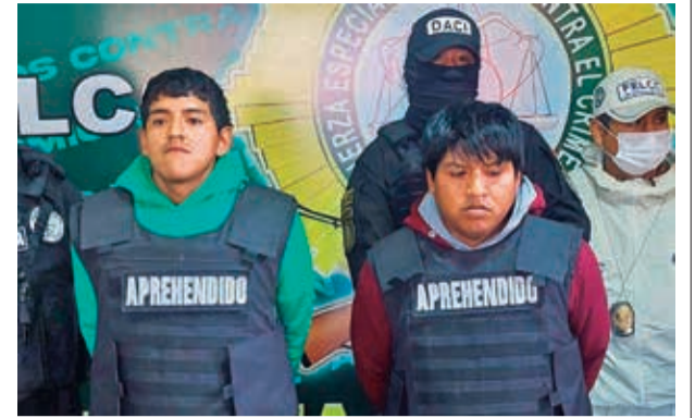
Los posibles asesinos en la Felcc, ayer.

La afectada recibe un tratamiento médico.