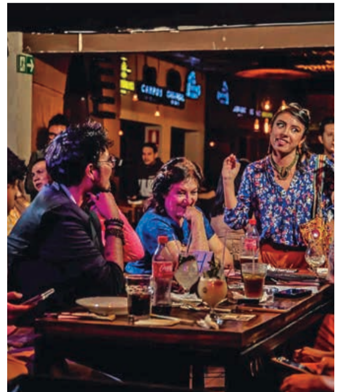
Escenas de una presentación anterior.

Para culminar, se ofrecerá como postre tarta de chocolate con emulsión de vainilla y nuez quemada, crema de limón, naranja y maracuyá. Además, los asistentes podrán disfrutar de una variada selección de tragos y cócteles.