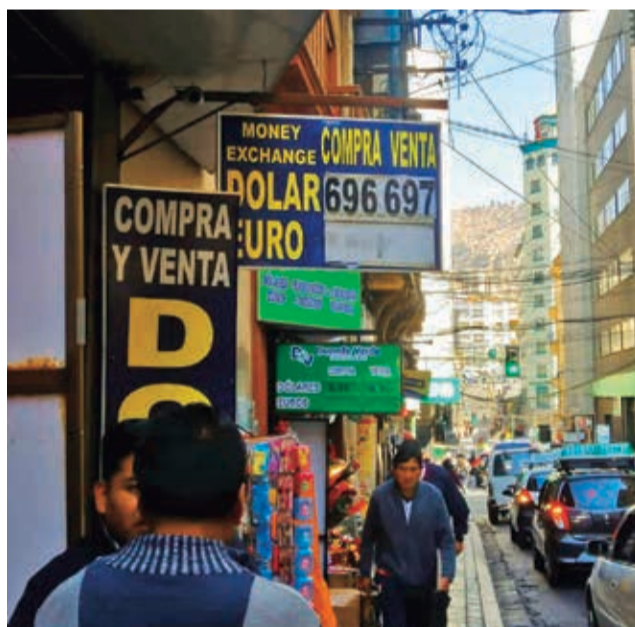
Casas de cambio en La Paz. SERGIO MENDOZA

Los cambistas consultados señalaron que algunas monedas, como el euro y el sol peruano, se comercializan