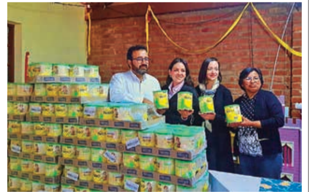
Donación realizada a niños de una fundación.

Omereque, Pasorapa, Arque, Bolívar, Tacapará, Tolata, Tarata, Aiquile, Santiviáñez, Ruyppampa, Vila Vila y Tacopaya son algunos de los municipios.