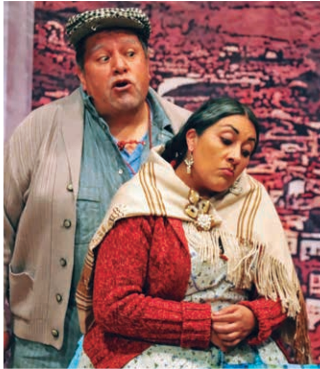
La obra fue presentada en La Paz, el pasado 16 de julio.

En la segunda parte es el desenlace de las historias de las tres protagonistas y de todos los demás personajes de por medio. “La vida da otras oportu-