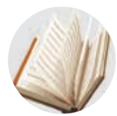
MARÍA FLORENCIA MELO

La autora es miembro de Data Journalist. florencia.melo@statista.com