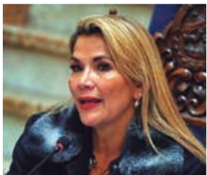
La expresidenta Jeanine Añez.