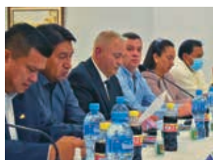
El último Congreso de la FBF. APG

Hoy debía llevarse adelante el Congreso en Cochabam-