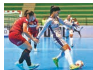
Partido entre Tigres y Always Ready, ayer. @LibertadoresFS

Con este resultado, el Millonario lidera el grupo A con 9 puntos, gracias a