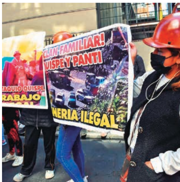
Mineros agredidos protestan en La Paz.

“Dos compañeros han sido baleados en el interior de la mina: uno en la cabeza, otro en el hombro y otro en las costillas”, denunció uno de los coo-