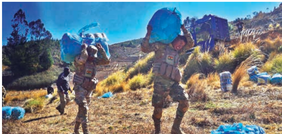
La mercancía de contrabando incautada en Colomi por la Aduana ayer.

MULTIMEDIA Conozca más detalles del tema viendo este video. www.lostiempos.com