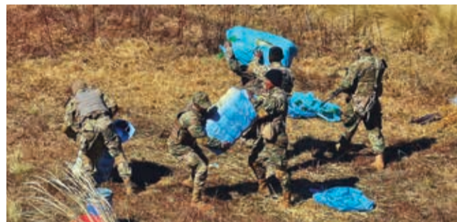
Personal que participó en el operativo anticontrabando.

Según el reporte, se decomisó 150 fardos de ropa usada sin documentación, equivalentes a aproximadamente seis toneladas, que se pretendía ingresar al mercado de