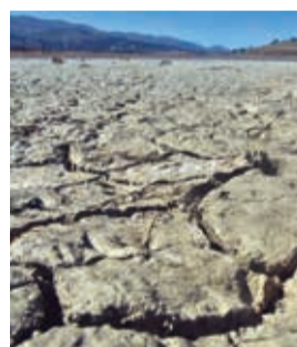
Una laguna seca en Vacas. J ROCHA