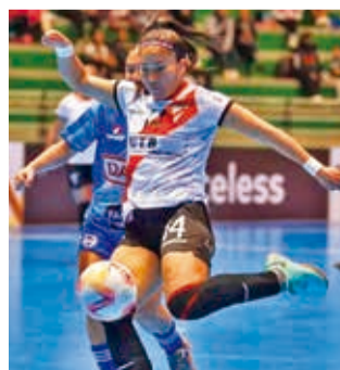
Una escena del partido Always vs. Deportivo JAP.

Restrepo fue autora de un triplete y Lopes aportó con un doblete. Los demás goles fueron anotados por Ana