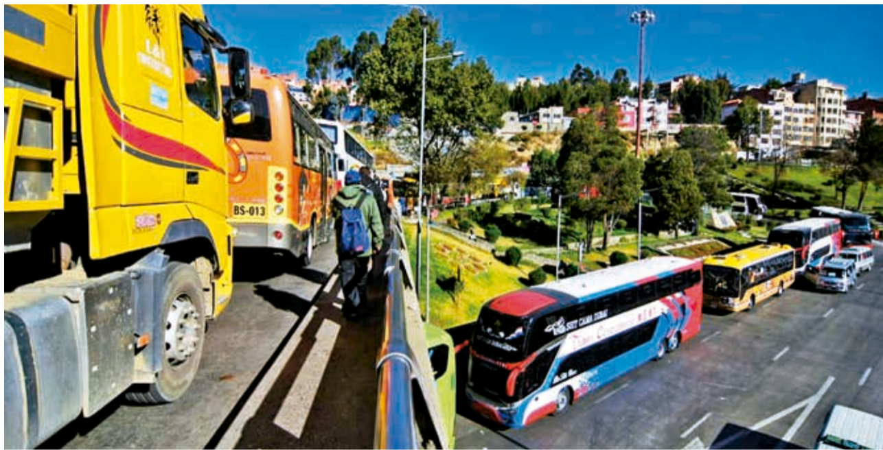
Filas de vehículos en espera de gas en La Paz, en junio pasado.

Economía. El Ejecutivo señala problemas externos e internos que causan especulación de dólares, combustible y algunos productos.