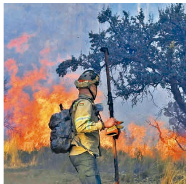
El último incendio reportado en el Tunari, el jueves. D.J.

En 2024 se reportaron 31 incendios en Cochabamba, 16 de ellos en el Tunari. Las autoridades iniciaron las acciones correspondientes para identificar a los responsables y señalaron que los chequeos están prohibidos.