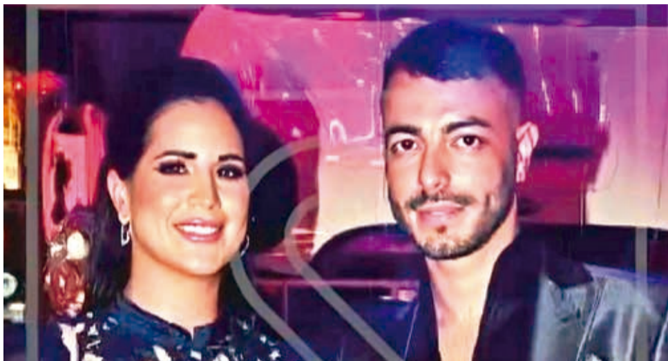
Sebastián Marset, buscado por narcotráfico. CAPTURA MARSET SANTO Y SENA

ESCUCHA EL AUDIO DE LA ENTREVISTA A MARSET www.lostiempos.com