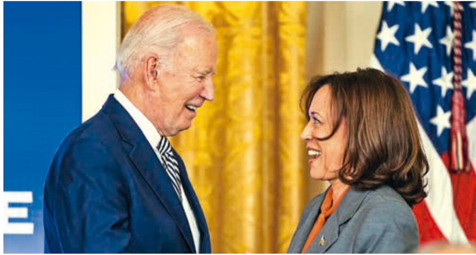
Joe Biden y Kamala Harris.

Unos minutos después, la propia Harris aceptó responsabilidad y afirmó que tiene la intención de “obtener y ganar” la nominación demócrata a la Presidencia de Estados Unidos, aunque en las prime-