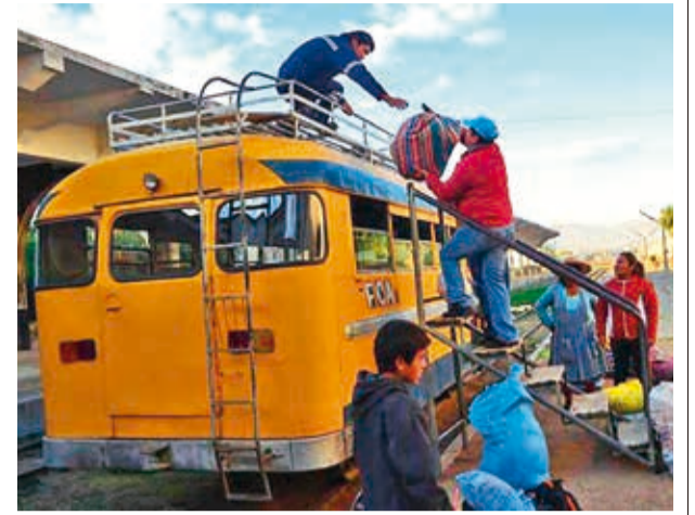
El buscarriil que unía Cochabamba con Aiquile. JOSÉ ROCHA

“Así vamos a poder cambiar la herramienta de trabajo de todos los hermanos transportistas, como yo he hablado con ellos”, señaló.