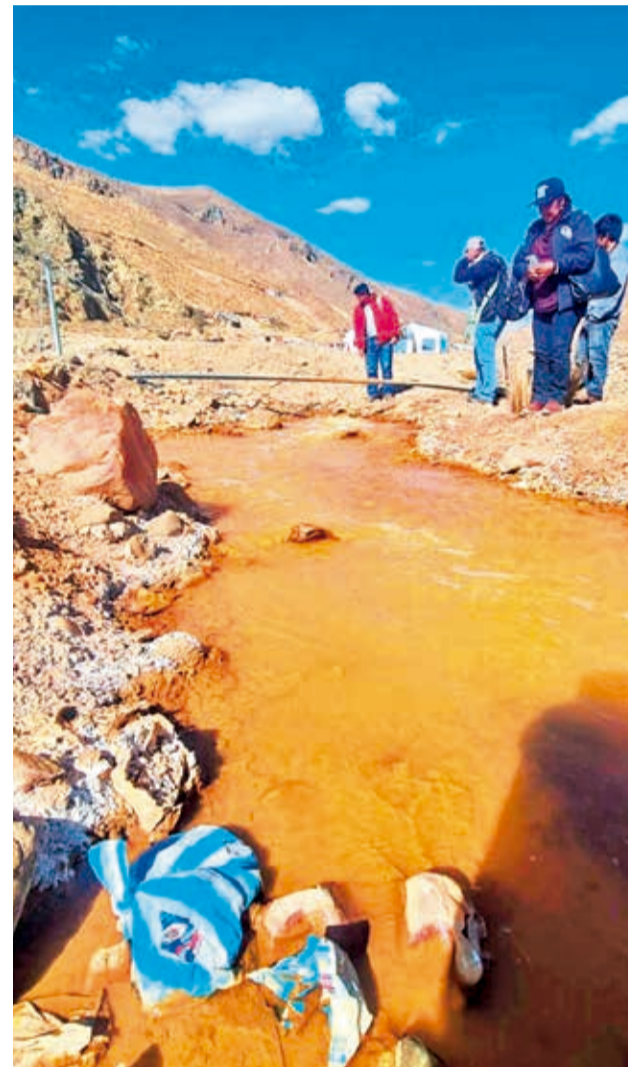
Un riachuelo en la comunidad de Puñaca.

Sin embargo, según Cenda, los estudios no se enfocaron en la salud de los comunarios y las aguas de la zona.