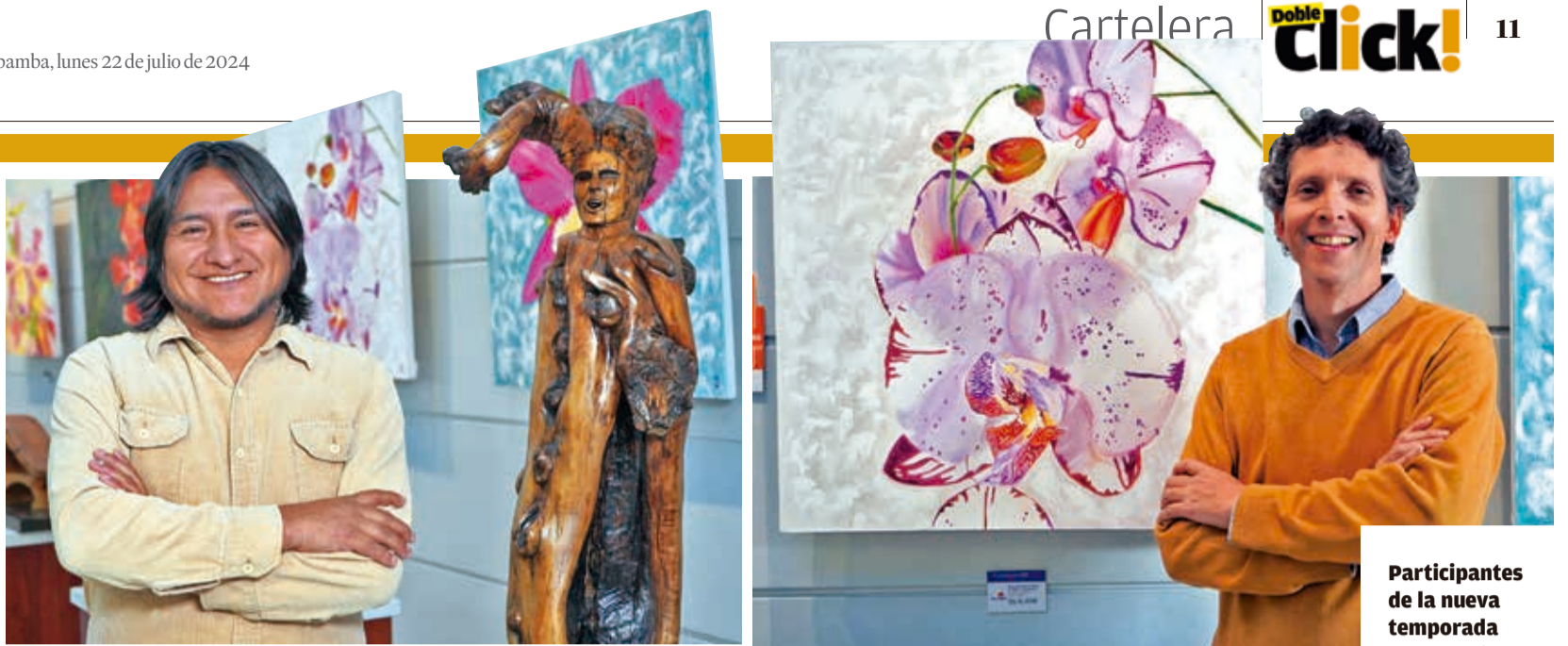
Participantes de la nueva temporada del espacio cultural MIC.