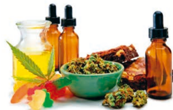
Uso medicinal del cannabis. INTERNET

¿Cómo debería comercializarse en Bolivia el cannabis medicinal? El investigador afirmó que podría ser a través de las farmacias. "Su venta sería con recetas y existirían varias presentaciones: gotas, aceite, mates, destilados, supositorios, cogollo, etc. al igual que en los países donde está legalizado.