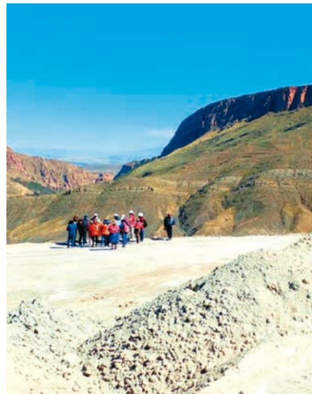
Pobladores de Cantumarca cerca de la zona minera.