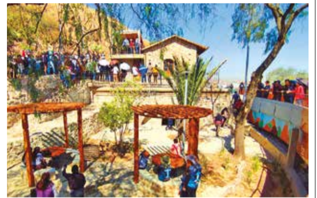
La inauguración de la “Parada Cero”, en San Pedro. D.J.

Entre los resultados presentados se encuentra la atención a más de mil niñas y niños en servicios de Abogacía y Cuidado.