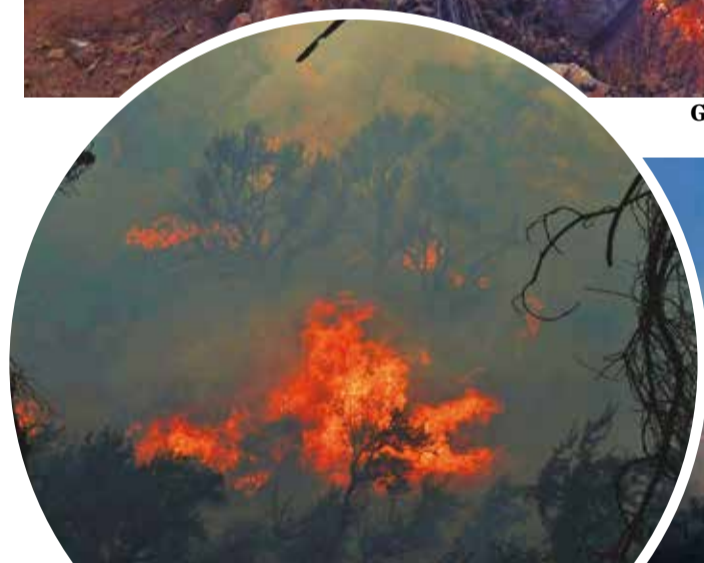
Las llamas alcanzaron áreas boscosas del Tunari.