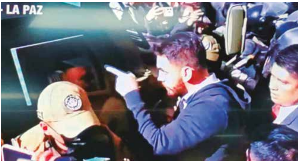
El ministro Del Castillo golpea el vehículo en el que iba Zuñiga, el 26 de junio.

Se desconoce cuál fue el método que usó la Fiscalía para tomar las declaraciones de las autoridades sobre el caso golpe. Si fue un cuestionario escrito, si se presentaron en la Fiscalía, si fue en sus oficinas o si la Fiscalía aplicó el artículo 195 de la Ley 1970, en la que se prevé un "tratamiento especial" para el presidente, vicepresidente, presidente de las Cámaras Legislativas, presidente de la Corte Suprema, presidente del Tribunal Constitucional, fiscal General, Defensor del Pueblo, representantes de misiones diplomáticas, parlamentarios y ministros de Estado.