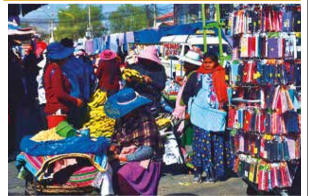
La informalidad predomina en la economía. JOSE ROCHA

Añadió que los trabajos se hacen en el municipio de Alto Beni, fuera de cualquier reserva o área protegida.