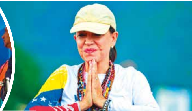
La líder de la oposición venezolana, María Corina Machado.