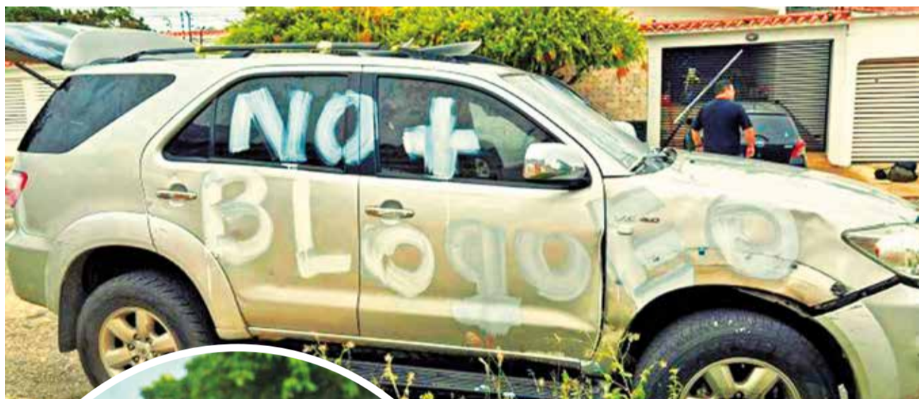
Uno de los vehículos de la líder opositora María Corina Machado que fueron vandalizados con pintura y golpes.

Elecciones. El presidente venezolano acusa a la disidencia democrática de planear "un apagón eléctrico para cambiar el voto del pueblo". La coalición antichavista exige a la Fiscalía investigar ataque contra Machado