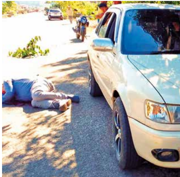
El cadáver fue hallado en la vía pública, ayer. RRSS

El personal de la Fuerza Especial de Lucha Contra el Crimen realizó el levantamiento