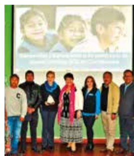
La celebración de un año más en Aldeas SOS. AÑEAS SOS