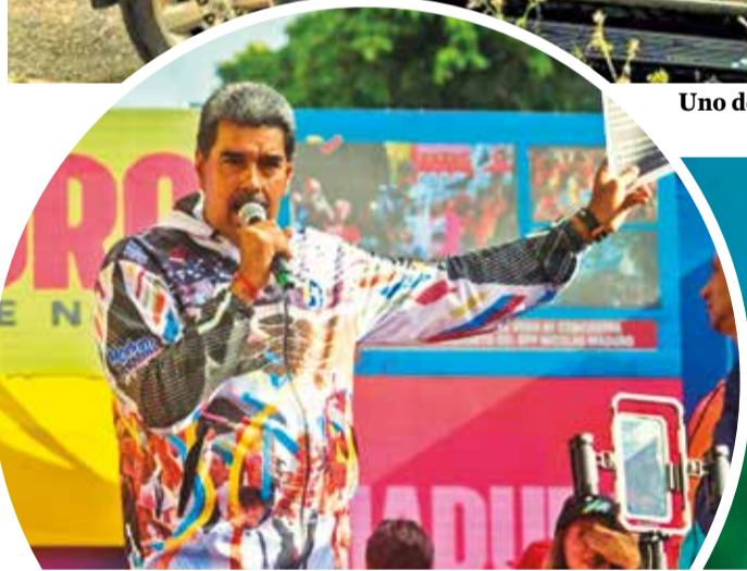
El presidente de Venezuela y candidato a la reelección, Nicolás Maduro.