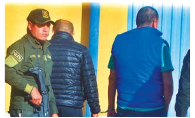
Los imputados en el IDIF, ayer. DANIEL JAMES

años, fue acribillado en el interior de su auto. Al menos 18 casos de secuestros y acribillamientos se registraron en la zona del Trópico, entre septiembre de 2023 y marzo de 2024.