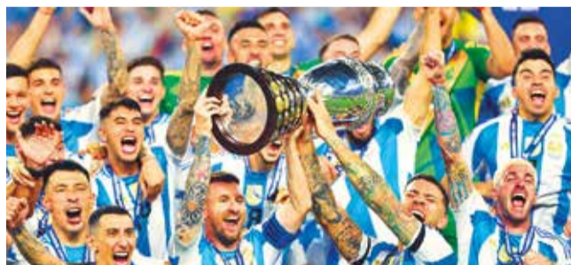
La selección de Argentina, campeona de la Copa América 2024.

Caída. De pobre campaña en la Copa América y recientes amistosos, la Verde sigue bajando en la clasificación mundial