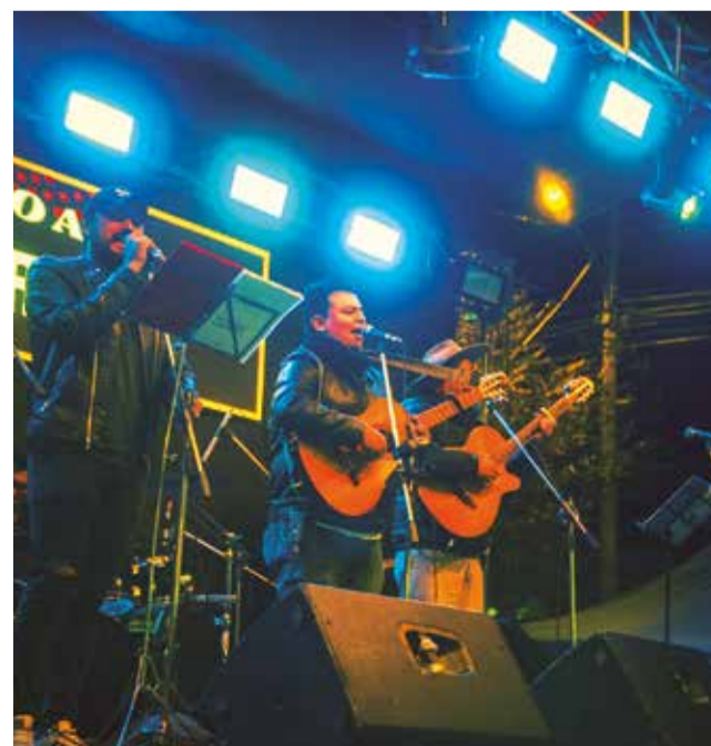
Músicos que participan del homenaje durante una presentación.

en la Circunvalación y Colquiri (dos cuadros arriba). Las puertas se abrirán a las 19:00 y habrá tres categorías de entrada: VIP a 100 bolivianos, golden a 70 y general a 50, garantizando la accesibilidad para todos los seguidores del género.