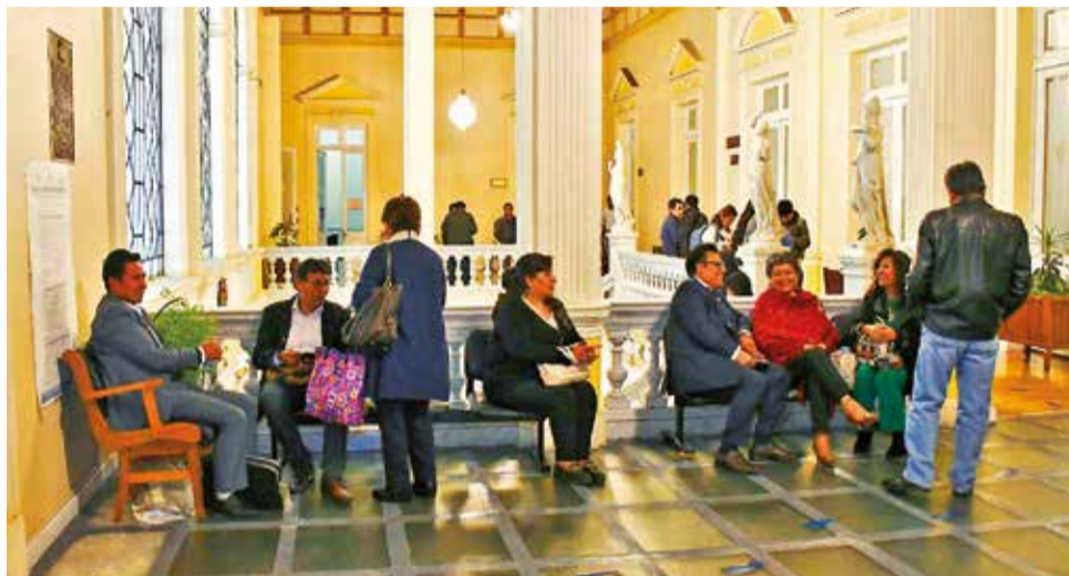
Postulantes a los altos cargos del Órgano Judicial en el Legislativo, la semana pasada.

Insistió que no pueden realizarse procesos simultáneos, refiriéndose a las elecciones primarias, cuya suspensión debe tratarse en el Legislativo hasta fines de este mes.