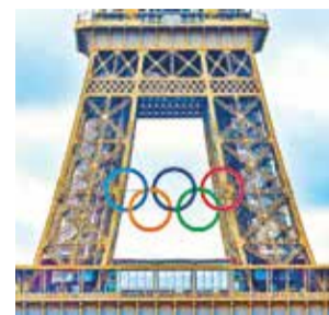
La torre Eiffel con los anillos olímpicos.

La organización ha utilizado ya la ceremonia inaugural del 26 para hacer un evento de excepción: un desfile de cerca de 200 barcos