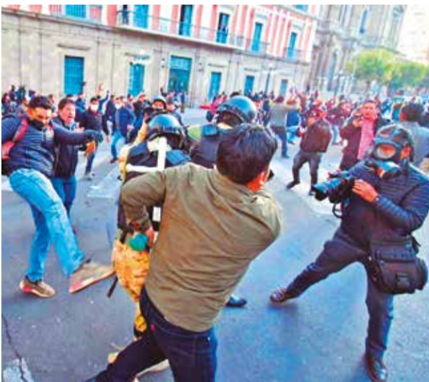
Periodistas cubren los hechos del 26 de junio.

Según la ANPB y la APLP, "convocar a los periodistas que estuvieron en la plaza Murillo la fecha señalada podría convertirlos en testigos obligados para respaldar, directa o indirectamente, la narrativa del Gobierno respecto a la acción militar de ese día. Posteriormente, implicaría la