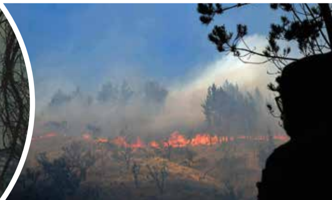
La humareda cubrió parte de la ciudad durante la tarde.