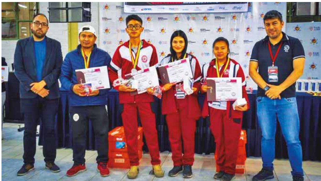
El equipo Safabot, segundo lugar en la categoría Tecnólogos Disruptivos. AGETIC BOLIVIA.

En Cochabamba participaron 200 jóvenes en las categorías de Tecnólogos Disruptivos e Inventores Disruptivos. Los ganadores en la primera categoría fueron: S. Rodribot en primer lugar, que tuvo como tutor a Mauricio Ordo-