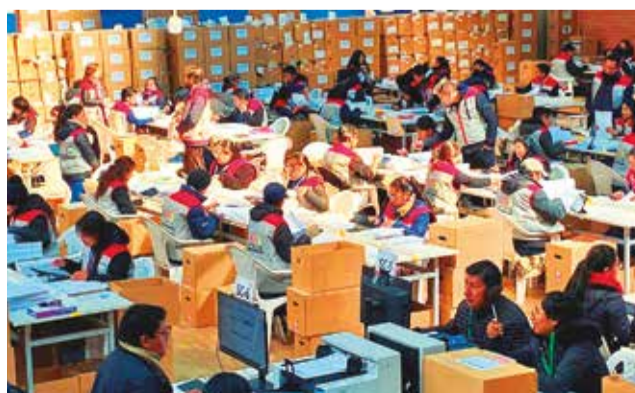
Funcionarios del INE procesan las boletas censales.

Tras concluir el Censo de Población y Vivienda el 25 de marzo en las áreas urbana, rural y dispersa, se procedió al retorno de las 95.000 cajas censales a la oficina nacional del INE, en La Paz, efectuando un seguimiento a través de un sistema informático, con código QR en cada una.