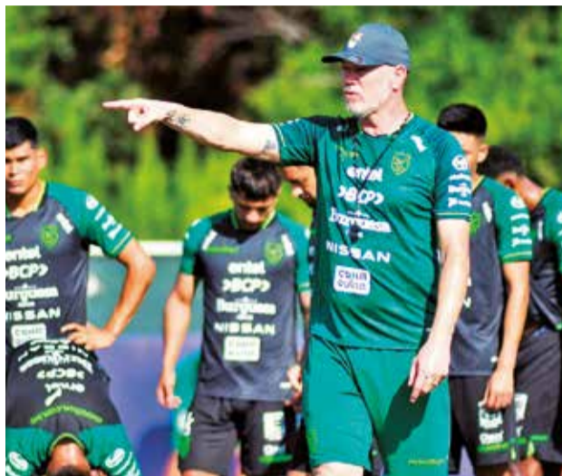
El extécnico de la Verde Antonio Carlos Zago.