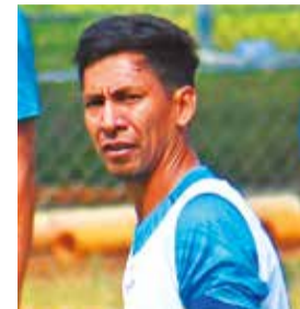
El futbolista nacional Jair Torrico. CARLOS LÓPEZ