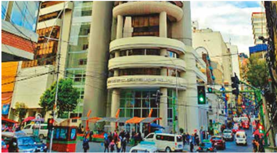
Oficinas del Ministerio de Economía, donde se realizan reuniones con rectores.

A principios de este mes, el sistema universitario expresó su preocupación por la caída de los ingresos de la renta petrolera, sentimiento al que