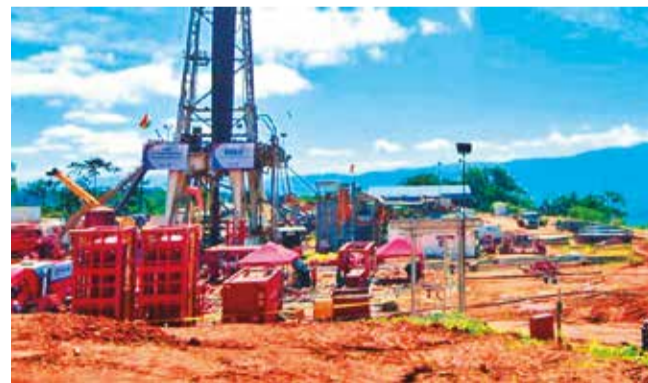
Infraestructura de perforación en el pozo Mayaya.

Costos. La estatal indicó que los recursos son propios y es posible que después se requieran mayores inversiones.