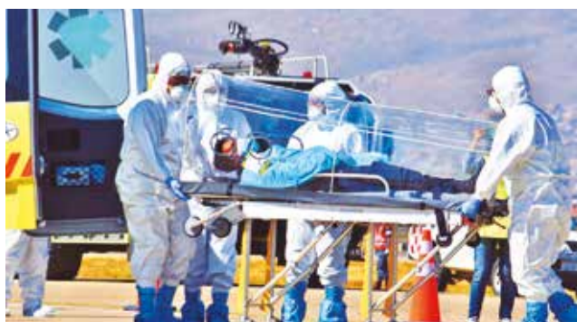
El simulacro de emergencia sanitaria, ayer. JOSE ROCHA

“Con este tipo de actividades, evaluamos la respuesta inmediata in situ de todo el personal que opera en los aeropuertos y determinamos