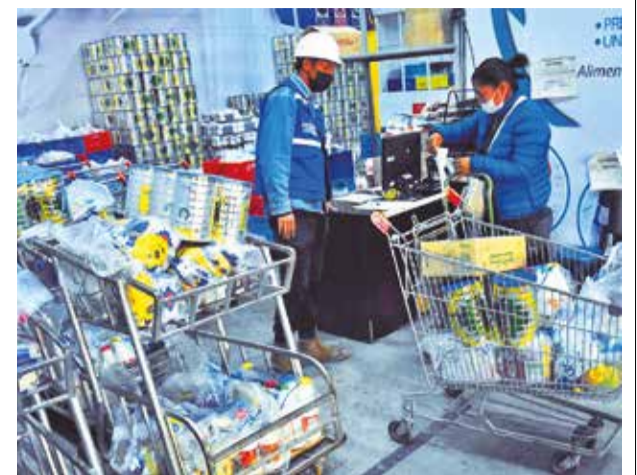
Entrega del subsidio de lactancia a una beneficiaria. D.J.

Además, las importaciones también han mostrado variaciones, pero la tendencia hacia una balanza comercial más equilibrada es una señal positiva para la economía regional”.