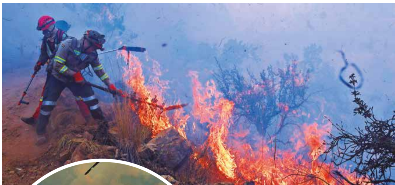
Grupos de primera respuesta combatieron el incendio, ayer.

Parque. El incendio de magnitud ocurrido ayer provocó humareda en la ciudad, principalmente en la zona norte. La Gobernación cuantifica los daños y el área afectada