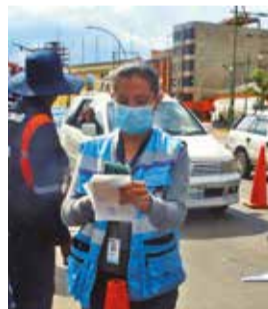
Un operativo de control de Recaudaciones. J.R.