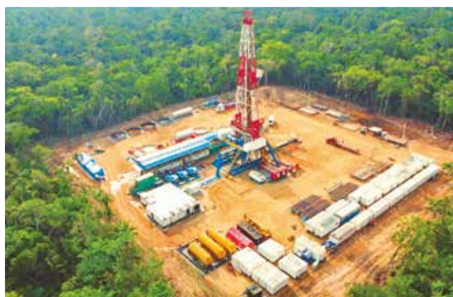
El pozo Yope-X1 en la región de Yapaquí, Santa Cruz.

“La idea es ir revirtiendo esta caída de producción que se está dando a lo largo de este tiempo, y la única manera de