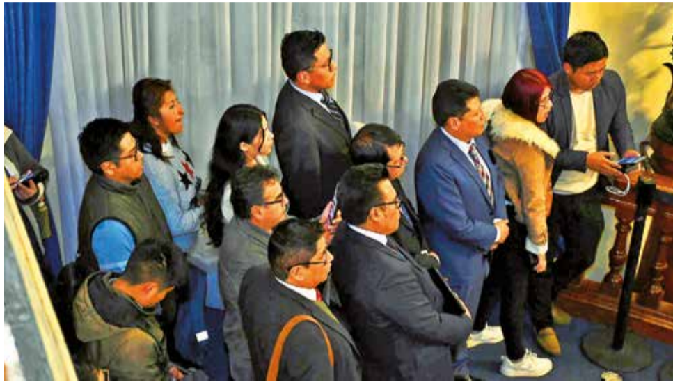
Postulantes a magistrados del Órgano Judicial, la anterior semana en el Legislativo.