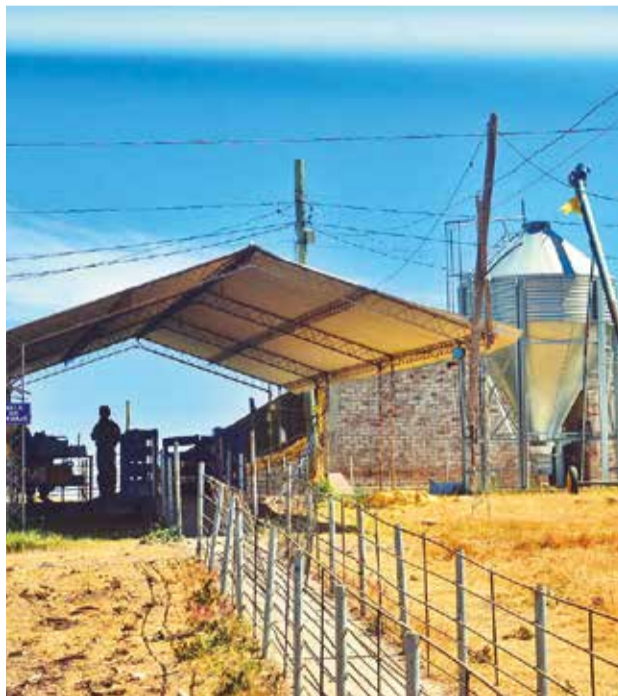
La granja de cerdos atacada en el municipio de Toco. D.J.

El conflicto por la granja tiende a agudizarse, ya que la unidad productiva es una de