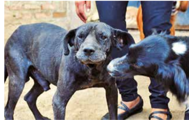
Algunos de los canes que viven en refugios. CARLOS LÓPEZ

Asimismo, anunció operativos semanales para secuestrar vehículos con deudas pendientes y embargos de bienes.