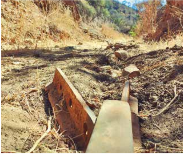
Restos de rieles tras el robo en Arbieta. DANIEL JAMES

“Actualmente, estamos realizando operativos, tanto en redes sociales como de manera física, esto en los departamentos de Cochabamba, Oruro, Sucre y Potosí. El objetivo es identificar a los comercializadores y a las fundidoras de rieles (...). En Bolivia, el mercado de rieles no está autorizado, sólo los operadores ferroviarios pueden utilizarlos y la provisión es a