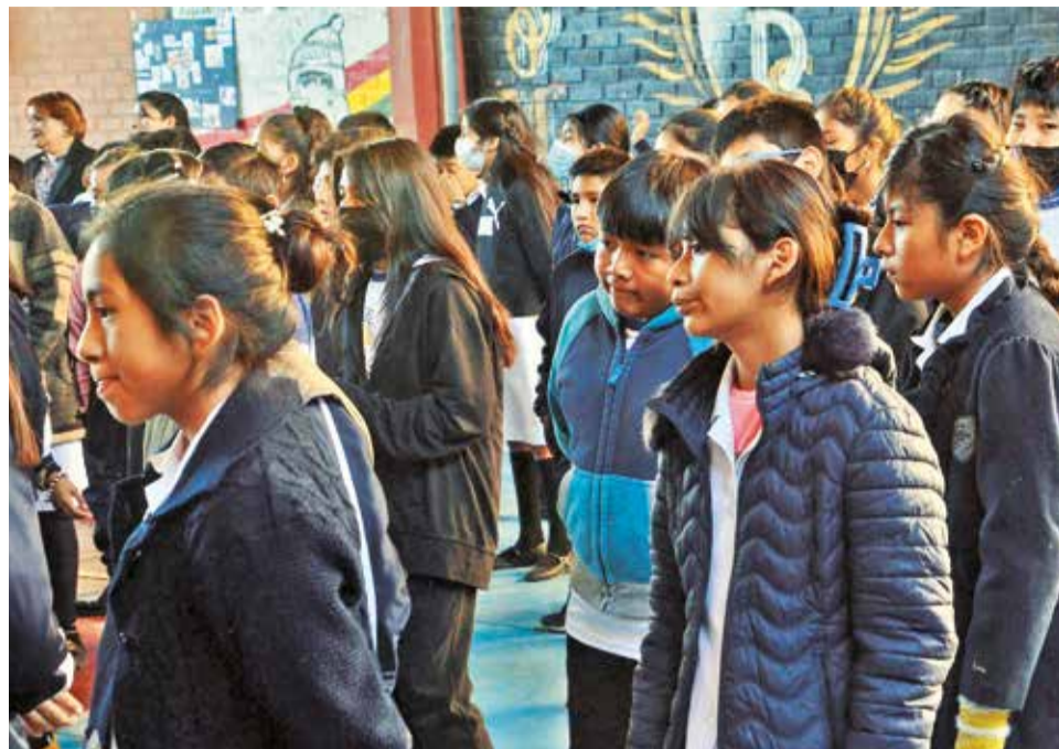
Escolares abrigados, antes del descanso pedagógico en Cochabamba.

El descanso pedagógico comenzó el 1 de julio y los estudiantes debían volver a las aulas el 15 de julio. Sin embargo, los ministerios de Educación y Salud decidieron ampliar, ahora, por semanas, el receso. Las clases se reanudarán el próximo 29 de julio en todo el país.