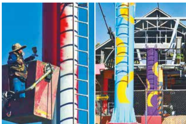
Los trabajos en las torres del teleférico, ayer.

Durante los últimos días, se completó el cambio de rodamientos, quedando pendientes algunos trabajos eléctricos y los repuestos provenientes