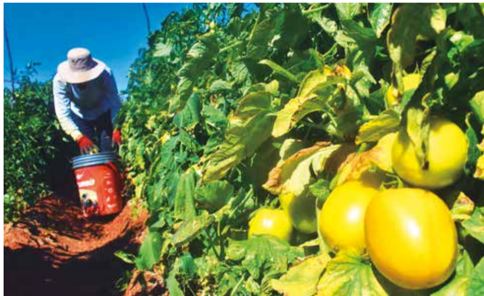
Cultivo de tomates en el municipio de Omereque, en junio.

Ambas fuentes coincidieron en estimar que el precio, sobre