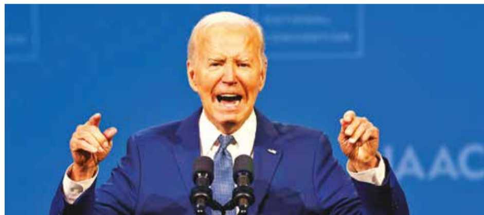
El presidente de Estados Unidos, Joe Biden.

Una nueva encuesta de ORC Consultores con vistas a las elecciones presidenciales del próximo 28 de julio en Venezuela arrojó que el candidato opositor Edmundo González Urrutia tiene una intención de voto del 59,6% frente a un 12,5% de Nicolás Maduro. Se trata de una diferencia de 47,1 puntos porcentuales entre ambos aspirantes.