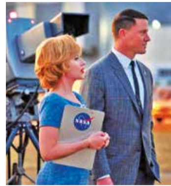
Fotogramas de las cintas que se estrenan en los cines.