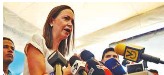
La líder opositora de Venezuela, Corina Machado.

Venezuela. La líder opositora emitió una alerta mundial por la escalada represiva del régimen del actual presidente de ese país