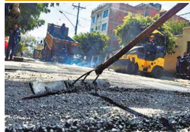
Los trabajos de reposición de asfalto en la Belzu. c.l.

ne de Cerdo, que aglutina a 2 mil afiliados, se declaró en emergencia y anunció una movilización para respaldar a los dueños.