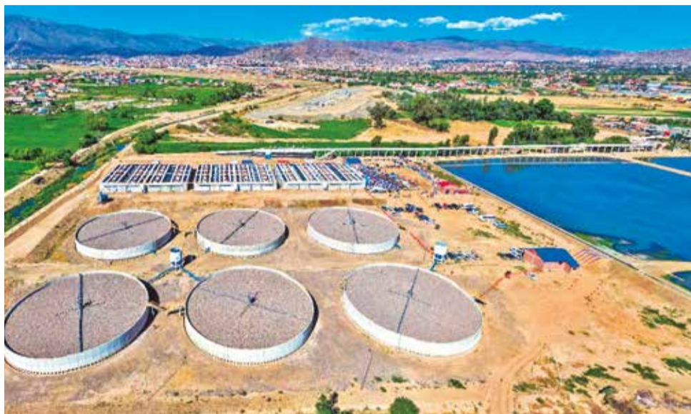
La nueva planta de tratamiento de aguas servidas de Albarrancho.