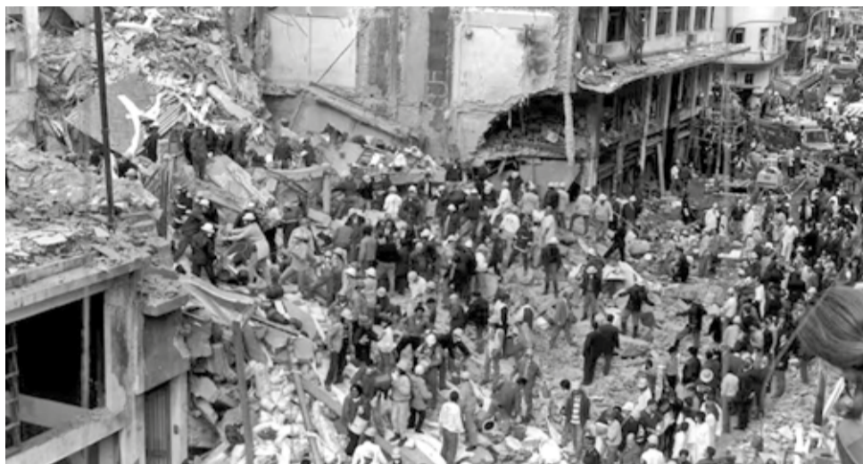
Una imagen tras el atentado a la AMIA de 1994.

El texto hace referencia al ataque terrorista que dejó 85 muertos y más de 300 heridos –y por el que Interpol lanzó alertas rojas para un ciudadano libanés y cinco iraníes–,