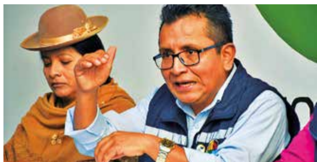
El defensor del Pueblo, Pedro Callizaya.

Defensa. El titular de la Defensoría se comprometió a proteger los derechos humanos y luchar contra la impunidad