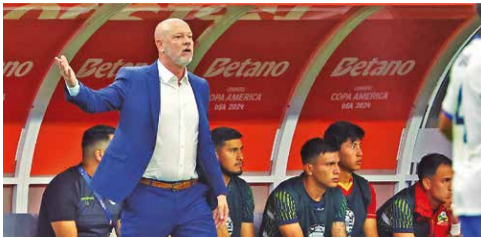
El director técnico de la selección nacional, Antonio Carlos Zago.