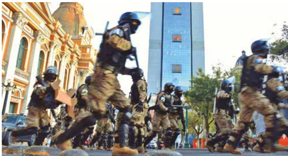
Tanquetas y militares durante la toma de la plaza Murillo, el pasado 26 de junio.