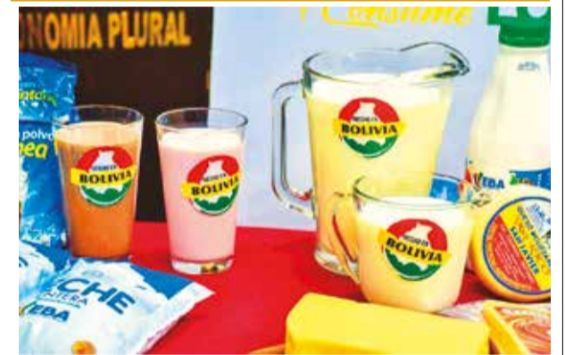
Productos lácteos elaborados en Bolivia. ABI

En los últimos meses, aumentaron los precios de distintos productos, principalmente de los importados o que dependen de insumos traídos del exterior. Este incremento se daría especialmente por la escasez de dólares, lo que elevó el precio del dólar por encima de los 10 bolivianos en el mercado paralelo, mientras que el tipo de cambio oficial se mantiene en 6,96 bolivianos.