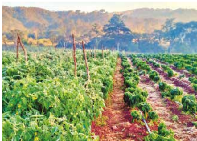
Una zona del país afectada por la helada.

La helada blanca se produce con frío y humedad y forma una capa blanca de hielo denominada escarcha. No es tan agresiva con el cultivo, “genera pérdidas”, pero “no es que dañe y quema to-